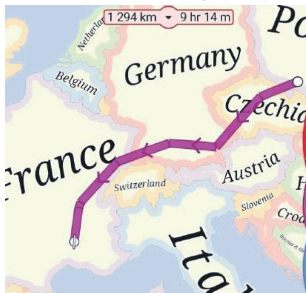
W tamtą stronę z Krzywiny paralotniarze lecą przez Czechy, Niemcy i Francję