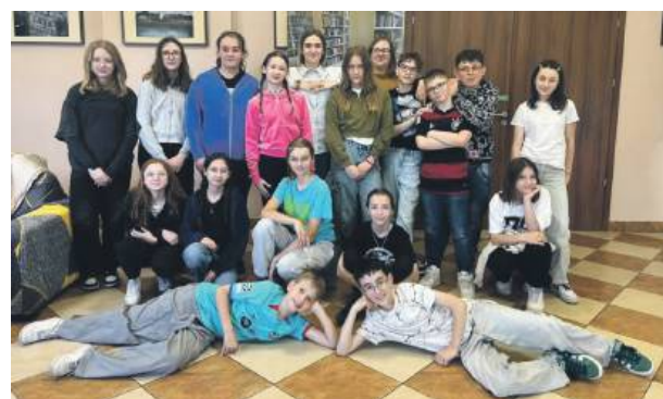
Młodzież uśmiechnięta po warsztatach fotograficznych w bibliotece w Borku Strzelińskim