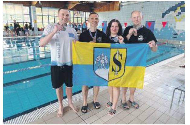
Doświadczeni pływacy ze Strzelina