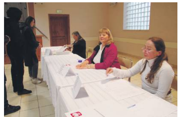
Nad sprawnym przebiegiem głosowania czuwały komisje