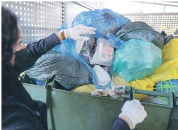
W kwietniu strzelińscy urzędnicy skontrolowali, w jaki sposób mieszkańcy segregują śmieci.

– Gminy nie mogą wprowadzać, nawet na wniosek wszystkich mieszkańców wspólnoty czy spółdzielni, zwolnienia z selektywnej segregacji odpadów komunalnych – kontynuuje burmistrz Dorota Pawnuć. – To obowiązek, do którego muszą się stosować wszyscy na terenie Polski. Z drugiej strony operator nie ma możliwości odbioru odpadów zgromadzonych chaotycznie jako posegregowanych, bo natrafi na sankcję od prowadzącego instalację gospodarowania odpadami