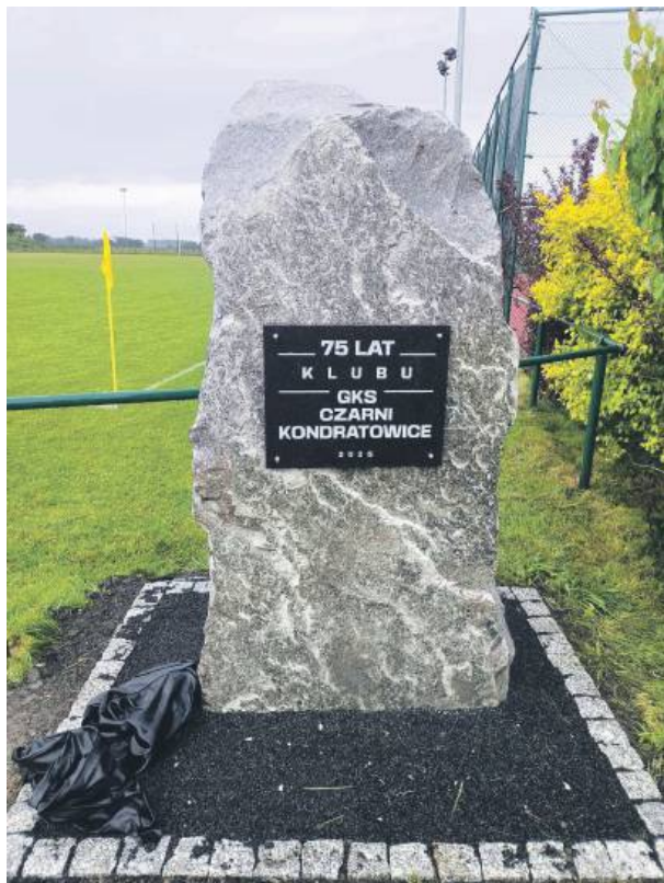
W niedzielę na stadionie w Kondratowicach odsłonięto pomnik z okazji 75-lecia klubu

pa z Kondratowic zajmuje przedostatnie miejsce w tabeli i musi walczyć o utrzymanie w klasie A. LKS Brożec stoczył wyrównany bój z Rapidem Domaniów. Raz zawodnik rywali przypadkowo umieścił piłkę we własnej bramce. W ostatniej akcji meczu bramkę na wagę punktu zdobył Ma-