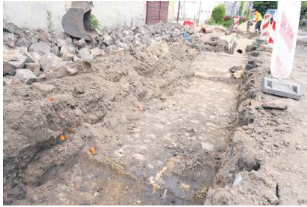
Obok bramy odkopano kamienny bruk, prowadzący do wiązowskiego rynku