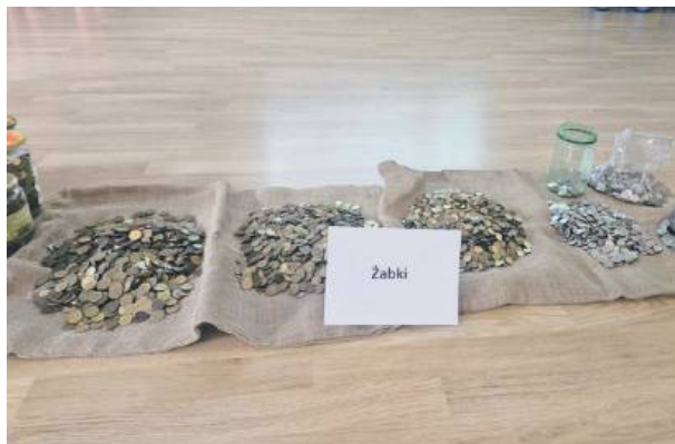
W zbieranie groszków zaangażowały się wszystkie przedszkolne grupy