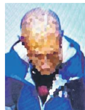
Zatrzymany 40-latek jest bohaterem nie tylko jednego zapisu sklepowych kamer. Monitoring zarejestrował również inne kradzieże na terenie sąsiedniego dyskontu