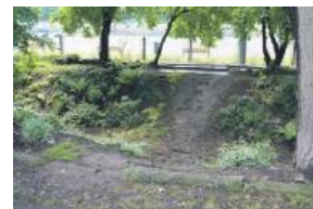
Wydeptany skrót zamierzają zmienić na kładkę

Gmina przy ulicy posiada teren, który w tym momencie jest zagospodarowany jako działki, ogródki i garaże. Część z nich jest nieużytkowana i w kolejnych latach planuje się to przeznaczyć na lepsze zagospodarowanie. Mieszkańcy ulicy zgłaszali również potrzebę stworzenia kładki nad Młynówką, która będzie służyła użytkownikom skateparku do swobodnego przemieszczania się, ponieważ teraz wydeptany został