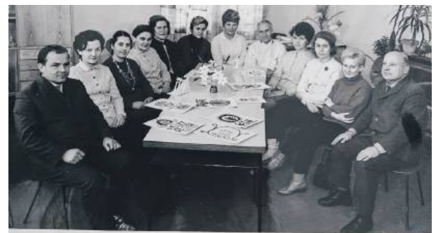
GRONO PEDAGOGICZNE SZKOŁA PODSTAWOWA nr 1 w STRZELINIE – LUTY 1971

Historia szkoły nr 1 w Strzelinie to nie tylko lata powojenne, ale też dużo późniejsze. Tych nauczycieli pewnie rozpoznacie bez problemu – grono pedagogiczne z 1971 r.