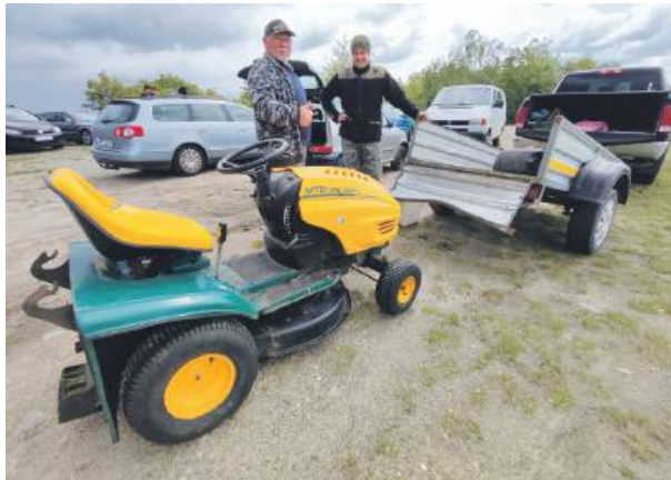
Do prac wędkarze wykorzystywali swój własny sprzęt