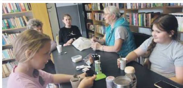
„Filiżanką słów”, czyli międzypokoleniowymi rozmowami, cieszyli się czytelnicy biblioteki w Ludowie Śląskim.