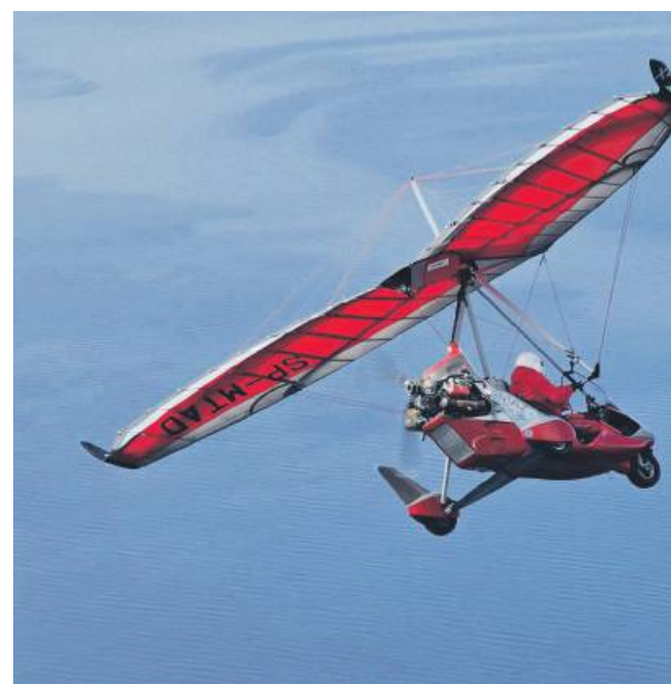
Tadeusz Leszczyński nad Bałtykiem, podczas ubiegłorocznej wyprawy na koło podbiegunowe