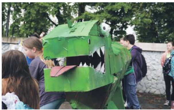
Eko Stwory opanowały strzeleński park

Na obszerniejszą relację z wydarzenia zapraszamy do kolejnego wydania Słowa Regionu. Zdjęcia z wydarzenia można znaleźć na naszym profilu Facebookowym.