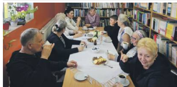
Klub biblioteczny w Zielenicach świętował Tydzień Bibliotek dobrymi rozmowami.