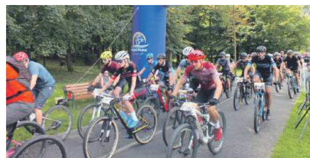
Przed rokiem do rywalizacji przystąpiło ponad trzysta osób