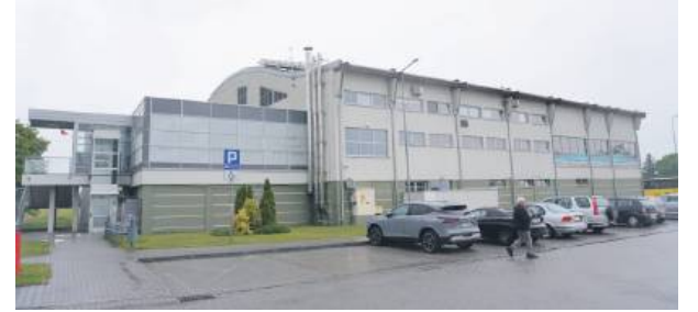
W aquaparku zostanie odnowiona sauna, schody ewakuacyjne oraz elementy uzdatniające wodę

Gmina pozyskała dofinansowanie z Urzędu Marszałkowskiego w wysokości 150 tys. złotych na to zadanie. Do