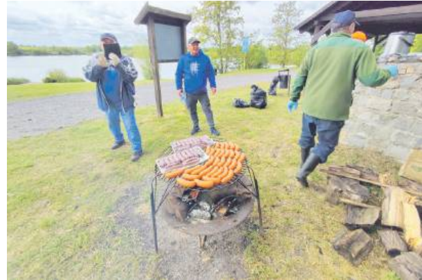
Po pracy był czas na kielbaski z grilla