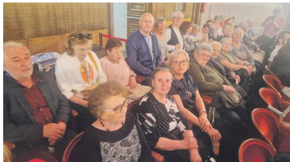
Koncert muzyki filmowej w sali Radia Wrocław przy blasku świec dostarczył niezapomnianych wrażeń.