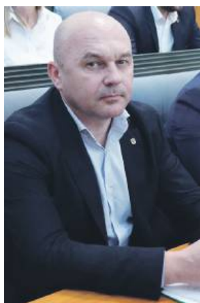
W debacie weźmie udział m.in. wicemarszałek województwa dolnośląskiego Wojciech Bochnak

W dniu 28 maja o godz. 10:00, w auli Liceum Ogólnokształcącego w Strzelinie fundacja zorganizuje również konferencję i seminarium pt. „Dziedzictwo kulturowe Ziemi Strzeleńskiej – utrapieniem czy szansą rozwojową regionu?” W debacie wezmą udział m.in. wicemarszałek województwa dolnośląskiego Wojciech Bochnak