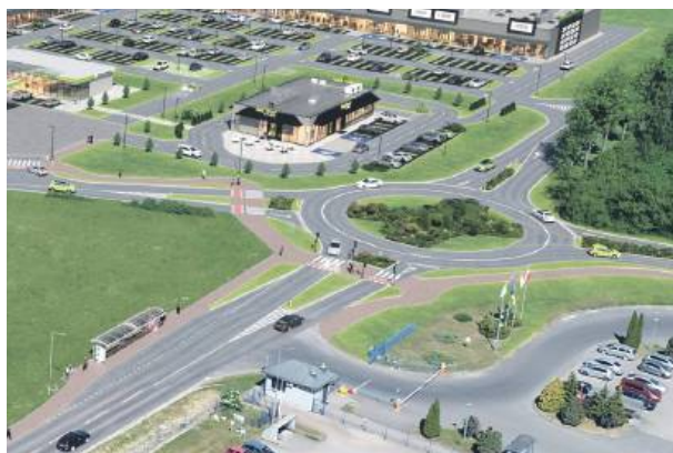
Tak może wyglądać zaprojektowane rondo, w którego budowę angażują się, oprócz inwestora, również gmina Strzelin i Samorząd Województwa Dolnośląskiego

nia przy udziale firmy PROPERTY BOX. Dotyczyć będzie zaprojektowania i budowy ronda na skrzyżowaniu projektowanej drogi gminnej z drogą wojewódzką nr 395 (Strzelin - Wrocław)