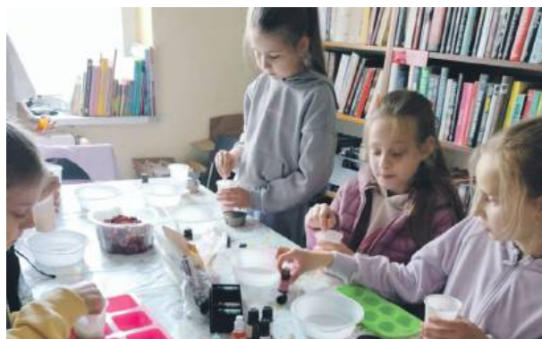
Mydlane Laboratorium zachwyliło dzieci, które przyszły do biblioteki w Borowie.