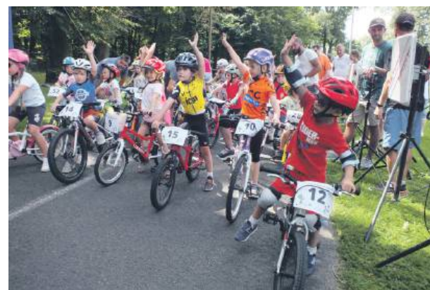
Ponownie odbędzie się wyścig dziecięcy