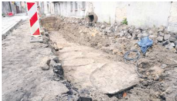
Podczas prac remontowych na ul. Strzelińskiej natrafiono na granitowe płyty zniszczonej Bramy Nyskiej