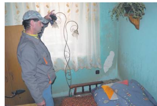
Grzyb w mieszkaniu powstaje od strony ulicy