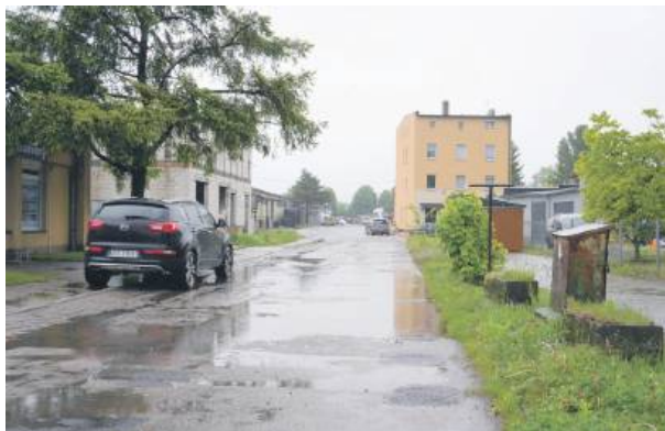
Gmina planuje wpiąć ul. Targową do kolektora deszczowego