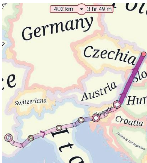
Powrót do Polski będzie prowadził z Francji przez Włochy, dalej przez Słowenię, Węgry, Słowację i Czechy