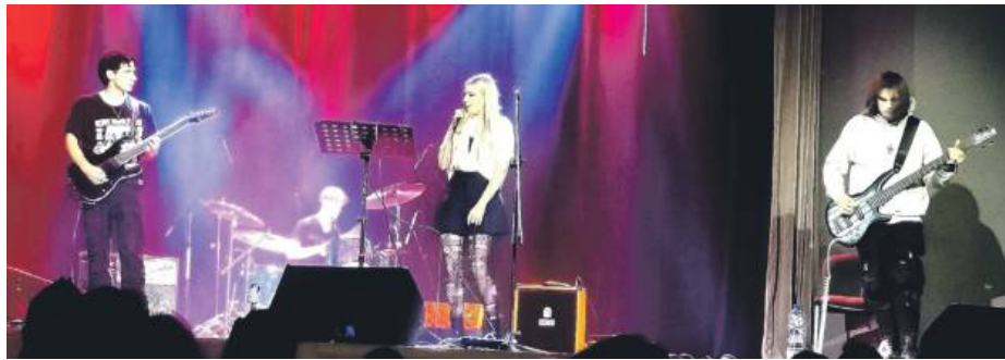
Grand Blue, jeszcze w starym składzie, kilka razy zagrał na deskach SOK-u

Koncert 29 maja będzie nie tylko okazją do posłuchania autorskiego materiału, ale też wsparcia zespołu. Wstęp jest darmowy, ale podczas wydarzenia będzie można wrzucić do puszek datki na dokończenie produkcji płyty. – Będą też świeżo wydrukowane