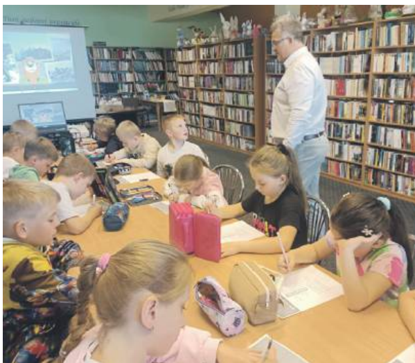
Na zakończenie spotkania uczniowie rozwiązywali tematyczną krzyżówkę, która pomogła im utrwalić zdobyte informacje w atrakcyjnej formie