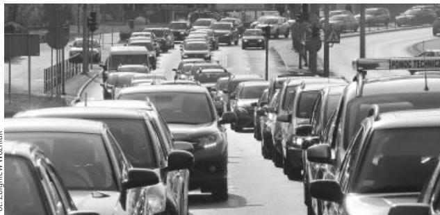
Dzień bez Samochodu, choć symboliczny, pozwala poczuć, jak wygląda codzienność bez auta i jakie daje to korzyści. Problem widać na zdjęciu