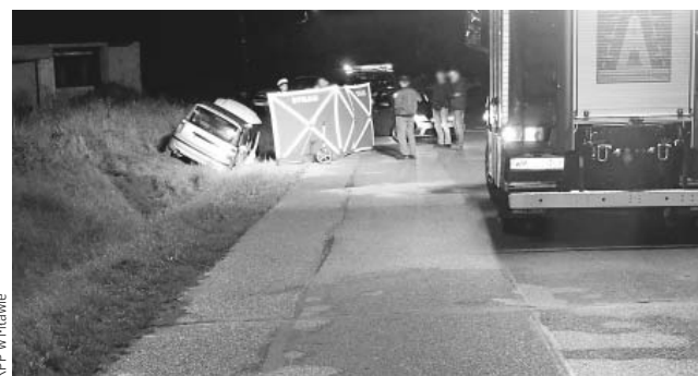
KPP w Mławie

Jak wynika ze wstępnych ustaleń policjantów, pracujących na miejscu wypadku, kierujący fiatem, 72-letni mławianin, jadąc w kierunku Mławy, zjechał na przeciwny pas ruchu i wjechał do przydrożnego rowu. Mężczyzna jechał sam, prawdopodobnie nie miał zapiętych pasów bezpieczeństwa. Uderzył głową w szybę