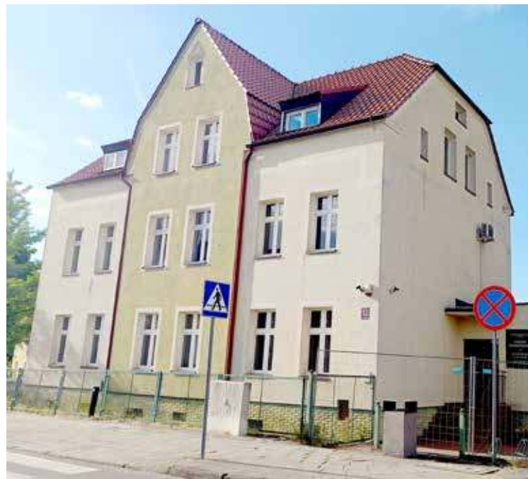
DD Budynek przy ul. Konopnickiej

osób niepełnosprawnych. Polegać one będą na zmianie aranżacji pomieszczeń. W tym celu część ścian zostanie usunięta, lub też wstawione zostaną nowe. Zmieniona zostanie również lokalizacja niektórych drzwi. Zostaną wykonane dodatkowe pomieszczenie toalet dla osób niepełnosprawnych na parterze i poddaszu. W nowej części, która zostanie dobudowana, zostanie zainstalowana winda z dostępem z zewnątrz. Wykonawcą jest Sigma – Firma Ogólnobudowlana Piotr Latuszek ze Szczecina. W trakcie postępowania przetargowego złożyła ona ofertę na kwotę 1 187 130,95 zł. Była to jedyna oferta w tym przetargu.