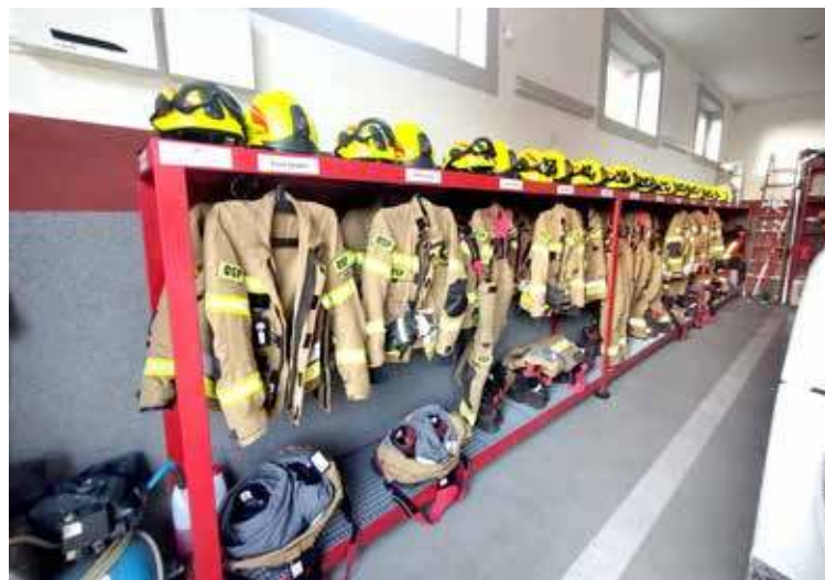
Sprzęt strażaków prezentuje się coraz lepiej