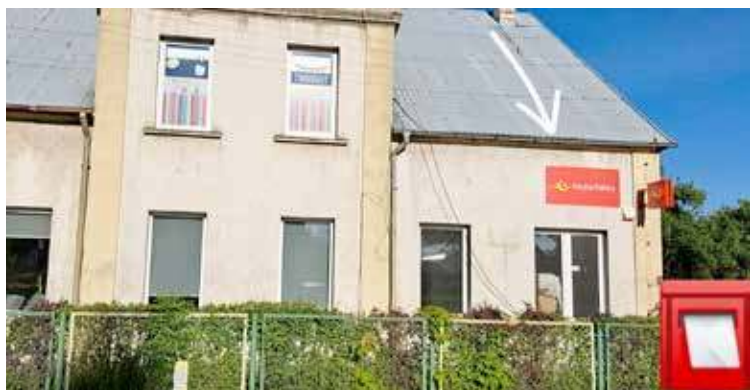
Poczta powstaje w budynku przy ulicy Szczecińskiej