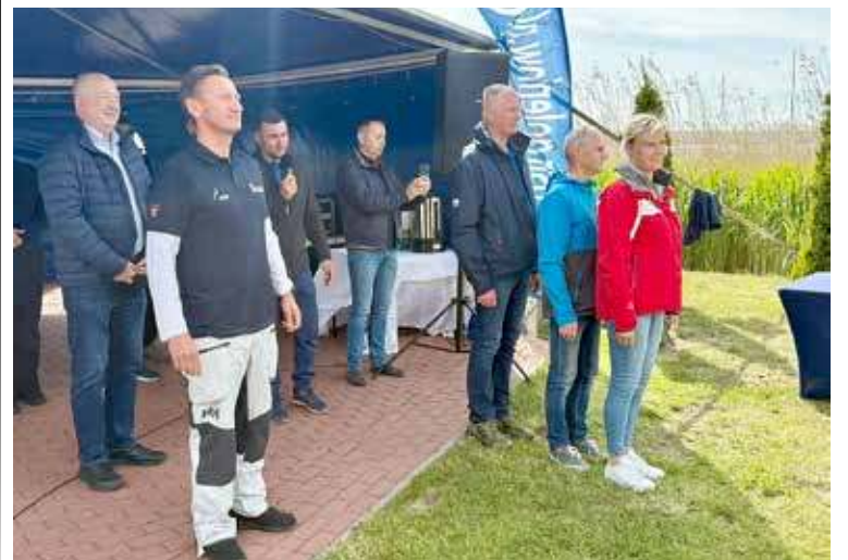
W wydarzeniu uczestniczyli przedstawiciele samorządów oraz różnych instytucji