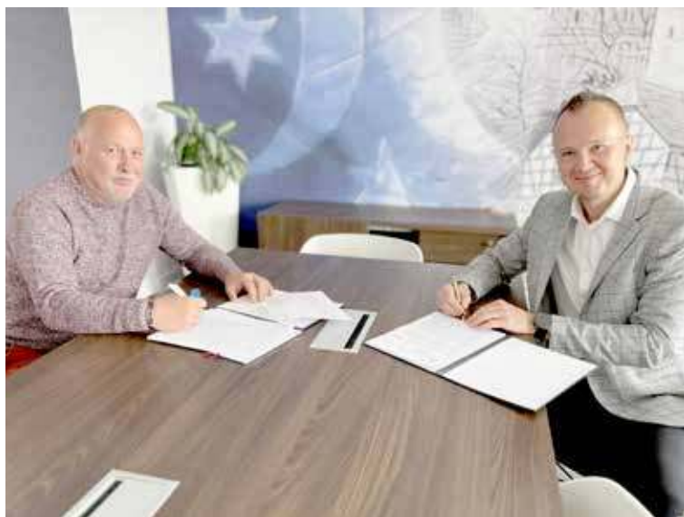
Umowa została podpisana