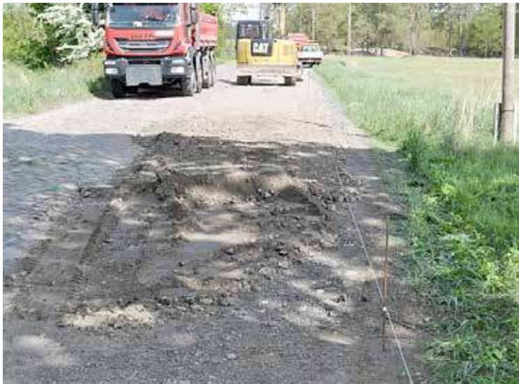
Remontowana jest droga do Budzenia