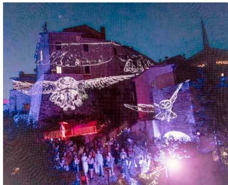
Miasto zostanie rozświetlone