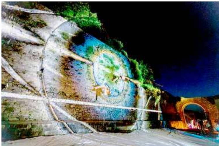
Festiwal Hanzeatycki otworzy niezwykle wydarzenie

Wydarzenie jest realizowane w ramach nowego projektu ID:Pomerania, który Stowarzyszenie Teatr Brama realizuje z Gminą Goleniów oraz Domem