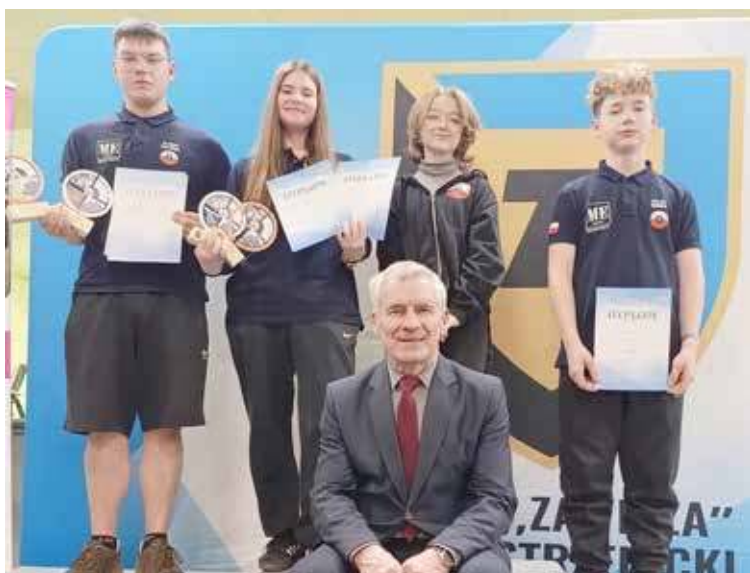
Drużyna TARCZY Goleniów na Pucharze Bydgoszczy

- w konkurencji 25 m pistolet sportowy 30+ 30 strzałów zajął II miejsce,