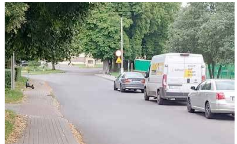
Ustawione wzdłuż krawężnika, a przed samym zjazdem do ZK, nie sprawa, że w tym miejscu jest bezpiecznie

Sprawa była zgłaszana już w poprzednich latach. Jednak do