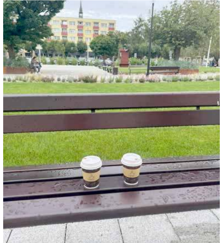
Czekał z kawą, tylko na kogo i stracił czas... ?

Ale cała ta gra w „pokrzywdzonego” ma jednak swój cel - uderzyć i skompromitować insynuacjami przeciwników, czyli w obecnym czasie głównie organizatorów referendum odwoławczego i napuścić na nich grono naiwniaków i żałośnie niezorientowanych - stanowiących niestety zwykle większość w większości społeczeństw. Potwierdzają taki niewypowie-