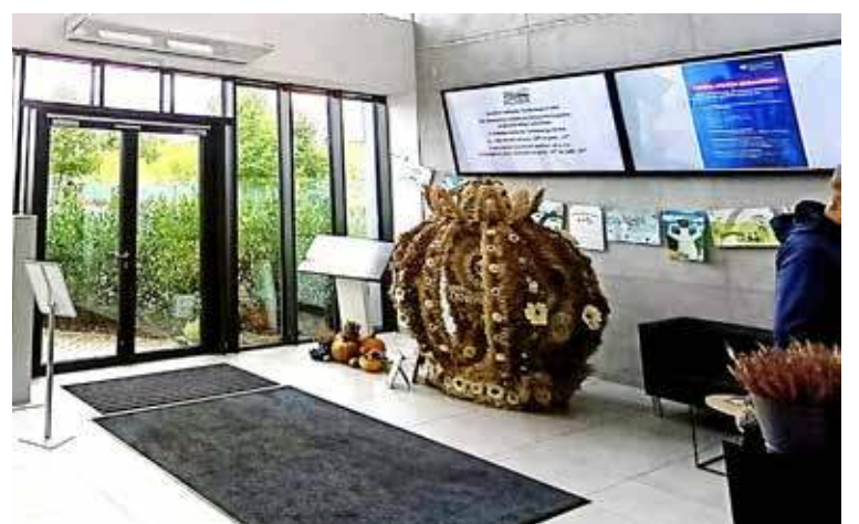
Wieniec stał się elementem wystawy szczecińskiego oddziału KOWR

Przez kilka tygodni będzie tam reprezentowany na specjalnej wystawie, promującą sztukę lokalnych twórców oraz tradycję gminy Osina. Dzięki temu sukcesowi sołectwo Węgorza i cała gmina Osina zyskują dodatkową okazję do promocji lokalnej społeczności. red.