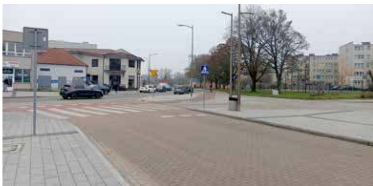
Betonu jest u nas wiele

Masz problem? Byłeś świadkiem ciekawego wydarzenia?