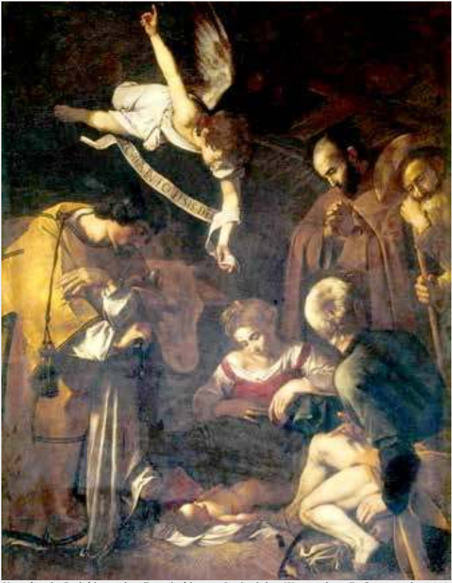
Narodzenie Pańskie ze św. Franciszkiem z Asyżu i św. Wawrzyńcem - Caravaggio 1610. Obraz skradziony w 1969 roku (i nie odnaleziony) z oratorium San Lorenzo w Palermo na Sycylii