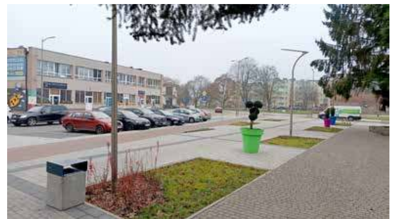
Nasadzenia są, ale dość mizerne

Taki cel jest naprawdę słuszny. Jednak, jak zauważyli co niektórzy z mieszkańców... nie widać prób jego realizacji. Komentujący dość zdroworozsądkowo wskazali na coś wręcz przeciwnego – rosnącą „betonożę”. Dość obrazowo to widać w jednej z naj-