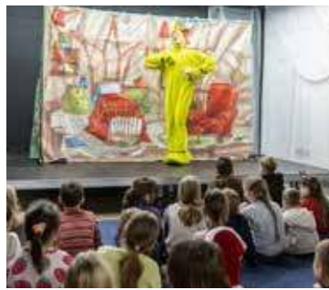
Spektakl dla dzieci

stawów i kręgosłupa oraz jakie naturalne metody mogą wspierać układ ruchu. Uczestnicy wysłuchali prelekcji i otrzymali wiele praktycznych wskazówek dotyczących troski o własne zdrowie.