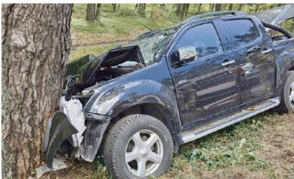
Uderzenie było silne...

7 czerwca przed godz. 11 na DK 50 w miejscowości Zieleniec miał miejsce wypadek drogowy. Samochód osobowy wypadł z drogi i uderzył w drzewo. W wyniku tego zdarzenia obrażeń doznała jedna osoba, którą karetką przewieziono do szpitala.