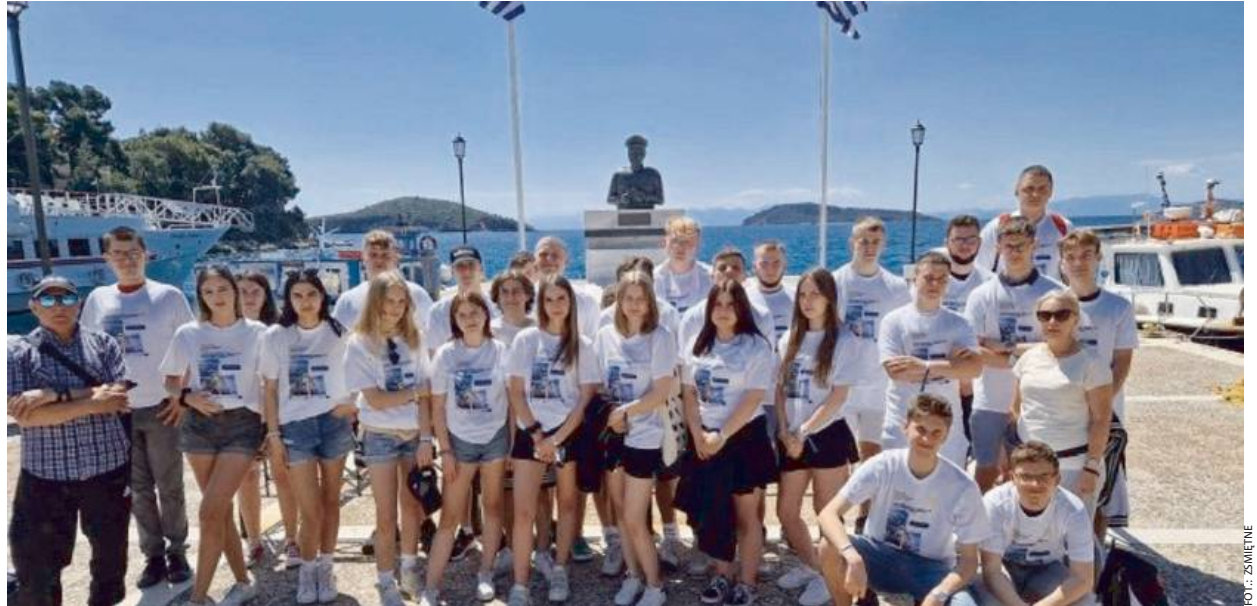
To jest właśnie edukacja na najwyższym poziomie doświadczania

Ogromną zaletą wyjazdów międzynarodowych jest możliwość pracy i poznania uczniów z innych europejskich szkół. Tym bardziej, że zwykle współpraca przebiega w bardzo przyjaznej atmosferze. Kolejną jest udział w urozmaiconych zajęciach. Są wśród nich zarówno zajęcia stacjonarne, warsztaty terenowe, gry miejskie, wykłady z ekspertami, wizyty w europejskich przedsiębiorstwach i instytucjach, jak i warsztaty cyfrowe czy językowe.