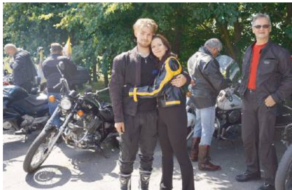
Kolejny rajd przechodzi do historii.