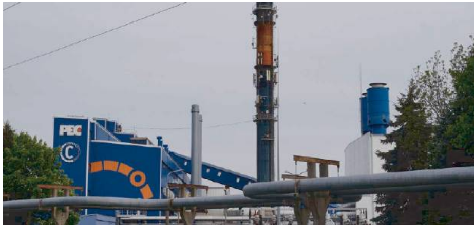
Czy pomysł budowy spalarni „spali na panewce”?

W decyzji odmownej określono szacowane koszty, które należy ponieść w celu przyłączenia, wynikające z budowy i modernizacji elementów sieci energetycznej w wysokości 7 mln 750 tys zł. Tak wysokie koszty opłaty przyłączeniowej nie były ujęte w kosztorysie inwestycji i nie będą pokrywane w ramach złożonych wniosków o dofinansowanie inwestycji. Przedsiębiorstwo Energetyczne w Siedlcach posiada odpowiednie środki na realizację inwestycji, jednakże pojawienie się tak wysokich dodatkowych kosztów