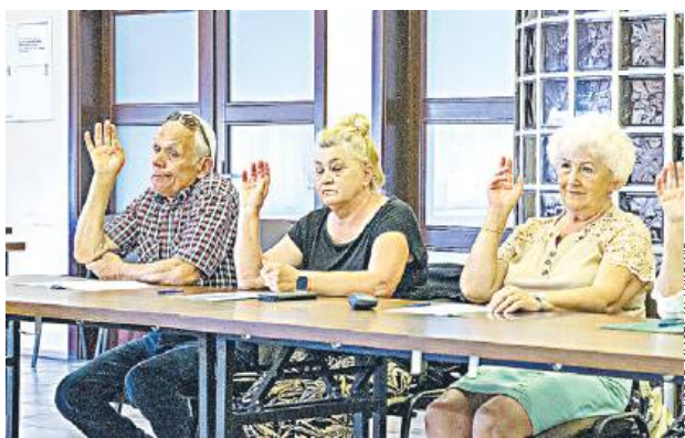
ESR ma być organem doradczym. Ma też aktywizować środowiska senioralne.