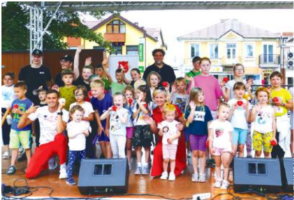
Najmłodszy mieszkańcy miasta z radością celebrowali swój dzień.

Dzień rozpoczął się od energicznego koncertu interaktywnego, który porwał zarówno młodszych, jak i starszych do tańca. Pan Sprężynka ze swoim zespołem Bąbel Ziombel zaprezentował spektakl pełen muzyki, tańca i zabawy. Po koncercie, uczestnicy mogli podziwiać po-