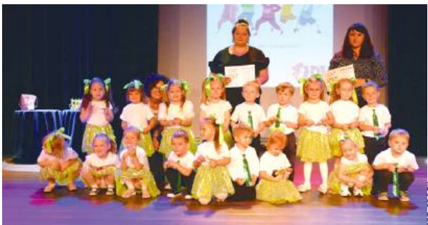
Młodzi artyści zauroczyli swoimi układami publiczność.

Młodzi tancerze, w liczbie przekraczającej trzysta, mieli