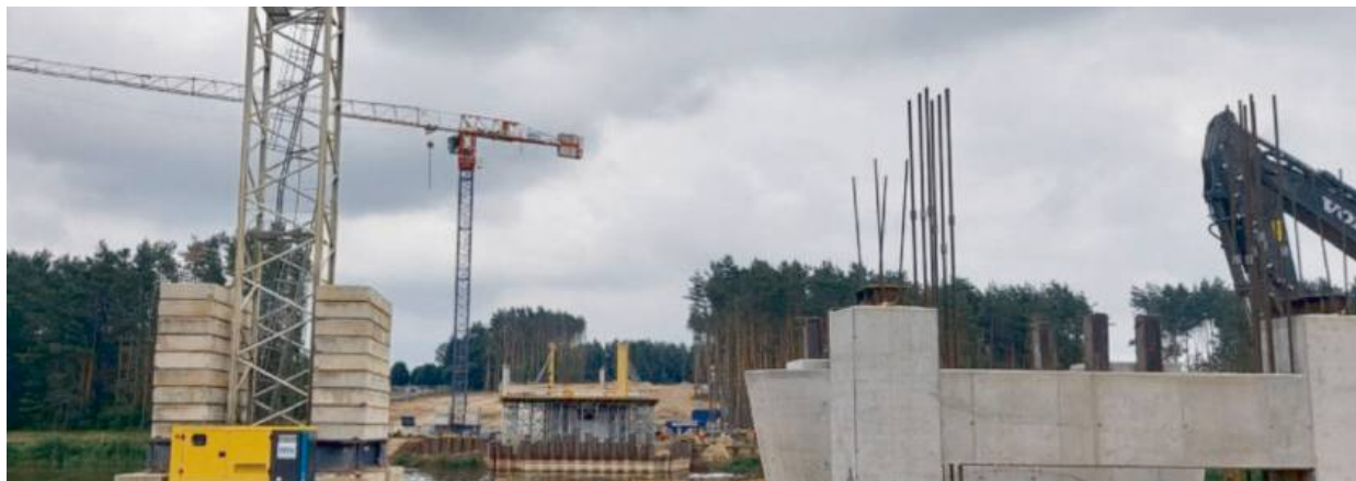
Widać postęp prac, ale jeszcze ogrom czasu przed nami

Budowa mostu jest inwestycją sześciu samorządów, tj.: województwa podlaskiego i mazowieckiego, powiatu siemiatyckiego i sokołowskiego, gmin Perlejewo i Jabłonna Lacka. Liderem projektu jest Powiat Siemiatycki. W związku z tym w spotkaniu wzięli udział staro-