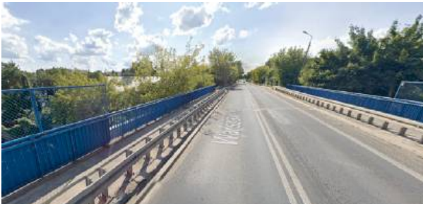
Obiekt jest już w bardzo złym stanie technicznym...

W pierwszym etapie prac wyłoniony wykonawca wykona dokumentację projektową i uzyska pozwolenie na budowę (będzie miał na to 12 mie-