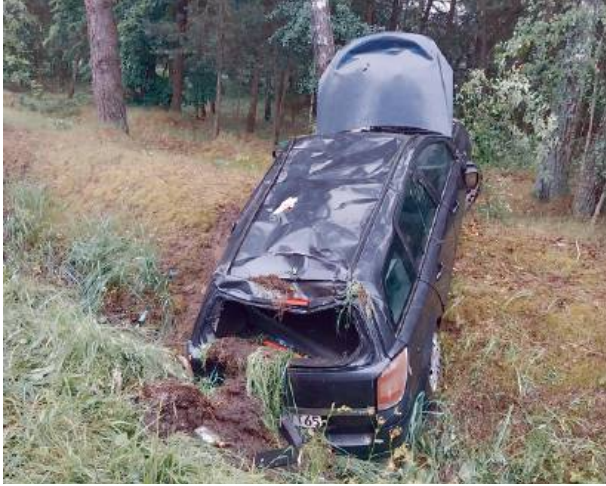
Strażacy z OSP Budziska (pierwsi na miejscu) zastali opla w przydrożnym rowie oraz grupę ludzi na poboczu.

6 czerwca doszło do wypadku drogowego w okolicach zakrętu między Budziskami a Gwizdatałami. - Po dojeździe na miejsce zdarzenia, strażacy z OSP Budziska zastali samochód osobowy marki Opel, który dachował i leży w przydrożnym rowie. Autem podróżowało pięć osób. Wszyscy wyszli na zewnątrz pojazdu, ale trzy osoby były ranne - poinformował Dariusz Maciąg z KP PSP w Węgrowie. Droga była przez pewien czas zablokowana, następnie ruch odbywał się wahadłowo. Na miejsce zdarzenia przybyły trzy zespoły ratownictwa medycznego. Poszkodowane w wypadku kobiety przetransportowano do szpitala.