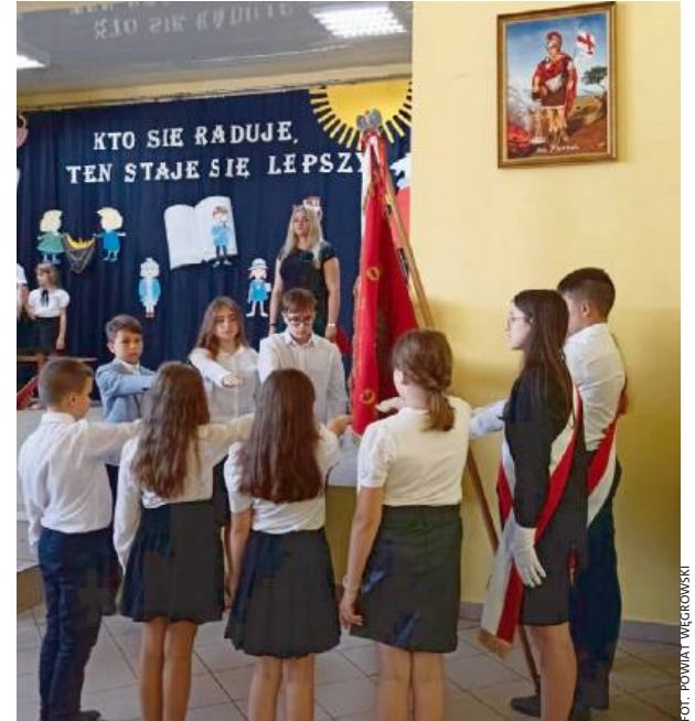
Ślubowanie złożyli przedstawiciele wszystkich klas.

W drugiej części uroczystości uczniowie Samorządowej Szkoły Podstawowej im. K. Maku-