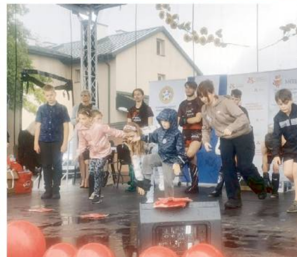
Nawet pogoda nie popsowała planów na ten dzień