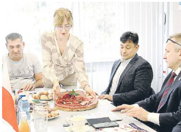
Spotkanie zostało zorganizowane po rozmowach, które odbywały się już wcześniej w ambasadzie Uzbekistanu.

- Podczas naszej wizyty w ambasadzie Republiki Uzbekistanu przedstawiliśmy ofertę mięsa i wyrobów wołowych, jakie możemy zaproponować na rynek muzulmański. W wyniku tej wi-