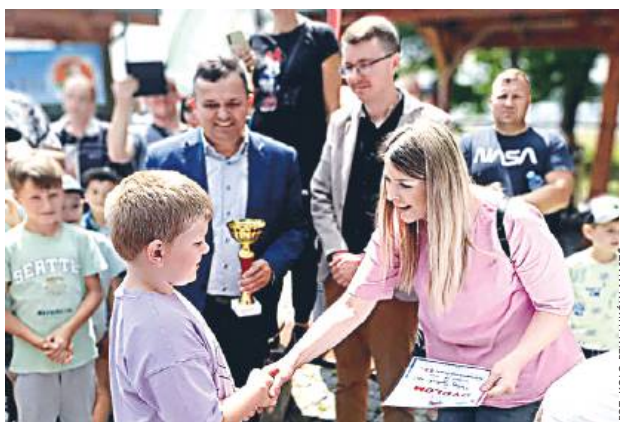
Głównym organizatorem zawodów było Koło PZW Łuków Miasto. Kolejne - nocne gruntowe - odbędą pod koniec lipca na siedleckiej Faworytce organizowane z Kołem PZW Szczupak Siedlce.