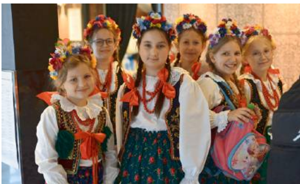
Wszyscy uczestnicy pięknie się prezentowali.

W tegorocznej edycji festiwalu na etapie powiatowym wzięło udział 1282 dzieci ze 124 przedszkoli oraz 1583 uczniów z 296 szkół podstawowych w całym województwie mazowieckim. Wyłoniono najlepszych 43 (zespoły lub soliści) reprezentantów poszczególnych powiatów i 6 czerwca przyszedł czas na grande finale. Tradycyjnie odbył się on na scenie centrum Kultury i Sztuki im. A. Meżeryckiego w Siedlcach.