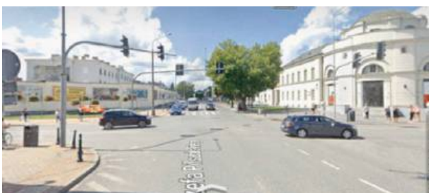
Kierowcy muszą uzbroić się w cierpliwość...

Organizacja ruchu w tym obszarze jest w trakcie opracowywania. Szczegóły wkrótce. RED.