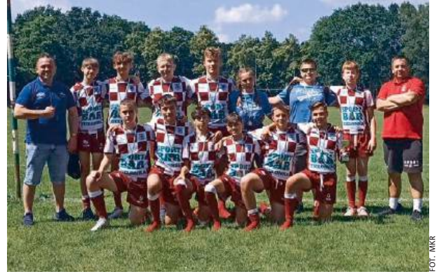
Siedleccy młodziecy z brązowymi medalami Mistrzostw Rugby 7.

Na hali sportowej Zespołu Oświatowo-Wychowawczego w Strzale rozegrano Otwarte Mistrzostwa Powiatu Siedleckiego w Rugby TAG Szkół Podstawowych dziewcząt i chłopców z klas IV, V, VI. W turnieju wzięło