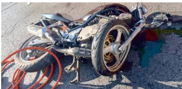
Motocyklista zderzył się z samochodem osobowym.

11 czerwca około godz. 6.45 przy ul. Terespolskiej w Siedlcach auto osobowe zderzyło się z motocyklem. W wyniku wypadku 33-letni kierowca jednoślada zmarł na miejscu. - Kierująca samochodem osobowym 45-letnia kobieta, wyjeżdżając z drogi podporządkowanej, nie ustąpiła pierwszeństwa przejazdu jadącemu ul. Terespolską 33-letniemu motocykliście, w wyniku czego doszło do zderzenia. Motocyklista w wyniku odniesionych obrażeń ciała poniósł śmierć na miejscu zdarzenia. Kobieta z ciężkimi obrażeniami ciała została przewieziona do szpitala - poinformowała Barbara Jastrzębska z KMP w Siedlcach. RED.