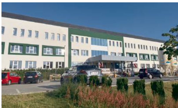
Usługa planowego cięcia cesarskiego jest oferowana bezpłatnie.

Mazowiecki Szpital Wojewódzki w Siedlcach oferuje przyszłym mam możliwość przeżycia planowego cięcia cesarskiego w obecności bliskiej osoby.