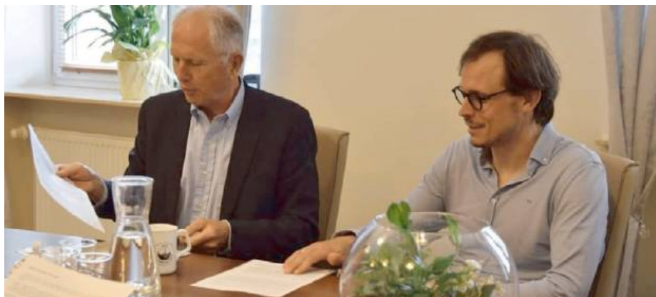
Rozmowy mają szansę zaowocować ciekawym projektem na promocję fabryki