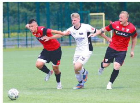
Trener Guzka był zadowolony z postawy Pogoni II w meczu z ŁDK. Wygrana z Jastrzębiem da awans.