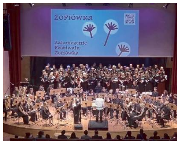
Zofiówkę zakończył koncert muzyki filmowej.

Festiwal Zofiówka to cykl wydarzeń kulturalnych zainspirowanych aktywną, społeczną postawą Zofii Moraczewskiej – mieszkanki Sulejówka z pierwszej połowy XX wieku. Festiwal ma charakter międzypokoleniowy. Jego celem jest budowanie lokalnych więzi społecznych i sąsiedzkich.