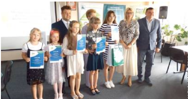
Autorzy najlepszych prac zostali nagrodzeni w starostwie.

Konkurs, zatytułowany „Bezpiecznie na wsi mamy, bo o zdrowie dbamy”, zebrał wiele