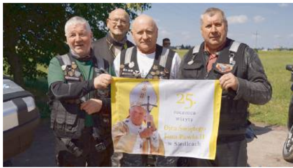
Na cześć i chwałę dla Wielkiego Polaka.

Mamy nadzieję, że pamięć o Wielkim Polaku pozostanie przekazywana pokoleniom, a rajd już na stałe wpisze się w wydarzenie historii naszego miasta i regionu.