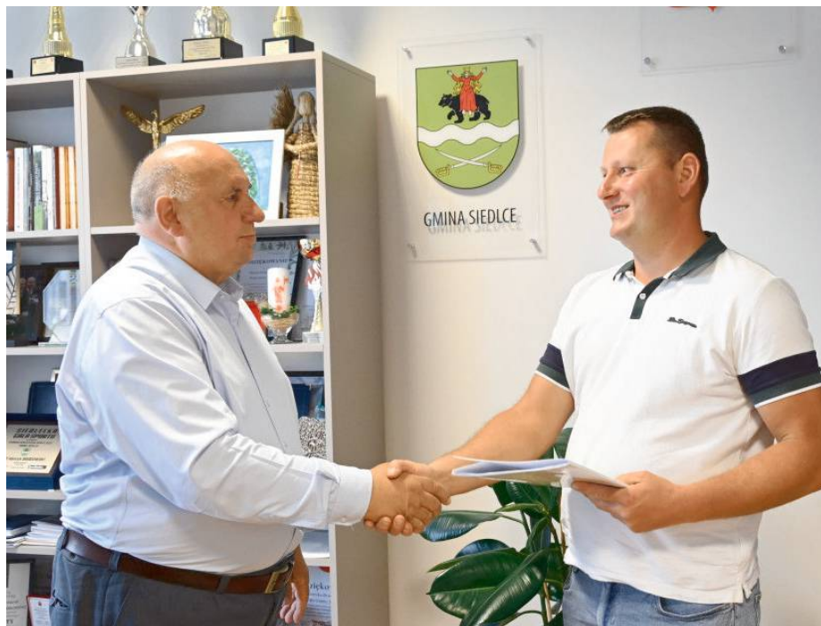
Umowa z wykonawcą została podpisana, czas na budowę

Łączny koszt inwestycji to ponad 543 tysiące złotych. RED