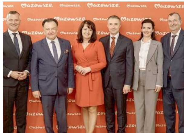
Nowy skład zarządu województwa mazowieckiego.