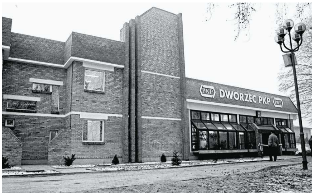
• Dworzec w Mikołowie otwarto w 1993 roku