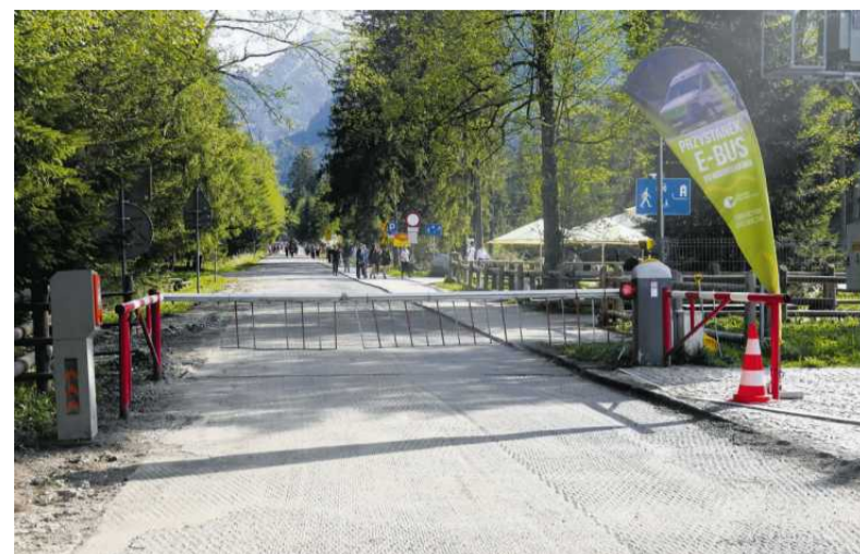
• Wjazd na drogę prowadzącą do Morskiego Oka