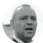
KAROL NAWROCKI na X w rocznicę wyboru na prezydenta

Choćbym szedł ciemną doliną, zła się nie ulękę, bo Wy jesteście ze mną. Dziękuję!