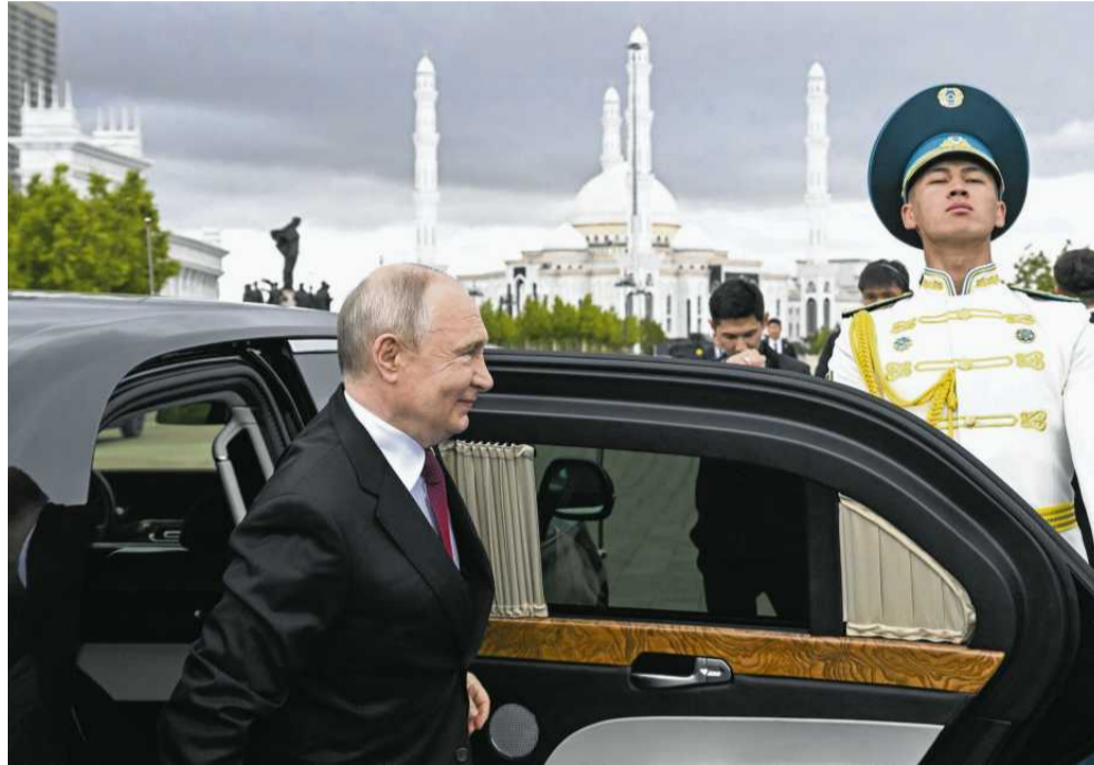
• Putin stawia partnerów przed wyborem – albo z nami, albo z nimi

Po trzecie: w czasie wojny EAUG okazała się bardzo przydatnym instrumentem gospodarczym pomagającym Kremlowi budować obejścia sankcji zachodnich. Byliśmy świadkami tego, jak eksport zakazanych w Rosji towarów z Europy do Armenii, Kazachstanu, Kirgizji rósł raptem o kilkaset procent. A to oznacza,