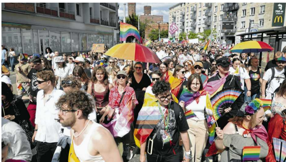
• Sobotni Marsz Równości we Wrocławiu

– Chciałyśmy przyjść od dawna, ale nigdy się nie udawało. W tym roku zło-