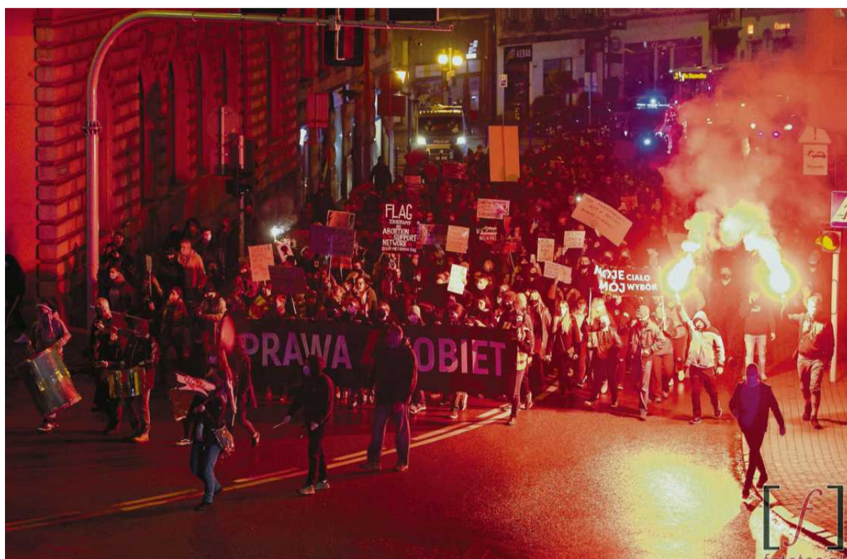
• Protest w Bielsku Białym po ogłoszeniu jesienią 2020 r. „wyroku” TK blokującego prawo do aborcji

Z tłumem, który ryczał tysiącem gardel. Szydził z rządzących mizoginów, drwił z władzy i z policji. Śmiał się i płakał. I kłął jak szewc.