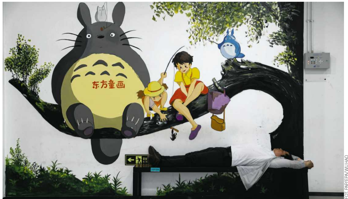
1 czerwca 2026 r., Pekin. Mężczyzna śpi na ławce w centrum handlowym. Więcej zdjęć z Polski i ze świata oraz niezwykłych galerii na Wyborcza.pl/zdjecia