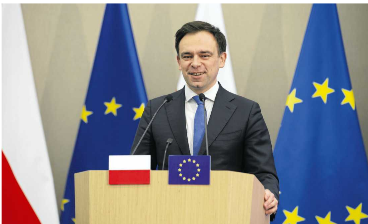
• Minister finansów Andrzej Domański

Pracodawcy domagają się, by podwyżka była tak niska, jak tylko pozwalają na to przepisy. Główny ekonomista Federacji Przedsiębiorców Polskich Łukasz Kozłowski wyliczył, że skoro relacja płacy minimalnej do przeciętnego wynagrodzenia w I kw. 2026 r. utrzymała się powyżej granicy 50 proc., to gwarantowany ustawowo poziom płacy minimalnej na 2027 r. wyniesie 4860,47 zł.