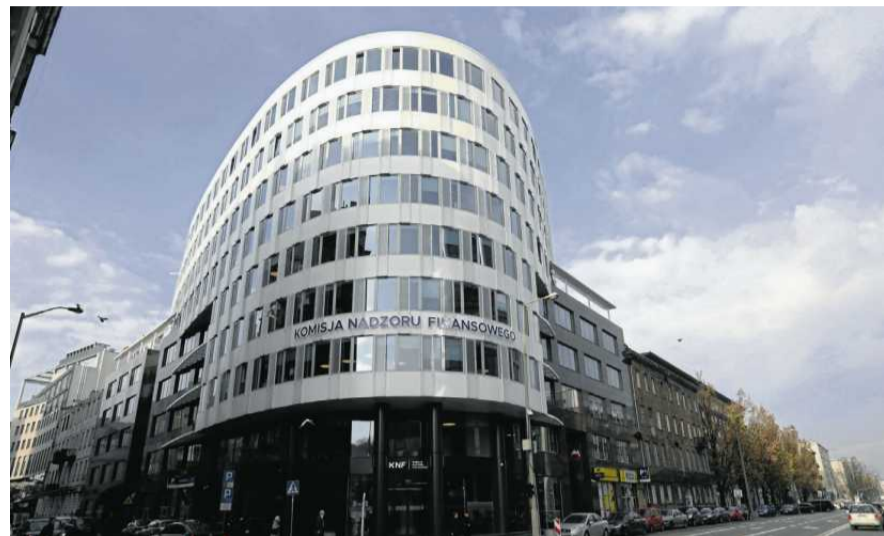
• Komisja Nadzoru Finansowego analizuje rozwiązania hiszpańskie

W Hiszpanii brokerzy nie mogą sponsorować imprez sportowych czy konferencji branżowych. To sytuacja trudna do wyobrażenia w Polsce, gdzie takie firmy są głównymi sponsorami wielu wydarzeń dla inwestorów