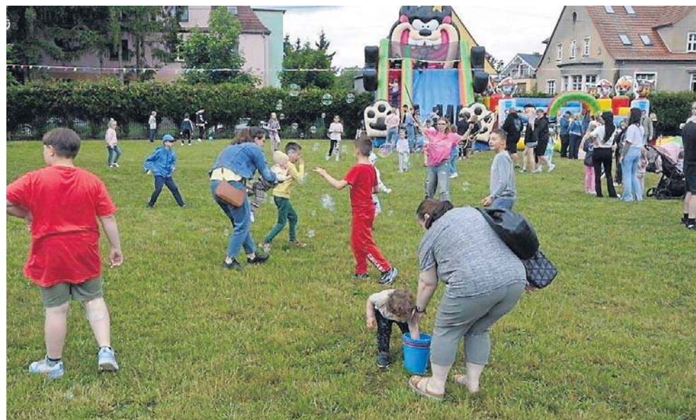
Decyzja radnych ma poprawić stabilność finansową zawodowych rodzin zastępczych

- Rodziny zastępcze zawodowe pełnią szczególną rolę w systemie pieczy zastępczej. Zapewniają dzieciom bezpieczne warunki do rozwoju emocjonalnego, społecznego i edukacyjnego. Ich praca wymaga całodobowego zaangażowania, wysokiej dyspozycyjności i gotowości do opieki nad dziećmi, które często doświadczyły traum, zaniedbań lub problemów zdrowotnych - mówi Grzegorz Koczubaj, rzecznik legnickiego ratusza.