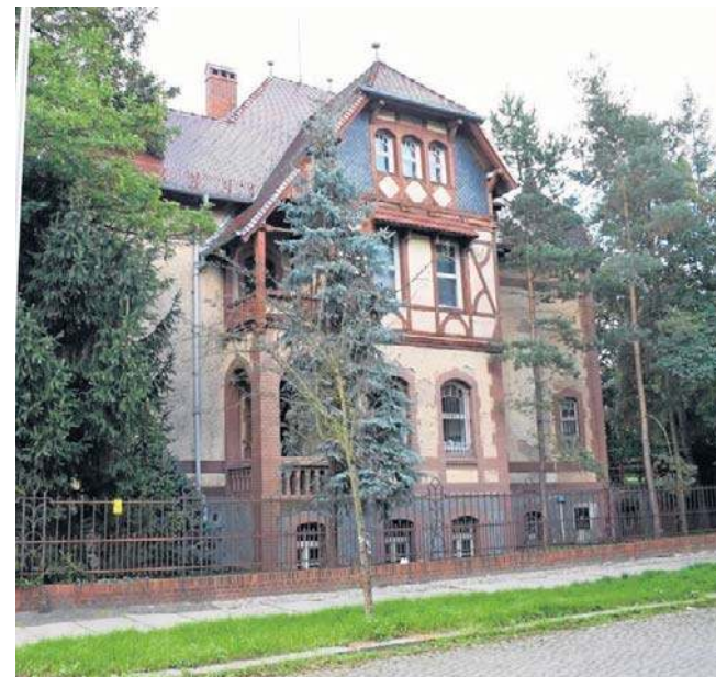
Do placówki przy ul. Rataja uczęszcza ok. 1000 dzieci

- Nauczani doświadczeniem innych miast wiemy, że takie decyzje często nie kończą się dobrze dla dzieci. Ta niepokojąca sytuacja może sprawić, że dzieci i młodzież będą mie-