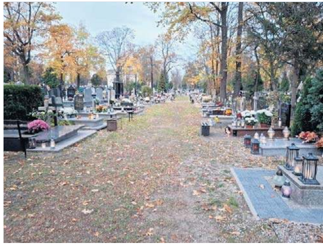
Legnicki cmentarz przy Wrocławskiej (zdjęcie u góry i na dole)