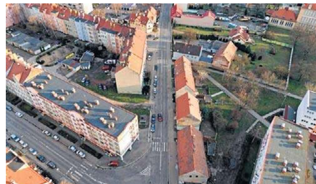
Remont ulicy Działkowej to kolejny punkt Legnickiego Programu Drogowego, ogłoszonego w 2024 roku