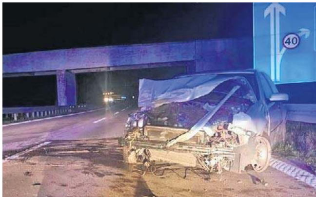
W nocy z czwartku na piątek doszło do wypadku na autostradzie A4. 28-latek zasnął za kierownicą