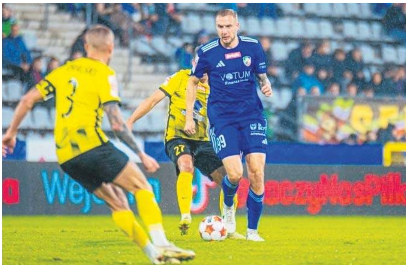
Miedź prowadziła dwoma bramkami, potem Wiczyzta wyrównała, a na finał Mansfeld zapewnił Legnicy wygraną

PIŁKA NOŻNA WIECZYSTA KRAKÓW POKONANA NA STADIONIE W LEGNICY