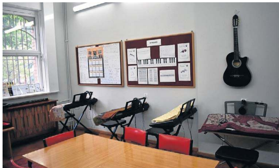
Młodzi ludzie poznają tu tajniki gry na instrumentach, stawiają pierwsze kroki w plastyce