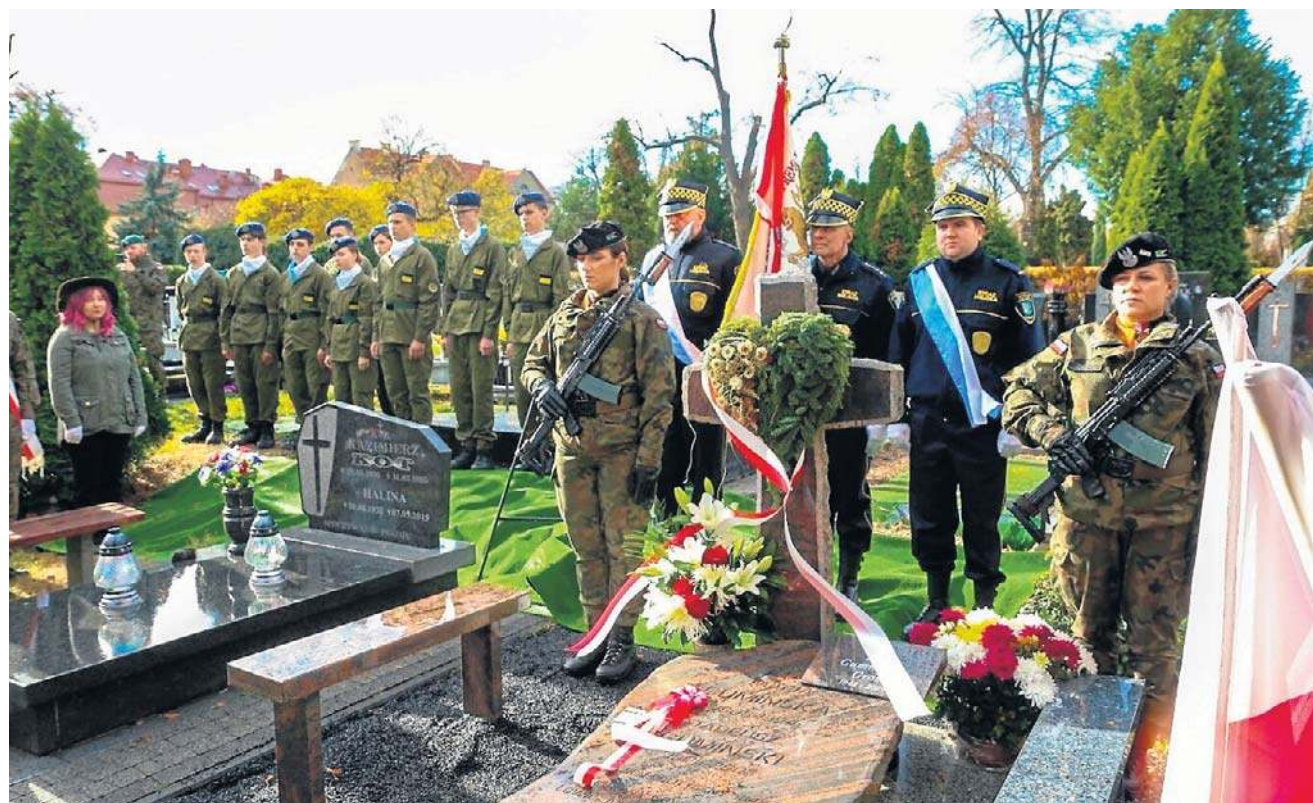
Grób Tadeusza Gumińskiego oznaczono tabliczką: „Mogiła Weterana Walk o Wolność i Niepodległość Polski”