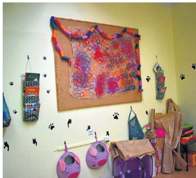
Na Rataja działa wiele sekcji artystycznych

Reprezentacja partii przyniosła petycję na poniedziałkową sesję Rady Miasta Legnicy licząc na to, że choć przyszłi bez zapowiedzi, to radni jednak pochylił się nad sprawą. Obrady były jednak utrudniane przez obrońców krzyża, sesję przerywano wieloma przerwami, skończyła się późnym wieczorem i plan partii Razem się nie powiódł.