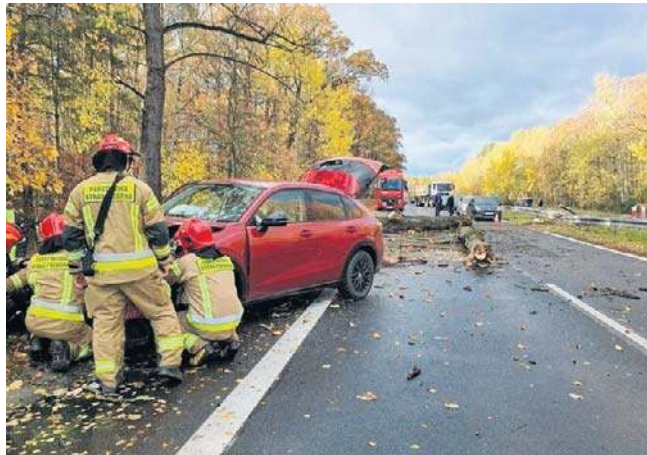
Na samochód 67-latka z Lubina spadło drzewo

Chwilę później, na przeciwnym pasie drogi DW 333,