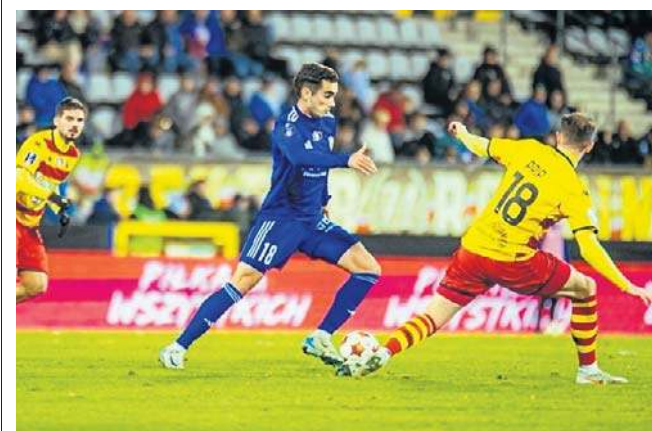
Miedź Legnica w meczu z Jagiellonią Białystok zaprezentowała się dobrze