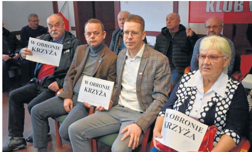
27 października na sesję Rady Miejskiej Legnicy przyszło kilkudziesięciu obrońców krzyża

- Zostałem ochrzczony, krzyż jest ze mną od dziecka. Nie wyobrażam sobie, żeby w takim miejscu jak sala obrad Rady Miejskiej go nie było. Tym bardziej, że to nie pan prezydent Kupaj ten krzyż wieszal więc nie miał moralnych uprawnień, żeby go zdejmować - dodał pan Ryszard, legniczanie.