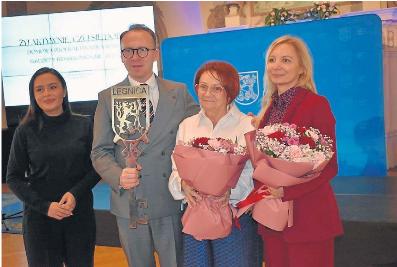
Władze Legnicy podczas Dni Seniora wręczyły temu środowisku symboliczny klucz do miasta. W wieku poprodukcyjnym mieszka w naszym mieście około 15 tysięcy osób