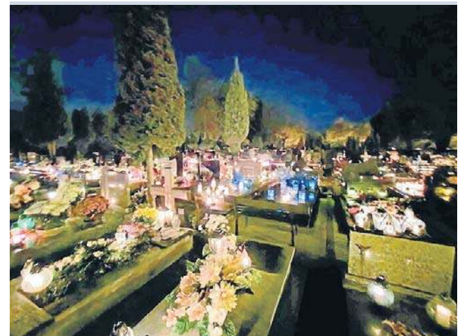
Cmentarz w Chojnowie