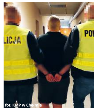
fol. KMP w Chełmie

zany adres. Zatrzymali tam dwie mieszkanki Chełma w wieku 22 i 32 lat.