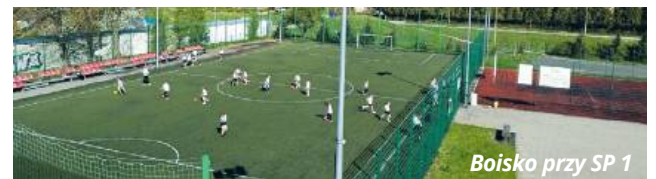
Boisko przy SP 1

Zamówienie zostało podzielone na dwie części, odpowiadające lokalizacjom kompleksów. W obu przypadkach zakres prac obejmuje m.in. opracowanie dokumentacji projektowej, wymianę nawierzchni boisk sportowych, modernizację ogrodzeń, wymianę wyposażenia oraz wykonanie dokumentacji powykonawczej wraz z inwentaryzacją geodezyjną. Dodatkowo, zgodnie z wytycznymi, na każdym obiekcie pojawi