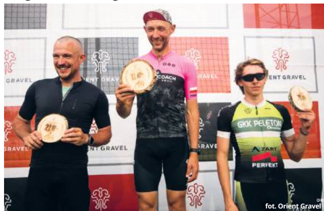
fol. Orient Gravel

W tym samym czasie dwójka kolarzy Peletonu brała udział w dwóch wyścigach z cyklu Poland Bike Marathon.