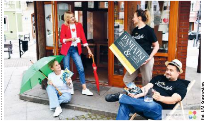
fol. UM Krasnostaw

W rynku miejskim rozpoczął działalność nowy punkt z pamiątkami, w którym lokalna tradycja łączy się z kreatywnym podejściem do promocji miasta i regionu.