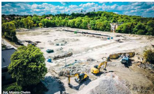
fol. Miasto Chełm

Umowę na realizację podpisano 22 maja 2024 roku z firmą MIRBUD ze Skierniewic, która została wyłoniona w postępo-