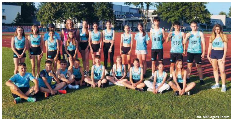
fol. MKS Agros Chełm