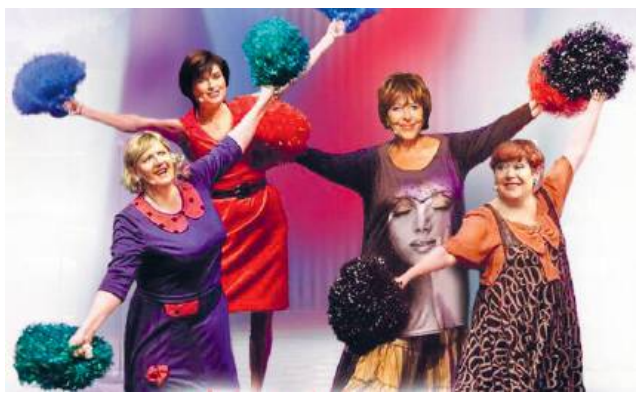
Spektakl w Muzeum Regionalnym w Krasnymstawie

Tak dowcipnie, otwarcie, z dystansem i poczuciem humoru na własny temat jak w tym spektaklu o sprawach kobiet nikt jeszcze nie mówił! Sztuka w zabawny sposób opowiada o trudnym okresie życia, który nie ominie żadnej z pań. Wspólna doświadczeń łączy bohaterki oraz kobiety na widowni. Spektakl staje się „babskim spotkaniem” pełnym humoru – najlepszym lekarstwem na wszelkie dolegliwości. Nieuchronne problemy w radosnej