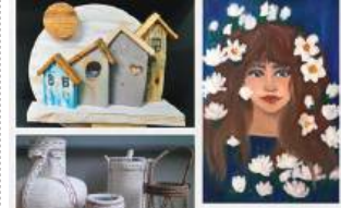
Wystawa w Biblioteki Pedagogicznej w Chełmie

Ekspozycja, która nosi tytuł „Równe szanse”, będzie czynna do 28 czerwca. Oglądać ją można w godzinach pracy placówki. szer