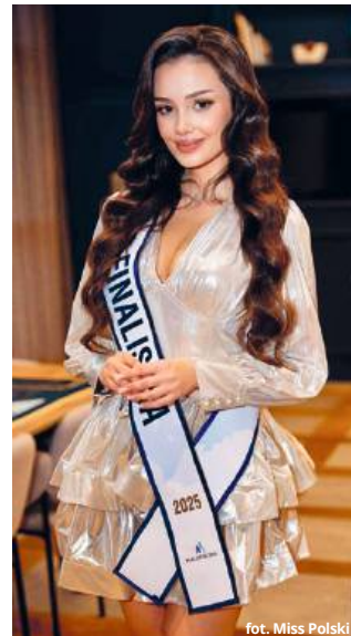
for. Miss Polski

MK: - Wydaje mi się, że najistotniejsza rada, jaką mogę dać, to to, że warto wychodzić poza swoją strefę komfortu, przełamać pewne lęki czy bariery, bo właśnie w taki sposób można się rozwijać i wyraźnie dostrzegać własny progres. Nie ma sensu przejmować się opiniami innych, ponieważ są to nasze decyzje i nasze marzenia. Osobiście nie spotkałam się dotąd z negatywnymi opiniami czy stereotypowym podejściem do brania udziału w konkursach piękności, ale zdaję sobie sprawę, że istnieje takie przypadki, a komentarze w stylu, że „skoro jest miss, to na pewno jest ładna, ale niekoniecznie ma coś do powiedzenia” nie mają nic wspólnego z rzeczywistością. Nie wiem, skąd się to bierze, ponieważ dziewczyny, które