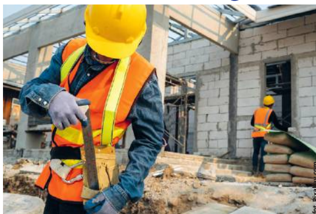
Właściciele domów jednorodzinnych z pewnością ucieszą się z możliwości budowy zadaszonych tarasów o powierzchni do 50 mkw. bez zbędnych formalności

jedynie zgłoszenie inwestycji. Ta zmiana ma na celu odciążenie urzędów i zapewnienie większej swobody inwestorom. Wśród obiektów objętych tym ułatwieniem znajdują się m.in. przydomowe schrony o powierzchni do 35 mkw. Właściciele domów jednorodzinnych z pewnością ucieszą się z możliwości budowy zadaszonych tarasów o powierzchni do 50 mkw. bez zbędnych formalności, co pozwoli na łatwiejsze powiększenie przestrzeni rekreacyjnej. Uproszczenia obejmą również budowę boisk sportowych, zarówno prywatnych, jak i osiedlowych czy szkolnych, co może przyczynić się do rozwoju lokalnej infrastruktury sportowej. Co więcej, nowe