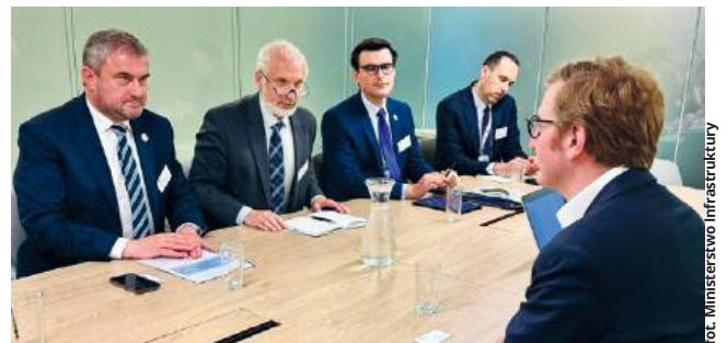
Wiceminister Stanisław Bukowiec spotkał się z europosłami zaangażowanymi w prace Komisji Transportu i Turystyki (TRAN)

Wszyscy są doskonale świadomi tego, że umowa zburza równowagę na rynku transportu drogowego – przewoźnicy z Ukrainy mają takie same prawa jak przewoźnicy z terenu unii, ale nie muszą z kolei spełniać unijnych wymogów. Przewoźnicy z terenu UE nie są w stanie konkurować z przewoźnikami ukraińskimi, ponieważ są zobowiązani do wypełniania chociażby tych wymogów, które związane są z europejskim „Pakiem mobilności”. To przepisy, które regulują między innymi warunki pracy kierowców, w tym ich wynagrodzenia, przepisy