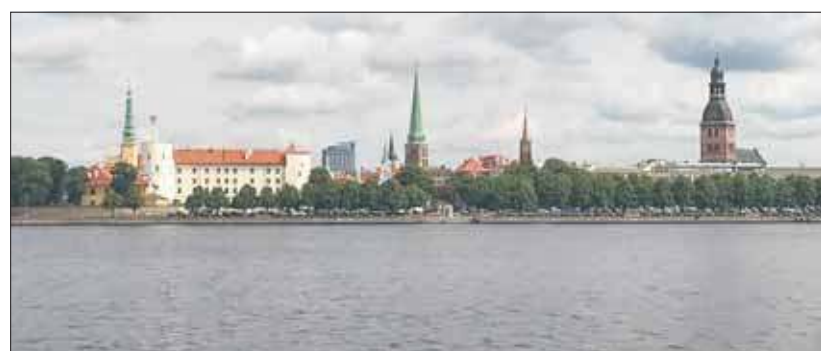
Widok za Dźwiną, stara zabytkowa część miasta. Z lewej zamek krzyżacki, z prawej protestancka katedra Najświętszej Maryi Panny, w środku katedra katolicka św. Jakuba – w mieście Ryga, Łotwa

– 223 km dalej. Dźwina to druga po Wiśle rzeka Bałtyku. W sumie dziś przejechałem 514 km. Na rowerze zajęłoby mi to 5 dni. Dyneburg to drugie po stolicy Rydze miasto Łotwy. To największe skupisko Polaków na Łotwie. Do granicy z Litwą tylko 25 km. Jutro po zwiedzeniu miasta jadę autobusem do Wilna. Tam zacznie się ostatni etap mojej podróży – przejazd przez Litwę aż do Suwałk, cały czas rowerem.