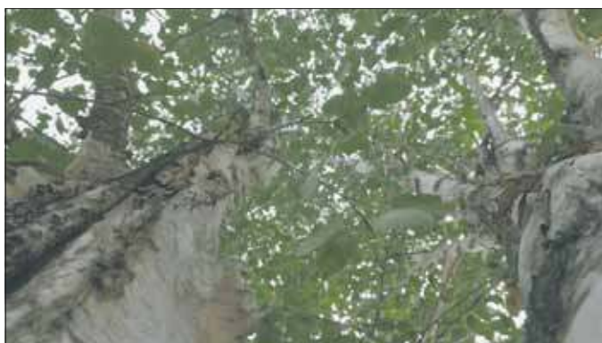
Brzozy na Niedzieliskach

skiej w Niedzieliskach. Nie w donicach, lecz tradycyjnie – w gruncie.