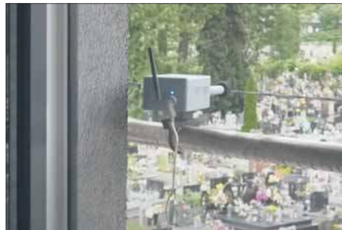
Urządzenie do monitorowania poziomu zanieczyszczeń

Od dwóch miesięcy w Jaworznie działa urządzenie, które monitoruje poziom zanieczyszczeń w powietrzu. Czujnik został zainstalowany na wieżowcu Kirker Tower i przez ostatni czas zbierał dane dotyczące jakości powietrza w centrum miasta. Wyniki są już znane i dają powód do ostrożnego optymizmu.