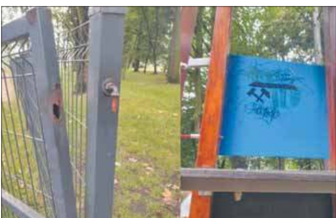
Zniszczony plac zabaw w Jeleniu

Teraz ofiarą wandalizmu padła kolejna przestrzeń miejska, a dokładnie plac zabaw przy Domu Kultury w Jeleniu. Nieznany sprawca w nocy z 5 na 6 sierpnia uszkodził bramkę wejściową, a także pomazał urządzenia, które znajdowały się na terenie obiektu. O zdarzeniu poinformowało ATELier Kultury.