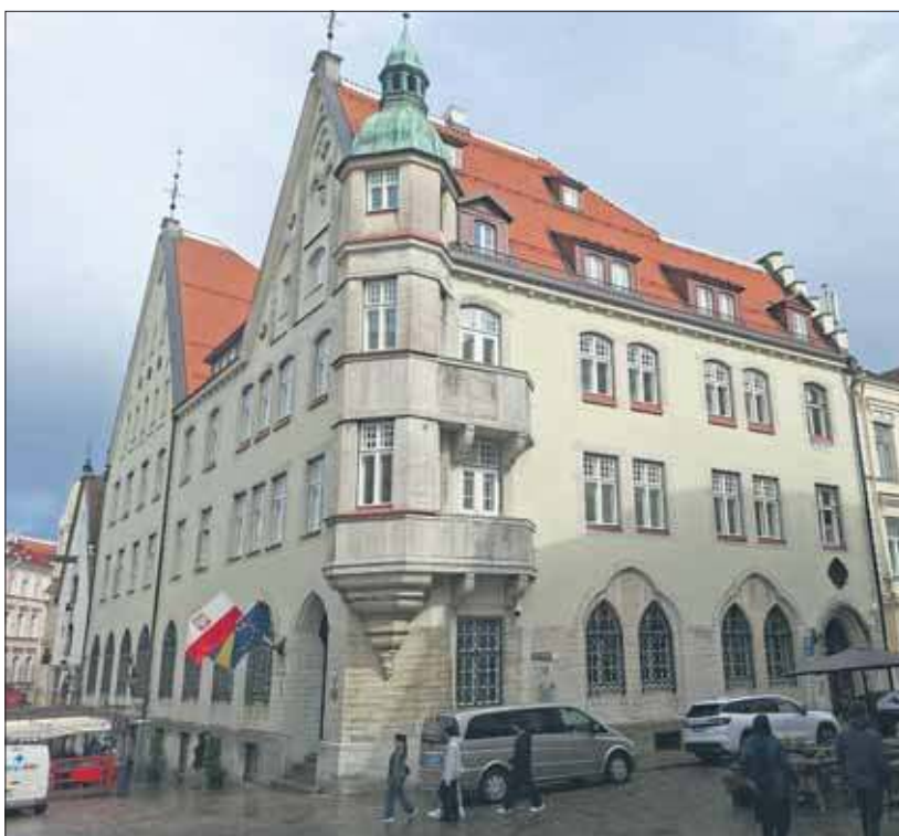
Polska ambasada na Starym Mieście