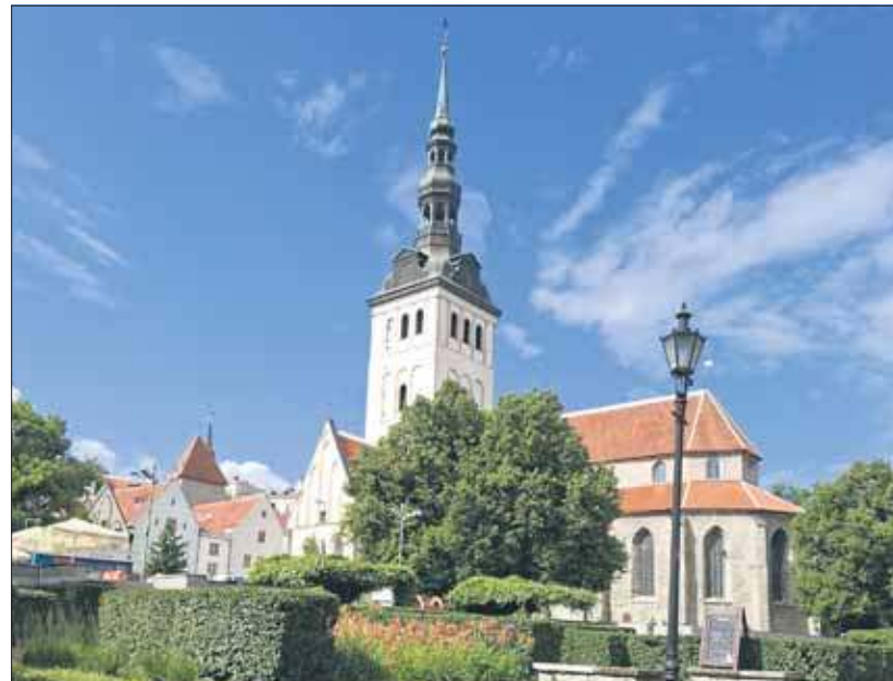
Kościół św. Mikołaja z XIII w. estońskiego kościoła ewangelicko-luterańskiego

Dziś zarówno śniadanie jak i kolację jadłem nad Dźwiną. Z tym, że pierwszy posiłek w Rydze, a wieczórny w Dyneburgu