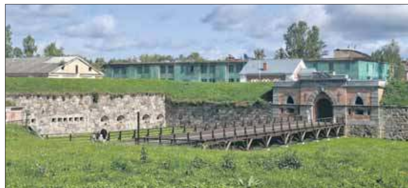
Wilno – Litwa