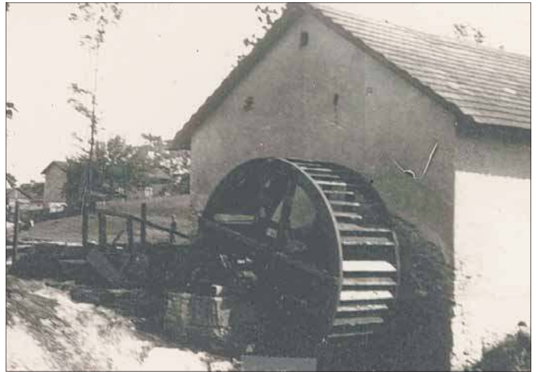
Długoszyński młyn w rejonie tytułowego stoku, lata 40. XX wieku (ze zbiorów prywatnych)

Mamy pełnię tzw. sezonu ogórkowego, przyszło mi więc na myśl miejsce, które z okresem takowym związane było dla mnie nieodłącznie od samego dzieciństwa. Zakątek ten dziś wydaje się raczej zapomnianą przestrzenią – wszak kiedyś tętnił życiem. Co to za miejsce? A mianowicie tzw. stok.