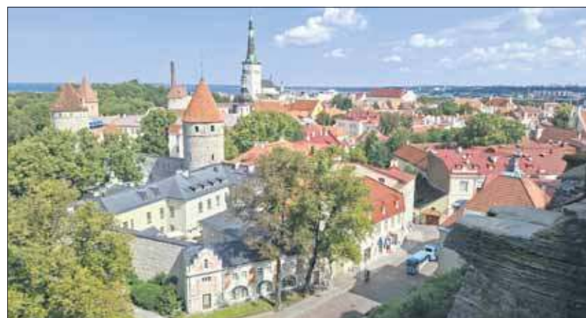
Widok ze wzgórza Toompea na stare miasto – w mieście: Tallinn, Estonia