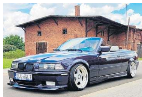
6. Bmw e36 cabrio, 1998, Alan Ledwoń