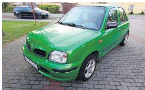
1. Nissan Micra, 2000, Wojciech Rzeźniczek, Kup