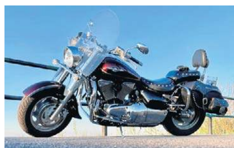
7. Suzuki Boulevard, 2008, Gabriel Wiśniewski, Opole