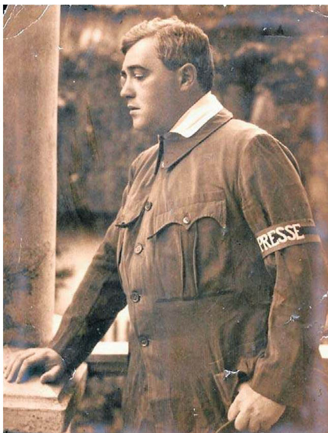
Ferenc Molnár – najwybitniejszy węgierski pisarz i dramaturg, pisał reportaże w Hnilczu.

Jedną z przełomowych dat w dziejach I wojny światowej na froncie wschodnim był maj