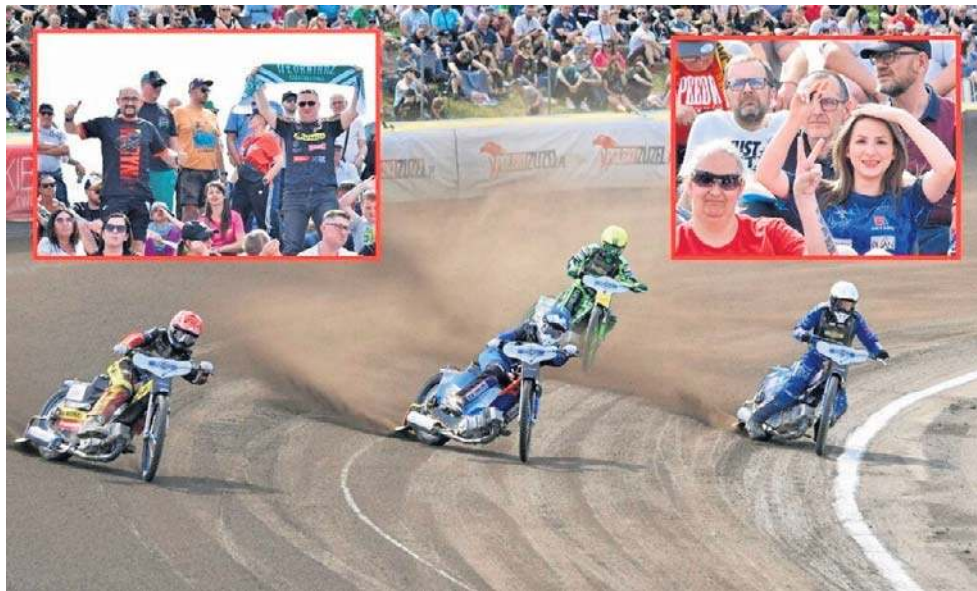
Podczas finału Złotego Kasku, na stadionie w Opolu trybuny są szczelnie wypełnione

Opole będzie jego gospodarzem już po raz piąty z rzędu przede wszystkim dlatego, że każdego roku podczas rozgrywania zawo-