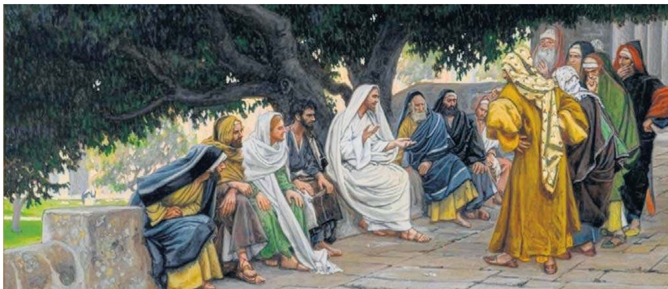
Jean Tissot „Jezus wystawiony na próbę przez faryzeuszy i eseneńczyków”. Ten obraz powstał we Francji w latach 1886-1894. Obecnie można go oglądać w Brooklyńskim Muzeum w Stanach Zjednoczonych

Nazwa ugrupowania pochodzi od hebrajskiego słowa „oddzielony”, „odseparowany”. Jej rodowód nie jest znany, naj-