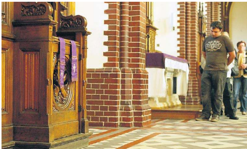
Szczególnie przed Wielkanocą, przed konfesjonatami ustawiają się kolejki

Kościół ma przykazania kościelne, ale wierni niekoniecznie pamiętają je słowo w słowo: przyjęło się po prostu, że jak Wielkanoc - to spowiedź i Komunia Św.