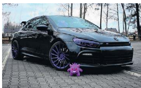
9. Volkswagen Scirocco mk3, 2009, Romek Kacprzak