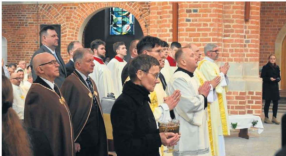
Msza Krzyżma to ostatnia liturgia przed rozpoczęciem Triduum Paschalnego. W katedrze opolskiej wierni mogli w niej uczestniczyć pierwszy raz po kilkuletniej przerwie.

- Nasz udział w chrystusowym namaszczeniu oznacza bogate obdarowanie oraz wyjątkowe wybraństwo i powołanie. W tym jest źródło naszego szczęścia. Jak często podkreślał święty Jan Paweł II. To boski dar i powołanie. Wszyscy chrześcijanie od dnia chrztu są świątynią Ducha Świętego