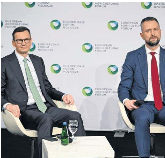
Między Mateuszem Morawieckim a wicepremierem Kosiniakiem-Kamyszem doszło do ostrej wymiany zdań

Mateusz Morawiecki tłumaczył, dlaczego jest prze-