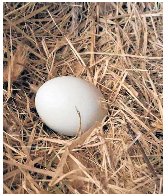
Na skład jaja najmocniej wpływa żywienie nioski.

W czasie Wielkanocy na naszych świątecznych stołach królują jaja. Producenci zalewają nas hasłami, których celem jest zachęta do kupowania tych, a nie innych. Czy hasła takie jak „szczęśliwa nioska, pyszne jajko”, „jajka z nutką szczęścia” czy „jajka od szczęśliwych kurek” mają coś wspólnego z prawdą? Czy faktycznie kury mogą być szczęśliwe?