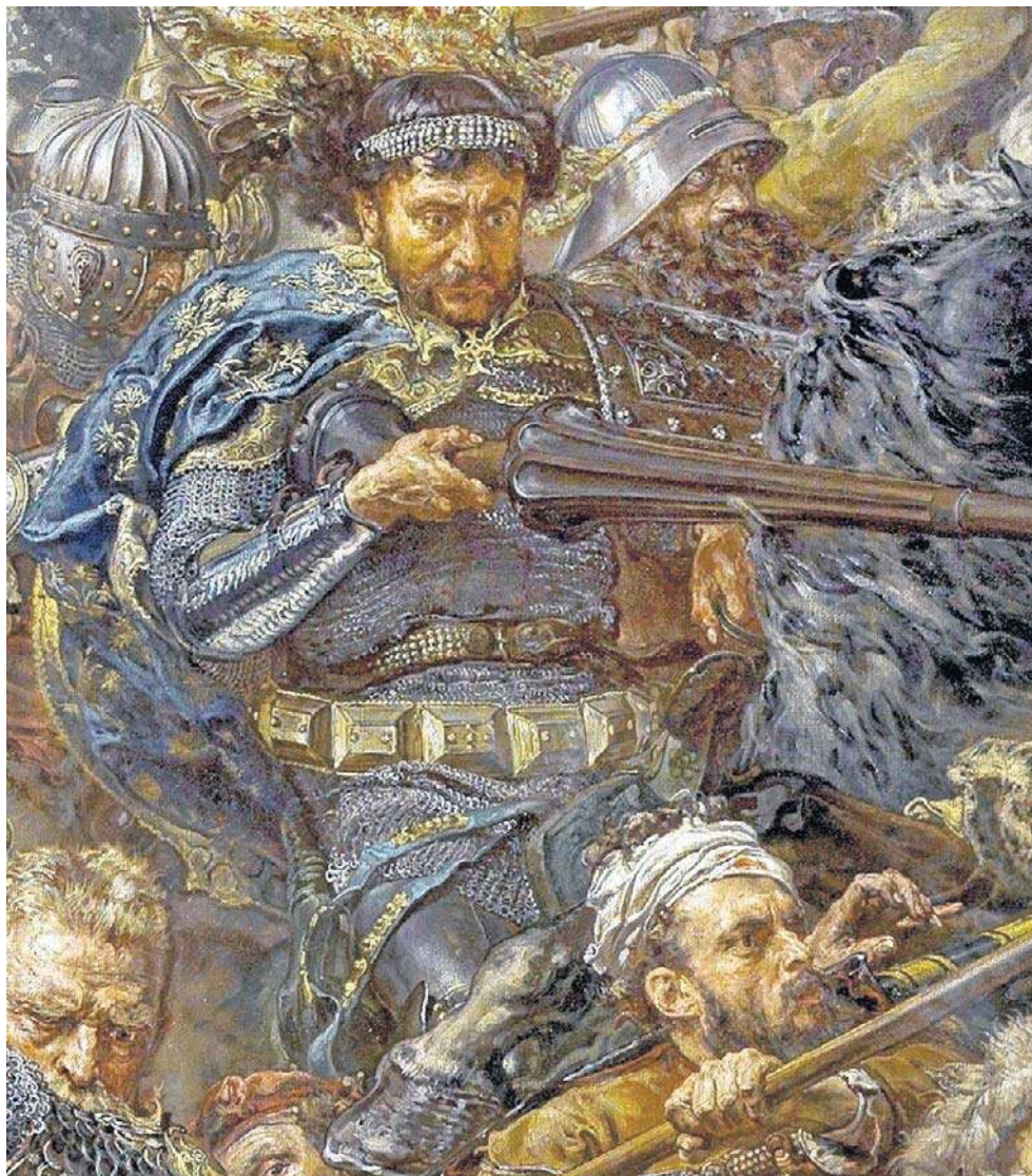
Legendarny Zawisza Czarny; fragment obrazu „Bitwa pod Grunwaldem” Jana Matejki.

Hnilcze zwróciły na siebie moją uwagę szczególnie ze względu na pisarza - Stani-