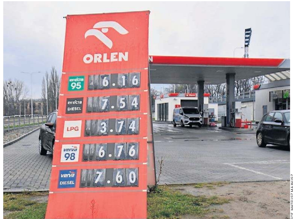
To, co dziś wygląda jak ulga dla kierowcy, jutro może wrócić do niego w innej formie: w słabszym budżecie państwa, większym deficycie, wyższych kosztach obsługi długu.

To właśnie dlatego część ekonomistów mówi dziś wprost, że rząd kupuje sobie chwilowy spokój polityczny kosztem długoterminowej stabilności finansów państwa. Taka operacja wygląda dobrze na konferencji prasowej i przynosi szybki efekt psychologiczny, ale nie rozwiązuje istoty problemu. Ceny paliw nie wzrosły przecież dlatego,