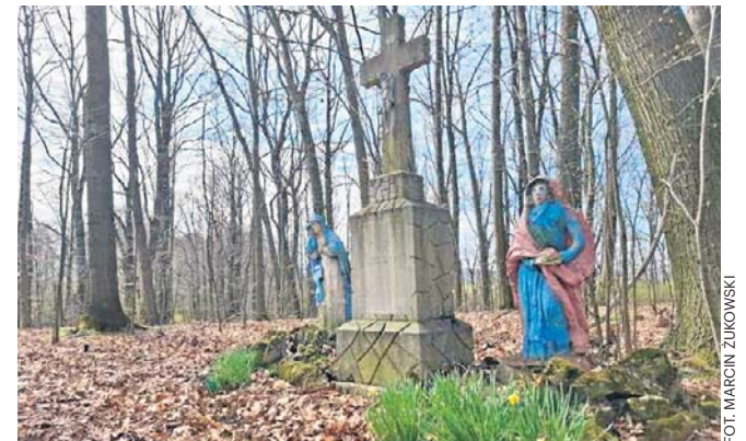
Zabytkowy zespół figur jest mocno zaniedbany.