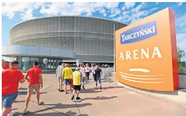
Stadion Tarczyński Arena we Wrocławiu był już areną kilku wielkich wydarzeń, nie tylko sportowych

szewski, rzecznik prasowy Tarczyński Areny. - Przyznam, że oprócz Śląska Wrocław, Manchester United od finału Ligi Mistrzów w 1999 roku prywatnie jest moim ulubionym klubem, a z grona włoskich klubów największą sympatią darzę właśnie AC Milan - dodał.