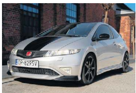
5. Honda Civic Type R, 2007, Piotr Lechun, Kluczbork