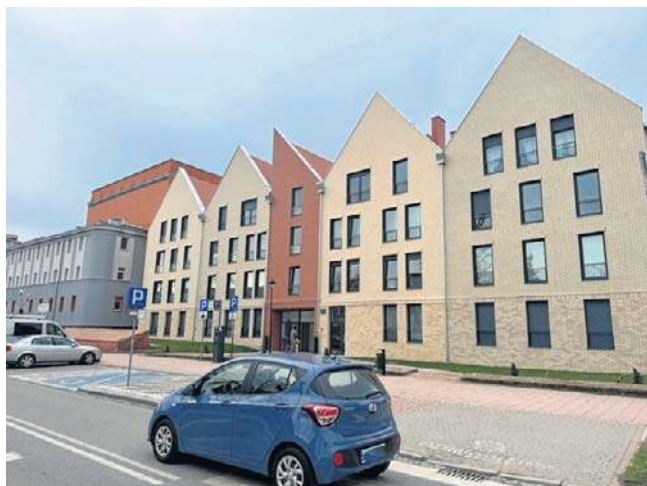
Mieszkania budowane w ramach SIM miały być alternatywą dla osób o relatywnie niskich dochodach.