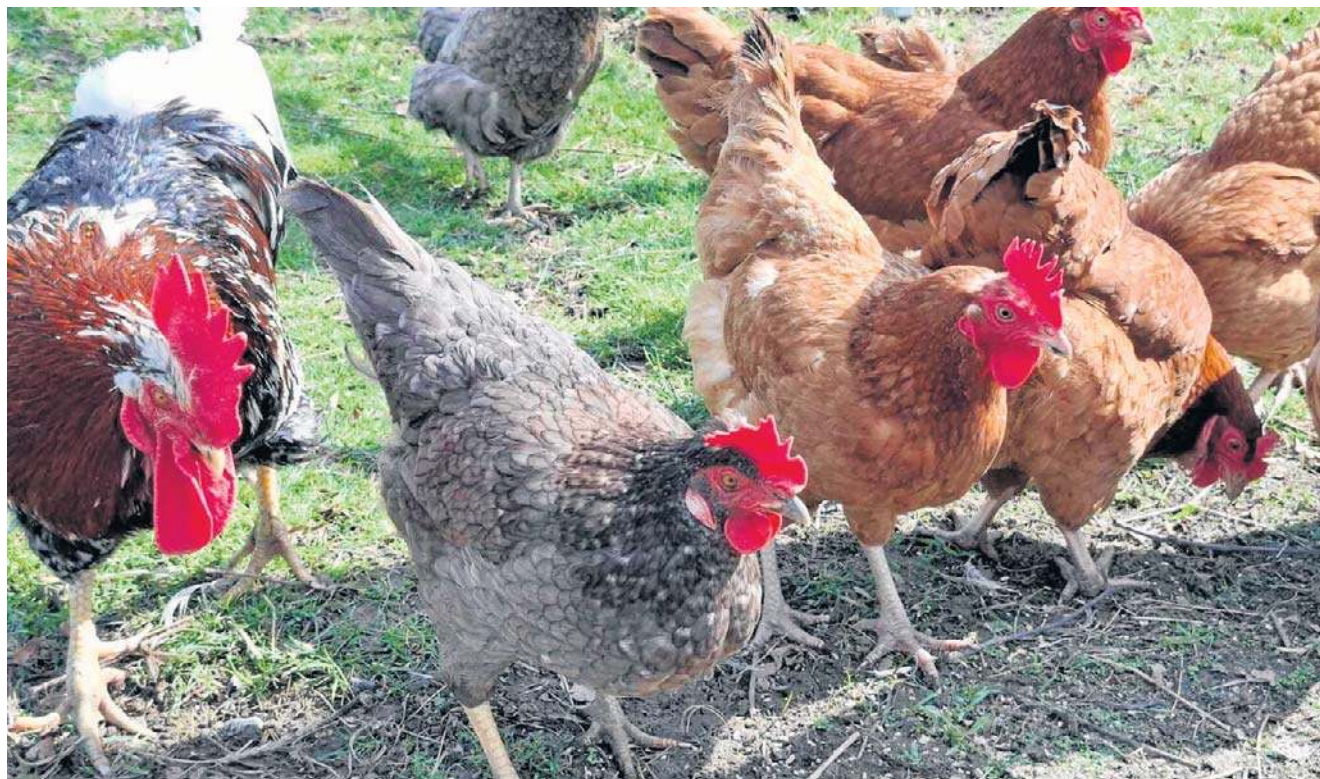
Szczęśliwa kura jest zdrowa, najedzona, napojona, ma możliwość grzebania i składania jaj w gnieździe.