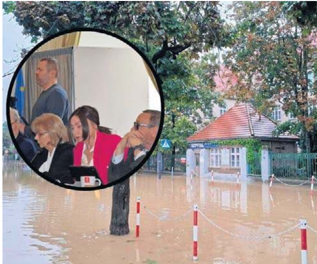
Półtora roku po wielkiej powodzi budowa bezpieczeństwa przeciwpowodziowego budzi nadal duże emocje.