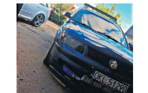
7. Passat b5 1.8T 4Motion, 2000, Sebastian kulesza, Łowkowice