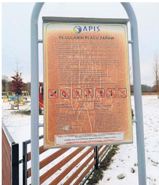
Później regulamin przeczytał też jeden ze strażników i stwierdził, że zapisu, na jaki się powołał, w nim nie ma.

Opolanka bardzo się zdziwiła, gdy kilka tygodni później odebrała wezwanie do straży miejskiej.