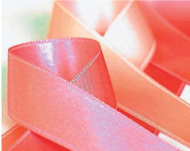
Wiele informacji na temat leczenia nowotworów można znaleźć na: onkologia.gov.pl

- Każdy chce mieć szansę na wyleczenie, więc wstawiamy po cztery łóżka, choć powinni być po trzy - tłumaczy pielęgniarka. - Przecież nie możemy odmówić nikomu leczenia, a nowotworów przybywa.