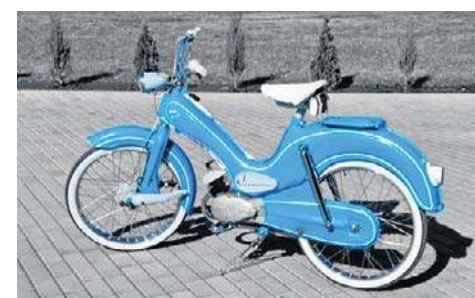
8. DKW Hummel, 1956, Oliver Smolin, Opole