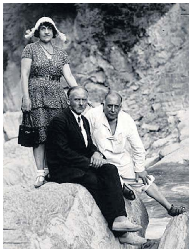
Ferdynand Ossendowski – płodny powieściopisarz, który ma swój udział w mitologizacji Hnilcza.

zyskania sił po bojach frontowych. Zapewniono przebywającym nie tylko wyżywienie i odpoczynek, ale zorganizowano również kursy przyuczające do zawodu i warsztaty. Stworzono m.in.: szkołę telefonistów polowych, mały szpital