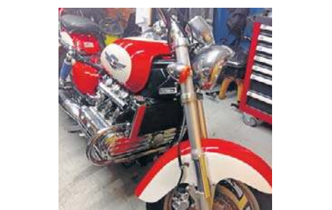
9. Honda valkyria, 1997, Piotr Wajs, Namysłów