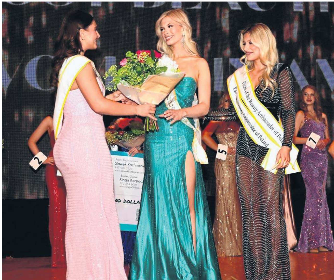
Chicago nazywane jest stolicą Polaków w USA. To jedno z największych skupisk Polonii na świecie.

- Miss Polonia to najpotężniejszy konkurs w Polsce, a jego