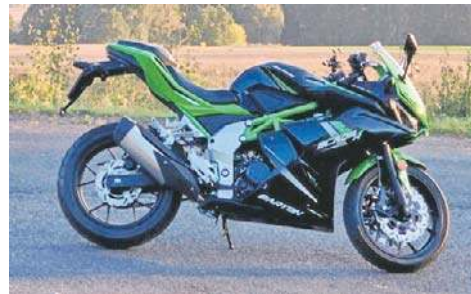
3. Barton Blade R 125, 2024, Andrzej Krzysztof Kubiak