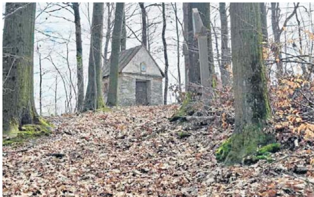
Kaplica na szczycie jest ostatnią stacją drogi krzyżowej.

Rzeźby pasyjne prawdopodobnie wykonali artyści ze szkoły rzeźbiarskiej, która kształciła w Sławniowicach licznych i bardzo dobrych rzemieślników. Stacje Drogi Krzyżowej rozpoczyna rzeźba przedstawiająca modlitwę w Ogrójcu. Klekający Pan Jezus jest w towarzystwie anioła trzymającego krzyż. Dalej ustawiono kamienne 14 stacji drogi krzyżowej. Niektóre uszkodzone, przewrócone, bez oznaczenia, pozbawione metalowego krzyżyka. Na szczycie wzgórza jest końcowa kapliczka będąca stacją „Złożenia do grobu”. Można wejść do środka, bowiem drzwi nie