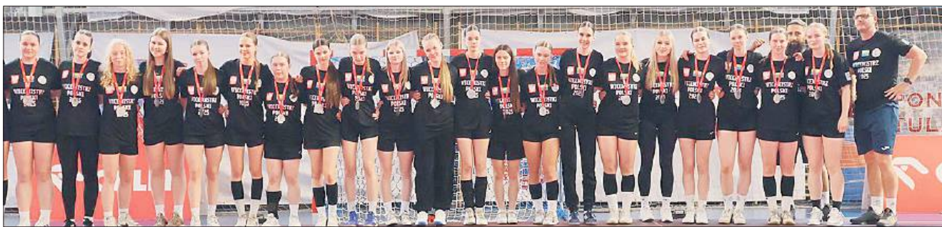
SPR POGOŃ 1945