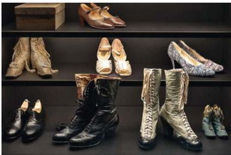
fol. Tomasz Kaczor/Muzeum Warszawy