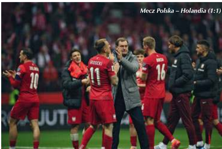
Mecz Polska – Holandia (1:1)