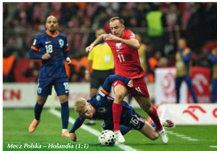
Mecz Polska – Holandia (1:1)

Co bowiem istotne, na rozszerzeniu mundialu zyskały przede wszystkim inne kontynenty. Z naszego awans wywalczy szesnaście drużyn. To oczywiście najwięcej, ale patrząc na siłę europejskich reprezentacji – nadal mało. Afryka otrzymała dziewięć, a Azja osiem miejsc. Dlatego proszę pamiętać: europejska droga na mistrzostwa świata była i jest wyboista. Pytanie, czy nasza reprezentacja, dzięki pracy trenera Urbana, jest