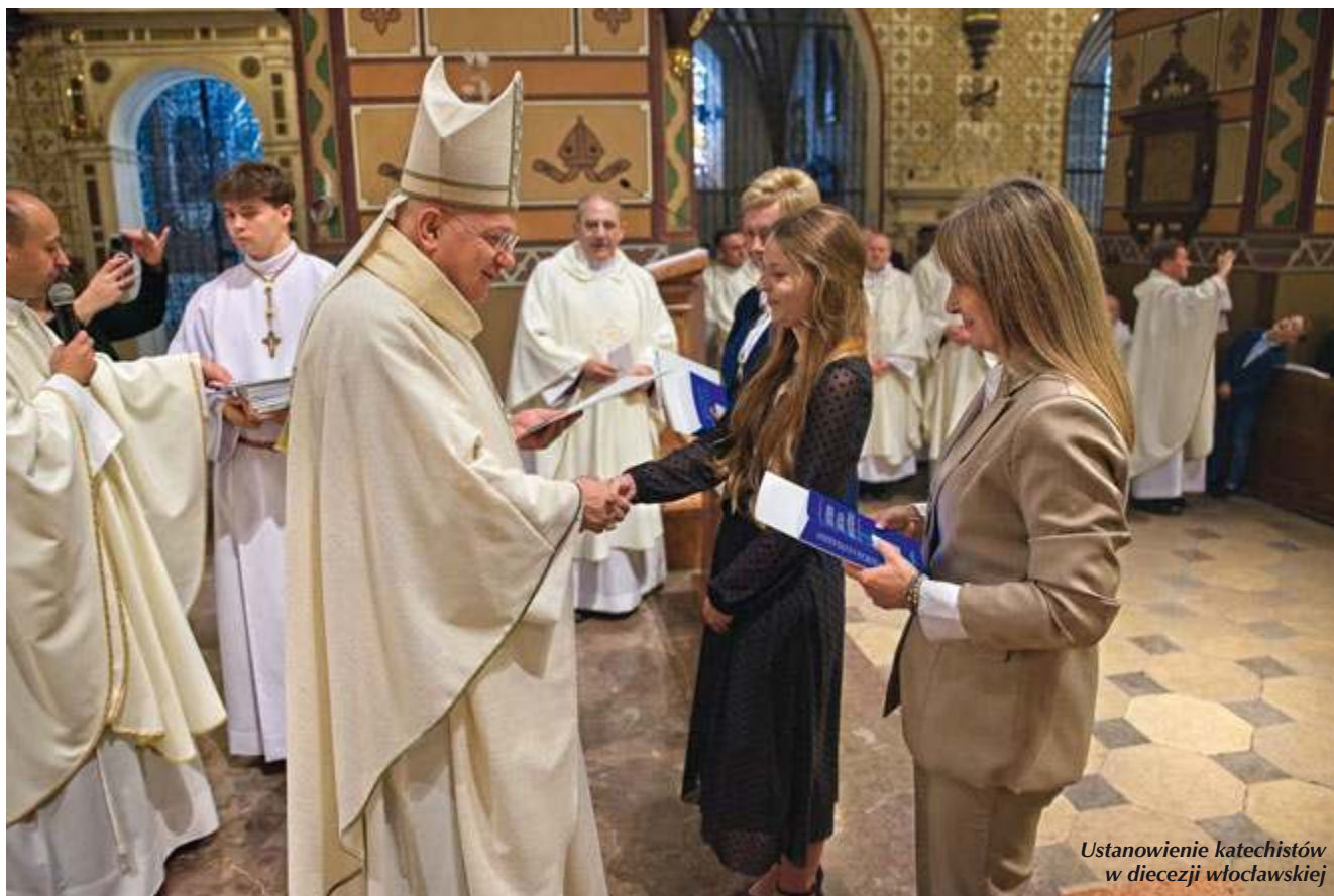
Ustanowienie katechistów w diecezji wrocławskiej