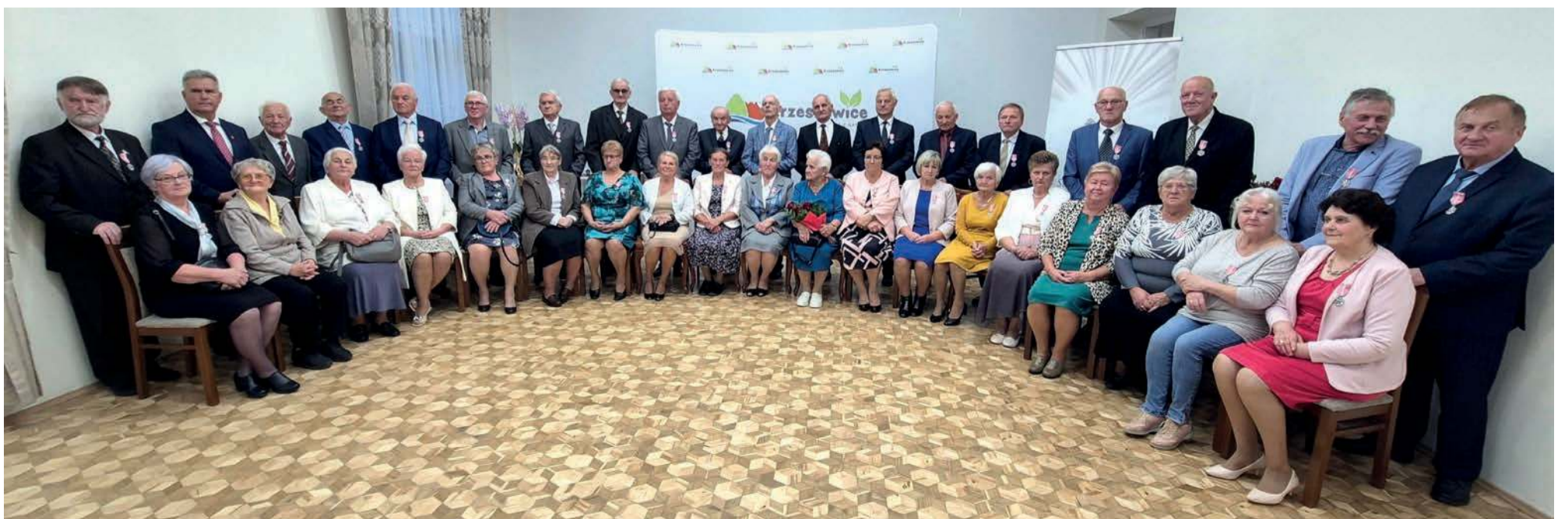
Pary obchodzące jubileusze