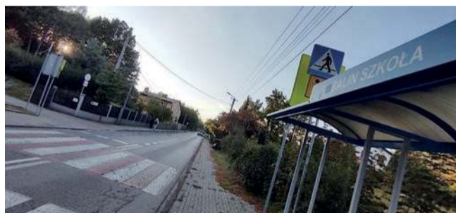
Przeście dla pieszych na Jaworznickej w Balinie, naprzeciwko szkoły

Wciąż pozostaje niezalutwany temat poprawy bezpieczeństwa na ul. Jaworznickej w Balinie.