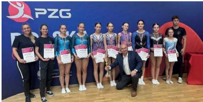
Reprezentacja UMKS-PMOS Chrześńców.

Zawodnicy UMKS-PMOS Chrześńców odnieśli znakomite sukcesy podczas Młodzieżowych Mistrzostw Polski, Mistrzostw Polski Juniorów oraz Pucharu Polski Seniorów, które odbyły się w Katowicach.