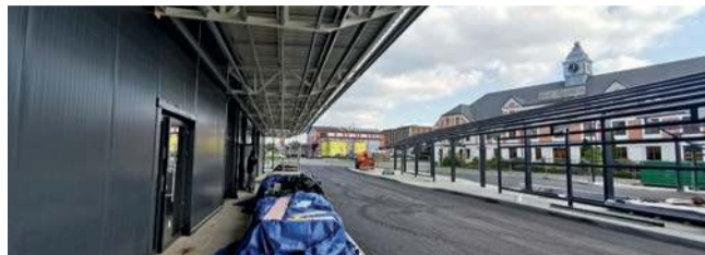
Trwa budowa centrum przesiadkowego w Trzebini

TRZEBINIA. W rejonie dworca kolejowego trwa budowa centrum przesiadkowego. Ma być gotowe już niedługo.