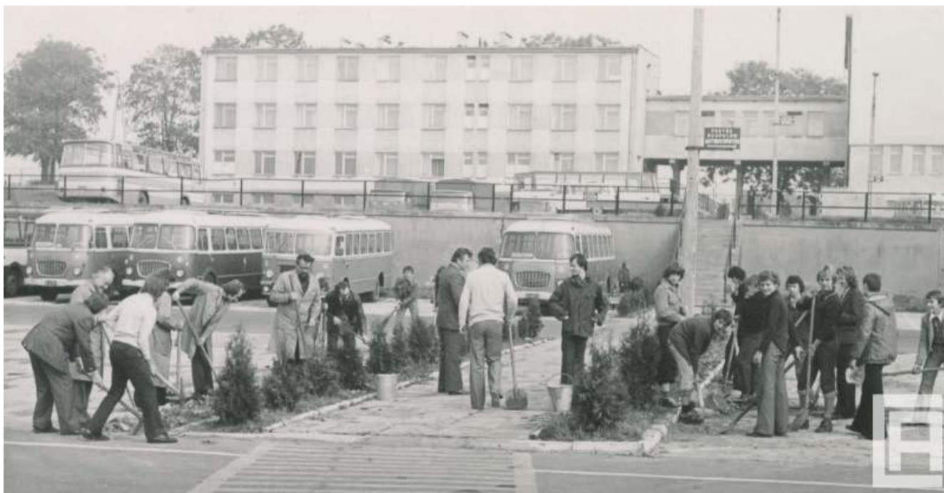
Dawna zajezdnia PKS w Chrzanowie

16 października minie 49 lat od uroczystego otwarcia zajezdni PKS przy ul. Balińskiej w Chrzanowie. Dzisiaj nie ma śladu po tych obiektach. Pozostało miejsce czekające na zagospodarowanie.