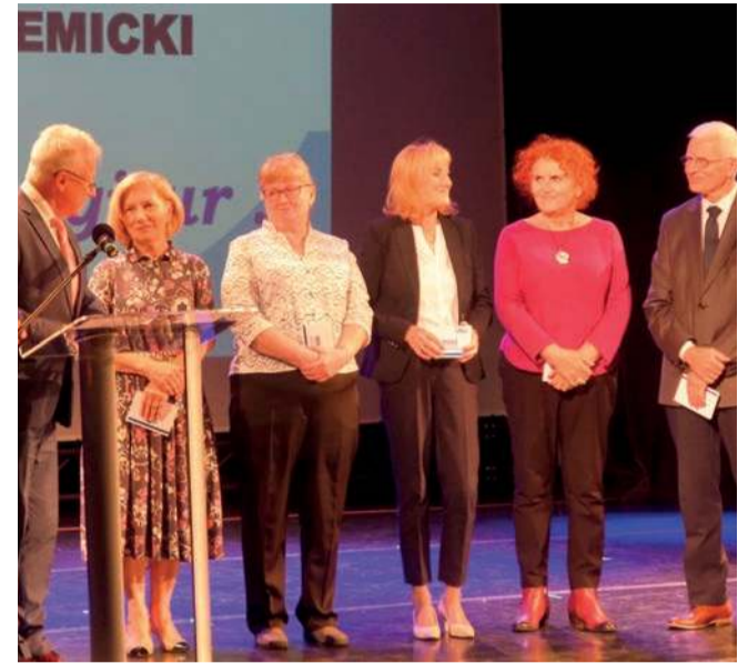
Słuchacze UTW Chrzanów podczas ślubowania

Słuchacze z Chrzanowa spotkali się na inauguracji w sali teatralnej domu kultury. Na zajęcia zapisało się w tym roku 189 osób. Nowych seniorów żądnych wiedzy jest 26 (w tym