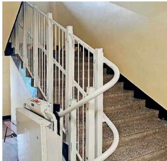
W SP nr 3 w Libiążu została zamontowana platforma schodowa

Radni z komisji oświaty i spraw społecznych libiąskiej rady miejskiej odwiedzili w poniedziałek SP nr 3. Zobaczyli prace wykonane w placówce w ostatnim czasie. Wyremontowane zostały kuchnia i stołówka szkolna. Kapitałny remont przeszły także pomieszczenia znajdujące się w piwnicy. Powstały tam pomieszczenia na sprzęt. Nowe są też drzwi do sali gimnastycznej. W poprzednim roku szkolnym remontu doczekała się mała sala gimnastyczna oraz gabinet pedagoga.