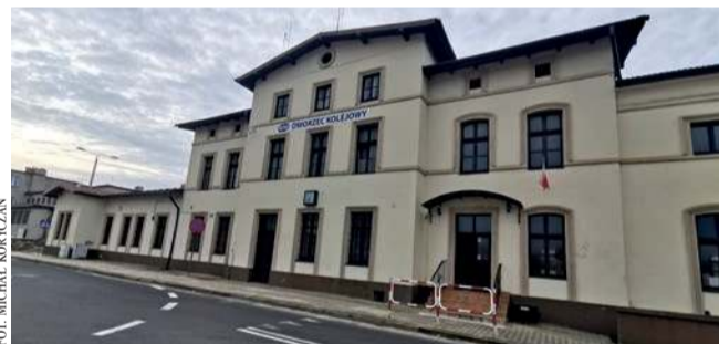
Budynek dworca kolejowego w Trzebini

Tak jak zabytkowy, XIX-wieczny budynek dworca kolejowego w Trzebini, jeden z największych w dawnej Galicji Zachodniej. Jeszcze w dru-