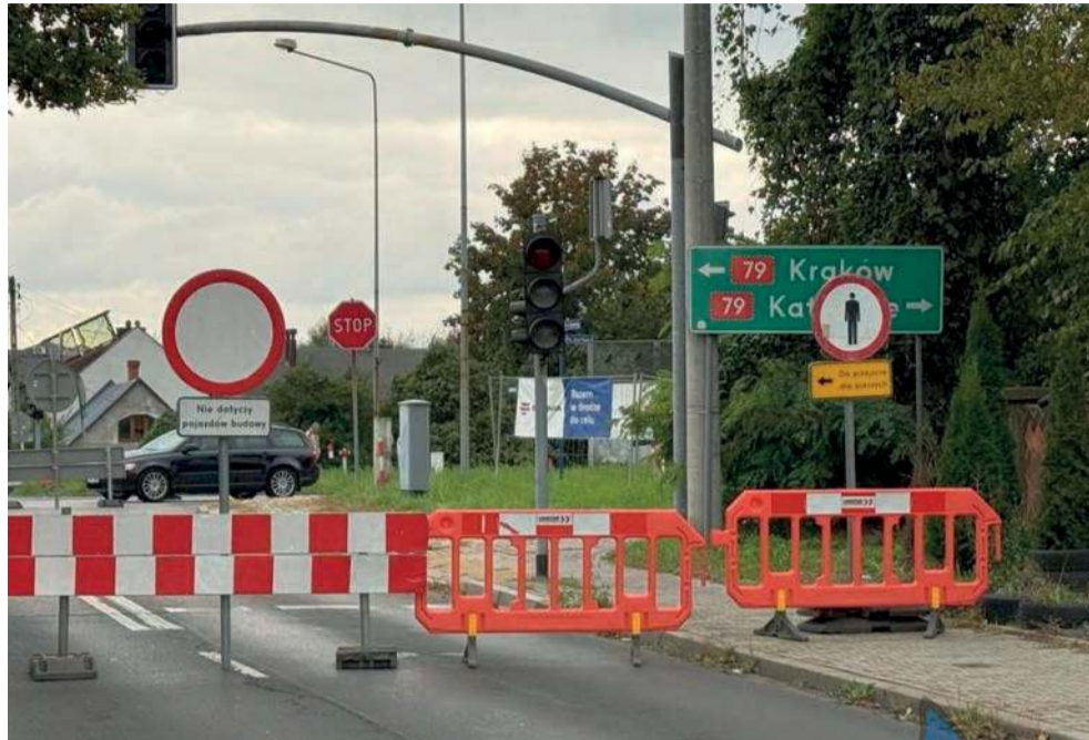
Kierowcy jadący z i do Chrzanowa przez Jaworzno muszą uważać.

Obecnie na skrzyżowaniu i w jego rejonie obowiązuje tymczasowa organizacja ruchu. Wprowadzono ruch wahadłowy sterowany przez sygnalizację świetlną. Wyłączo-