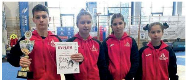
Medaliści pierwszego dnia.

Zawodnicy KS Judo Kangury osiągnęli znakomity wynik podczas XXVIII Międzynarodowego Turnieju Judo - VII Memoriale Józefa Chowańca w Zakopanem, zdobywając aż 10 medali.