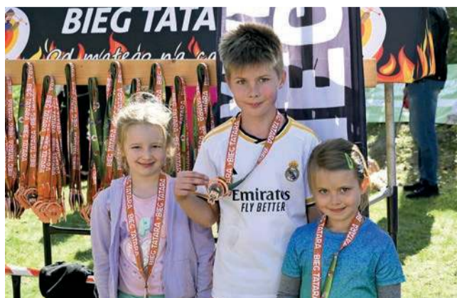
Zadoleni lokalni zawodnicy