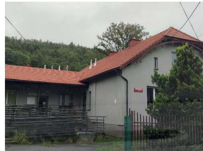
Nowy dach na ośrodku zdrowia w Regulicach

Sporo firm ubiegało się o zlecenie na remont gminnego obiektu przy alei Jana Pawła II w Regulicach, w którym mieści się biblioteka i ośrodek zdrowia. Inwestycja jest już wykonana.