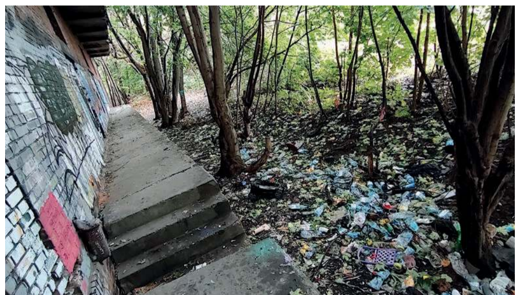
... sterty śmieci

- To jeszcze zajmie trochę czasu, bo częściowo komunalizujemy tamte działki, częściowo mamy tam współwłasność. Cały ten teren przy linii kolejowej, od Siennej do