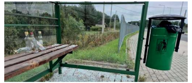
Zdewastowany przystanek w Woli Filipowskiej

Przystanek zaraz za zjazdem z wiaduktu na tzw. Białce niekiedy wykorzystują w celu spotkań towarzyskich i pijaństwa.