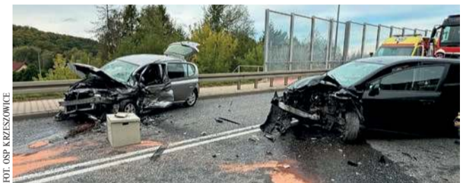
Wypadek na drodze krajowej 79 w Krzeszowicach