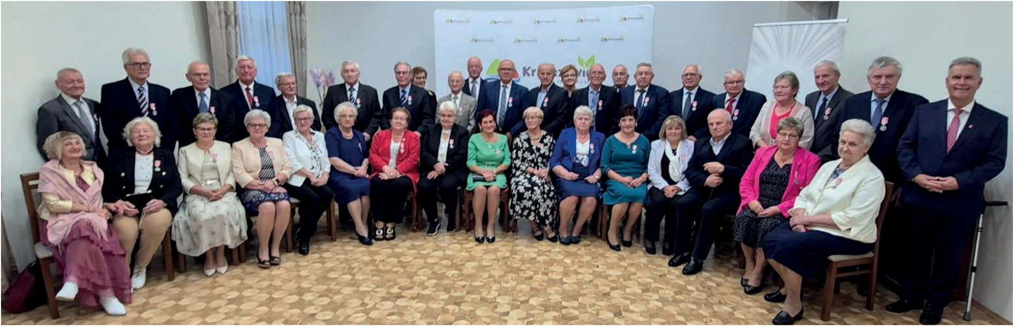
Pary obchodzące jubileusze