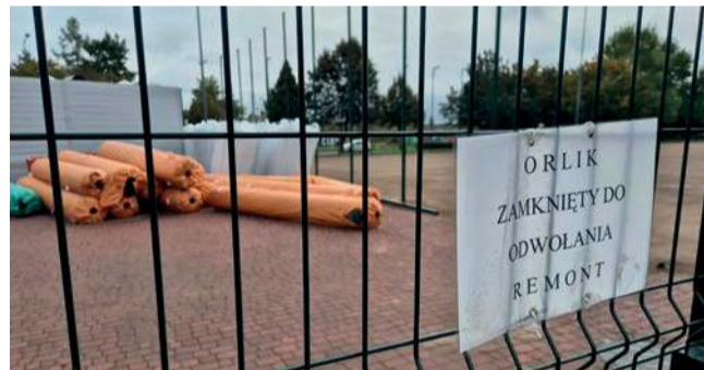
Boisko Orlik od początku wakacji jest zamknięte

w ubiegłym roku dotację 500 tysięcy złotych z Ministerstwa Sportu i Turystyki na modernizację Orlika.