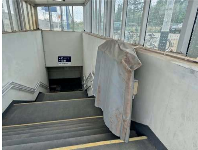
Niepełnosprawni teoretycznie mają możliwość skorzystania z przejścia podziemnego za pomocą platformy...

- Mieszkańcy zgłaszają, że rogatki mają czujniki, reagujące na dotyk. Czasem wystarczy lekko je szturchnąć i już się same zamykają w czasie, gdy auto tamtędy przejeżdża - mówi radna. - Jeden z mieszkańców poruszający się na wózku prawie co dzień ma ten