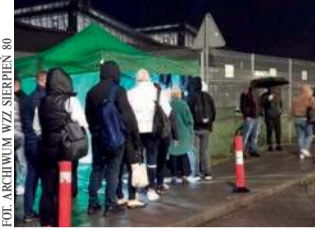
Pracownicy Valeo biorą udział w referendum strajkowym. Kolejka przed rozpoczęciem dziennej zmiany ok. godz. 5.50

Podkreśla, że celem związkowców nie jest strajk, ale wy-