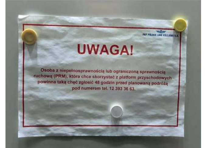
...ale muszą dwa dni wcześniej powiadomić o tym obsłudze. Informacja o tym znajduje się w podziemiach

chomienie szybkich pociągów i likwidacja części przejazdów kolejowych. I to się udało. Co więcej, wkrótce zacznie się budowa nowego wiaduktu w rejonie sąsiadującej z Wolą Filipowską ul. Zielonej w Krzeszowicach. To sprawi, że przejazd na ul. Kolejowej przechodzącej za torami w Młyńską będzie całkiem zlikwidowany. Na razie to przyszłość, ale plany powo-