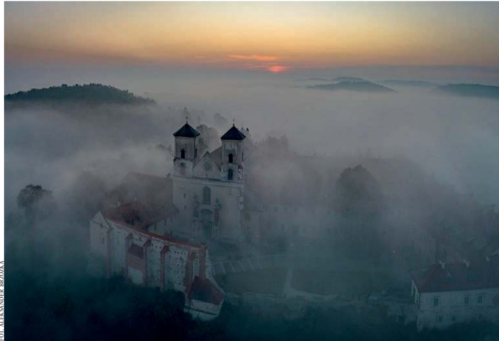
Opactwo benedyktynów w Tyńcu