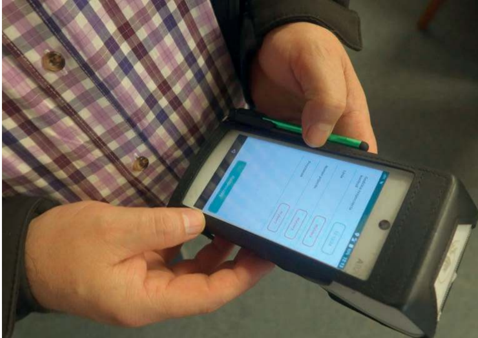
Kontrolerzy pracujący w ZKKM-ie używają w autobusach takich terminali

Do 2013 roku Związek Komunalny „Komunikacja Międzygminna” w Chrzanowie zlecał kontrole zewnętrznej firmie. Od dwunastu lat sam się tym zajmuje. Zatrudnia na umowę zlecenie siedmiu kontrolerów. Część wynagrodzenia mają za przeprowadzone kontrole. Dostają także prowizję od mandatów, które udaje się wyegzekwować.