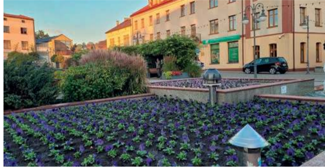
Jesienne bratki na rynku w Trzebini

Osiem firm zgłosiło się do przetargu na utrzymanie zieleni miejskiej w Trzebini. Chodzi o 7 sektorów obejmujących nie tylko koszenie trawników, przycinanie krzewów i nasadzenia, ale także opróżnianie koszy i zimowe utrzymanie chodników w obrębie terenów zielonych.