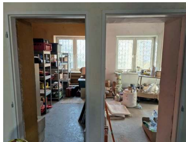
W hufcu są jeszcze pomieszczenia czekające na remont

- Kochani! To się wydarzyło! Mamy to! Mamy 100 procent celu! Mamy 100 000 PLN! Dziękuję w imieniu zuchów, harcerzy, instruktorów. Nasza wdzięczność jest ogromna, za każdy gest wsparcia, za fanty, za licytacje, za wpłaty te anoni-