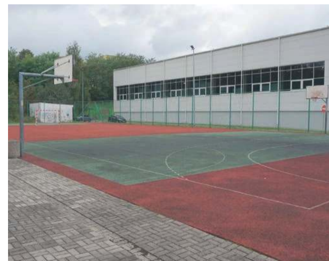
Tak wygląda obecnie boisko za libiąską halą

Powiat chrzanowski planuje kolejną inwestycję w obiekty sportowe. Tym razem powstanie w pobliżu Zespołu Szkół w Libiążu.