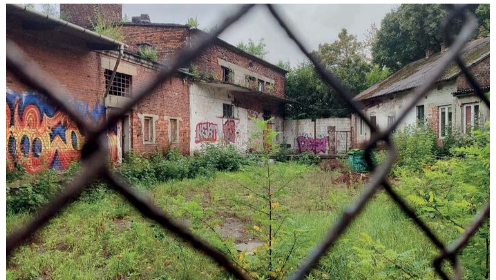
Pustostany w sąsiedztwie ul. Stara Huta w Chrzanowie i...

Gminne parkingi mają też powstać po drugiej stronie linii kolejowej, wraz z przebudową ul. Stara Huta, od ul. Siennej w kierunku dworca i przedszkola.