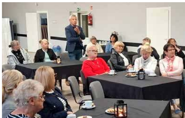
Uczestnicy spotkania zadali autorowi sporo pytań

Po prelekcji przyszedł czas na pytania od uczestników spotkania, dzięki czemu rozwinęła się dyskusja m.in. nad tym, jak przekazywać wiedzę historyczną młodzieży, czy jak patrzeć na obecną sytuację wewnętrzną w kraju oraz