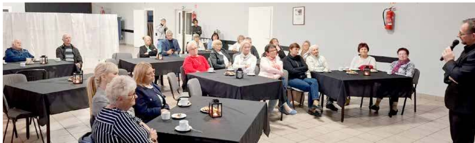
Historia to nie tylko zapis minionych dziejów, ale również lustro, w którym możemy spojrzeć na naszą współczesność - powiedział autor