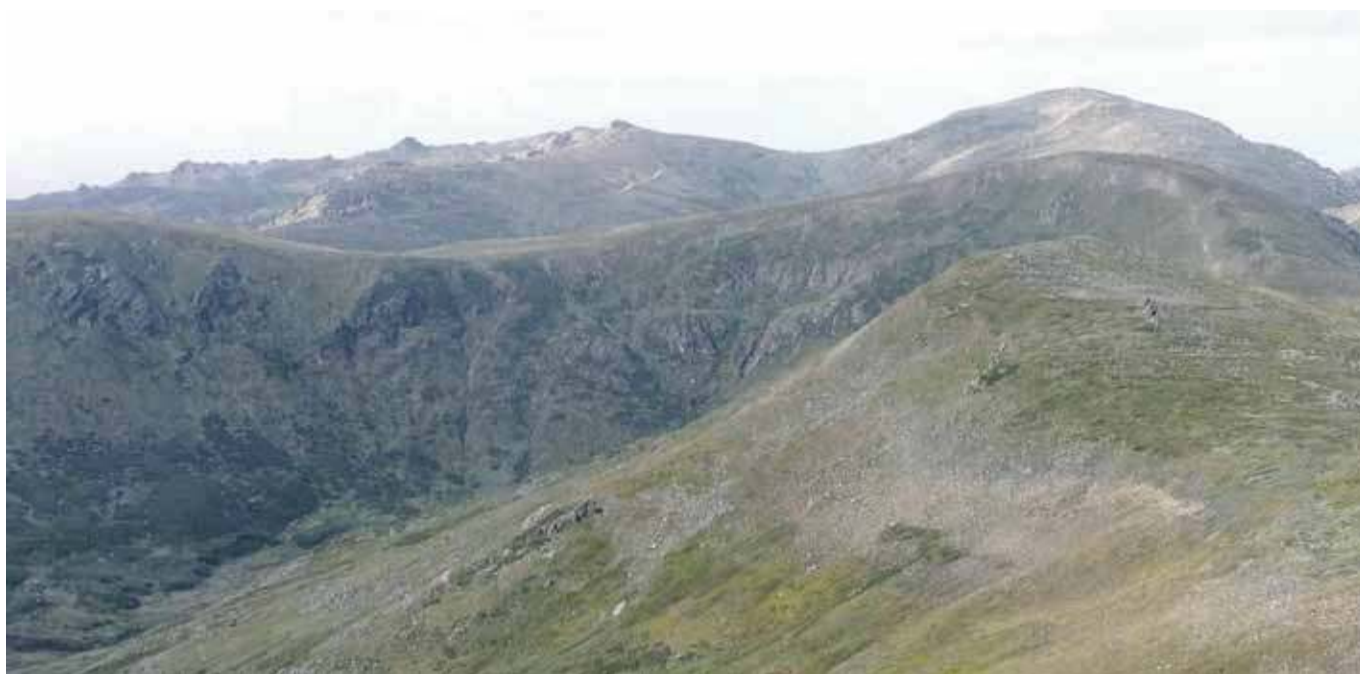
Widok na Mt Kosciuszko (w głębi, po prawej) z grani Main Range.

Bazą wypadową zostało niewielkie miasteczko Tawonga South , położone u podnóża Australijskich Alp. Stamtąd do początku szlaku przy Mountain Creek Campground jest zaledwie kilkanaście kilometrów.