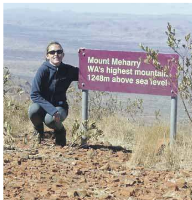
Autorka na Mount Meharry – najwyższym szczycie Australii Zachodniej

Kolejnym celem był Mount Meharry (1249 m) – najwyższy szczyt Australii Zachodniej. Choć sama góra nie jest szczególnie wymagająca, dotarcie do niej wymaga sporej determinacji. Najpierw lot do Port Hedland , potem kilkaset kilometrów jazdy przez pustynny