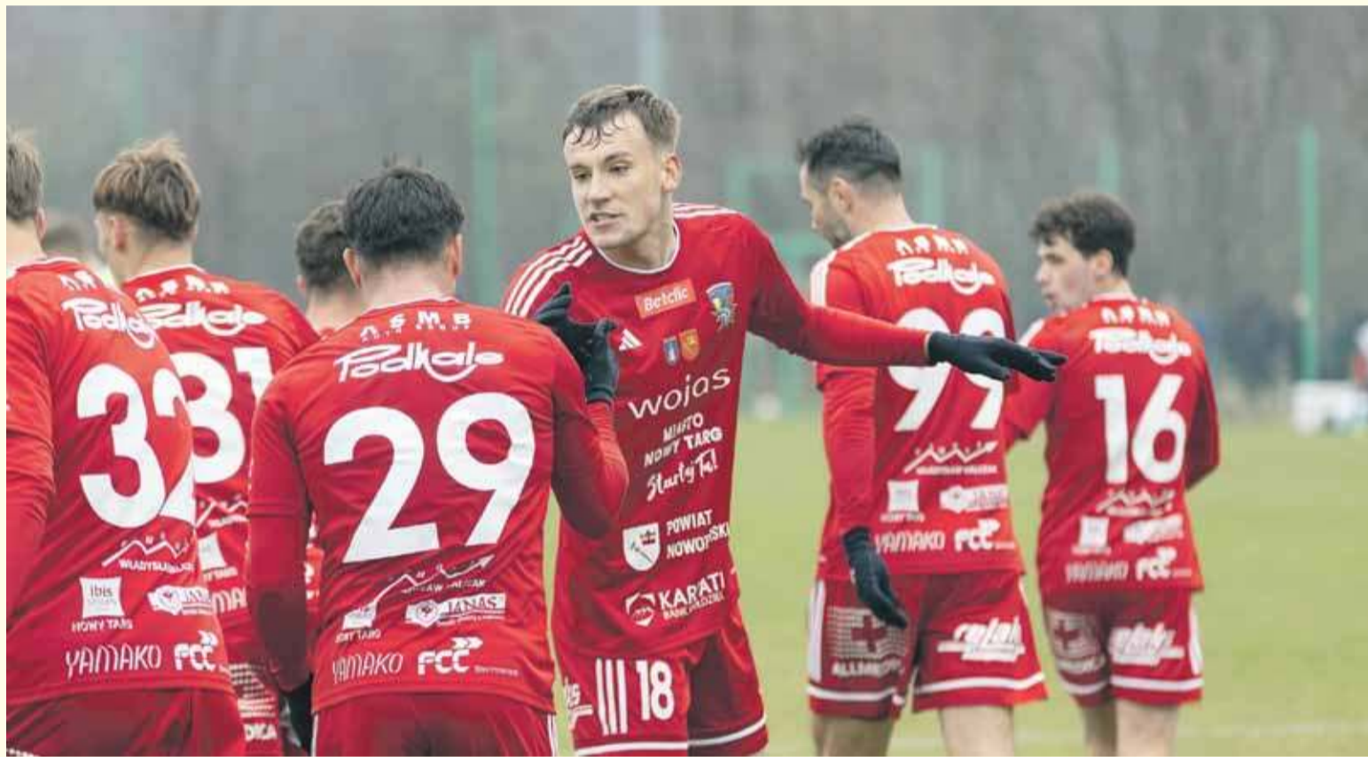
Piłkarze Podhala byli bliscy wygranej w Kaliszu.