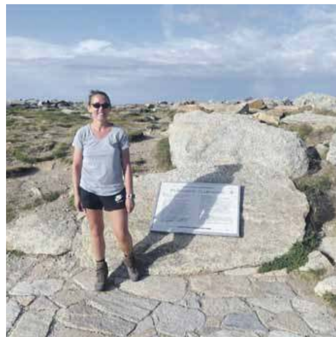
Na wierzchołku Mt Kosciuszko – najwyższym szczycie Nowej Południowej Walii i całej Australii.

krajobraz, nocleg w klasycznym outbackowym roadhouse , a następnie kolejne godziny na drogach gruntowych.