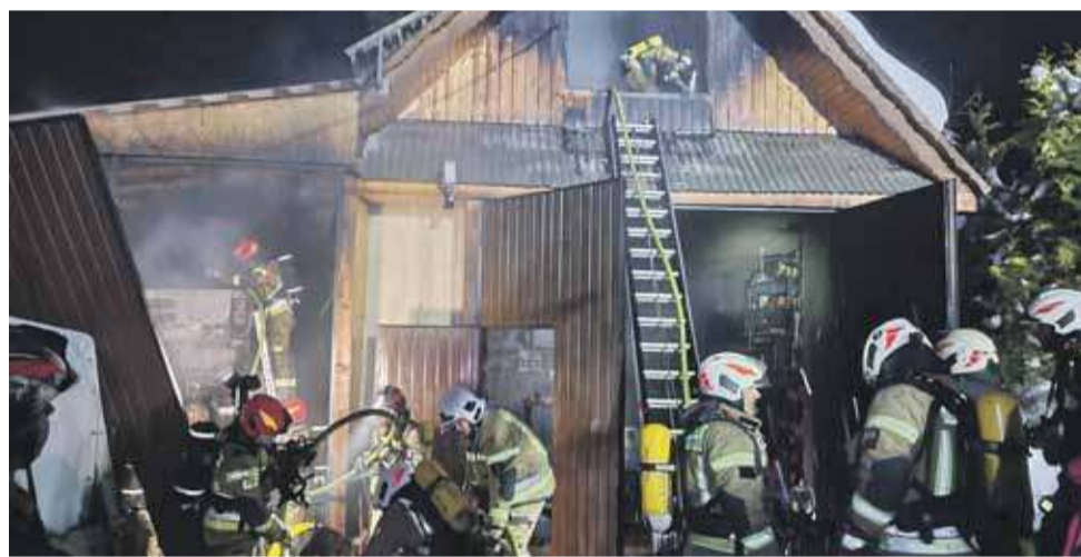
W Wielki Czwartek pożar wybuchł w warsztacie należącym do strażaka z OSP Kościelisko.