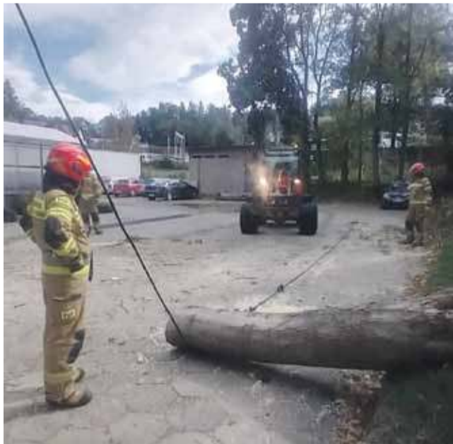
W 2024 roku halny powalił drzewo i zakończył żywot prowizorycznego kabla.