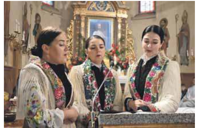
Jedla nie na koncertowej scenie, ale w prezbiterium miętusiańskiej świątyni.