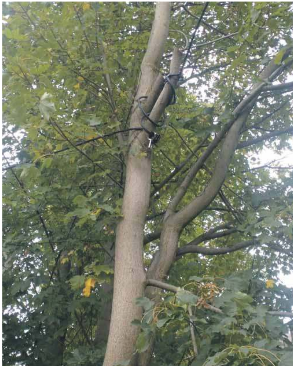
Tak wyglądała prowizorka na drzewach przy Drodze do Samków.

Jednocześnie kabel pozostawiono jako rozwiązanie rezerwowe na wypadek kolejnych awarii. W tym czasie w okolicy prowadzono bowiem kilka inwestycji, m.in. budowę ronda na skrzyżowaniu zakopianki z ul. Spyrków-