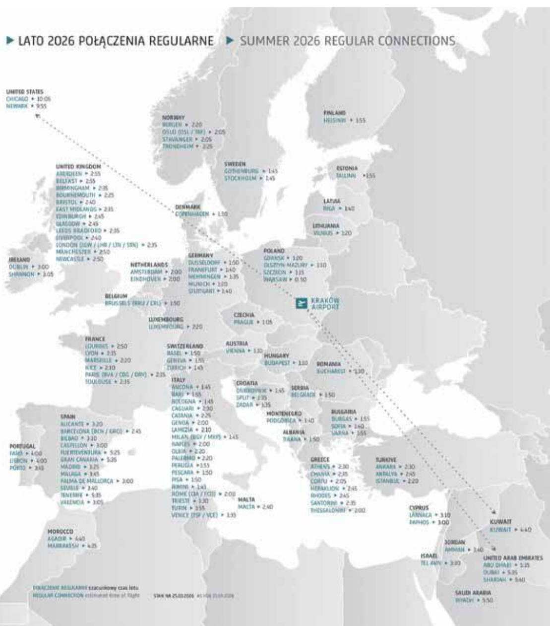
Mapka bezpośrednich połączeń z Balic zawiera aż 173 połączenia do 119 miast w 39 państwach.

szym lotniskom regionalnym, takim jak nasze, lepsze perspektywy wzrostu i współpracy z PLL LOT. Już ten rok to rekordowy wzrost oferty LOT na poziomie 44 procent. Tego lata po raz pierwszy bezpośrednio z Małopolski na pokładzie LOT-u dostaniemy się do Rzymu, Barcelony i Madrytu. Ciekawie zapowiada się też połączenie z Gdańskiem, które będzie obsługiwane siedem dni w tygodniu przez Boeinga 737 MAX. Będzie to powrót PLL LOT do bezpośredniego