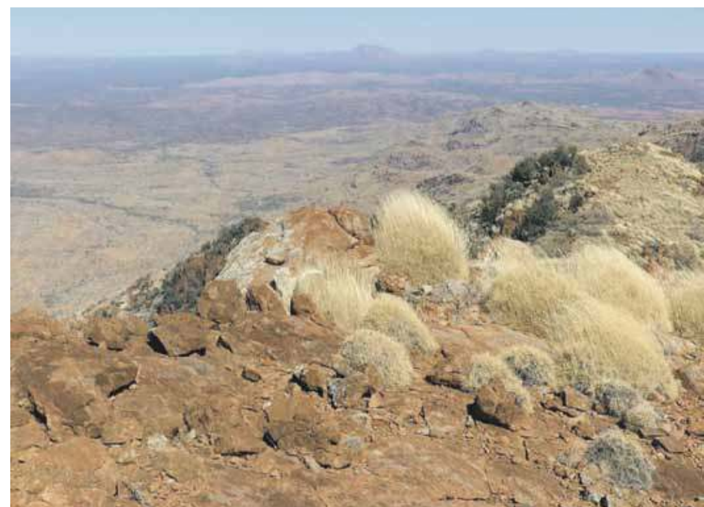
Grań szczytowa Mt Zeil, w oddali Haasts Bluff, Mt William i Mt Edward