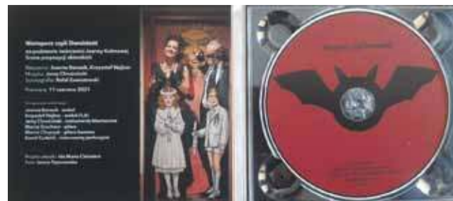
Szata graficzna wydanej niedawno płyty jest atrakcją samą w sobie

Joanna Kulmowa jest także autorką utworów scenicznych, librett operowych, cyklu psal-