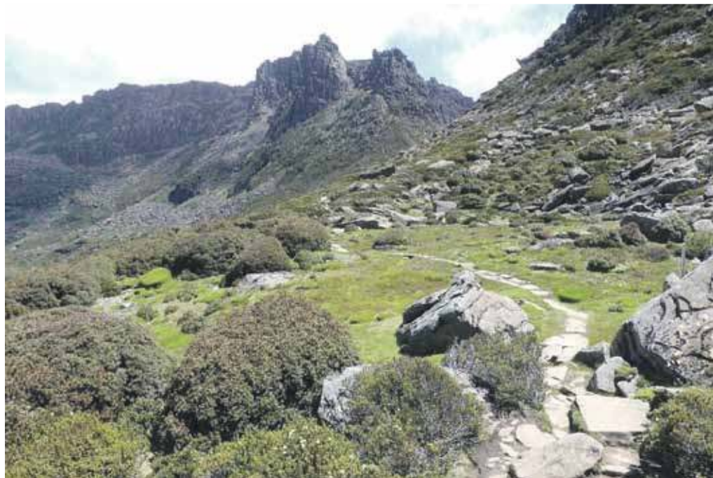
Ścieżka trawersująca Mt Doris, w głębi Mt Ossa.

Przy naszej, przyznając, raczej ograniczonej wiedzy z zakresu „serpentologii”, wyglądało to dokładnie jak eastern brown snake – jeden z najbardziej jadowitych węży świata. Co gorsza, wąż ani myślał się usuwać. Uniósł głowę i przyjął postawę, która jednoznacznie sugerowała gotowość do ataku. Cofnęliśmy się kilka kroków i zaczęliśmy robić jak najwięcej hałasu, licząc na to, że uda się go przepłoszyć. Efekt był dokładnie odwrotny. Jadowity strażnik zaparł się na ścieżce jakby miał za zadanie kontrolować bilety na wejściu. Obejście bokiem nie wchodziło w grę – gęsta roślinność skutecznie uniemożliwiała jakiegokolwiek manewry. Wycofałyśmy się więc kawałek niżej, usiadłyśmy na drugie śniadanie i... czekałyśmy.