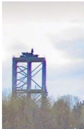
Rezydencji Putina strzeże już blisko 30 wież z systemami rakietowymi Pancyr

Wcześniej Radio Swoboda odkryło również, że ponad 20 wież z karabinami maszynowymi dużego kalibru, a także kilka platform z przeciwlotniczym kompleksem rakietowym Pancyr zostało zbudowanych na terenie i na obrzeżach specjalnej strefy ekonomicznej Ałabuga.