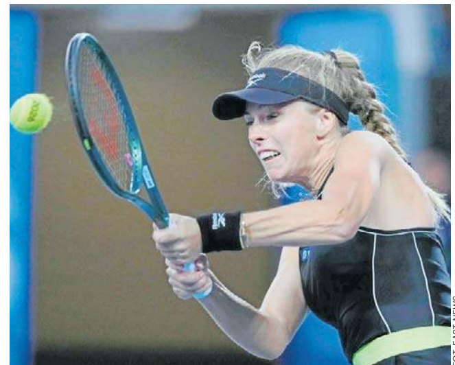
W najnowszym notowaniu światowego rankingu tenisistek Magdalena Fręch utrzymała 39. miejsce

1. runda = 13 189 dolarów; 2. runda = 18 299 dolarów; ćwierćfinał = 35 566 dolarów; półfinał = 66 939 dolarów; finalistka = 116 122 dolarów; zwycięzczyni = 188 135 dolarów.