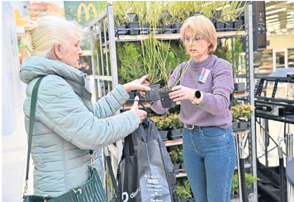
Akcja „Karma Wraca” odbyła się w sobotę w G City Biała w Białymstoku