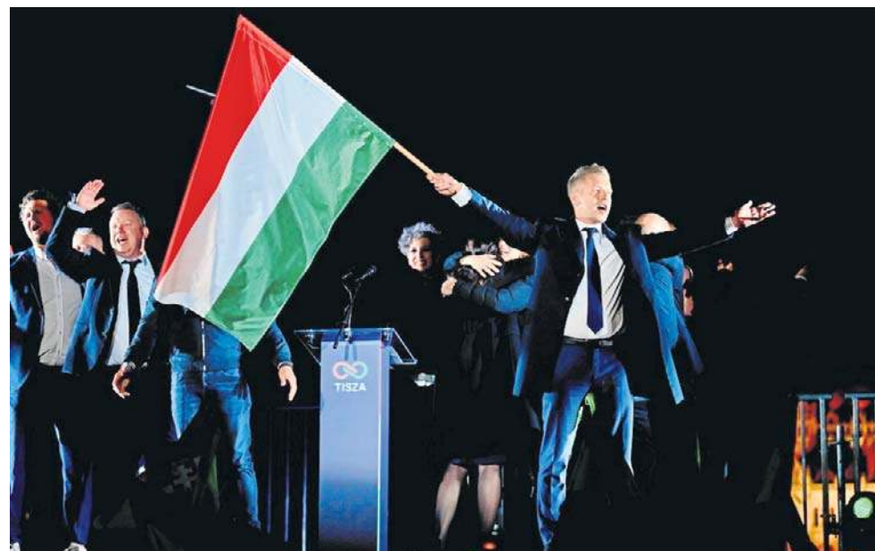
Objęcia urzędu premiera przez Petera Magyara należy oczekiwać najpóźniej w drugiej połowie maja - tak wynika z węgierskiej konstytucji i przepisów wyborczych

- Odzyskałiśmy nasze państwo, uwolniliśmy je. TISZA nie tylko wygrała, ale będzie mieć większość konstytucyjną