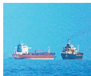
Porty nad Zatoką Perską muszą być dostępne albo dla wszystkich, albo dla nikogo

Rzecznik dodał, że porty nad Zatoką muszą być dostępne albo dla wszystkich, albo dla nikogo. Ostrzegł także,