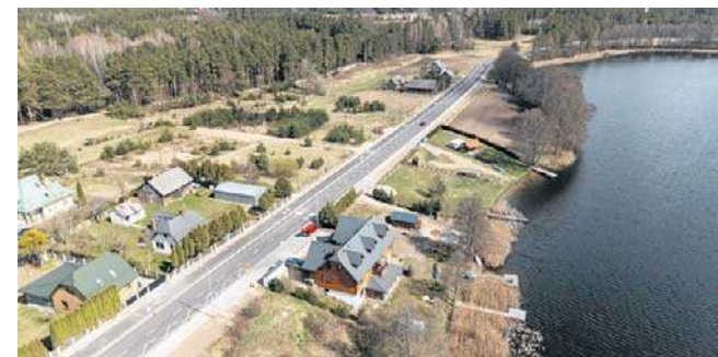
Nowa droga kosztowała niemal 20 mln zł i w całości została sfinansowana z budżetu województwa

- Jest to droga niezwykle ważna, ponieważ łączy Augustów z granicą państwa. Jestem przekonany, że ta inwestycja spowoduje, że bezpieczeństwo mieszkańców w podróżowaniu będzie jeszcze większe,