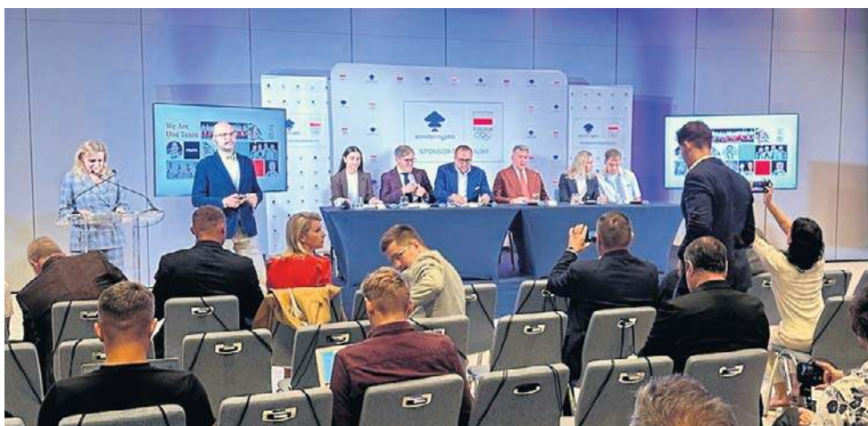
W przypadku zondacrypto wiarygodność była wzmacniana przez narrację o „polskiej giełdzie”, lokalnym graczu, który rzekomo działa bliżej standardów tradycyjnych finansów

W przypadku zondacrypto ta wiara była dodatkowo wzmacniana przez narrację o „polskiej giełdzie”, lokalnym graczu, który rzekomo działa bliżej standardów tradycyjnych finansów. Problem w tym, że rzeczywistość prawna i właścicielska tej platformy jest znacznie bardziej złożona – i znacznie mniej komfortowa z punktu widzenia użytkownika. Giełda ma formalną siedzibę w Estonii, a jej struktura właścicielska prowadzi do podmiotów zarejestrowanych w Szwajcarii. W praktyce ozna-