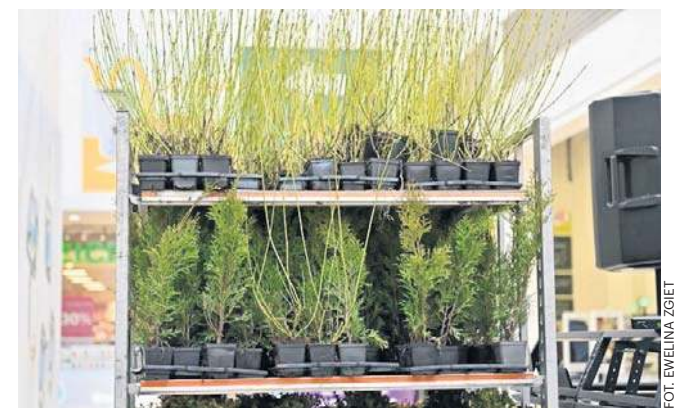
Za przekazane dary rozdawaliśmy sadzonki krzewów

wany jest również ten zabieg. Robione są też badania i testy, gdzie sprawdza się czy zwierzę nie jest nosicielem chorób zakaźnych. Dopiero po całym takim procesie zwierzę jest gotowe do adopcji.