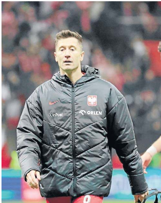
Robert Lewandowski ma wrócić po jednym meczu przerwy w lidze do wyjściowego składu FC Barcelony

Jak będzie w rewanżu? Diego Simeone najpewniej postawi - zgodnie ze swoim zwyczajem - na szczelne zabezpieczenie defensywy. Katalończycy muszą natomiast odrobić straty, jeśli marzą o awan-