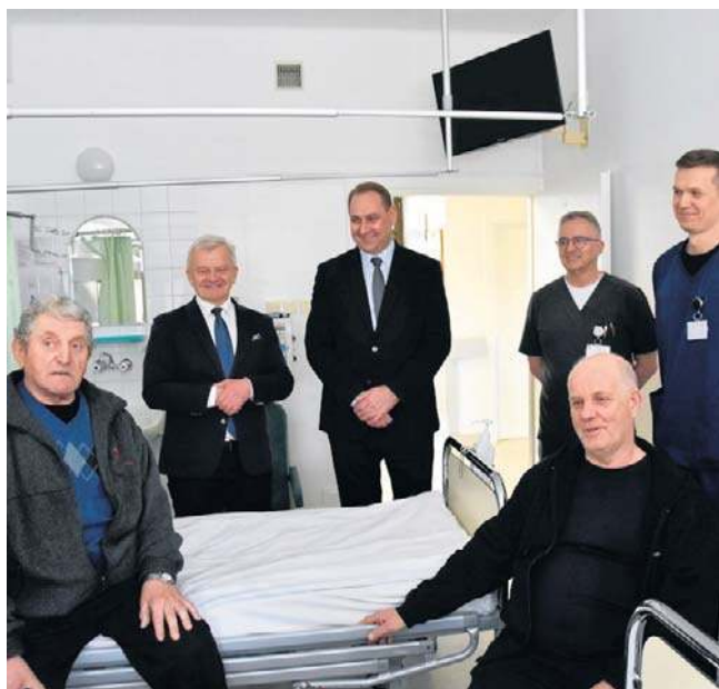
O pierwszych operacjach z wykorzystaniem robota opowiadano w piątek w łomżyńskim szpitalu

- Najtrudniejszy był chyba sam wstęp, przygotowanie. Od ćwierć wieku prowadzimy zabiegi związane z rakiem prostaty, od dobrych kilku lat laparoskopię. Obecnie przechodzimy na wyższy etap. Cały świat idzie w kierunku robotyki. Ludzie słyszą: „robotyka” i bieżą tam, gdzie ta robotyka jest. Oznaczało to dla nas od-