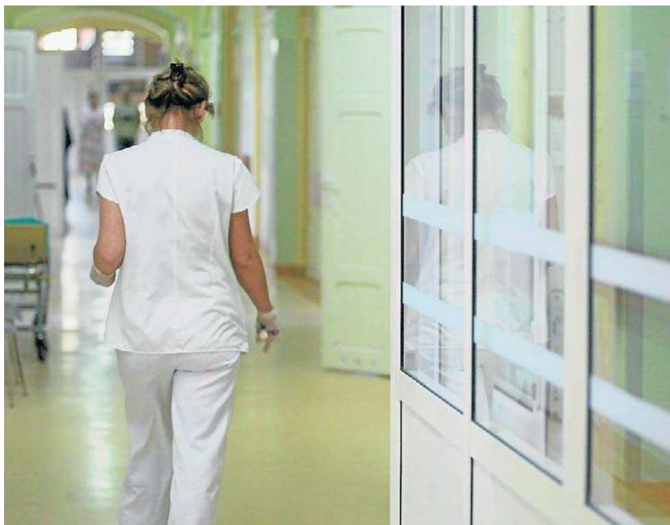
Nowe przepisy rozszerzające uprawnienia inspekcji pracy mogą zamieszać m.in. w szpitalach

- W sektorze ochrony zdrowia skutki reformy będą szczególnie odczuwalne, co wynika z unikalnej struktury zatrudnienia lekarzy oraz chronicznych niedoborów kadrowych. Reforma nie jest zmianą prawa pracy, lecz zmianą jego egzekucji. W sektorze medycznym, gdzie kontrakty są fundamentem operacyjnym, oznacza to wysokie ryzyko lokalnych turbulencji kadrowych, presji