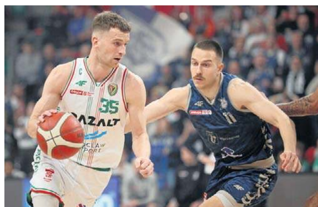
Śląsk w sobotę pożegnał się z Pekao S.A. Pucharem Polski

Druga odsłona spotkania zaczęła się obiecująco dla ekipy z Wałbrzycha. Seria 7:0 i akcja