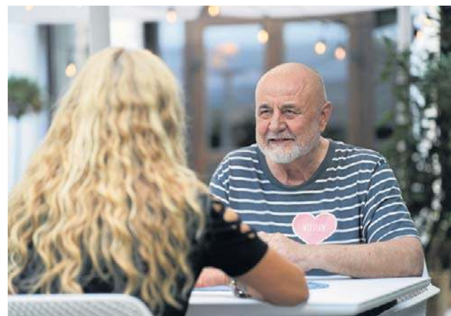
Mężczyzna jest otwarty na randki i nowe relacje. Marzy o prawdziwej, wielkiej miłości

Pracował w różnych zawodach - jako logistyk, kierowca, mechanik samochodowy i magazynier. Był trzykrotnie żonaty, ale jego związki nie przetrwały próby czasu. Bardzo młodo poszedł do wojska, co przyczyniło się do rozpadu pierwszego małżeństwa. Z tego związku ma syna. Kolejna relacja zakończyła się, kiedy dziecko pary zmarło zaraz po porodzie. Trzecie małżeństwo zawarł z desperacji i samotności.