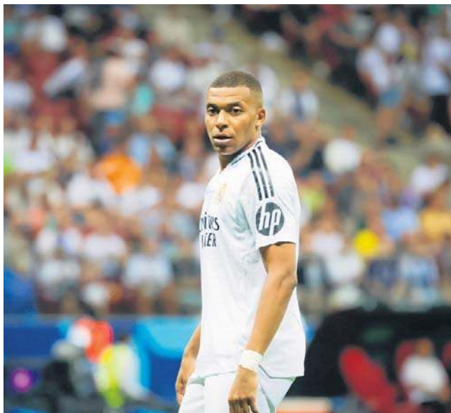
Królewscy zaraz po tym, jak wreszcie awansowali na fotel lidera La Ligi, zostali zatrzymani przez średniaka

Największym wydarzeniem tego weekendu na Półwyspie Iberyjskim była niespodziewana porażka Realu Madryt na wyjeździe u Osasuny Pampeluna. Królewscy po tym, jak wreszcie awansowali na fotel li-