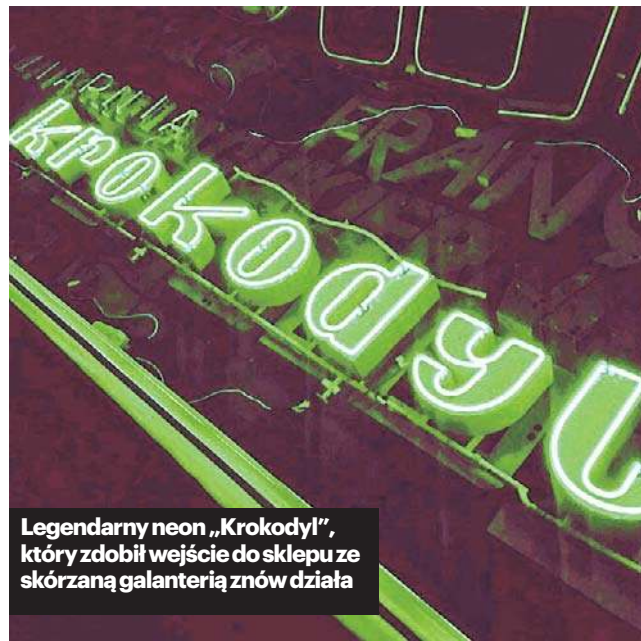
Legendarny neon „Krokodyl”, który ozdobił wejście do sklepu ze skórzaną galanterią znów działa