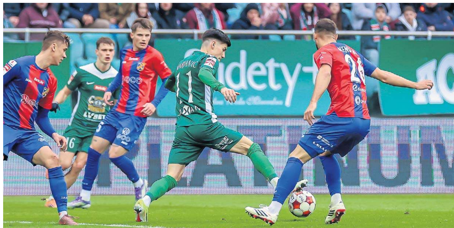
Piłkarze Śląska pokonali wczoraj na stadionie we Wrocławiu drużynę Odry Opole 3:0. Tym samym przerwali fatalną passę ośmiu meczów z rzędu bez wygranej i po raz pierwszy od wielu miesięcy zachowali czyste konto. Nasza relacja na str. 15