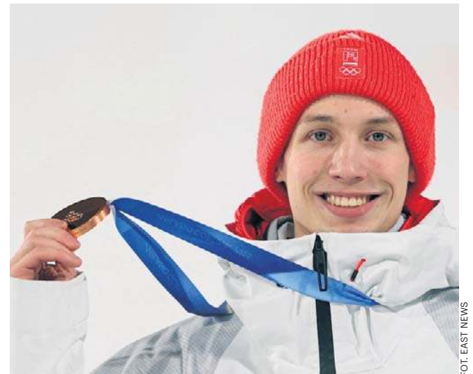
Za świetny występ olimpijski Kacper Tomasiak może liczyć na 1 980 000 złotych z tytułu nagród finansowych

To oczywiście będzie przedmiotem analizy szkoleniowców i – jak zakładam – całych związków sportowych, gdyż wnioski przydadzą się na przyszłość. O ile Tomasiak atakował nawet nie z drugiego, tylko wręcz z trzeciego szeregu, o tyle Żurek i Ziomek-Nogal byli faworytami do medali. Podobnie jak Aleksandra Król-Walas. Najwięk-