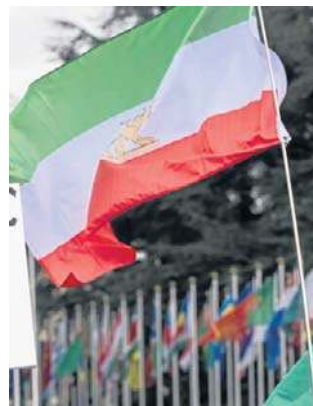
Demonstracje odbyły się na terenie kilku uczelni

Potem studenci starli się z funkcjonariuszami Basij, ochotniczej formacji paramilitarnej, która odegrała znaczącą rolę w stłumieniu poprzednich protestów politycznych. Na filmach