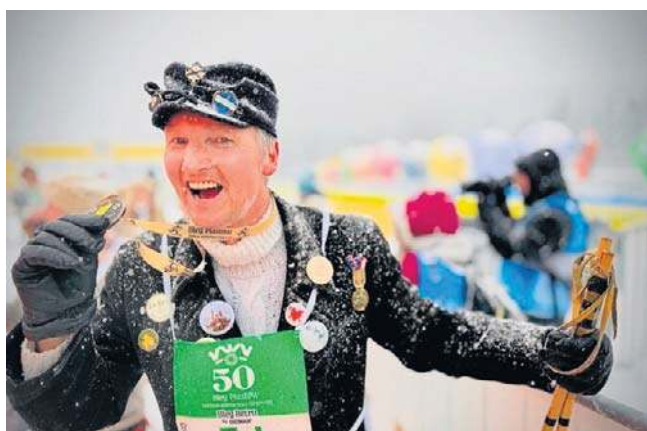
Narciarski Bieg Retro by Coconaut to był hołd dla bogatej historii Biegu Piastów. Liczyła się dobra zabawa