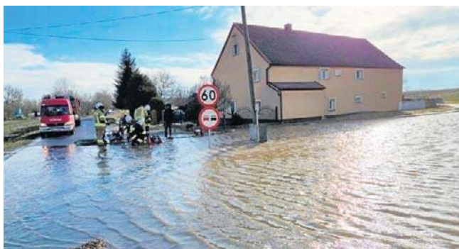
Strażacy interweniowali głównie w kilku zalewanych miejscach w gminie Zagrodno

Ogłoszony przez Instytut Meteorologii i Gospodarki Wodnej alert dotyczy następujących powiatów: lubański, lwówecki, karkonoski, kamiennogórski, wałbrzyski, kłodzki. Obowiązuje do dzisiejszego południa.