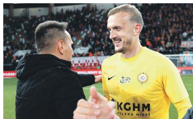
Zagłębie potrzebuje w Gdańsku Buricia z ostatniego meczu

KGHM Zagłębie Lubin stoi przed dość nieoczekiwaną szansą. Wyniki 22. serii gier w PKO Ekstraklasie ułożyły się tak, że trzy punkty mogą dać piłkarzom Leszka O-