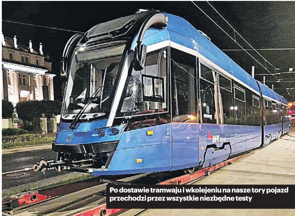
Po dostawie tramwaju i wkolejeniu na nasze tory pojazd przechodzi przez wszystkie niezbędne testy

NOCNA PODRÓŻ Z BYDGOSZCZY DO WROCŁAWIA TRWA DWA DNI Tramwaje Pesa 146N Twist powstają w zakładach Pesa Bydgoszcz. Droga stamtąd do Wrocławia trwa około dwóch dni i jest dużym wyzwaniem logistycznym. Pojazd przewożony jest na specjalnej lawecie przystosowanej do transportu ponadnormatywnego. Taki przejazd wymaga odpowiednich zezwoleń i dokładnego zaplanowania trasy. Lawetę prowadzi