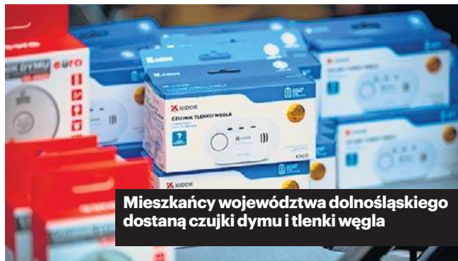
Mieszkańcy województwa dolnośląskiego dostaną czujki dymu i tlenki węgla