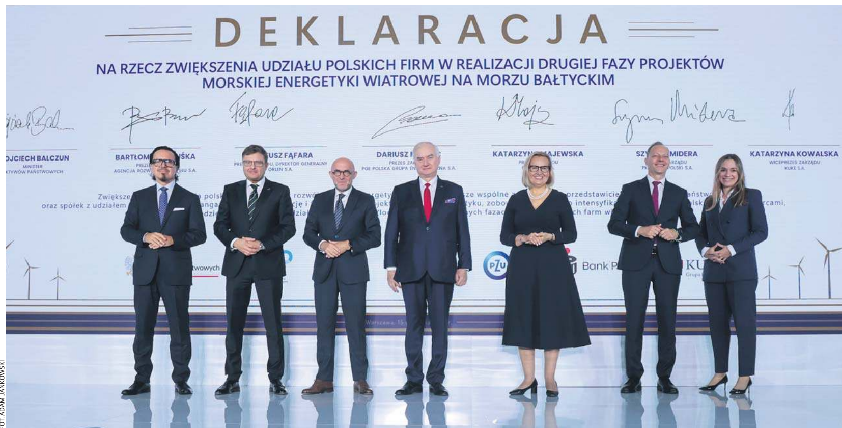
II edycja Forum „Energia z Polski”. Podpisanie deklaracji o udziale polskich firm w budowie morskich farm wiatrowych.

Wydarzenie odbywa się pod hasłem „Wind Factory of Europe” i jest adresowane szczególnie do sektora małych i średnich przedsiębiorstw (MŚP). Dzięki swojej elastyczności i innowacyjności to właśnie one mogą stać się strategicznymi