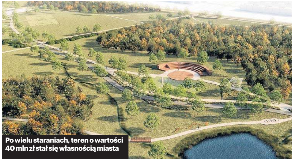
Po wielu staraniach, teren o wartości 40 mln zł stał się własnością miasta

Podpisany akt notarialny otwiera drogę do realizacji inwestycji, o której mieszkańcy Wojszyc i Jagodna słyszeli od lat. Droga do przekazania gruntów nie była prosta. Początkowo KOWR nie był zainte-