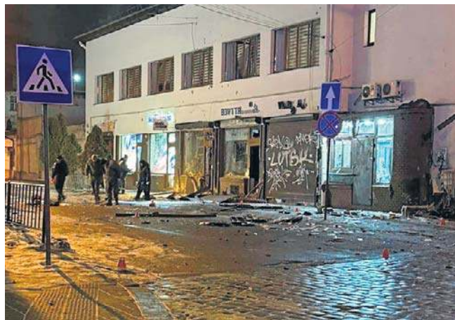
Do dwóch eksplozji doszło, gdy wezwano policję do włamania do sklepu blisko centrum Lwowa