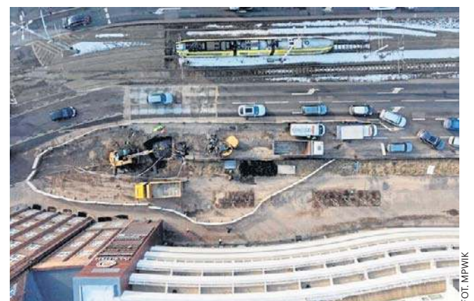
Na zdjęciu widać miejsce awarii, gdzie wymieniono kawałek wodociągu. Poniżej Kings Apartments

Dziś powinna się rozpocząć naprawa nawierzchni.