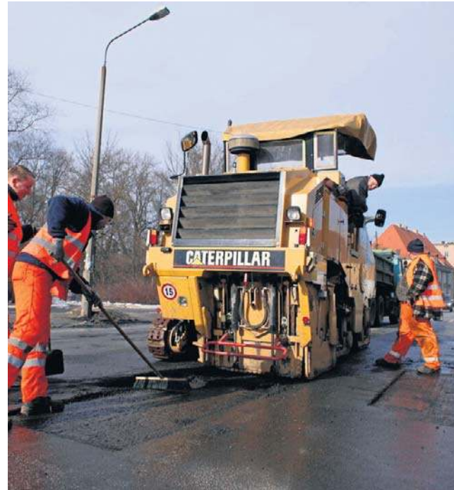
Z rządowego funduszu otrzymamy 136 mln zł

Oto kilka przykładów, jak samorządy wykorzystają miliony z rządowego funduszu.