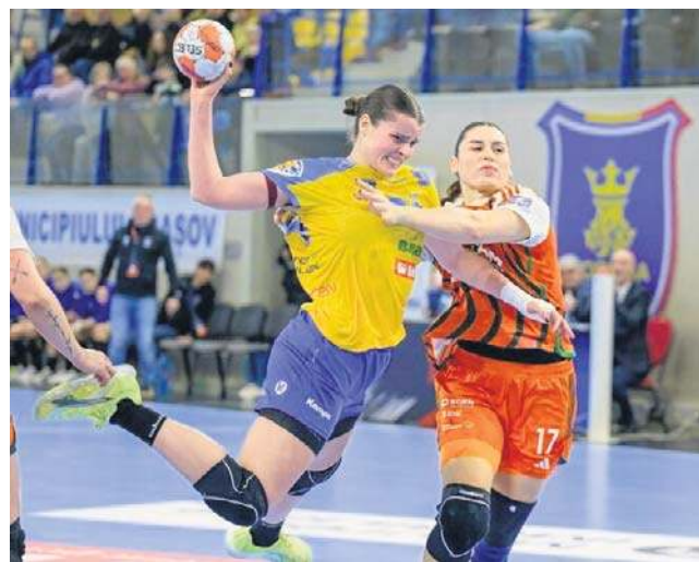
Zawodniczki Zagłębia liczyły, że w ostatnim meczu Ligi Europejskiej uda im się zanotować pierwszą wygraną