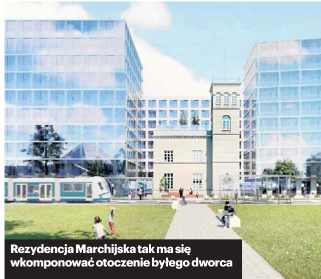
Rezydencja Marchijska tak ma się wkomponować otoczenie byłego dworca

Dworzec Marchijski obsługiwał kiedyś pociągi z zachodniego Śląska oraz do centralnych państw niemieckich. Dziś pozostała po nim jedynie wieża i fragment budynku – ale jakże cenny historycznie. Działka przy pl. Orłąt Lwowskich i ulicy Marchijskiej dzieli się na trzy części: dwie brzegowe – niezabudowane – i centralną, z pozostałością bu-