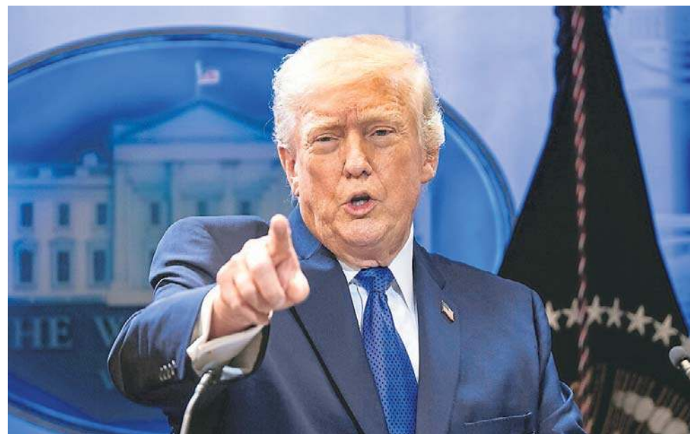
Prezydent USA Donald Trump na konferencji prasowej skrytykował decyzję Sądu Najwyższego, który unieważnił większość jego ceł

Po piątkowej decyzji Sądu Najwyższego o unieważnieniu ceł nałożonych przez prezydenta