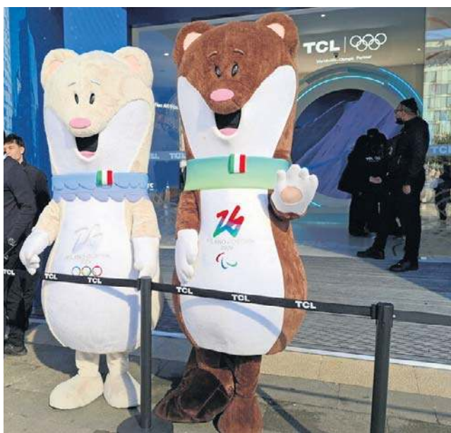
Maskotki XXV Zimowych Igrzysk Olimpijskich i XIV Zimowych Igrzysk Paralimpijskich - gronostaje Tina i Milo

- Skialpinizm miał fenomenalny start, w naprawdę niesamowitej atmosferze - wyjaśnił szef komitetu organizacyjnego.