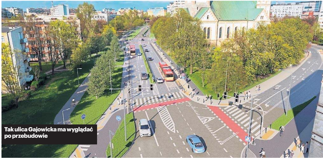
Tak ulica Gajowicka ma wyglądać po przebudowie

Linie autobusowe 124, 134 - w obu kierunkach pojadą