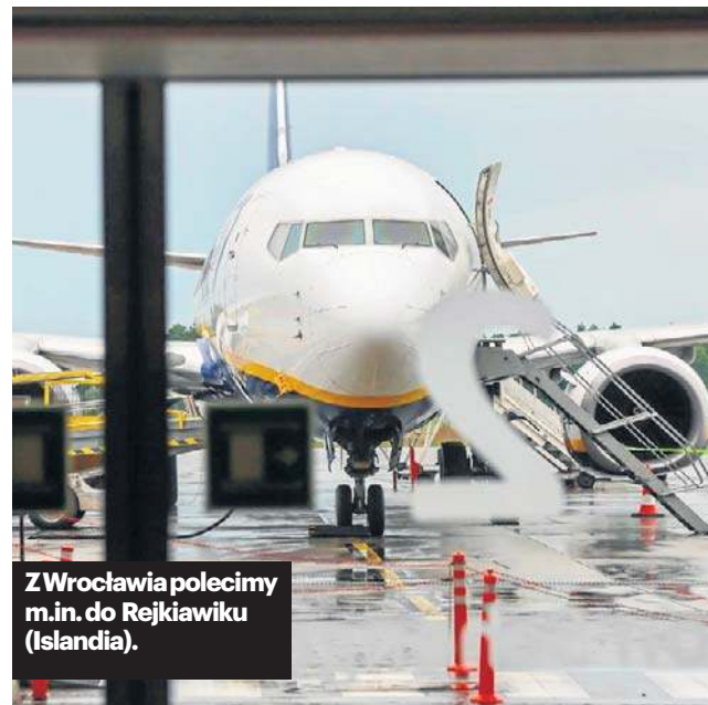
Z Wrocławia polecimy m.in. do Rejkiawiku (Islandia).

Dokładnie 316 496 pasażerów w styczniu 2026 roku zawitało na lotnisku we Wrocławiu. Torekordowy styczeń w historii działania naszego portu i wzrost o 19,9 procent w porównaniu do stycz-