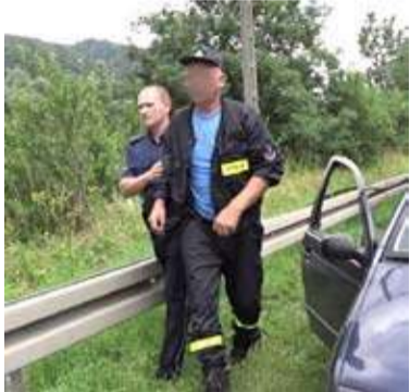
Zdjęcie przykładowe, nie przedstawia opisywanej sytuacji

Wtedy też przez długie tygodnie nadkomisarz nie mogła ustalić, kiedy to się stało, oraz że żadna policjantka nie pobiła dziecka na służbie. Teraz nie pytaliśmy, czy strażak był na służbie, bo wiemy, że nie. W sprawie policjantki zajęło nam kilka tygodni potwierdzenie informacji. Sprawa była i jest bardzo głośna. Policjantka z KPP Zawiercie jest oskarżona o pobicie i groźby karalne, w Sądzie Rejonowym w Myszkowie toczy się jej proces karny, ze względu na dobro nieletnich, wyłączony z jawności. Prokuratura Okręgowa w Katowicach z kolei prowadzi śledztwo czy policjanci z KPP Zawiercie próbowali kryć koleżankę, utrudniać dochodzenie. Są przesłuchiwanie. A