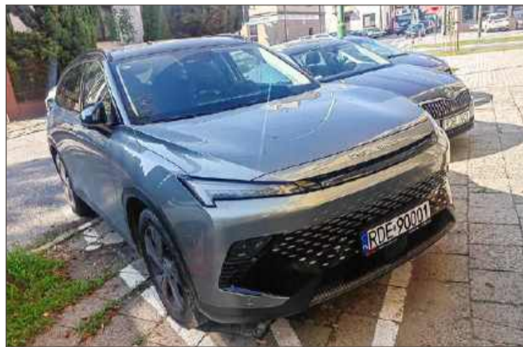
Samochód parkujący pod urzędem imponuje wyglądem.

- Myślę że zakup jest uzasadniony, jeśli samochód będzie wykorzystany również przez innych