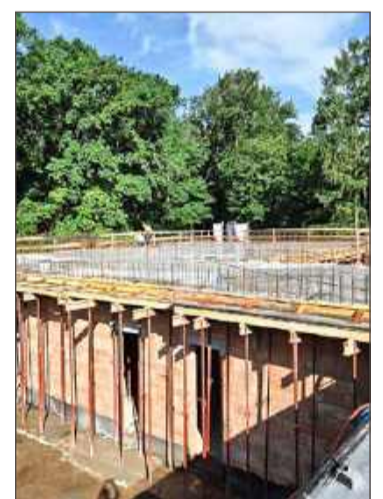
Budynek już wygląda tak.

W kolejnym etapie planowane są dalsze prace konstrukcyjne, wyko-