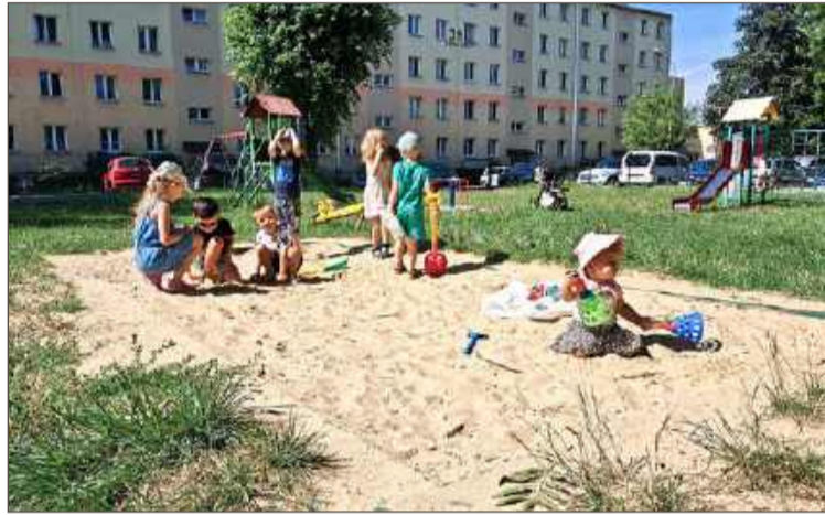
Odwiedzający plac muszą uzbroić się w cierpliwość. Remont rozpocznie się dopiero w przyszłym roku.

- Porozumienie będzie podobne do tego, które zawarliśmy z miastem w przypadku Wielopolskiej, czy Pana Tadeusza - dodaje Olszewski.