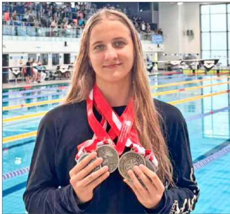
O utalentowanej zawodniczce z pewnością jeszcze usłyszymy.

W zawodach udział wzięło łącznie 475 zawodników z roczników 2007 i 2008, reprezentujących aż 131 klubów z całej Polski. Dlatego