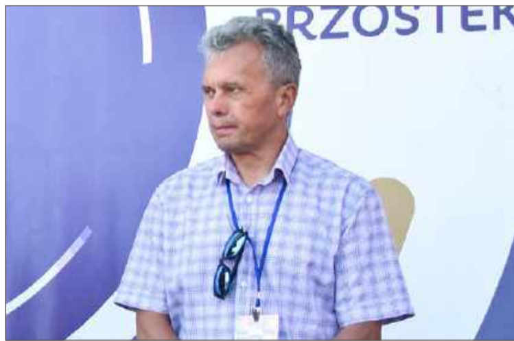
Były kierownik z Brzostku pokieruje ośrodkiem sportu w Jaśle.

Przyszły kierownik przede wszystkim musi być dyspozycyjny, gdyż jego praca wiąże się z obowiązkami w dni ustawowo wolne od pracy, jak i po godzinach. Musi mieć wykształcenie wyższe i co najmniej pięcioletni staż pracy lub przez minimum pięć lat prowadzić własną działalność gospodarczą. Wymagane jest wykształcenie wyższe, mile widziane w zakresie wychowania fizycznego, sportu, turystyki i rekreacji. Dodatkowym atutem będzie zatrudnienie w jednostkach organizacyjnych realizujących zadania w zakresie kultury fizycznej i sportu. Wymagań jest więcej, a wszystkie można znaleźć w Biuletynie Informacji Publicznej Urzędu Miejskiego w Brzostku. Nowy kierownik funkcję obejmie najprawdopodobniej 1 września.