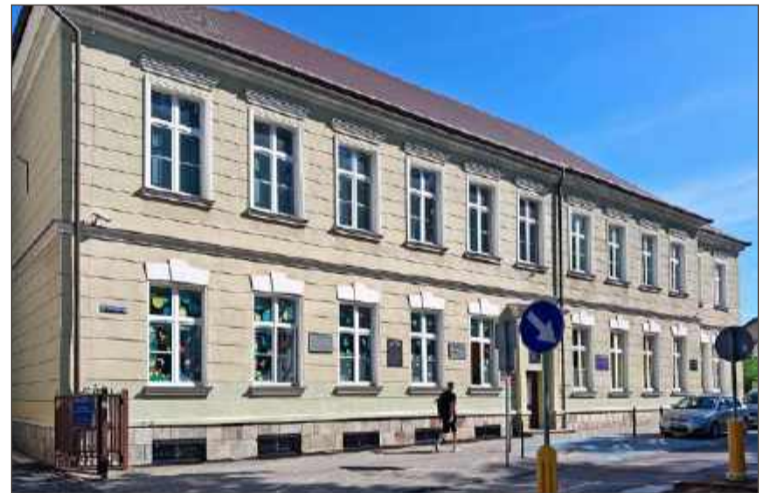
W dawnym Miejskim Gimnazjum nr 1 siedzibę znajdują różne organizacje.