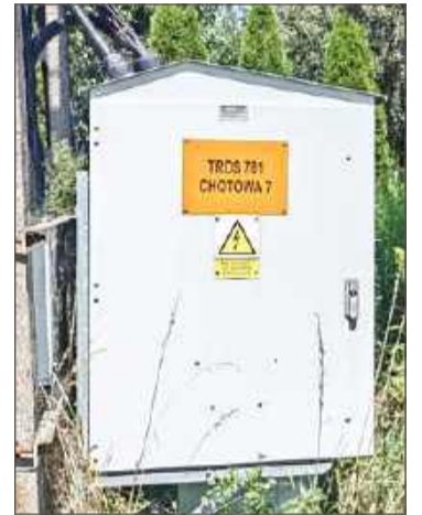
Agregaty się przydadzą, kiedy zabraknie prądu.

Kolejnym zakupem będą dwa agregaty prądotwórcze o dużej mocy. Ich zastosowanie jest szerokie, w sytuacji nieplanowanych