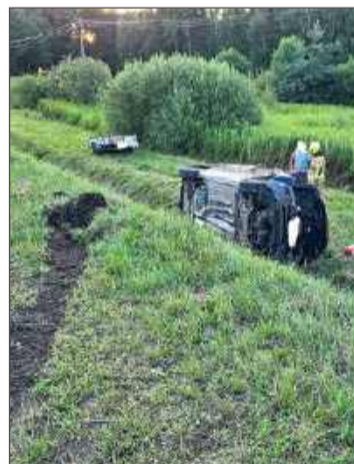
Na miejscu pracowali strażacy.