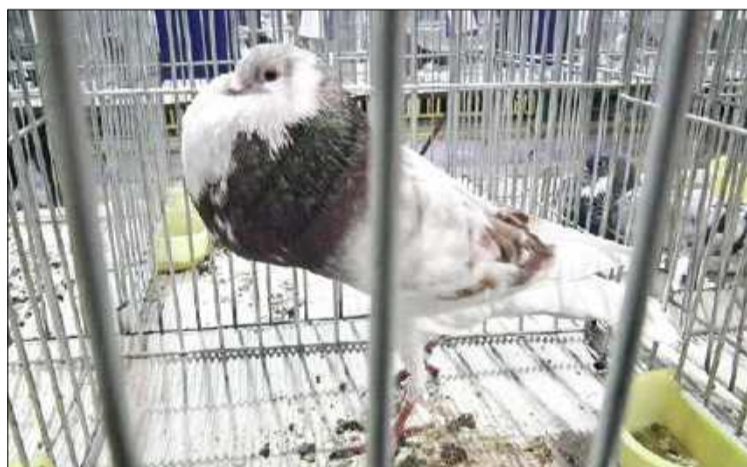
Najważniejsza jest klata!