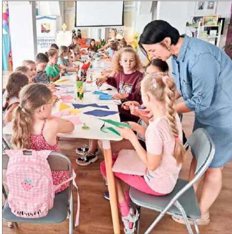
W zeszłym roku dzieciaki też świetnie się bawiły w bibliotece.

Ci, którym nie uda się zapisać na zajęcia, bo liczba miejsc jest ograniczona, jeszcze w sierpniu mogą wziąć udział w Wakacyjnych za-