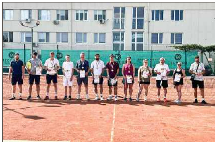
Zawodnicy na kortach dawali z siebie wszystko.

W weekend 19 i 20 lipca na kortach im. Grzegorza Matyfiego rozegrany został Polsaros Cup.