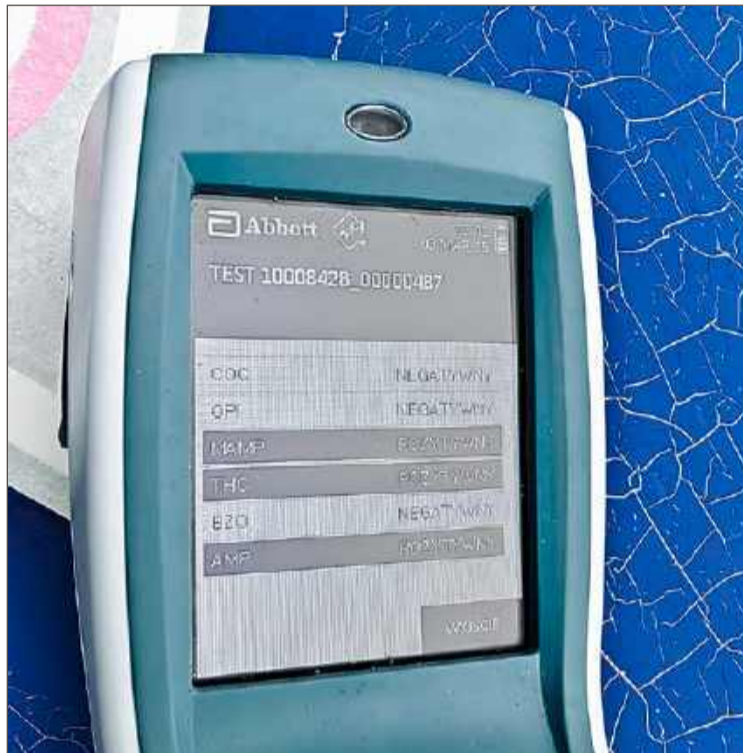
Kierowca znajdował się pod wpływem środków odurzających.

- Więc przebadali 32-latkę narkotestem i w tym przypadku wynik