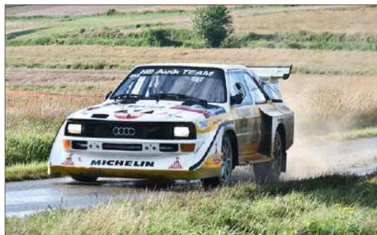
Długość odcinka specjalnego Brzostek wynosić będzie 17,5 km.