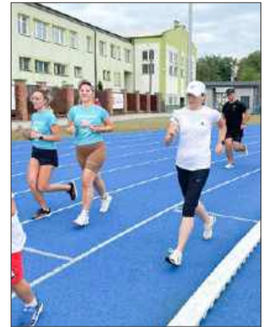
W zeszłym roku taki bieg odbywał się na stadionie lekkoatletycznym.