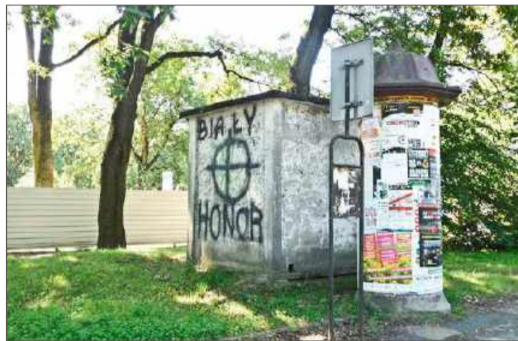
Takie symbole pojawiały się już na murach w latach dziewięćdziesiątych.

Twierdzi, że od jakiegoś czasu zaczął bacznie przyglądać się temu co ludzie, przede wszystkim młodzi, wypisują w internecie. Stąd wie, że na pikietach antyimi-