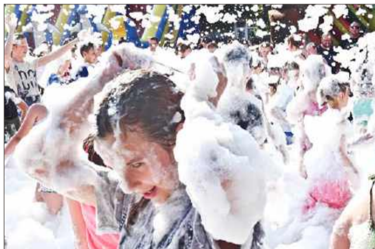
Imprezę na pilźnieńskim Rynku zakończy Piana Party.

– Dzieciaki! Pokażcie co potraficie – zaprosicie przyjaciół i rodzinę, bawcie się formą, kolorami, pomysłami i wygrajcie szansę na świetne nagrody, fantastyczną zabawę i... potężną dawkę pianowej radości! – namawiają.