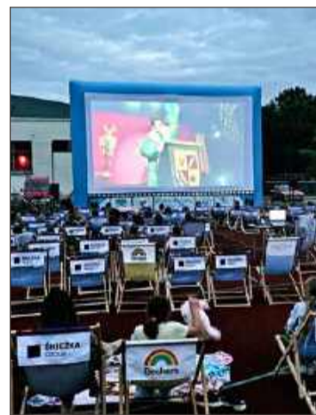
W Pustkowie-Osiedlu projekcje odbywają się na boisku.

Wszystkim sierpniowym projekcjom towarzyszyć będą konkursy partnera strategicznego Kina Letniego – firmy Śnieżka.