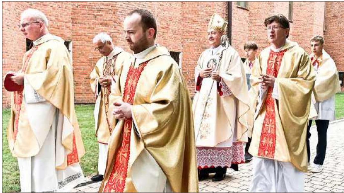
Wprowadzenie metropolity tarnowskiego do kościoła w Korzeniowie.

Ale, jak zauważył, kierunek porzucający Boga, zaczyna odchodzić