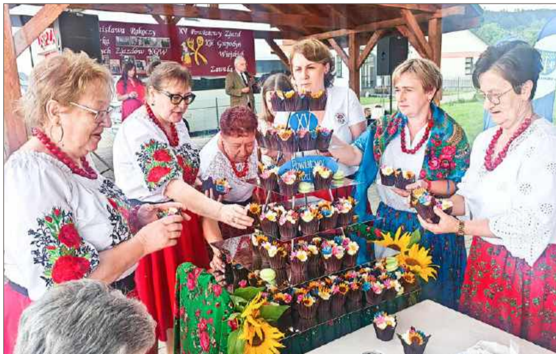
Każdy chciał skosztować smakowitych babeczek z jubileuszowego tortu.