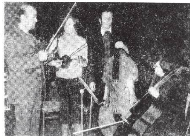
Głos z 18 czerwca 1978 r.

Na stałe związała się Filharmonia Górnicza z Oświęcimiem, dając tam regularnie co miesiąc koncerty dla