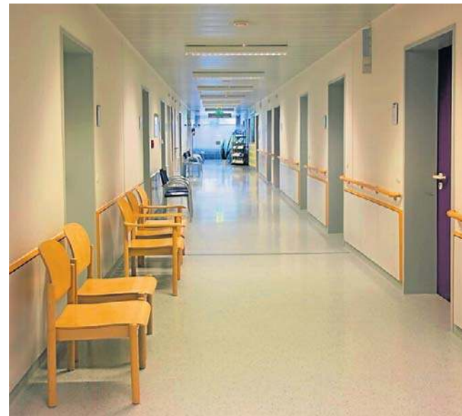
Niepojawienie się pacjenta na umówionej wizycie to zmora wielu placówek medycznych

Według ekspertów automatyzacja komunikacji z pacjentami może w najbliższych latach odgrywać coraz większą rolę w organizacji pracy placówek medycznych, zwłaszcza w warunkach rosnących kosztów i niedoboru personelu administracyjnego.