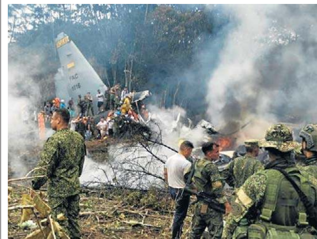
Do katastrofy doszło wkrótce po starcie samolotu z lotniska w Puerto Leguizamo

Prezydent Kolumbii Gustavo Petro na platformie X obwinił za katastrofę biurokratyczne przeszkody opóźniające modernizację armii. Pierwsze amerykańskie samoloty Hercules C-130 zostały wyprodukowane w latach 50. XX wieku, a Kolumbia nabyła te maszyny pod koniec lat 60. Niedawno zmodernizowano niektóre starsze C-130, zastępując je nowszymi modelami, sprowadzonymi ze Stanów Zjednoczonych na mocy ustawy zezwalającej na transfer używanego lub nadwyżkowego sprzętu wojskowego. PAP