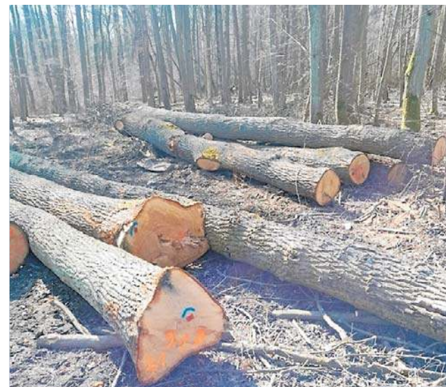
Nadleśnictwo wyjaśnia, że trwa okres odnowień i m. in. na tej powierzchni zostaną posadzone nowe drzewa

- Na podstawie przekazanych fotografii, w tym głównie znacznika drewna informuje,