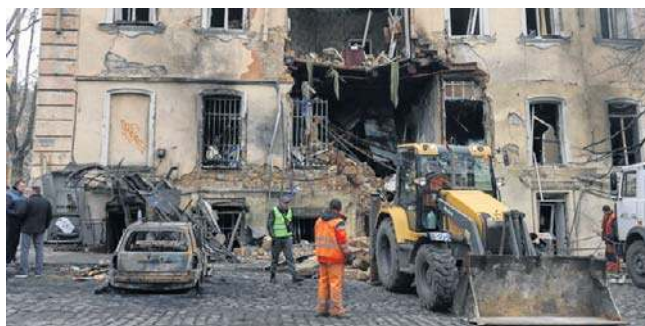
W nocy z poniedziałku na wtorek armia rosyjska użyła w atakach 34 rakiet i 392 dronów

Wojska rosyjskie zaatakowały w nocy z poniedziałku na wtorek Ukrainę w obwodach charkowskim, połtawskim, chersońskim i zaporoskim. Zginęło łącznie co najmniej pięć osób, a ponad 20 zostało rannych.