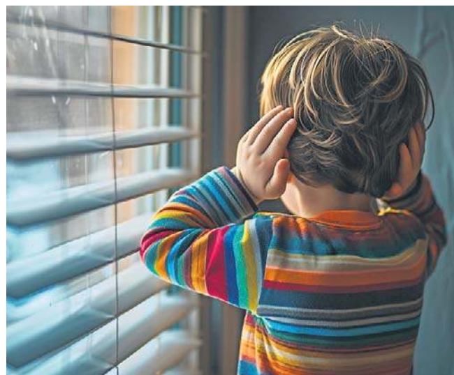
Hałas występujący w naszym środowisku działa niczym smog. Otacza nas z każdej strony

To, że śpimy, nie oznacza, że mózg przestaje odbierać bodźce. Hałas może zaburzać fazy snu - skracać je albo powodować mikroprzebudzenia. Człowiek może się rano czuć zmęczony, choć nie wie dlaczego. A brak dobrej jakości snu jest z kolei powiązany z wieloma problemami zdrowotnymi: od zaburzeń koncentracji po depresję.