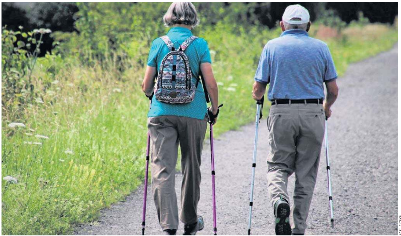
„Na własną rękę” można, a nawet powinno się dbać o utrzymanie odpowiedniej masy ciała. W zapobieganiu ograniczenia ruchomości stawów pomoże też aktywność fizyczna. Spacer, jazda na rowerze, pływanie

Ingrid Hintz-Nowosad ingrid.hintz@polskapress.pl