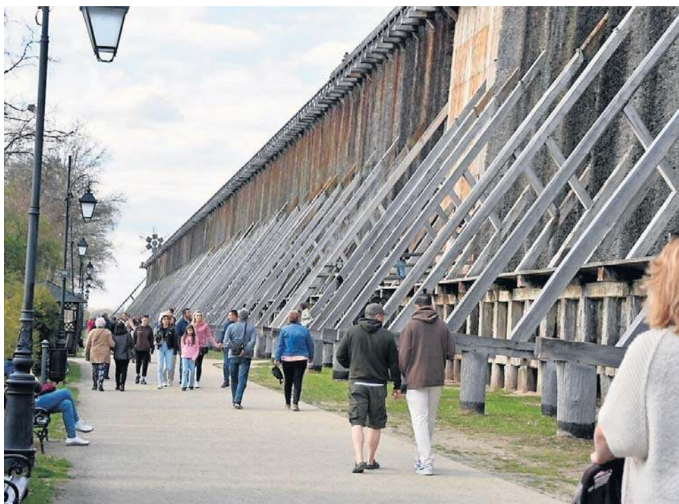
Kuracjusze często rezygnują z wymarzonego pobytu w sanatorium

- Bo wysyłają z jednego końca Polski na drugi, a przecież to są seniorzy i nie zawsze