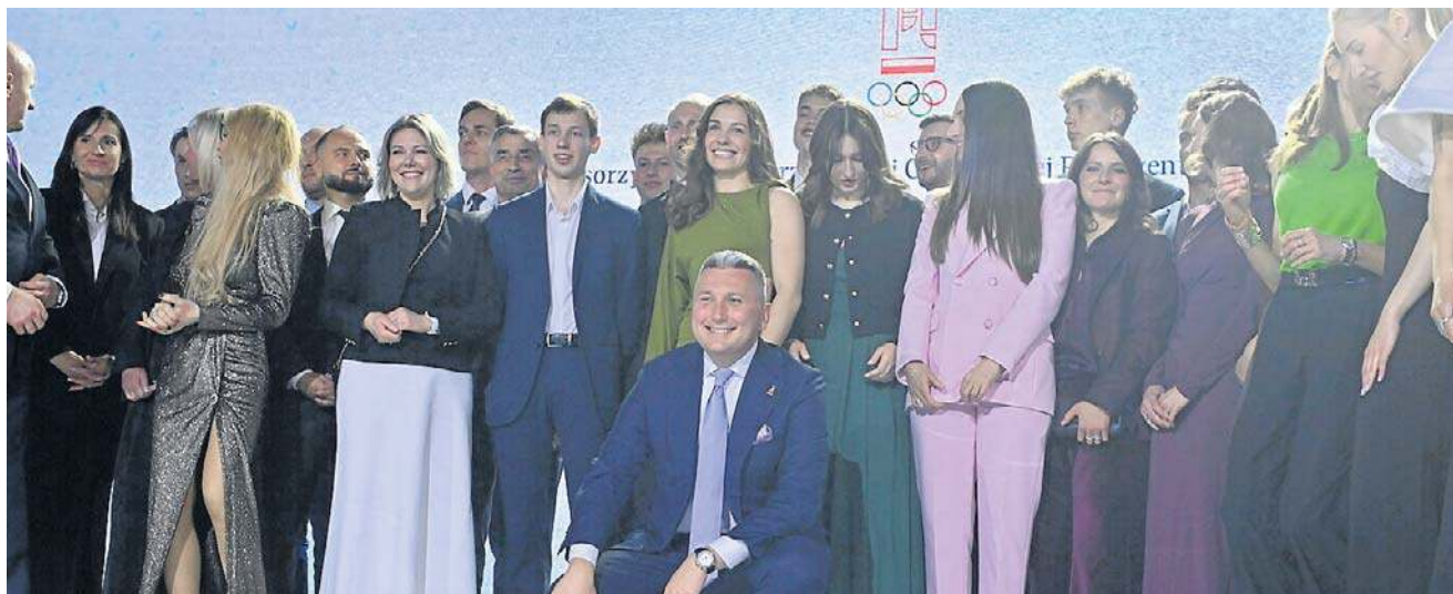
Uczestnicy Gali Olimpijskiej podsumowującej XXV Zimowe Igrzyska Olimpijskie

Sportowcy, którzy wywalczyli miejsca 4-8 dostali tokeny