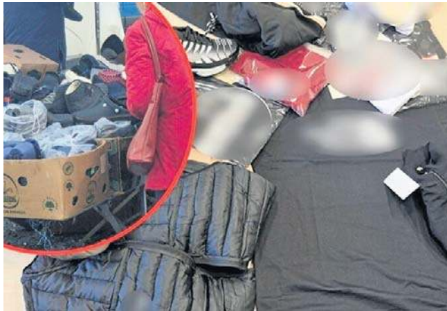
Podczas niespodziewanej kontroli na targowisku zatrzymano podrobioną odzież i buty za prawie 340 tys. zł.

Nowa Trybuna Opolska bok.prenumerata@polskapress.pl prenumerata.nto.pl