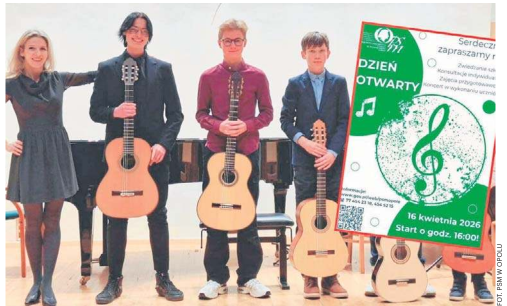
Uczniowie szkoły regularnie zdobywają nagrody na krajowych i międzynarodowych konkursach muzycznych.

- Dzień otwarty z założenia ma zachęcić do podjęcia nauki w naszej szkole, jest też okazją, by zobaczyć „od środka” jak szkoła funkcjonuje. Jest to możliwe na kilka sposobów, przede wszystkim tego dnia, między godziną 16.00 a 18.00 można będzie wejść do każdej sali lekcyjnej. Każdy, kto na odwiedziny, otrzyma specjalną