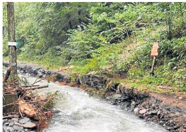
Zniszczone przez powódź oznakowanie szlaków w Cichej Dolinie

- Od 2018 roku pozyskujemy pieniądze z urzędu marszałkowskiego i staramy się systematycznie, po kawałku