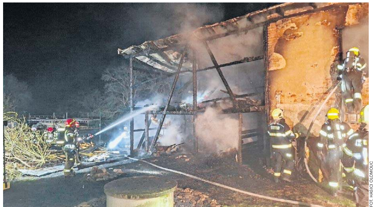
Nocny pożar w Złatych Horach gasili wspólnie strażacy z Polski i Czech.

Świat: Rekordowa liczba zdrajców została schwytana przez estoński kontrwywiad str. 8