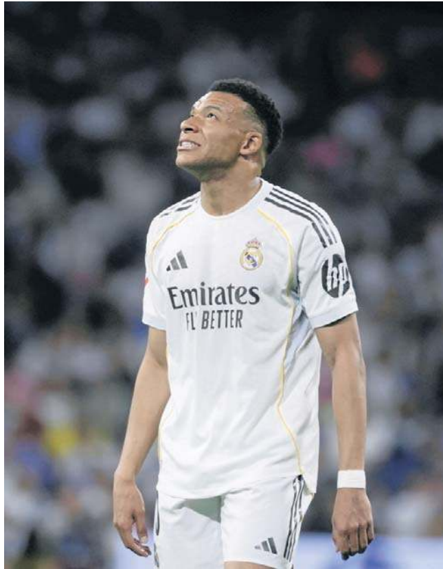
Czy Kylian Mbappe w rewanżowym meczu ćwierćfinału Ligi Mistrzów z Bayernem Monachium uratuje Real Madryt?

Bayern Vincenta Kompany'ego odniósł 5 zwycięstw z rzędu. Tydzień temu na Bernabeu nie pozwolił Mbappe i Viniciusowi na zbyt wiele. Michael Olise, Joshua Kimmich i Harry Kane powinni byli