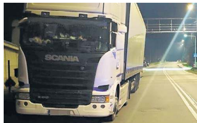
Pijanego kierowcę ciężarówki zatrzymano dzięki obywatelskiej postawie mieszkańca powiatu prudnickiego.

Dosłownie w ostatniej chwili, kilkadziesiąt metrów przed linią granicy państwowej, policjanci z Prudnika zatrzymali do kontroli pijanego kierowcę TIR-a. 53-letni obywatel Słowacji, kierujący potężnym ciągnikiem siodłowym, wydmuchał w alkomat 1,5 promila alko-