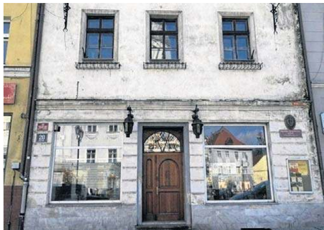
Dom Plastyka to zabytkowa kamienica położona pod numerem 20 przy Rynku w Paczkowie.

Dom Plastyka to zabytkowa kamienica położona pod numerem 20 na Rynku w Paczkowie. Zbudowano ją 200 lat temu. Przez ostatnie lata był siedzibą ogniska plastycznego dla dzieci, prowadzonego przez powiat nyski. W 2022 roku starostwo przekazało zarówno samą nieruchomość jak i zadanie prowadzenia ogniska plastycznego gminie Paczków, a burmistrz Artur Rolka rozpoczął przygotowania do remontu. Gmina sfinansowała projekt, zakładający przebudowę elewacji na bardzo nowoczesną i dostosowanie wnętrza do potrzeb domu kultury z biblioteką. Obiekt będzie miał też z tyłu dobudowaną windę.