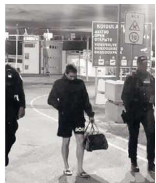
Estonia wydała przez granicę jednego z agentów Rosji