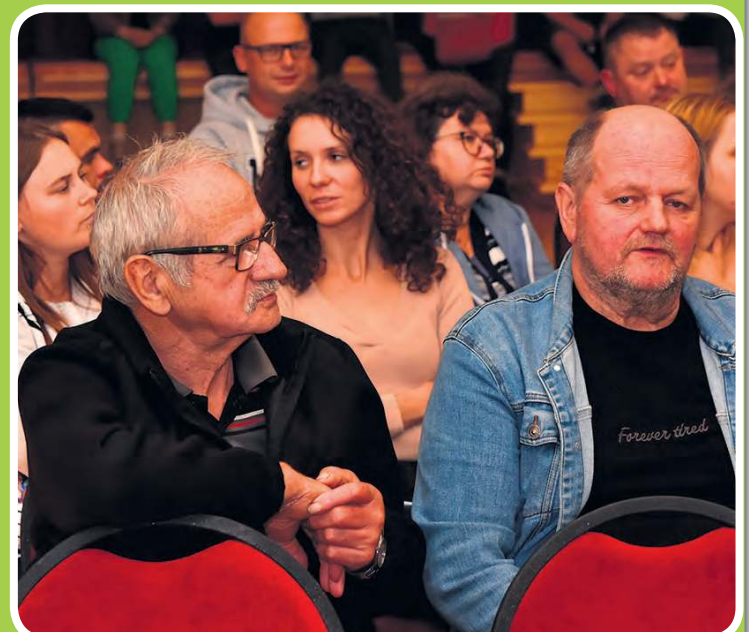
W gminie Lubiewo widać wyraźny trend przekazywanie środków z funduszu sołectkiego na zadania drogowe. O tym, czy tak być powinno debatowano podczas jesiennego zebrania wiejskiego w Bysławiu.