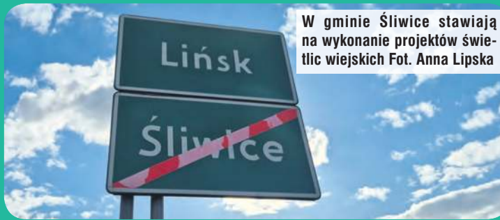
W gminie Śliwice stawiają na wykonanie projektów świetlic wiejskich

– krzewienie kultury, tradycji i kultury fizycznej – 2950,46 zł, – poprawa bezpieczeństwa ruchu drogowego w sołectwie – 3000 zł, – internet w sołectwie – 11.000 zł, – utrzymanie zieleni w sołectwie – 1000 zł, – doposażenie świetlicy – 1000 zł.