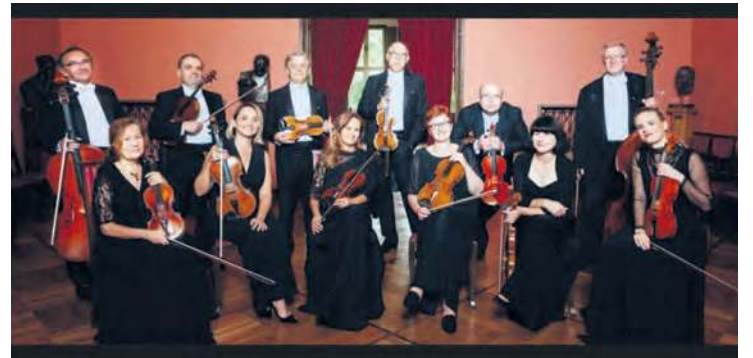
„Capella Bydgosciensis”.