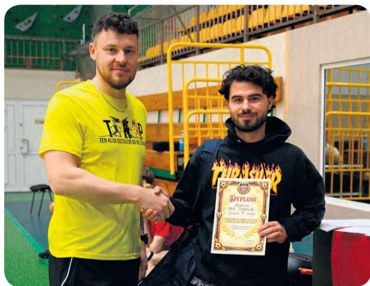
Dla każdej drużyny, także spoza podium, pamiątka w postaci dyplomu. Turniej halowy to sportowa część tegorocznego jubileuszu Tucholskiego Klubu Piłkarskiego.

Dwadzieścia lat strzeliło jak z bicza strzelił – to nic nowego, że okrągły jubileusz rodzi takie odczucia. Po części dlatego, że piłkarze TKP to ludzie nie tylko aktywni, ale z wielkim dystansem do siebie, umiejętnością autoironii, bez wielkiego parcia na wynik za wszelką cenę. To ten klub konsekwentnie gra w Nowy Rok i zbiera się w sezonie, by bez względu na wynik po prostu pograć w piłkę.