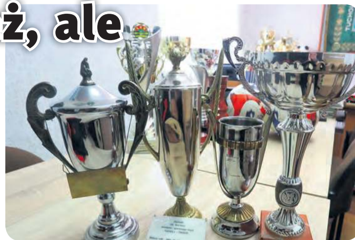
Klub jest w posiadaniu kilku pucharów z dawnych czasów sekcji lekkoatletycznej.