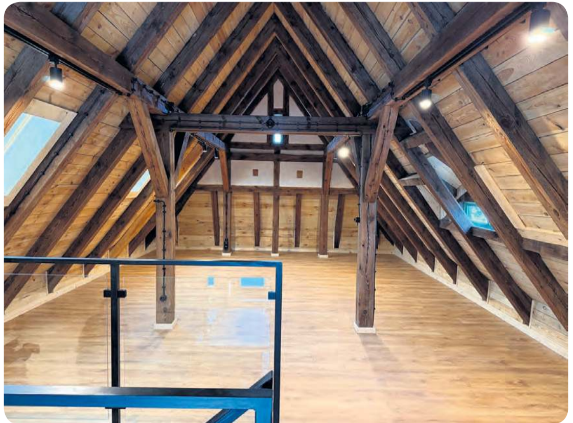
Lubiewski samorząd poszukuje starych fotografii, na których uwieczniono budynek za żłobkiem.

Gmina Lubiewo 30 listopada 2015 roku nabyła nieruchomości w drodze darowizny od Skarbu Państwa – na cele publiczne, czyli budowę żłobka. Wcześniej