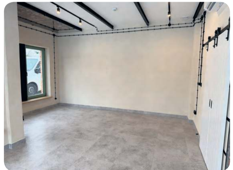
Planowana izba kultury, pamięci i tradycji z całą pewnością – w krótkim czasie – stanie się obowiązkowym punktem do odwiedzenia na mapie gminy Lubiewo.

W zakres prac, opiewających na 525.593,28 zł, weszły: przebudowa budynku, wymiana pokrycia dachowego, ocieplenie ścian z wykonaniem elewacji, wymiana sto-