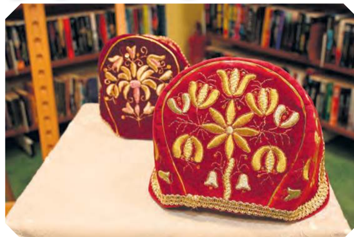
Wspaniałe czepce – chluba „Złotnicy”.