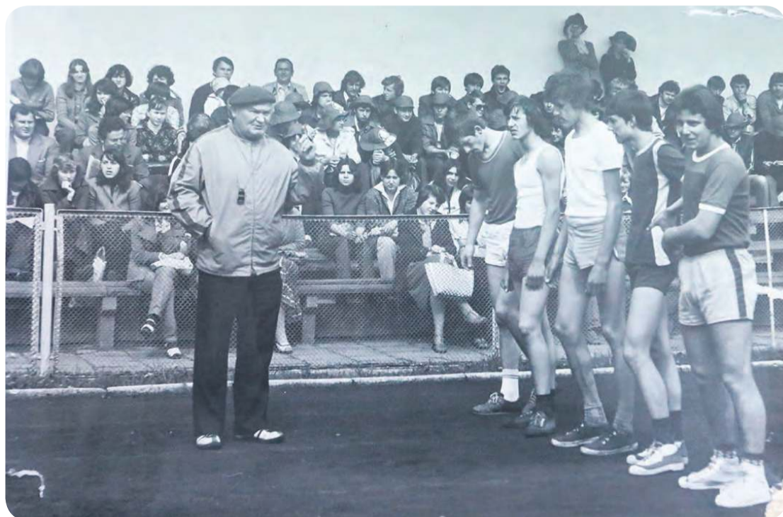
Spartakiada młodzieżowa w Tucholi, 1981 rok.