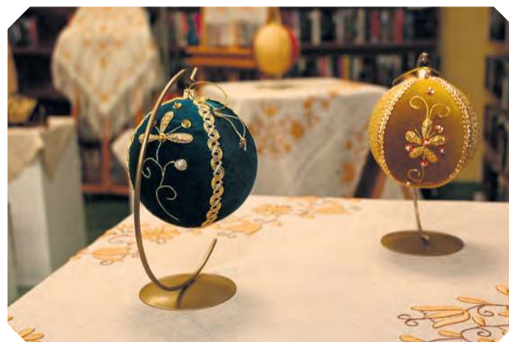
Pomysł na ozdoby świąteczne na przyszły rok. Nasze, borowiackie, czyli najlepsze!