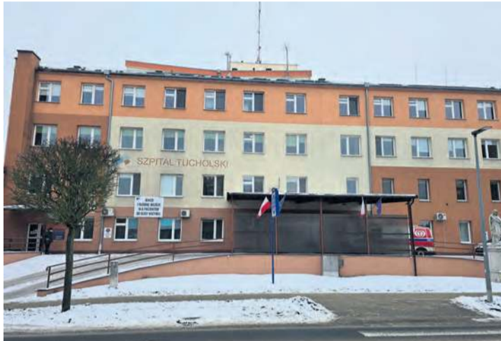
Pacjenci Szpitala Tucholskiego czekają na przywrócenie wejścia od ulicy Nowodworskiego od czasu zakończenia pandemii koronawirusa.