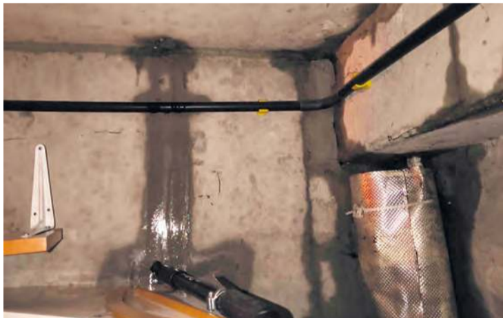
W sobotę woda lała się po ścianach i kapiała z sufitu. Oprócz mieszkania zalała także piwnicę. Jej właściciel zgłosił się do „Tygodnika”. Długą historię mieszkania na parterze zna dobrze.

niczny. Nie ta kwestia jest jednak teraz najważniejsza. Większe znaczenie ma obawa przed potencjalnymi kolejnymi incydentami, które – jak słyszymy – mogłyby na wszystkich mieszkańców klatki i bloku sprowadzić niebezpieczeństwo.