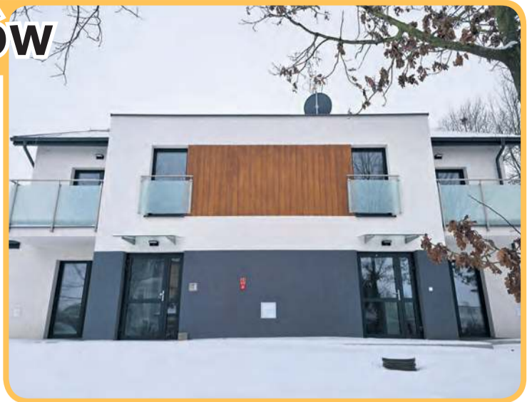
Budynek wielorodzinny w Żalnie mieści się u zbiegu ulic Starowiejskiej i Sportowej.

Potencjalni najemcy mają czas na złożenie wniosku do 19 lutego (czwartek). Wniosek można składać osobiście w Sekretariacie Urzędu Gminy w Kęsowie (pok. nr 4) lub pocztą na adres: Urząd Gminy w Kęsowie, ul. Główna 11, 89-506 Kęsowo. Dokumenty należy dostarczyć w zamkniętej kopercie z dopiskiem: „Nabór wniosków na lokale mieszkalne w Żalnie”.