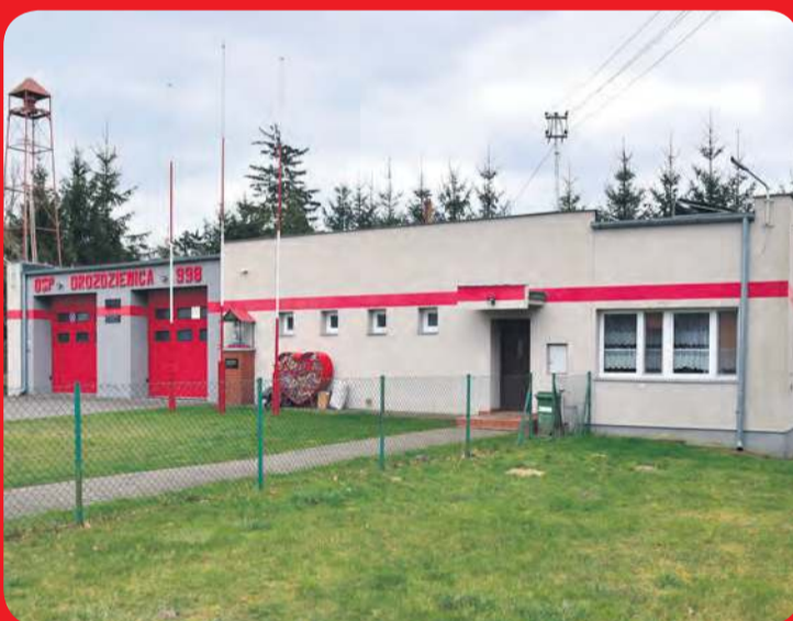
Sołectwa z gminy Kęsowo ze swych funduszy wesprą m.in. jednostki OSP.