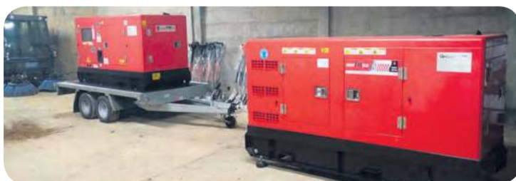
Agregaty prądotwórcze w sytuacjach kryzysowych mają zapewnić funkcjonowanie infrastruktury komunalnej.

Jak podaje gmina, do magazynów trafiły też pakiety żywnościowe i woda jako zestawy awaryjne na pierwsze 72 godziny kryzysu. Wspomniane urządzenia, żywność i woda zostały zakupione z funduszu związa-