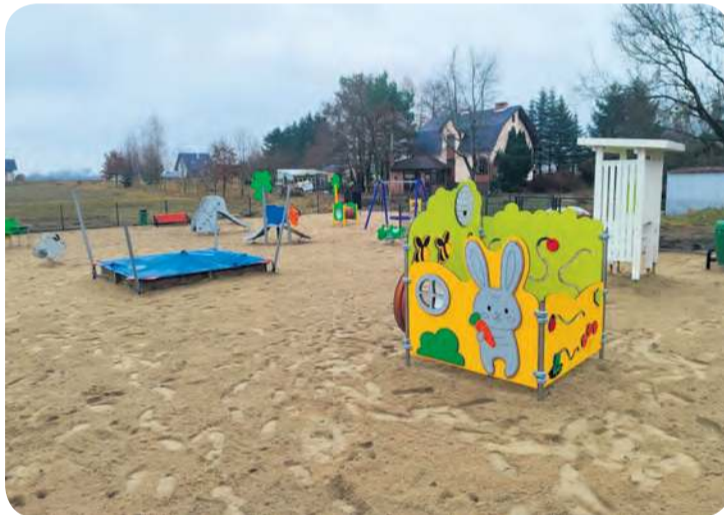
Investycja z całą pewnością stworzyła bezpieczną i atrakcyjną przestrzeń do zabawy dla najmłodszych mieszkańców gminy.

Pod koniec 2025 roku, dzięki dofinansowaniu z programu „Aktywne Place Zabaw”, Bysław wzbogacił się o nowe miejsce rozrywki dla dzieci. Plac wykonała firma Novum ze Szczytna za kwotę 265.814,02 zł brutto. Wsparcie finansowe, poza dostawą i montażem, objęło również przygotowanie dokumentacji projektowej. Łączna wartość wszystkich wydatków w ramach zadania to 271.814,02 zł brutto, z czego 251.814,02 zł wyniosło dofinansowanie z powyższego programu. Pozostała kwota w wysokości 20.000 zł to wkład własny z budżetu gminy Lubiewo.