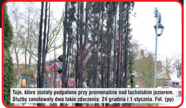
Tuje, które zostały podpalone przy promenadzie nad tucholskim jeziorem. Służby zanotowały dwa takie zdarzenia: 24 grudnia i 1 stycznia.

– 24 grudnia 2025 roku oraz 1 stycznia 2026 roku doszło