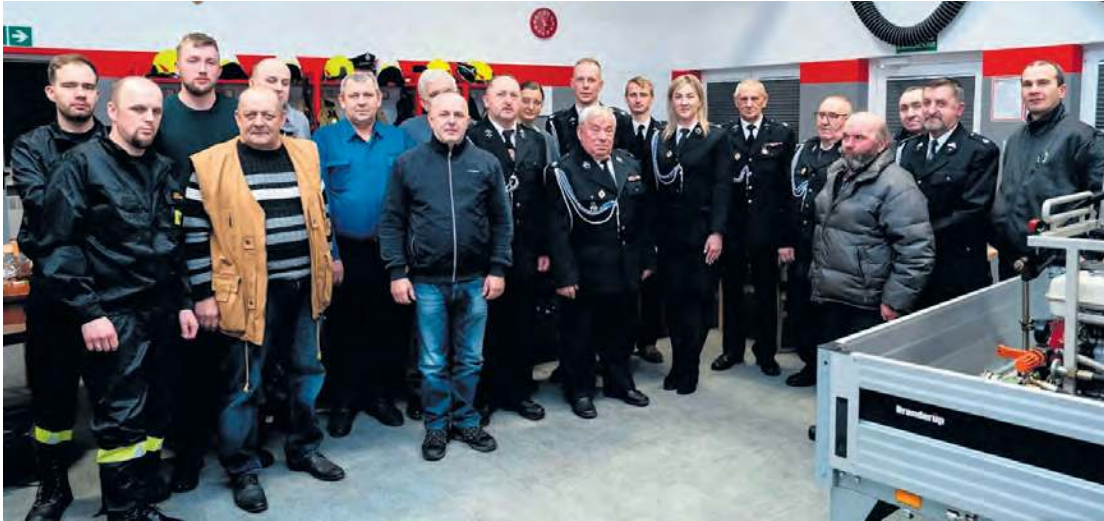
Walne zebranie sprawozdawczo-wyborcze w Ochotniczej Straży Pożarnej w Kręgu odbyło się pod koniec stycznia.

W jednostce Ochotniczej Straży Pożarnej w Kręgu odbyło się walne zebranie sprawozdawczo-wyborcze, podczas którego zapadły ważne decyzje dla tamtejszych ochotników.