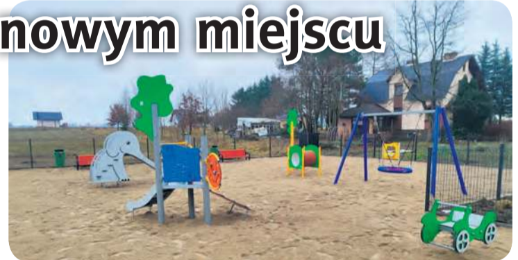
Tylko czekać, aż nadejdzie wiosna i dzieci będą korzystać z nowego placu zabaw.

W ramach projektu przebudowano plac zabaw przy żłobku „Bajkowa Kraina”, na którym zamontowano: huśtawkę „bobacianie gniazdo”, zadaszoną ławkę z przewijakiem, piaskownicę z przykryciem i zadaszeniem, stolik z siedziskami, podwójną tablicę do rysowania, zestawy zabawowe, tablicę sensoryczną, zjeżdżalnię, tablicę manipulacyjną, sprężynowce jednoosobowe.