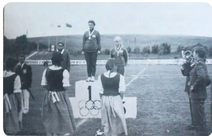
Lata ubiegłego wieku były czasem dużej aktywności sekcji lekkoatletycznej. Stadion tętnił życiem podczas wszelkich zawodów.

Jest rekordzistą klubu na 800 m w hali i na stadionie. Występował w zawodach ogólnopolskich i międzynarodowych, jak choćby Mityng Międzynarodowy Enea Cup czy Europejski Festiwal Lekkoatletyczny.