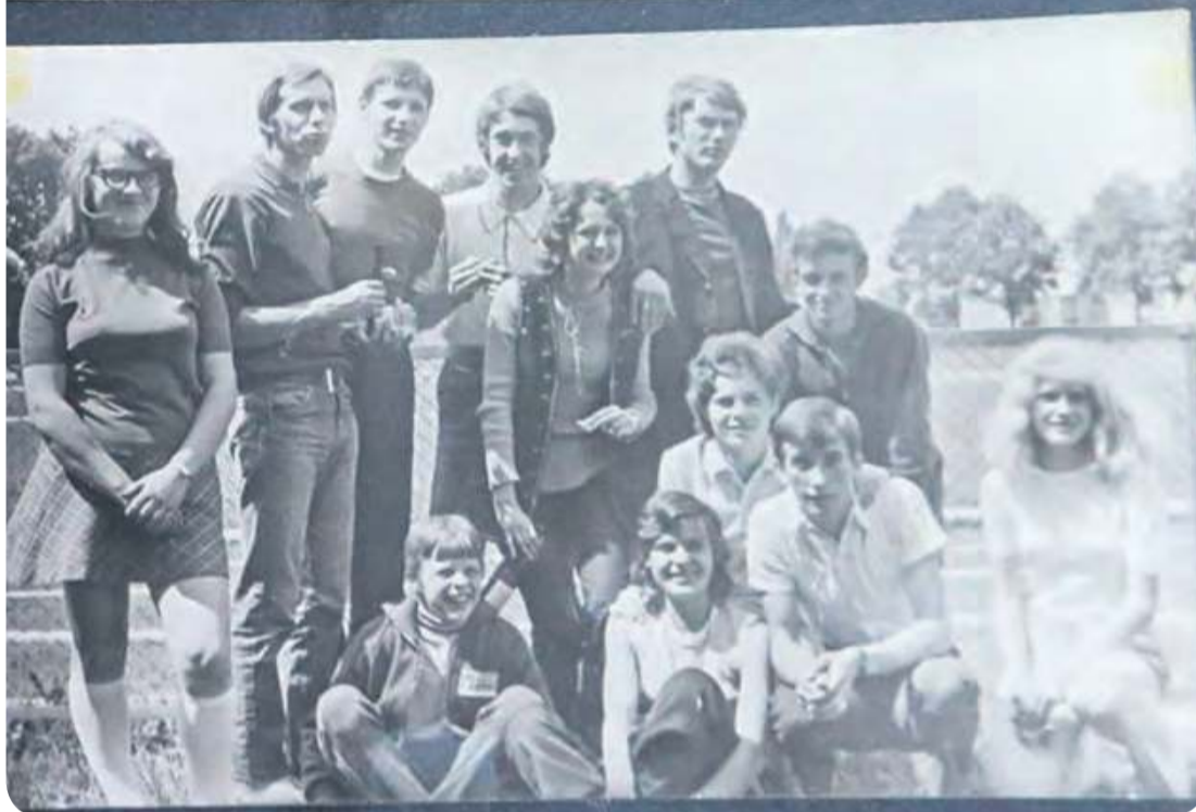
W sekcji lekkoatletycznej trenowało przed laty mnóstwo sportowców.