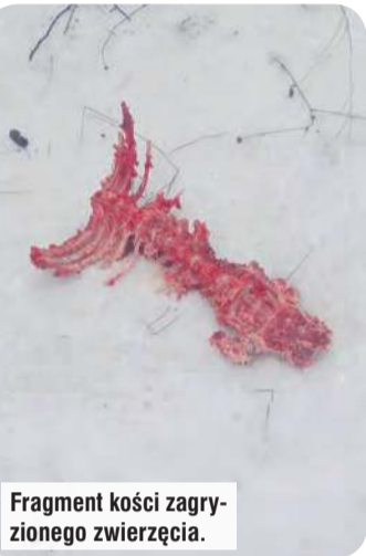
Fragment kości zagryzonego zwierzęcia.

W ciągu dwóch miesięcy publikujemy już trzeci artykuł na ten temat aktywności wilków i ostrzeżeń w gminie Śliwice.