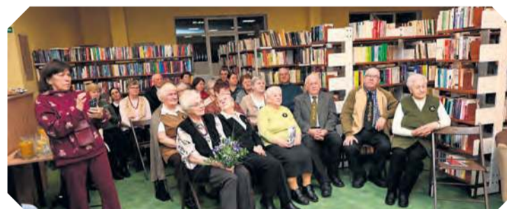
Na wernisaż przybyło sporo gości. Jak widać po panach, haft bardzo dobrze prezentuje się także na krawatach.

– Ona była specjalistką w haftowaniu czepców i nauczyła też tego nas. Bardzo mi się podobał haft czepcowy. W latach 2012 i 2013 byłyśmy na tygodniowym plenerze u siostr benedyktynek w Bysławku, gdzie haftowałyśmy tylko czepce, bo przecież od setek lat to domena siostr zakonnych. Dla mnie haftowanie jest ważną częścią życia. Dużo prac wykonałam, ale zachowałam niewiele, wszystkie poszły do ludzi. Cztery czepce przekazałam