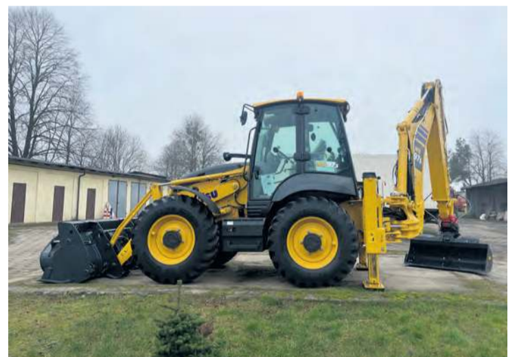
Nowa koparko-ładowarka jest warta ponad 600 tys. zł. Gmina otrzymała na jej zakup sto procent dofinansowania.