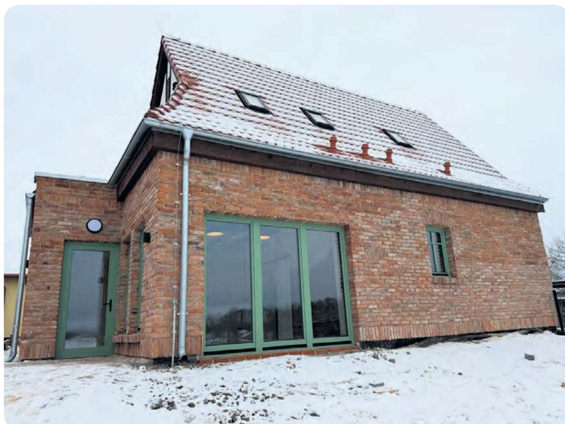
Przebudowany obiekt i sąsiedni plac zabaw oficjalnie mają zostać otwarte wiosną – aby teren wokół był odpowiednio uporządkowany. W tym przeszkodziła zima.