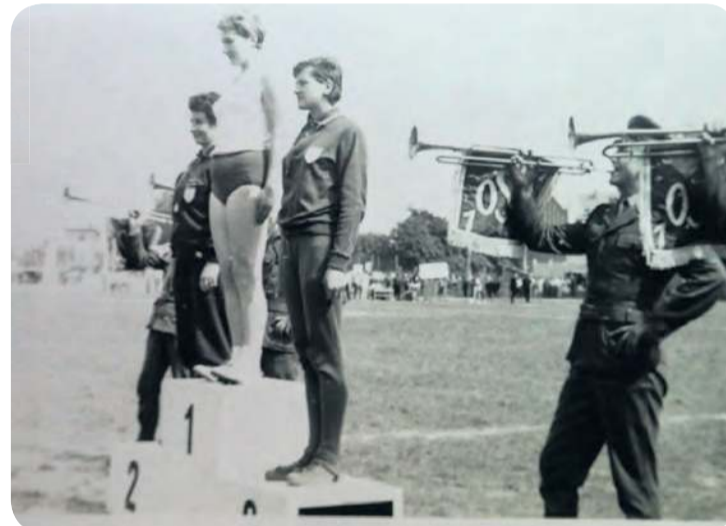
Igrzyska sportowców wiejskich w Brodnicy, 1970 rok.

Wiśniewskiego są areną występów utytułowanych biegaczy, a przy okazji także miejscem realizowania pomysłów charytatywnych, jak też biegów integracyjnych dla najmłodszych. Miła jest wydarzeniem, na które przybywają tłumy.