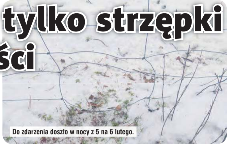
Do zdarzenia doszło w nocy z 5 na 6 lutego.

Wilki zaatakowały łanię daniela na Osiedlu Leśnym w Śliwicach. Zaniepokojony mieszkaniec, właściciel zagryzonego zwierzęcia, zwraca uwagę, że do ataku doszło w bliskiej odległości od szkoły podstawowej, gminnego targowiska, restauracji i przychodni zdrowia.