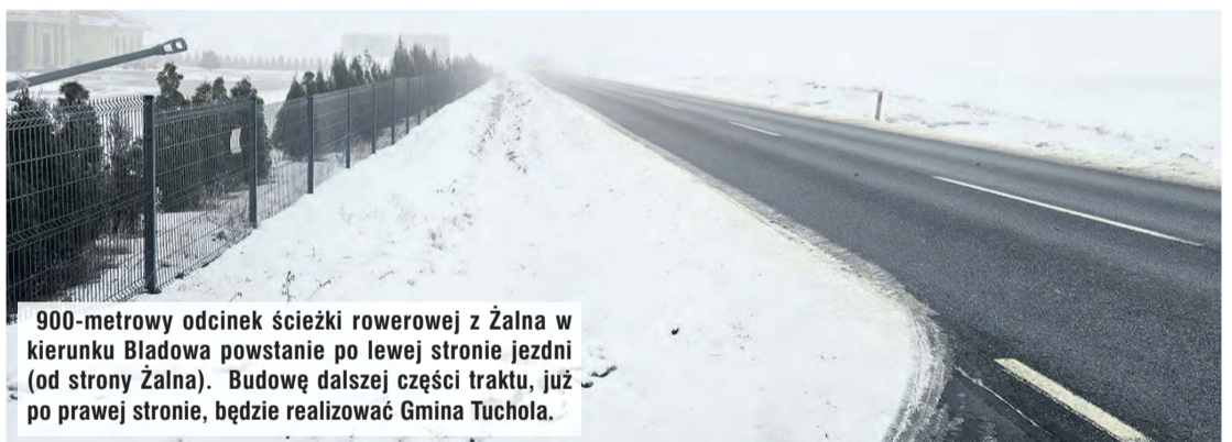
900-metrowy odcinek ścieżki rowerowej z Żalna w kierunku Bładowa powstanie po lewej stronie jezdni (od strony Żalna). Budowę dalszej części traktu, już po prawej stronie, będzie realizować Gmina Tuchola.

Jak zaznacza wójt, budowa ścieżki rowerowej z Żalna w kierunku Bładowa jest od lat