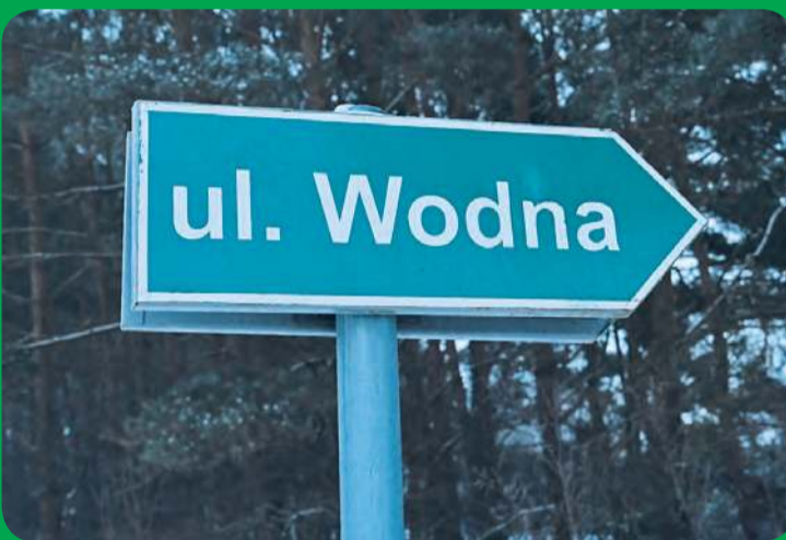
Na zebraniu sołeckim w Cekcynie jesienią ubiegłego roku, szerokim echem odbił się punkt poświęcony projektom dróg m. in. ul. Wodnej.

– funkcjonowanie i doposażenie świetlicy wiejskiej – 2.307,37 zł, – pobudzenie aktywności obywatelskiej – 3000 zł, – utrzymanie obiektów infrastruktury gminnej – 14.000 zł, – utrzymanie terenów zielonych – 1000 zł,