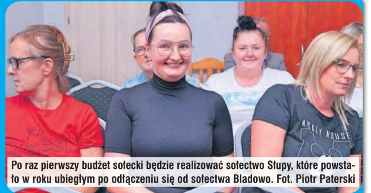
Po raz pierwszy budżet sołectki będzie realizować sołectwo Słupy, które powstało w roku ubiegłym po odłączeniu się od sołectwa Bładowo.

– zakup płyt jumbo na utwardzenie drogi w miejscowości Huby – kolejny etap – 48.000 zł, – prowadzenie świetlicy wiejskiej i organizacja Dnia Dziecka – 7000 zł, – utrzymanie zieleni w sołectwie Mały Mędromierz – 5500 zł, – kultura fizyczna i sport – utrzymanie boiska sportowego – 583,19 zł.