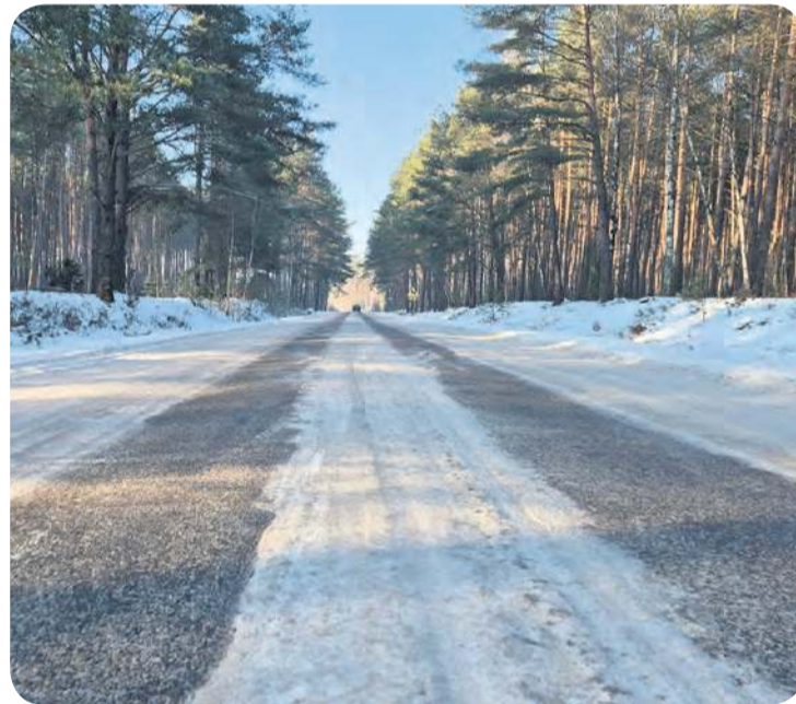
22 stycznia droga powiatowa pokryta była warstwą lodu.

Mieszkancka kontynuowała, że droga powiatowa, jadąc do Łobody, „jest pięknie posypana”, a dalej w kierunku Brzeźna już nie. Swoją wypowiedź pod-