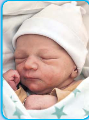
Syn p. Winiarskich, 3.02, 2800 g, 53 cm, Osowo