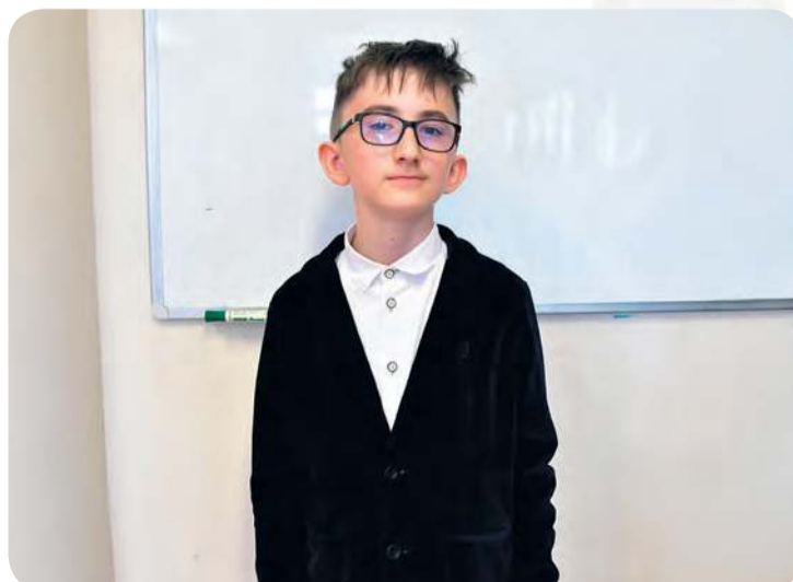
Uczeń Szkoły Podstawowej w Cekcynie

Aby wziąć udział w konkursie, należy wykonać dwuwymiarową