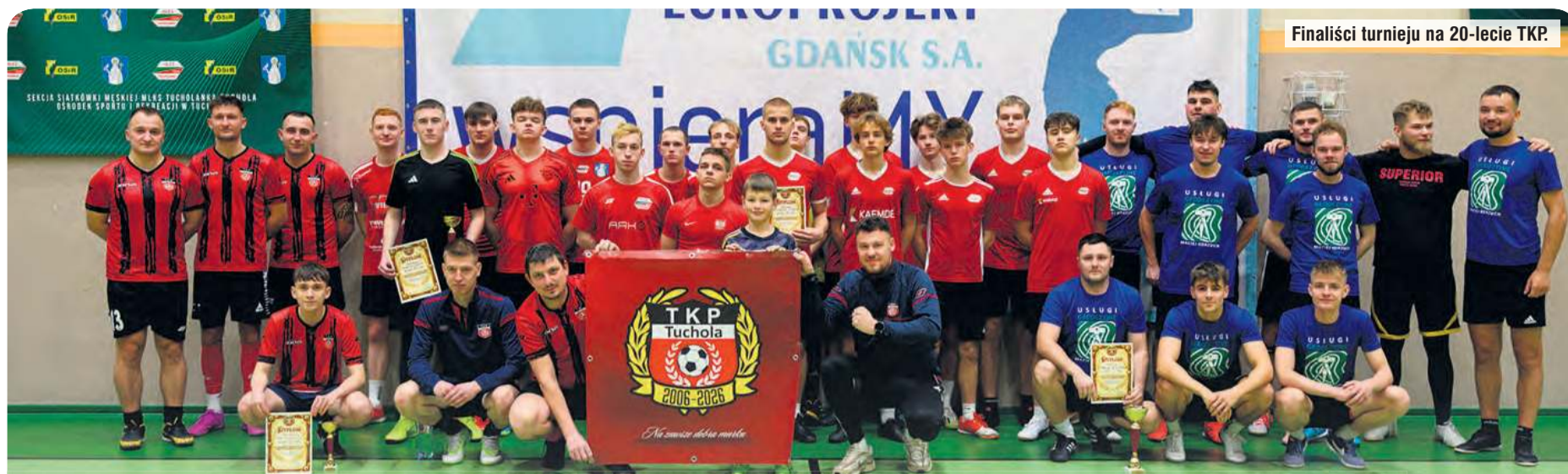
Finaliści turnieju na 20-lecie TKP.