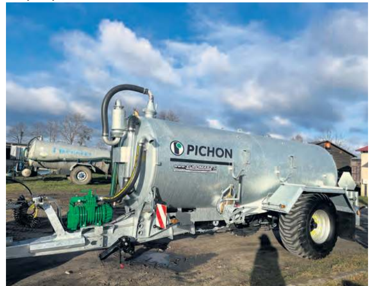
W koszu zakupowym znalazł się też wóz asenizacyjny, czyli specjalistyczna przyczepa (cysterna) do wywozu płynnych nieczystości.