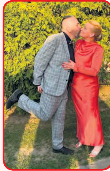
Wybrane zdjęcie w kategorii 50+. Wysłała je Kasia Giersz.

W sprawie ustalenia szczegółów wykorzystania obu nagród prosimy Was o bezpośredni kontakt zarówno z Fiero, jak i WinoGrono. Kontakt możliwy jest za pośrednic-