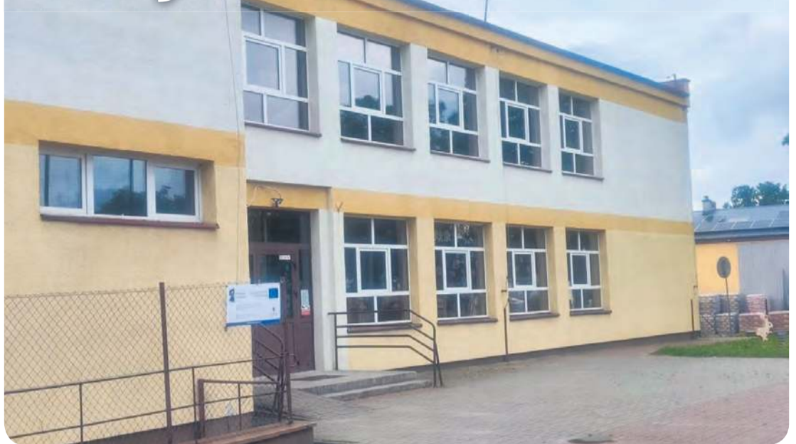
Zakres prac obejmuje kompleksową termomodernizację budynku szkoły, którego powierzchnia wynosi 867 m 2 .

Inwestycja ma przynieść wymierne efekty ekologiczne. Szacuje się, że roczne zużycie energii pierwotnej zmniejsz