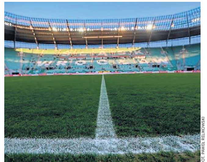
Wygląda na to, że w sprawie niedoszłego meczu Śląsk Wrocław z Wisłą Kraków czeka nas jeszcze wiele odcinków

Z kolei Śląsk zamieścił bardzo długi komunikat, w którym głównym motywem jest informacja o tym, że wrocławski klub odwoła się od kary oraz że będzie się domagał od Wisły zwrotu kosztów organizacji meczu. ©©