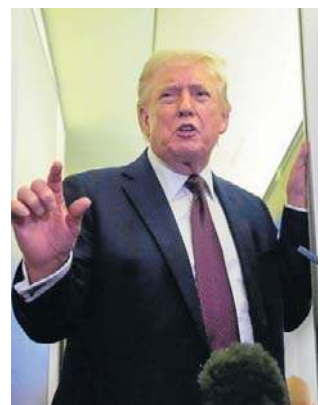
Donald Trum na pokładzie Air Force One

- Żądam, aby te kraje przybyły i chroniły swoje teryto-