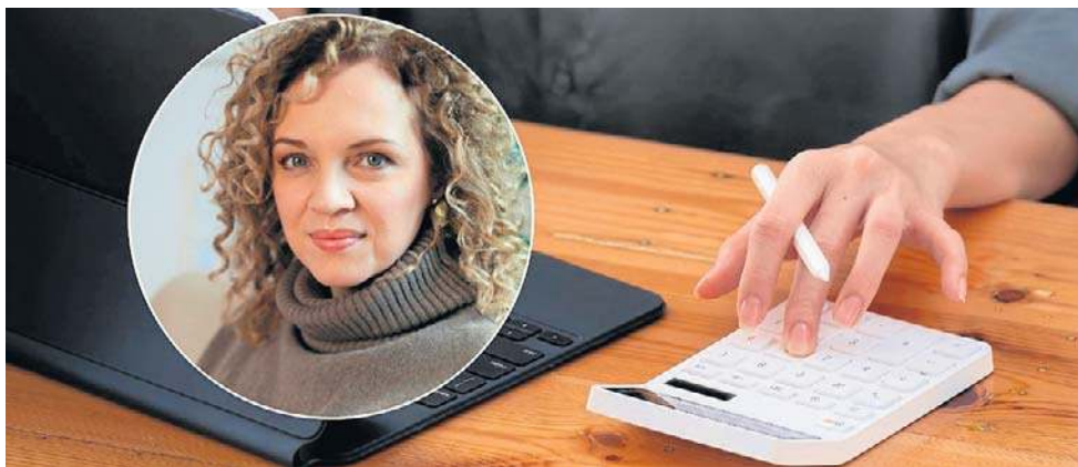
Kobiety w Polsce stanowią zaledwie 8-9 procent aktywnie inwestujących

Uważam, że AI jest świetnym narzędziem w rękach ludzi, którzy wiedzą, co z nim robią. Jeśli tej świadomości nie ma, AI nie zastąpi rzetelnej wiedzy. W finansach powtarzam, że to jest ważne, żeby wiedzieć, do czego używamy narzędzia. Można z wykorzystaniem AI przeanalizować dużą liczbę danych i wyciągnąć wnioski, ale trzeba wiedzieć, co robimy i po co. Zadanie pytania w stylu „Oto moje cele, ułóż mi strategię” to już problem. Nie ma uniwersalnego schematu dla każdego człowieka. Jeśli natomiast mamy już przemyślaną strategię i chcemy coś uprościć, wtedy narzędzie może pomóc. Może zrobić raport, prześledzić dane z wybranego okresu. Ale nie zastąpi to edukatora czy doradcy w dopasowaniu strategii