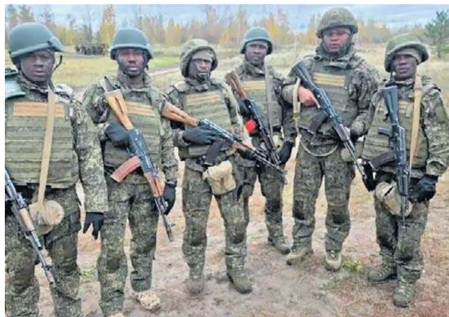
Według raportu kenijskiego wywiadu ponad 1000 Kenijczyków zostało zwerbowanych do walki przez Rosję

Z kolei Ławrow przekonywał, że obywatele Kenii dobrowolnie podpisali kontrakty na walkę u boku armii rosyjskiej.