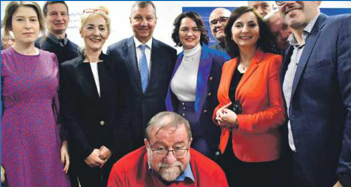
Mistrz pierwszego planu jest tylko jeden!