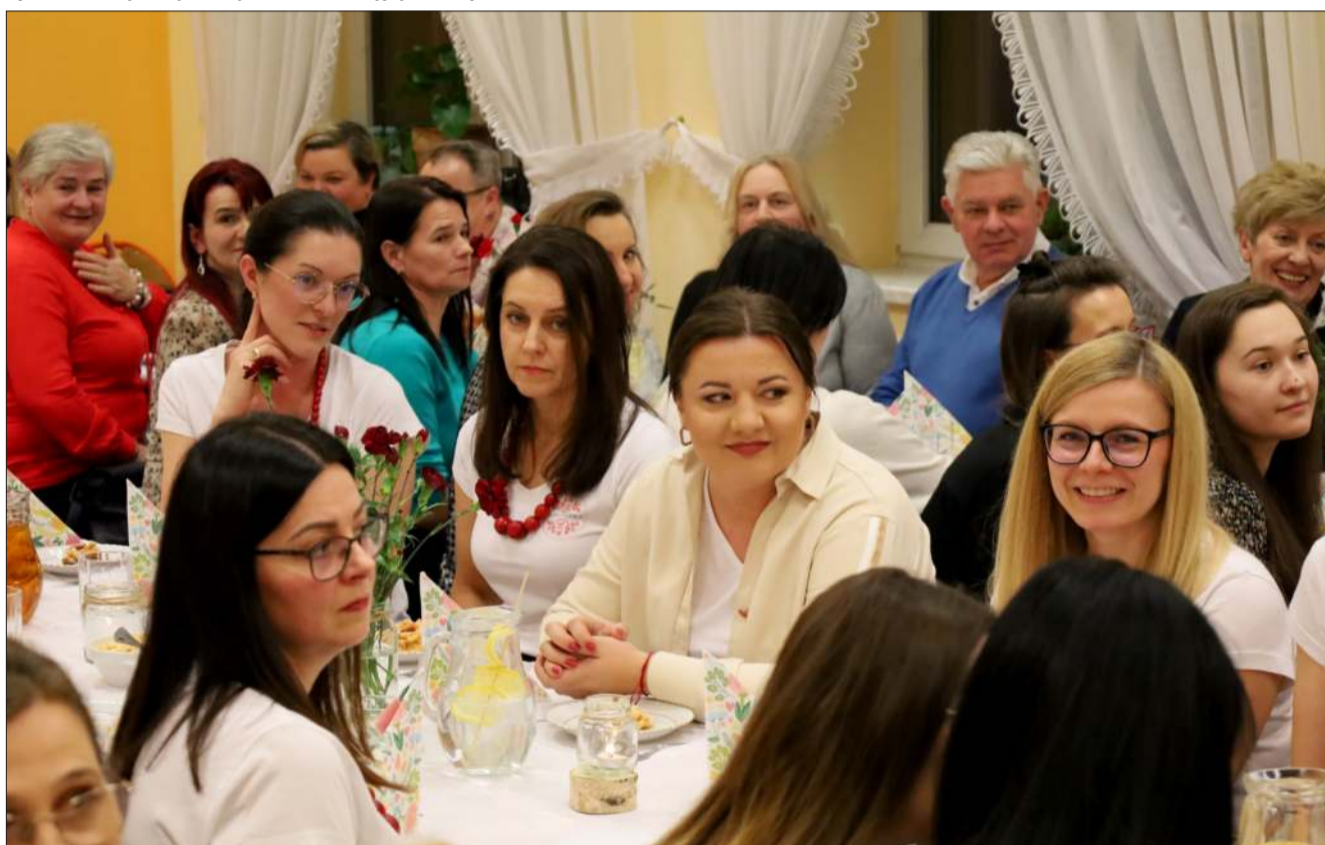
Gospodynie zapełniły stoły pysznymi przekąskami.