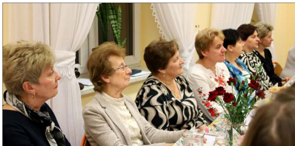
Panie tego dnia spędziły czas na rozmowach.