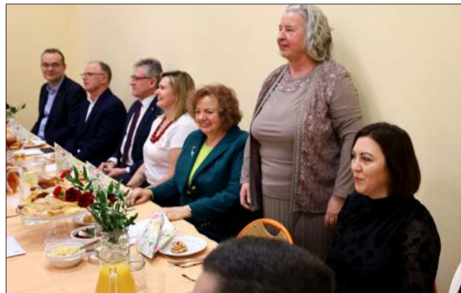
Nie zabrakło lokalnych władz i gości.

Tłusty Czwartek to jedno z najbardziej wyczekiwanych świąt kulinarnych w Polsce. Obchodzony jest w ostatni czwartek przed Wielkim Postem i stanowi symboliczne „pożegnanie” karnawału. Tego dnia – zgodnie z tradycją – można bez wyrzutów sumienia sięgnąć po słodkie wypieki.