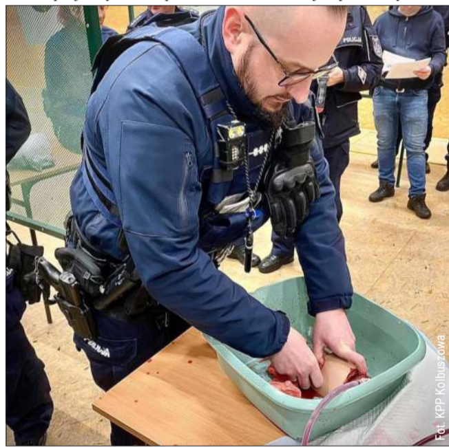
Policjanci przeszli specjalne szkolenie.

Zajęcia miały charakter praktyczny i odbywały się na strzelnicy Liceum Ogólnokształcącego w Kolbuszowej. Funkcjonariusze ćwiczyli m.in. szybkie rozpoznawanie masywnych krwotoków oraz skuteczne metody ich tamowania, przy użyciu specjalistycznego sprzętu.