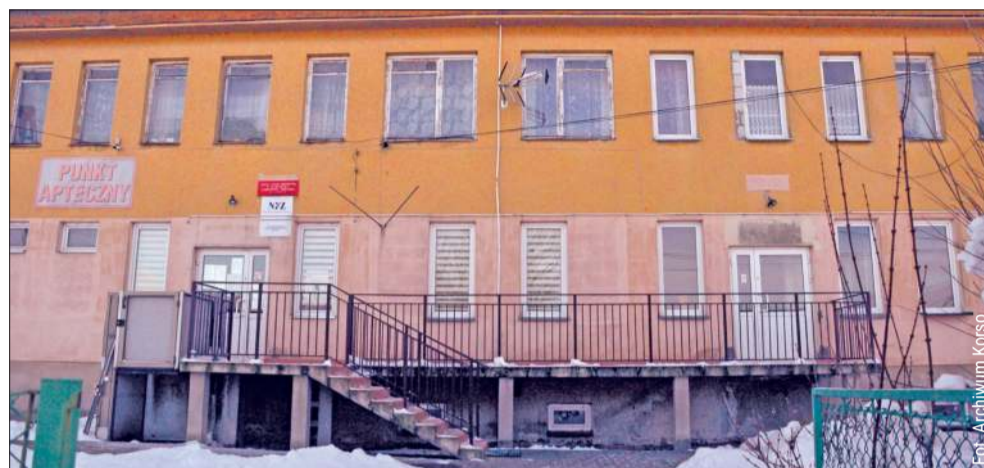
Budynek Wiejskiego Ośrodka Zdrowia w Lipnicy, który ma ponad 40 lat, to ruina. Mieszkańcy od lat bali się, że zostanie on zamknięty. Obawy stały się faktem.