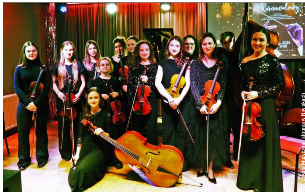
W Niwiskach odbył się wyjątkowy koncert karnawałowy.

Koncert karnawałowy był kolejną okazją do zaprezentowania talentów uczniów oraz zaangażowania nauczycieli i rodziców w życie szkoły.