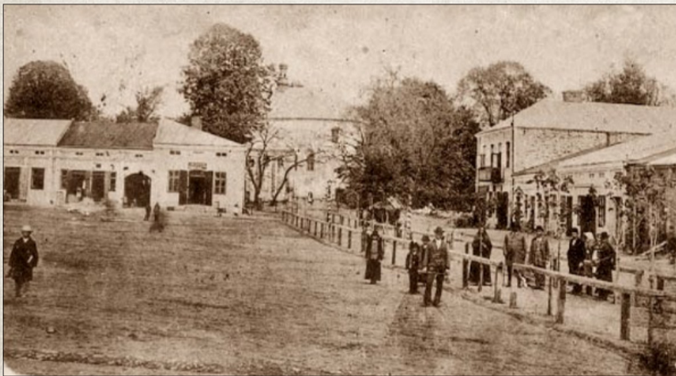
Rynek w Kolbuszowej, 1905 rok.

W dniu 24 czerwca 1942 roku wywieziono wszystkich Żydów z kolbuszowskiego getta do getta w Rzeszowie, a następnie do obozu zagłady w Belżcu. Z grupy deportowanych, około 100 osób zostało przeniesionych z Rzeszowa z powrotem do Kolbuszowej, by przeprowadzić prace rozbiórkowe w getcie. Po usłyszeniu informacji o rozstrzelaniu przez Niemców dużej grupy Żydów w pobliskim lesie, 37 z nich postanowiło uciec, jednak nie udało im się uciec przed śmiercią. Pozostali zostali deportowani ponownie, 14 listopada 1942 roku, z powrotem do Rzeszowa i stamtąd do obozu zagłady w Belżcu.