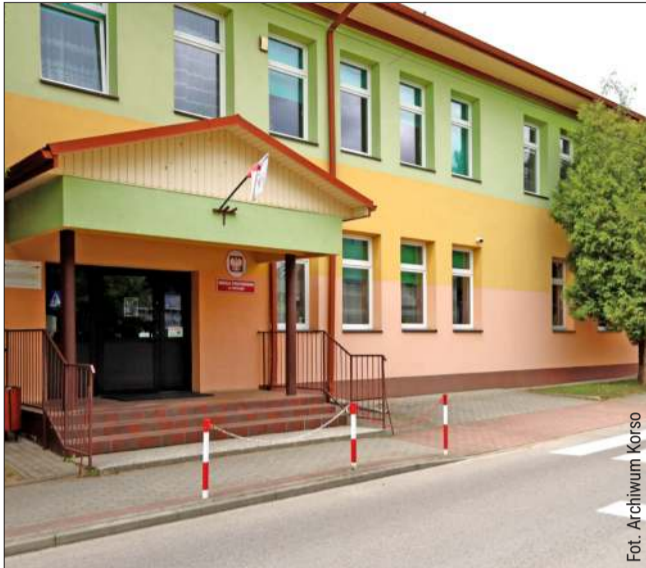
Szkoła w Przylęku doczekała się swojego patrona.

Najpierw swoje propozycje zgłaszali rodzice, uczniowie i nauczyciele. Przygotowano trzy urny, a dyrekcja nie wskazywała żadnego kandydata. Każdy mógł samodzielnie zdecydować, kogo widzi w roli patrona.