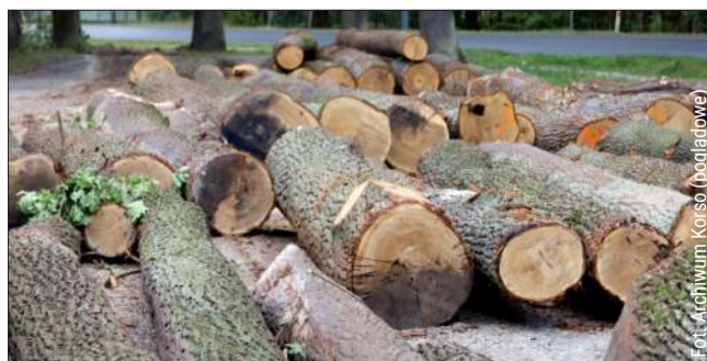
Licytacja zostanie przeprowadzona bezpośrednio na terenie lasu.

Wydanie i wywóz drewna możliwe będą po dokonaniu wpłaty w dniu sprzedaży. Brak zapłaty przez wyłonionego w przetargu nabywcę skutkuje unieważnieniem postępowania w odniesieniu do danego drewna.