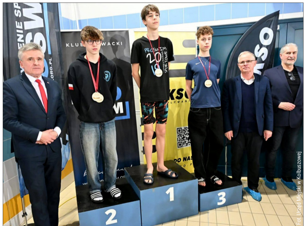
lg Zawody w Kolbuszowej przyciągnęły wielu pływaków z województwa.

Reprezentanci UKS Fregaty Kolbuszowa zdobyli dziewięć medali, a pływacy z Klubu SSKiR Cmolasy sięgnęli po jedno złoto i jedno srebro.