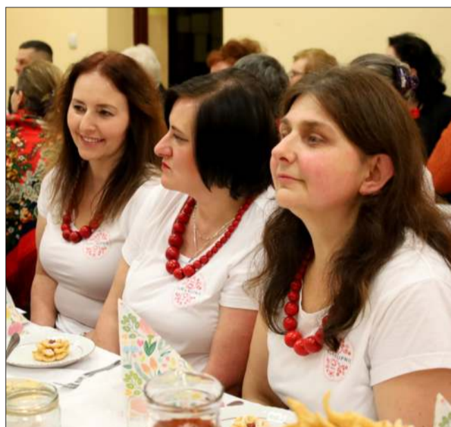
KGW Kupno zajęło się organizacją wydarzenia.