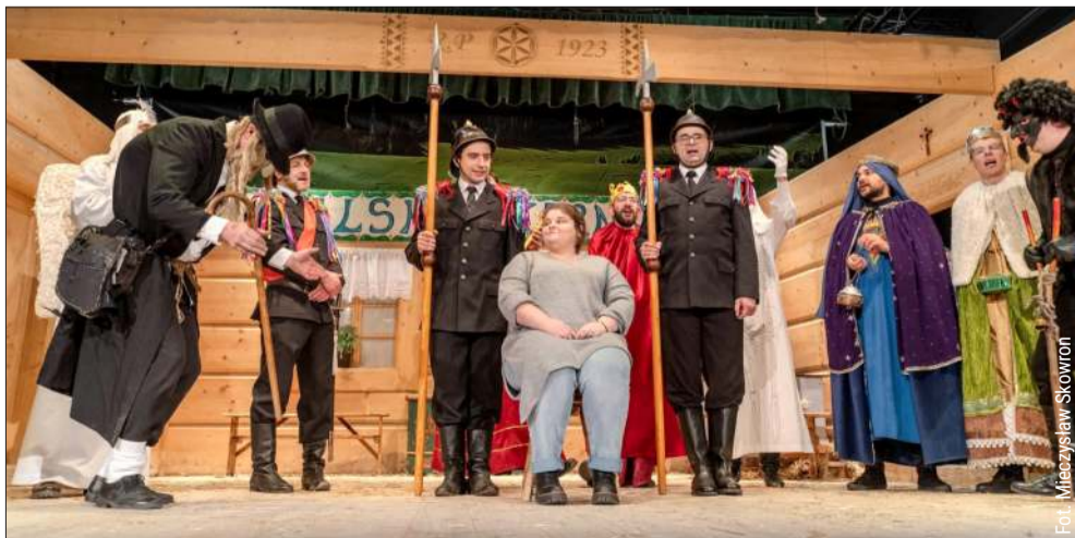
Jury doceniło sztuk „Górników”.

Zespół zapowiada, że po zakończeniu sezonu kołędniczego rozpoczyna przygotowania do kolejnych wydarzeń w kalendarzu kulturalnym. Jeśli tempo i poziom zostaną utrzymane – o Kolbuszowej Górnej jeszcze nieraz będzie głośno. kz