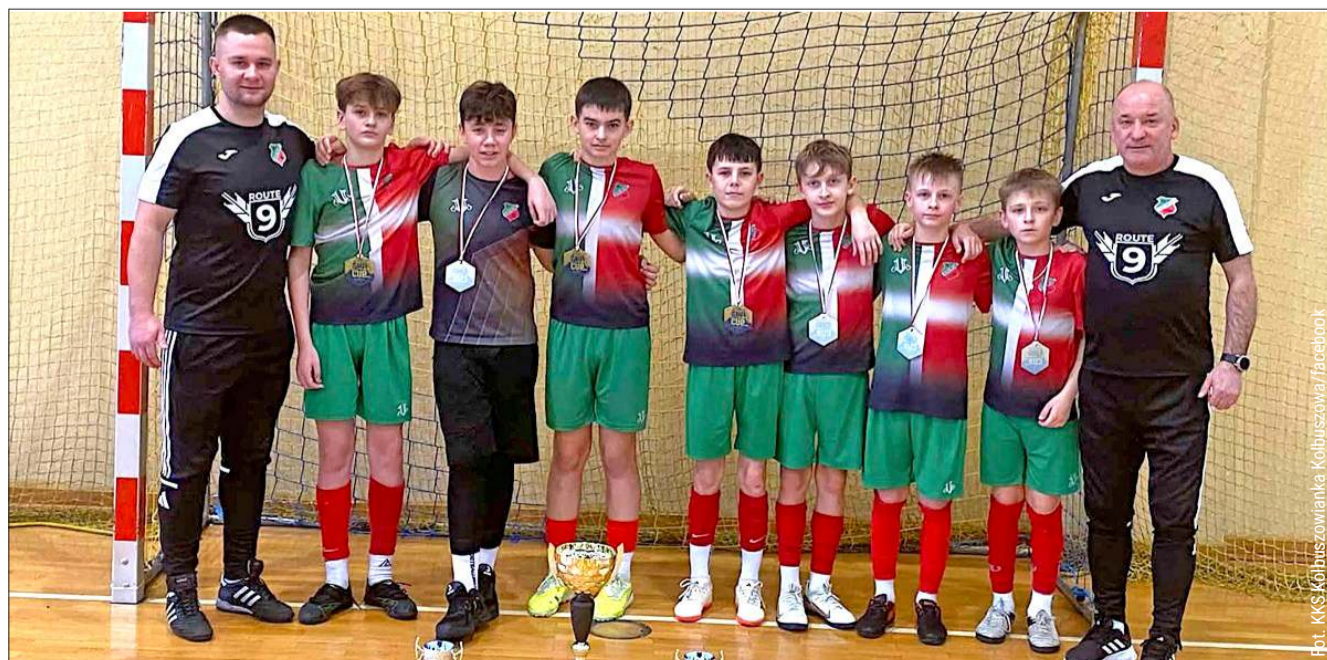
lg Kolbuszowianie wygrali turniej w Nowej Dębie

Młodzi zawodnicy Kolbuszowianki zakończyli turniej z kompletem siedmiu wygranych, notując przy tym impo-