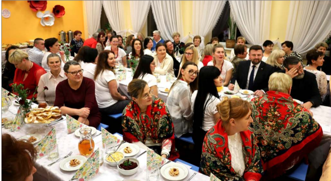
Spotkanie odbyło się w budynku wielofunkcyjnym w Kupnie.