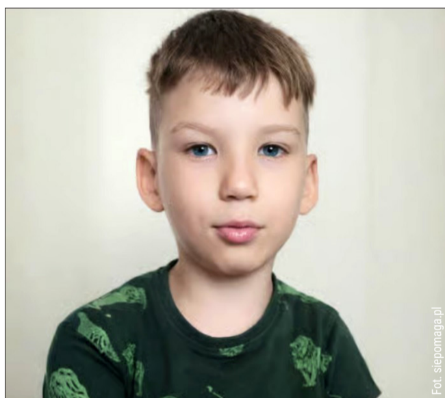
Ma siedem lat i walczy z rzadką chorobą. „Nie ma leku, jest tylko codzienna walka”.