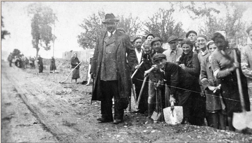
Żydzi na robotach przymusowych w okolicach Kolbuszowej; Październik 1940 r.

Na początku 1940 roku powstał Judenrat, który miał zarządzać sprawami Żydów w Kolbuszowej. W czerwcu 1941 roku utworzono getto, w którym warunki sanitarne były tragiczne. Głód i choroby były przyczyną wysokiej śmiertelności wśród mieszkańców getta.