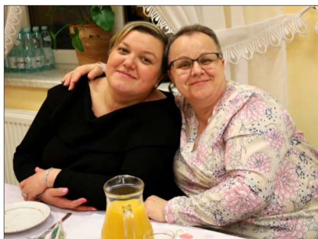
Gospodynie chętnie pozowały do zdjęć.