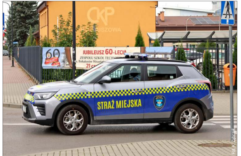
W Kolbuszowej trwa dyskusja nad przyszłością Straży Miejskiej.

W przypadku Kolbuszowej mówimy o trzyosobowym zespole. Decyzja o ewentualnej likwidacji oznaczałaby nie tylko reorganizację systemu bezpieczeństwa w gminie, ale także pytania o dalsze losy zatrudnionych strażników.