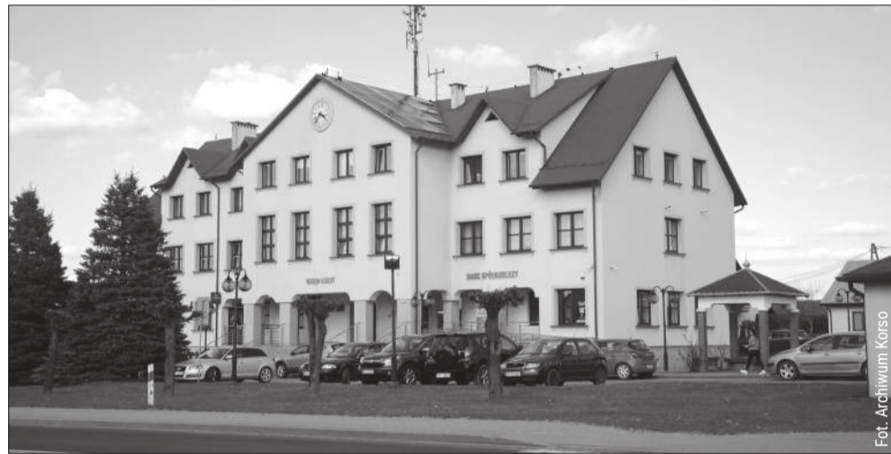
Radny Rady Miejskiej w Majdanie Królewskim był znany lokalnej społeczności.

Szczególnie mocno angażował się w życie swojej miejscowości – Brzostowej Góry. Jak wspomina zastępca wójta, był jednym z tych, którym szczególnie zależało na budowie miejscowej szkoły. To właśnie sprawy lokalnej społeczności były mu najbliższe.