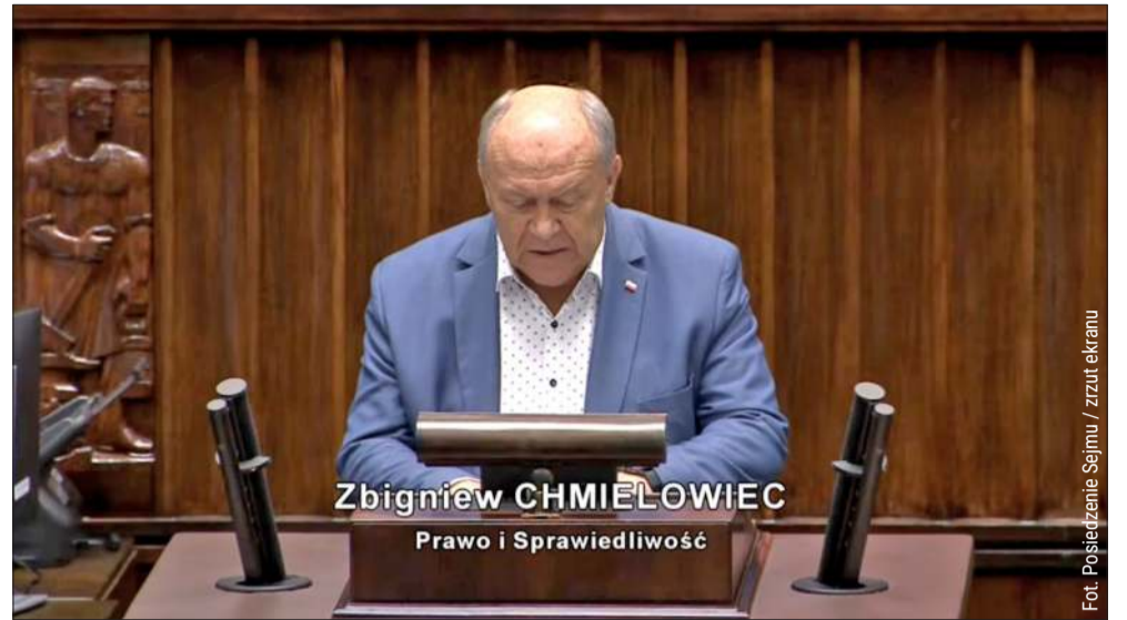
Głos z Kolbuszowej wybrzmiał w Sejmie. Chodzi o strażaków ochotników.

Pod wpisem posła pojawiły się komentarze strażaków z naszego regionu. Widać w nich wyraźne poparcie dla inicjatywy.