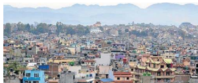
Katmandu liczy niecałe 900 tysięcy mieszkańców, natomiast obszar metropolitalny około 4 milionów

Tysiące mieszkańców tego regionu udały się do swoich do-