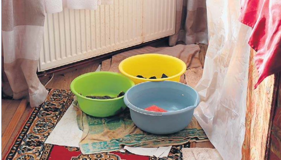
Rozstawione miski zbierające wodę w mieszkaniu przy ul. Wojska Polskiego

Mimo upływu roku czasu i licznych interwencji problem nie został rozwiązany. Lokatorka zapowiada, że nie odpuści