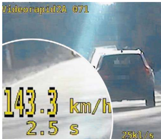
Na trasie pod Suchorzem kierowca pędził 143 km/h

Jedną z najważniejszych zmian jest rozszerzenie zasady zatrzymania prawa jazdy za przekroczenie prędkości o ponad 50 km/h. Dotychczas przepis ten obowiązywał głównie w obszarze zabudowanym. Od 3 marca sankcja w postaci zatrzymania prawa jazdy na trzy miesiące może zostać zastosowana również poza terenem zabudowanym - na drogach jednojezdniowych dwukierunkowych. Oznacza to, że kierowcy przekraczający znacznie dozwoloną prędkość także poza miastem muszą liczyć się z natychmiastową utratą prawa jazdy.