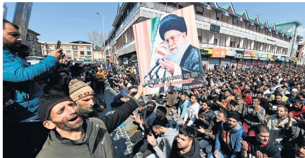
W sobotę w amerykańsko-izraelskim ataku zginął najwyższy przywódca duchowo-polityczny Iranu Ali Chamenei. Jego następcę ma wybrać Zgromadzenie Ekspertów