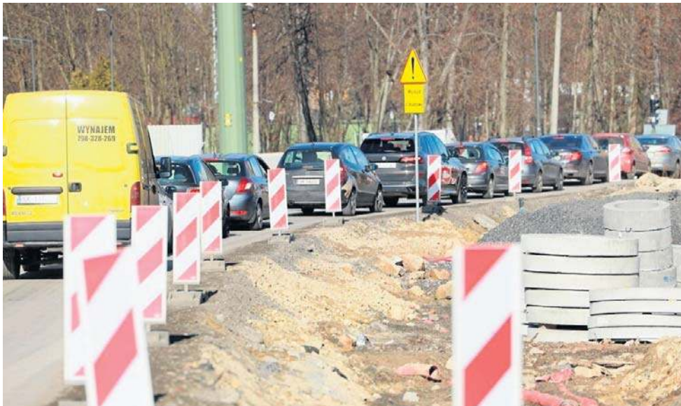
Dzięki dofinansowaniu w wysokości 121 mln zł na Pomorzu możliwa będzie budowa, przebudowa lub remont 125 km dróg, w tym 48 km dróg powiatowych i 77 km gminnych

Z kolei gmina Ustka pozyskała dofinansowanie - ponad 1,2 mln złotych - na budowę ulicy Siennej w Przewłocze wraz