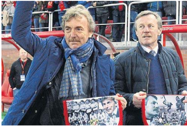
Zbigniew Boniek i Józef Młynarczyk w dniu otwarcia nowego stadionu Widzewa przy al. Piłsudskiego w Łodzi

- To, że kończę 70 lat, jakoś mnie specjalnie nie wzrusza. Z punktu widzenia mentalnego nic się nie zmieniło. Oczywiście, czasami, gdy człowiek wstanie, to kości bardziej trzeszczą. Ale to jest normalne. Moja „kilometrówka” - niestety - ma tak duży przebieg, tyle w życiu wybiegałem, że już dawno trzeba byłoby