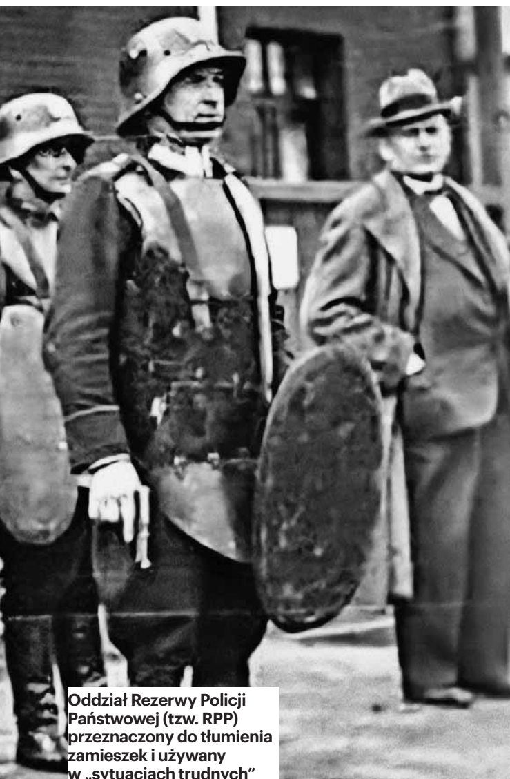
Oddział Rezerwy Policji Państwowej (zw. RPP) przeznaczony do tłumienia zamieszek i używany w „sytuacjach trudnych”