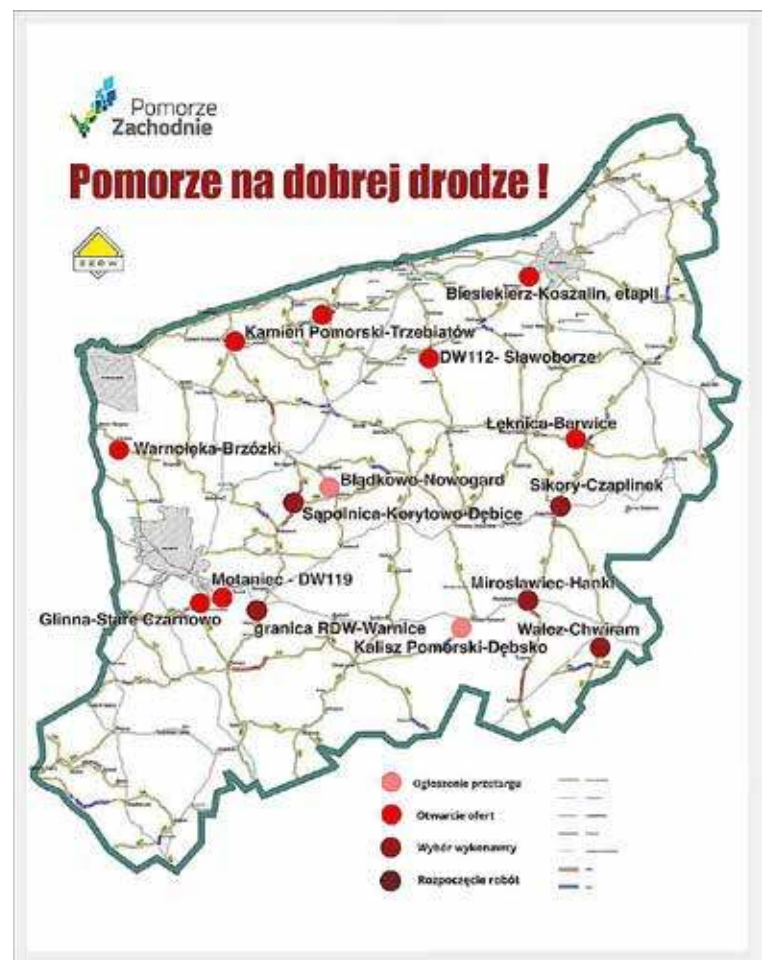
Mapa pokazująca bieżące zadania inwestycyjne