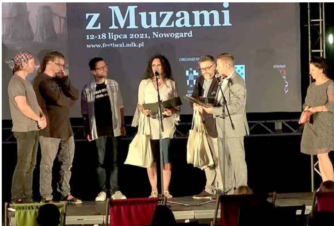
Final Festiwalu w 2021 roku

mienie z marszałkiem, które ma zabezpieczyć fundusze na przebudowę NDK. Żadne pieniądze nie trafiły jeszcze na konto gminy nie mówiąc o wyłonieniu firmy mającej zająć się przebudową NDK, czyli odbyciu jeszcze całej długotrwałej z natury procedury formalnej. Ale najistotniejsze- i obnażające naciągane argumenty burmistrza jest to, że festiwal nie wymaga koniecznie pomieszczeń NDK ponieważ jak wszyscy wiemy wiele jego edycji odbywało się głównie w plenerze a nawet jeśli coś musi być pod dachem to jest przecież np. wolne-wakacje - forum w SP nr 3.