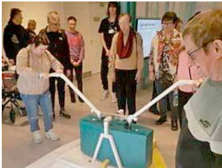
Wycieczka do Morskiego Centrum Nauki w Szczecinie pozostanie w pamięci na długo