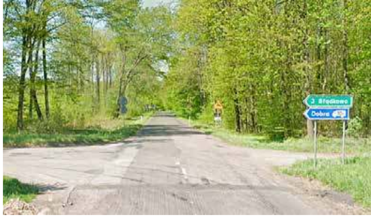
Przebudowany zostanie odcinek drogi od skrzyżowania DW 144 do Błądkowa w stronę Wierzbęcina

Drugim przykładem inwestycji wojewódzkich na drogach w granicach gminy Nowogard jest przebudowa DW 106 na odcinku Sapolnica – Dębice. W tym przypadku przetarg ogłoszony został już na począt-