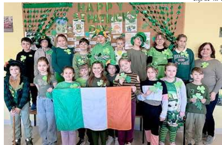
W trakcie celebracji Dnia św. Patryka nie mogło zabraknąć koloru zielonego i flagi Irlandii