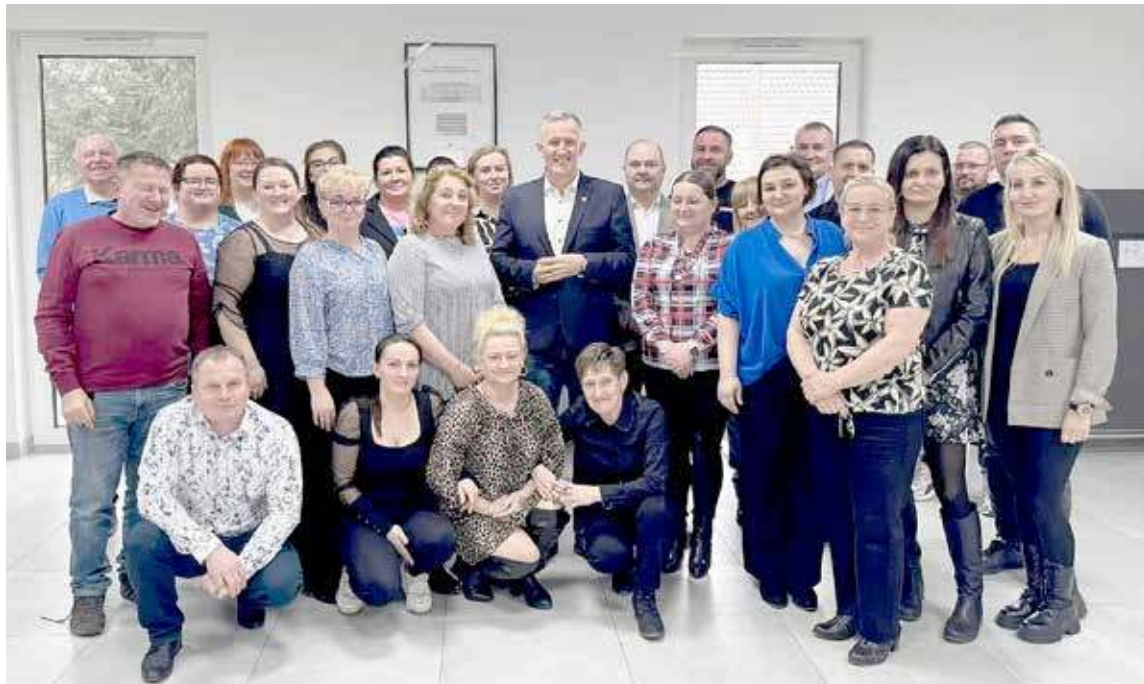
Wspólne zdjęcie uczestników spotkania