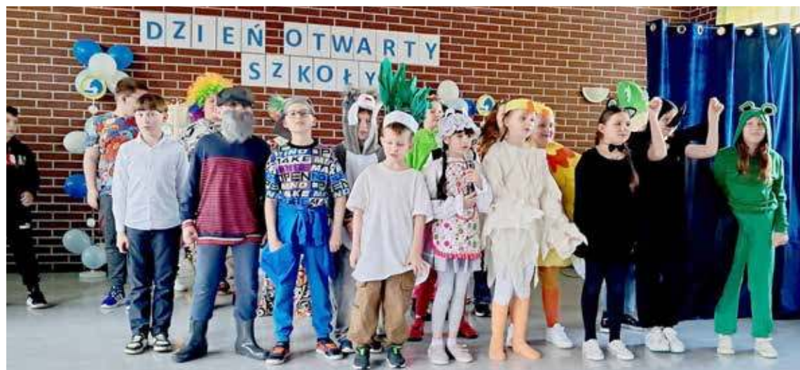
Uczniowie SP nr 4 mieli okazję gościć w progach szkoły przyszłych pierwszoklasistów

Inf. SP nr 4 Izabela Tas, Wioletta Krugly