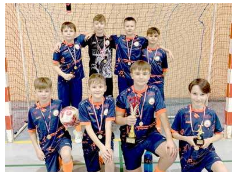
Drużyna już po dekoracji