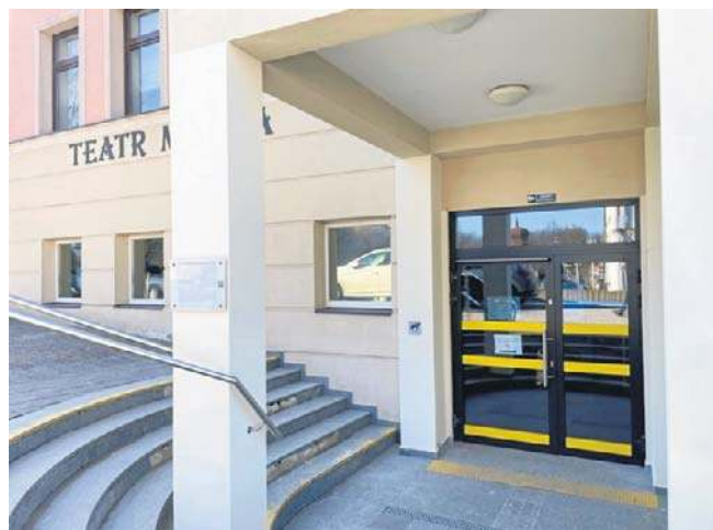
Dzięki unijnemu wsparciu w teatrze zamontowano automatyczne drzwi do budynku

W trakcie organizacji jest także mobilny pokój wyciszeń. Będzie to przestrzeń nie tylko dla osób ze specjalnymi potrzebami, ale także dla tych, którzy czują się przebodźcowani. Będą mogli w tym miejscu odpocząć. ©©