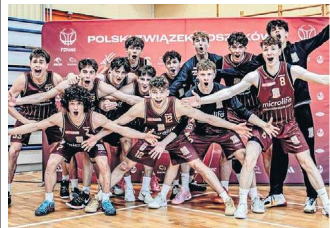
Koszykarze pempaVita Resovii dzielnie walczyli w sopockim turnieju i wrócili do Rzeszowa w dobrych nastrojach

Punkty: pempaVita Resovia: Musiałek 7,23 (4x3, 9 zb., 8 as.), 5 (1x3), 17 (2x3), Jędrzejczyk 6 (12 as.), 7 (1x3, 6 as.), 2 (5 as.), 2, Żydzik 18 (2x3, 7 zb.), 13 (1x3), 8 (2x3), 9, Ząbczyk 10 (1x3, 8 zb., 6 as.), 24 (6 zb.), 4 (5 as.), 16 (1x3, 9 as., 8 prz.), Boruciński-Hrycyk 19 (1x3), 2, 9 (1x3), 12, oraz Mikosz 4, 11 (7 zb.), 4 (7 zb.), 2, Mrówczyński 4, 15 (6 as.), 7 (1x3), 24 (4x3, 8 as., 7 zb.), Terlecki 5 (1x3), 3 (1x3), 6, Żukowski 0, 7 (1x3), 4 (3 prz.), 6, Gil 0, 0, 14 (2x3), Kuzniar -, 0, 0, 4, Matusiewicz 0, 2, 3 (1x3), 0, Skowron, -, -, -, 2.