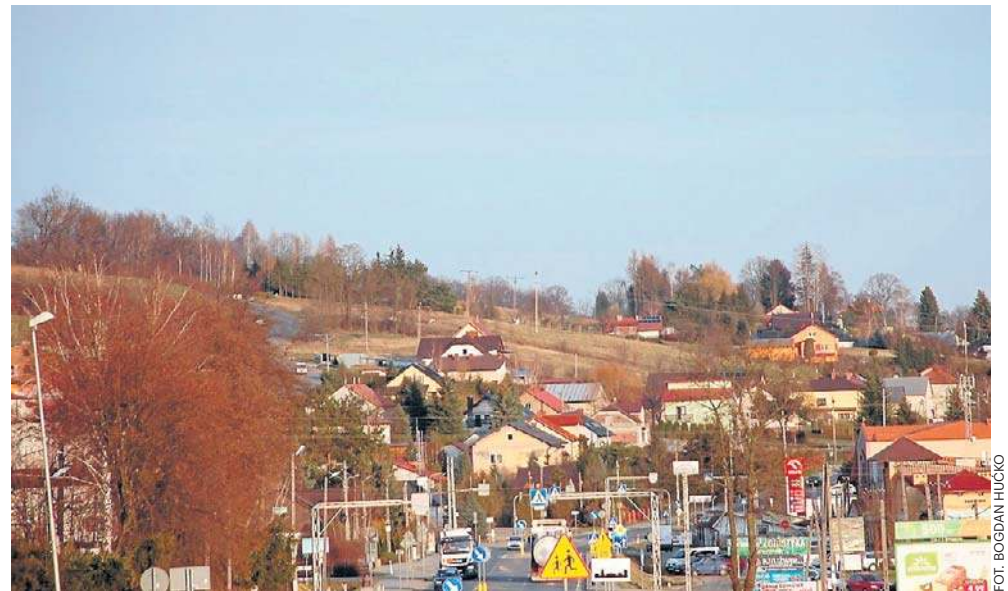
Ograniczenie sprzedaży napojów alkoholowych w godzinach nocnych obowiązuje na terenie sołectwa Skołyszyn (powiat jasielski)

Zakaz nocnej sprzedaży alkoholu, zgodnie z podjętą przez radę gminy uchwałą, obowiązuje tylko na terenie sołectwa Skołyszyn, w którym na koniec