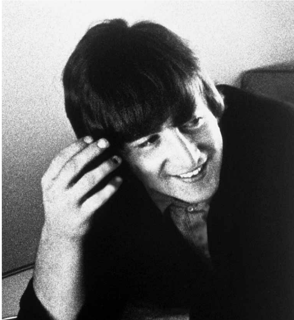
Po przylocie zespołu do Stanów 11 sierpnia John Lennon – wyraźnie zdenerwowany – oficjalnie przeprosił za swoje słowa

Cofnijmy się do początków 1966 r. Beatlesi cieszyli się już statusem światowego giganta muzyki młodzieżowej. Grupa miała już na koncie sześć płyt, była już także po premierze nominowanego do Oscara filmu „A Hard Day's Night”. Rok wcześniej na rozdaniu nagród Grammy Brytyjczycy zgarnęli statuetkę dla „Najlepszego Nowego Artysty”, a w marcu 1966 r. zapisał się w historii jako