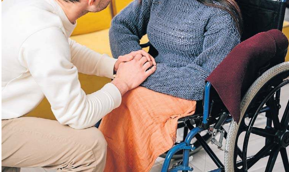
Przemysł, jako jeden z nielicznych samorządów w województwie podkarpackim, nie dostanie pieniędzy w ramach rządowego programu „Opieka wytchnieniowa”

- Zdecydowanie taka pomoc jest w Przemyslu potrzebna.