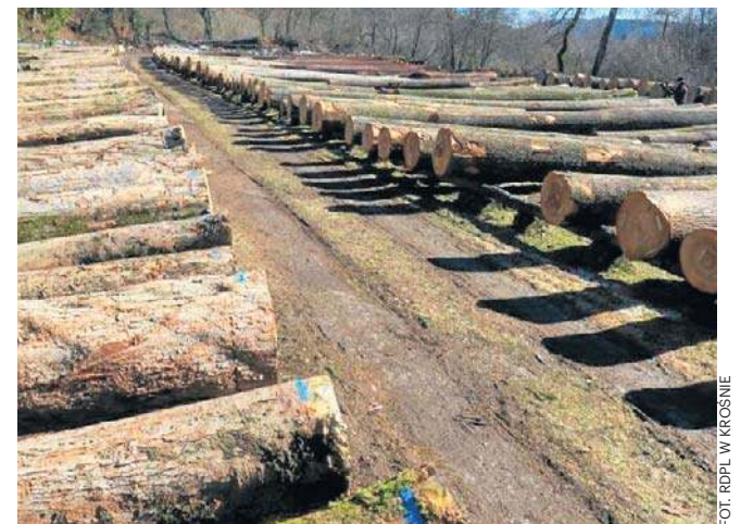
Wśród oferowanych gatunków dominował dąb, modrzew oraz jawor

W przetargu wzięło udział 19 firm z Austrii, Czech, Słowacji, Rumunii, Włoch oraz Polski. Oferty cenowe zostały komisyjnie otwarte w biurze Nadleśnictwa Brzozów, a o zwycięstwie zdecydował program komputerowy wskazujący najwyższą kwotę za konkretną kłodę. Średnia cena