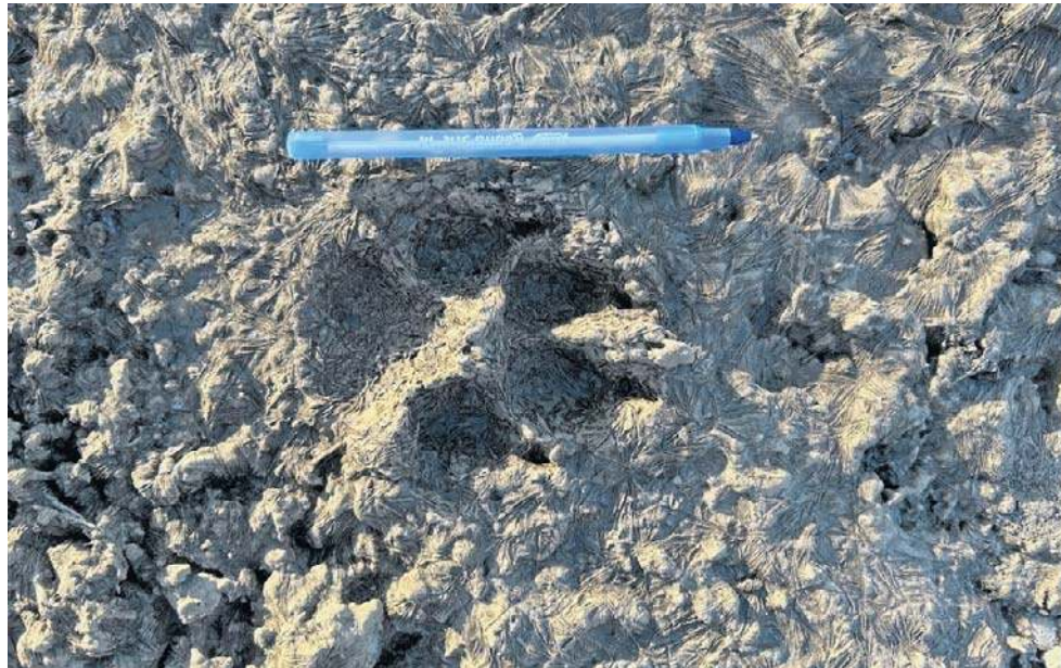
Ślady łap jednoznacznie wskazują, że biegacz spotkał na swojej trasie wilki

- W świetle latarki - czołówki, którą miałem na głowie, żarzyły się dwie pary oczu. W odległości ok. 10 metrów ode mnie zobaczyłem dwa okazałe wilki. Dosłownie wbiegłem na nie. Stały niemal nieruchomo i spokojnie się we mnie wpatrywały. Jakby były zaskoczone, a może zaciękawione moją obecnością. Po chwili schyliłem się po ka-