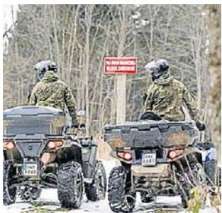
Cudzoziemcy zostali zatrzymani przez SG

Ukraińiec nielegalnie przekroczył granicę polsko-ukraińską w Bieszczadach. Przyjechał po niego rodak, który - jak się szybko okazało - przebywał w Polsce nielegalnie.