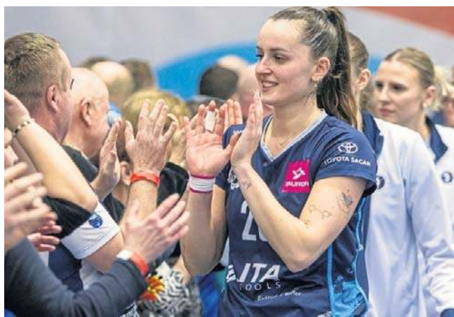
Mieleckie siatkarki cieszyły się w weekend ze zgarnięcia ważnych trzech punktów, które przybliżyły ich do „8”

Mielczanki będąc faworytkami musiały się mocno zmobilizować, żeby nie dać plamy w meczu z ligowym outsiderem. Początek pierwszego seta nie był dla ITA TOOLS Stali łatwy. Miejscowe prowadziły 7:4, ale potem przy lepszej grze w przyjęciu i w ataku odrobiły nieznacznie stratę i same wyszły na prowadzenie. Dobrze działał atak i blok Stali. Dzięki temu Stal mogła powiększać przewagę i zdecydowanie wygrać tego seta. Początek drugiego zwiastował prędkie zwycię-