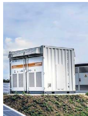
Są pieniądze na budowę magazynów energii

dla dużych podmiotów oraz 60 proc. dla pozostałych kategorii firm. Wnioski będą przyjmowane wyłącznie w formie elektronicznej; nabór rozpocznie się 3 marca 2026 r. i potrwa do 31 marca br. Zainteresowani naborem będą mogli skorzystać ze szkolenia, które zaplanowane zostało na 9 marca br. w siedzibie urzędu marszałkowskiego w Rzeszowie. Rejestracja na szkolenie odbywa się poprzez formularz zgłoszeniowy na stronie programu regionalnego Fundusze Europejskie dla Podkarpacia. (HUK/PAP)