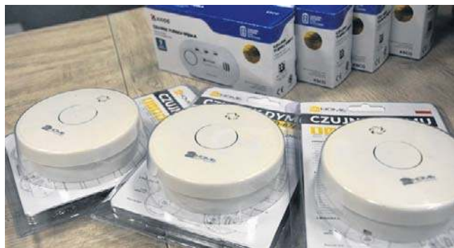
Montaż czujek to wspólna akcja Gminy Przeworsk i KP PSP w Przeworsku