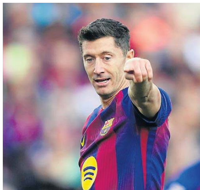
Kapitan reprezentacji Polski Robert Lewandowski zdobył jedenastą bramkę w obecnym sezonie La Ligi

W hiszpańskiej La Lidze lider rozgrywek, Barcelona, pokonała na własnym stadionie Vil-