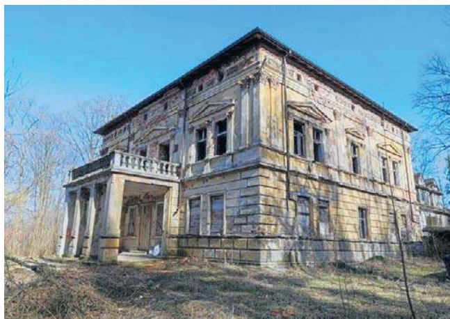
Pałac, wzniesiony w stylu eklektycznym, do dziś przyciąga uwagę detalami architektonicznymi