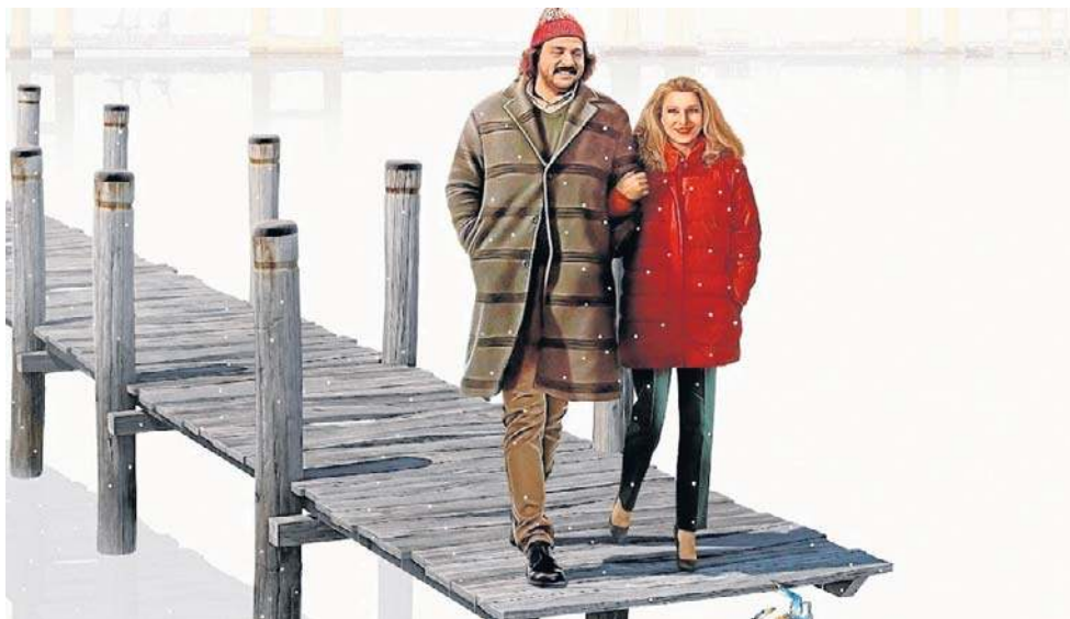
Komediodramat „Oszołomy z Baltimore” to jedna z propozycji Przeglądu Niezależnego Kina Amerykańskiego

5 marca, o g. 18: „Natchez” (reż. Suzannah Herbert), dokument odślanający złożoną historię miasteczka Natchez w stanie Missisipi, gdzie turystyczny urok kontrastuje z dziedzictwem niewolnictwa i trudną przeszłością Południa. Film