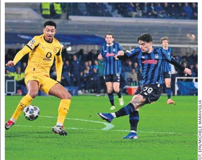
Nicola Zalewski w 1/8 finału Champions League sprawdził wraz z kolegami z Atalanty - formę Bayernu Monachium