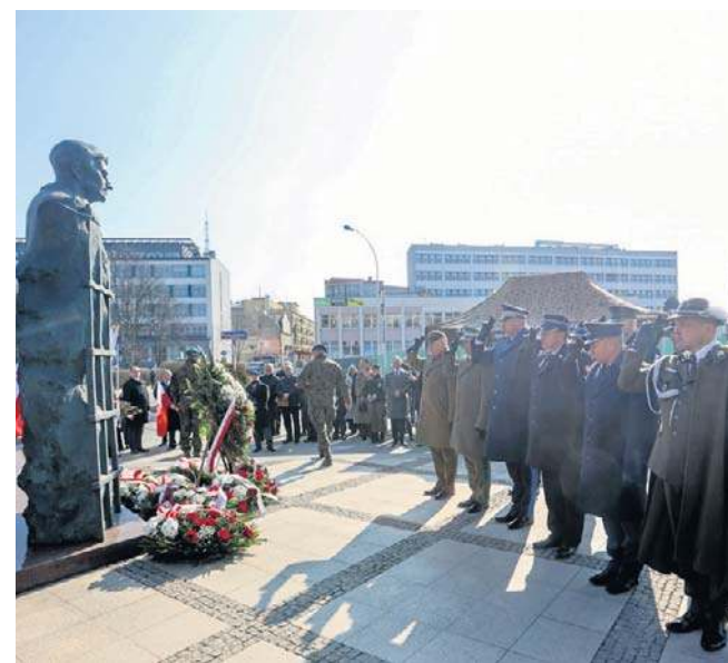
W niedzielę w Rzeszowie - oraz wielu miastach regionu - oddano hołd bohaterom antykomunistycznego podziemia, którzy po II wojnie walczyli o wolną Polskę. Przed Pomnikiem Pamięci Żołnierzy Wyklętych odczytano apel pamięci, złożono kwiaty i wieńce.