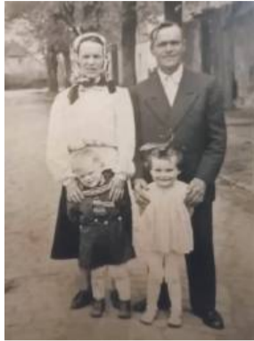
Rodzice pani Agnieszki z wnuczkami na głównej ulicy w Borku Strzeleńskim. Fot. archiwum rodzinne poszedł zarejestrować, że chce tam, bo to piechotą poszedł do Strzelina, to już się okazało, że zajęte było. To my poszli tu na zakręcie mieszkać – tu, gdzie fryzjer teraz.

- Stamtąd to już do Strzelina. W Strzelinie przyjechały wozy – furmanki i tak rozwozili po wsiach. Najpierw trafiliśmy tu, do Borka, do tego domu na początku wsi [od strony Wrocławia – red.], ale tam tak wszyscy na kupie byli. Potem przenieśliśmy się tu, gdzie pani sołtys teraz, niedaleko krzyża. Ale zanim tato