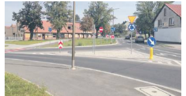
Radni pozytywnie odnieśli się do pomysłu nadania nazwy Solidarności dla nowego ronda u zbiegu ulic Wrocławskiej, Wolności i Oławskiej w Strzelinie

GRUPA MACTERM Profesjonalne izolacje budynków