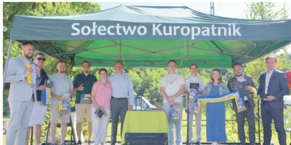
Podczas wydarzenia uhonorowano osoby zaangażowane w działalność klubu Gromnika Kuropatnik

W sobotę, 14 czerwca, na stadionie im. Kazimierza Piotrowicza w Kuropatniku odbyło się wyjątkowe wydarzenie – Dzień Kuropatnika połączony z obchodami 80-lecia istnienia klubu piłkarskiego – Gromnika.