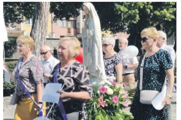
W pochodzie niesiono figurę Matki Bożej Fatimskiej