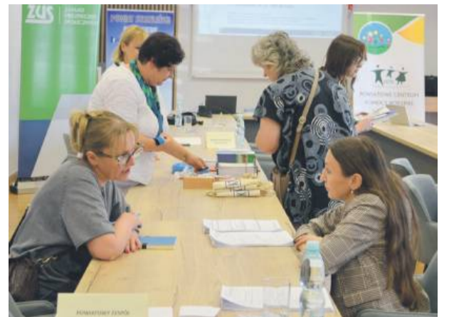
W połowie czerwca w sali obrad strzelińskiego starostwa powiatowego odbyło się spotkanie w ramach „Dni Osób z Niepełnosprawnościami 2025”.

Czym i dla kogo jest świadczenie wspierające? – To nowe wsparcie finansowe dla osób z niepełnosprawnościami, które ukończyły 18 lat – wyjaśnia dyrektor strzelińskiego PCPR-u. – To świadczenie przysługuje niezależnie od dochodu oraz innych form pomocy, które dana osoba już otrzymuje. Aby otrzymać świadczenie, nie wystarczy samo orzeczenie o stopniu niepełnosprawności. Osoba zainteresowana musi uzyskać specjalną decyzję wojewódzkiego zespołu ds. orzekania o niepełnosprawności (WZON), która określi poziom potrzeby wsparcia w skali punktowej. Świadczenie przysługuje tym, którzy uzyskali od 70 do 100 punktów w tej skali. Krok po kroku: najpierw trzeba uzyskać decyzję o poziomie potrzeby wsparcia z WZON. Wielu mieszkańców naszego powiatu pobiera druki wniosku potrzebnego do uzyskania ww. decyzji z Powiatowego Zespołu Orzeka-