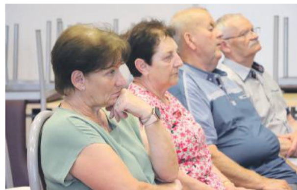
Mieszkańcy gminy Przeworno chętnie uczestniczą w spotkaniach Klubu Piastowskiego „Myśląc Polska”, gdzie nie brakuje ważnych tematów i żywej dyskusji

Od refleksji filozoficznej duchowny przeszedł do konkretnego – działalności opo-