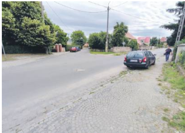
Ten samochód jeszcze kilkanaście dni temu stał od ponad roku na ul. Staromiejskiej, niedaleko sklepu i utrudniał ruch w obrębie tego skrzyżowania. Po naszej publikacji został zabrany

jących od dawna na poboczu. Pojazdy te były wręcz zapomniane: jeden z nich stał bez powietrza w kołach od kilku lat, ogranicza-