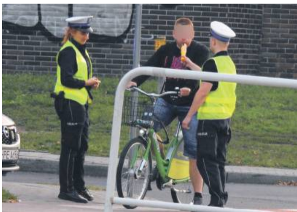
Policja kontroluje rowerzystów. Fot. ilustracyjne

– Za jazdę w stanie po spożyciu (od 0,2 do 0,5 promila) grozi mandat w wysokości minimum tysiąca złotych. W stanie nietrzeź-