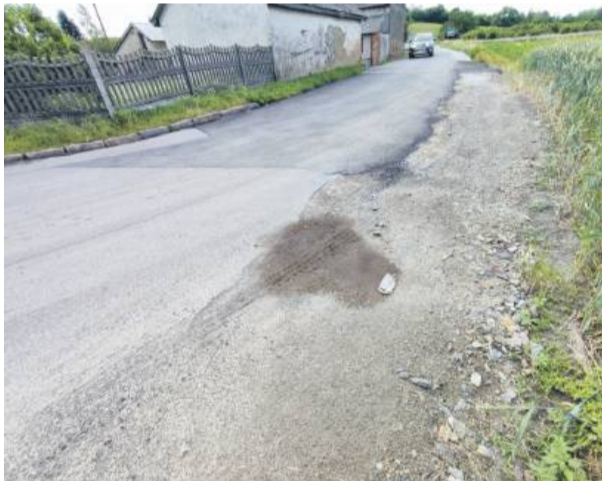
A tak wygląda po wymianie asfaltu i utwardzeniu pobocza

Realizując interwencję, zarządca drogi sfrezował