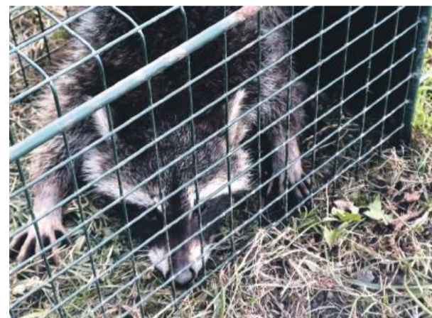
Rok temu sołtysowi udało się złapać do klatki szopa