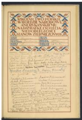
Pamiątkowy dyplom z okazji 150-lecia niepodległości USA z podpisem m.in. Konstantego Klimaszewskiego

Uroczyste obchody 80-lecia szkoły nr 1 odbędą się w czwartek, 18 września, w auli Liceum Ogólnokształcącego. Wszystkich zainteresowanych organizatorzy zapraszają na godz. 13, a w programie przewidziano m.in.