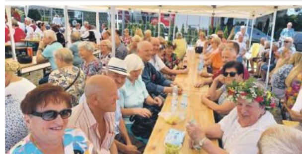
W wydarzeniu udział wzięło wielu mieszkańców

W Strzelinie upamiętnią 45. rocznicę powstania Solidarności