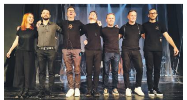
Muzycy po występie w SOK-u zaprezentowali się widzowi