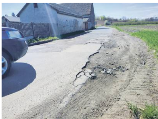
Tak wyglądała droga w opisywanym miejscu przed remontem...