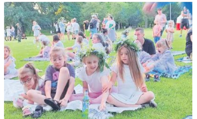
Wieczorne wydarzenia szczególnie podobały się dzieciom

Akcja charytatywna na rzecz Patryka przyniosła ponad 7 000 zł wsparcia, co potwierdziło ogromne