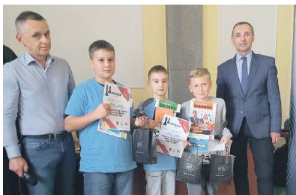
Najlepsi otrzymali puchary

Strzeńskiego 2024/2025 – prestiżowe rozgrywki szachowe, które już na stałe wpisały się w kalendarz szkolnych wydarzeń sportowych regionu. Finałowy turniej rozegrano 10 czerwca, wieńcząc rok pełen emocji, intelektualnych wyzwań i sportowej rywalizacji. W zmaganiach, które odbywały się cyklicznie przez cały rok szkolny, udział wzięło wielu zawodników, co przełożyło się na imponującą