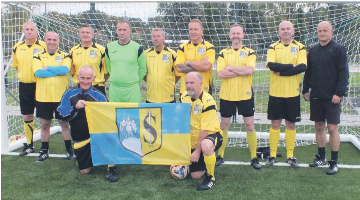
W Strzelinie rywalizować będą doświadczeni piłkarze