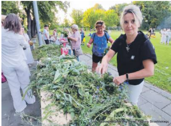
Wianki pomagały pleść animatorki z SOK-u

- Zespół LOVE DANCE, który rozkręcał publiczność, angażując uczestników do wspólnej zabawy tanecznej; - Spektakularny pokaz