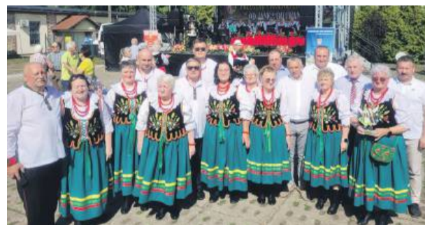
Zespół Złotokłose na pamiątkowym zdjęciu z zaproszonymi gośćmi