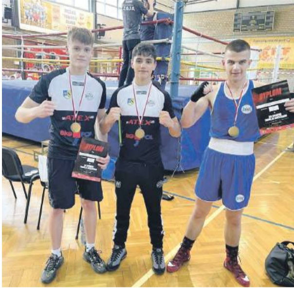
Pięściarze ze Strzelina walczyli w Oławie