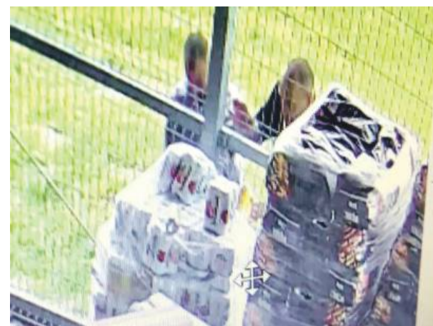
Monitoring sklepu okazał się kluczowy w ustaleniu sprawców.

przewieziony do komendy celem wytrzeźwienia. Dzień później zatrzymano drugiego podejrzanego – 29-latkę z naszego powiatu. Po wytrzeźwieniu obaj usłyszeli zarzuty kradzieży z włamaniem. Choć wartość skradzionych napojów nie była duża, zniszczenia w ogrodzeniu oraz sposób działania sprawców sprawiają, że sprawa ma poważny charakter. Policja