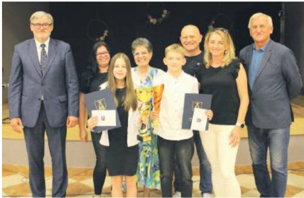
Na sesji uhonorowano młodych sportowców

Następnie wójt Grochowski przedstawił raport o stanie gminy za 2024 rok. W ubiegłym roku gmina zrealizowała dochody w wysokości ponad 33,3 mln złotych, z czego ponad 3,1 mln złotych to dochody majątkowe. Głównymi źródłami dochodów były subwencje do budżetu państwa – ponad 10,9 mln złotych, wpływy z podatku dochodowego od osób fizycznych – 5,2