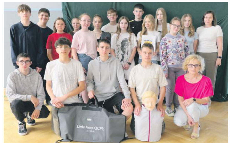
Część uczniów zielenickiej szkoły, która brała udział w programie „Bezpieczny Dolnoślązak”