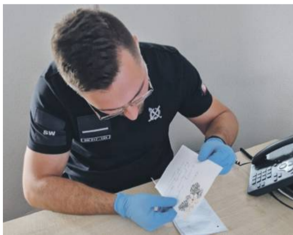
Po dokładnym sprawdzeniu okazało się, że list nasączony jest nieznaną substancją. Przeprowadzone badanie przy użyciu narkotestu wykazało obecność ABP