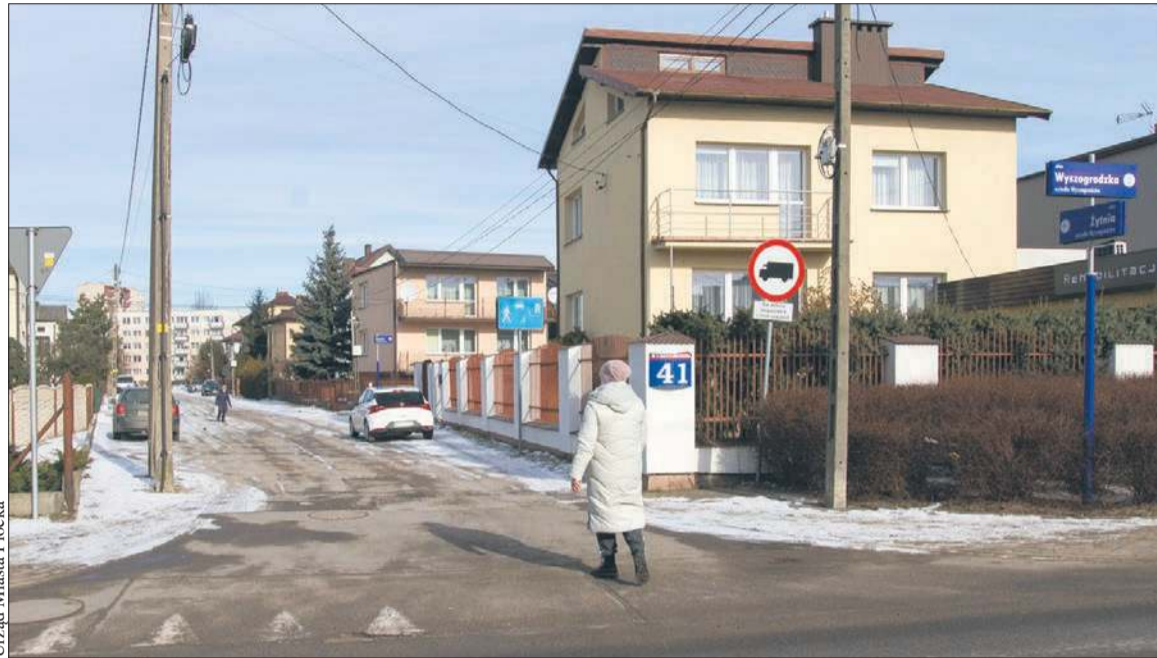
Urząd Miasta Płocka