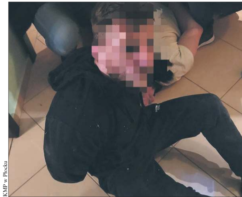
Zdjęcia z zatrzymania złodziejskiej szajki przez policjantów

Jak ustalili policjanci, obaj byli poszukiwani celem odbycia kary pozbawienia wolności. 45-latek w listopadzie nie powrócił z przepustki do zakładu karnego, gdzie odbywał karę za kierowanie pojazdem pomimo są-