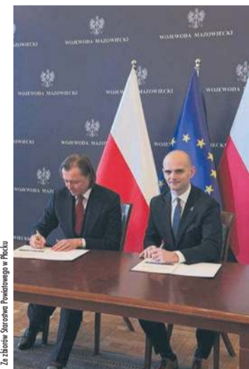
Z. Grabiec / Starostwo Powiatowe w Płocku

W ramach rządowego programu Fundusz Rozwoju Przewozów Autobusowych powiaty i związki powiatowo-gminne w województwie mazowieckim podpisały 44 umowy na łączną kwotę ponad 91,6 mln zł. To dodatkowa pula środków przeznaczona na dofinansowanie przewozów autobusowych o charakterze użyteczności publicznej w województwie mazowieckim. Dzięki podpisanym umowom środki zostaną przeznaczone zarówno na uruchomienie nowych połączeń, jak i na utrzymanie już funkcjonujących linii. Łącznie dofinansowanie obejmie 524 linie komunikacyjne.