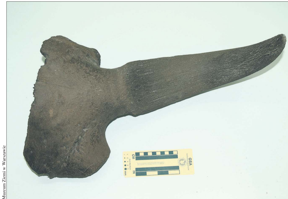
Muzeum Ziemi w Warszawie