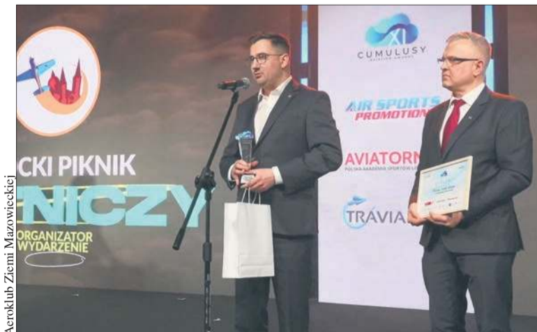
Organizatorzy Płockiego Pikniku Lotniczego 2025 z nagrodą „Błękitny Cumulus 2025”