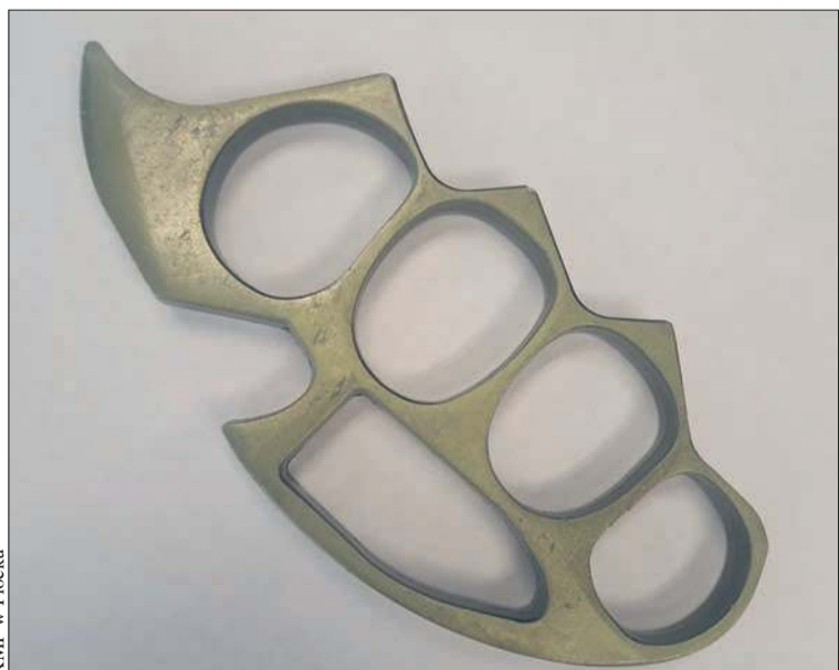
Przyjście do szkoły z kastetem skończy się dla piętnastoletniego ucznia jednej z płockich szkół wizytą w sądzie