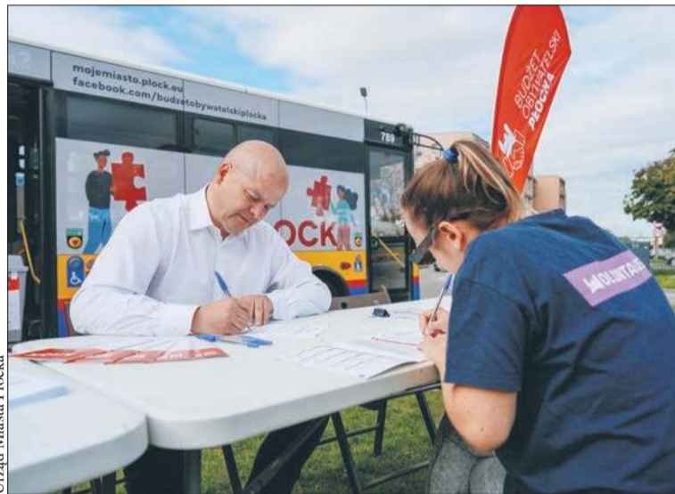
Prezydent Płocka Andrzej Nowakowski zachęca mieszkańców miasta do zgłaszania projektów w 15. edycji Budżetu Obywatelskiego Płocka

Pierwszy z nich to projekty ogólnomiejskie (muszą one dotyczyć potrzeb mieszkańców więcej niż jednego osiedla), a także projekty dotyczące jednostek organizacyjnych miasta takich jak: przedszkola, szkoły podstawowe, zespoły szkół, szkoły ponadpodstawowe, poradnie psychologiczno-pedagogiczne, szkoły specjalne, placówki