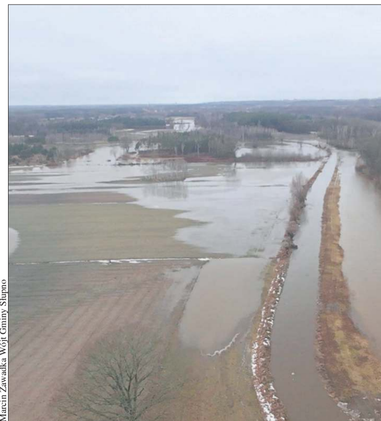
Tak wyglądała okolica Słupianki w poniedziałek, 23 lutego