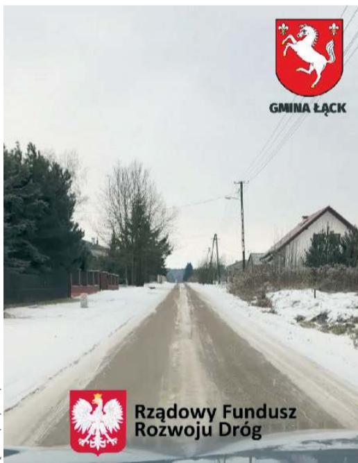
Zdjęcie z 18 lutego 2026 roku