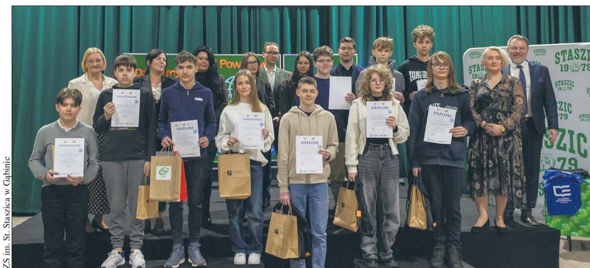
ZS im. St. Staszica w Gąbinie

Czy rodzic ma prawo publikować wizerunek swojego dziecka bez ograniczeń? Czy sztuczna inteligencja to pomoc w nauce, czy już forma oszustwa? I dlaczego „idealne życie” z mediów społecznościowych potrafi tak mocno uderzyć w psychikę młodych ludzi? Między innymi na te pytania szukano odpowiedzi podczas IX Powiatowego Dnia Bezpiecznego Internetu w Zespole Szkół im. Stanisława Staszica w Gąbinie. Wydarzenie po raz kolejny pokazało, że temat bezpieczeństwa w sieci nie jest już dodatkiem do szkolnej profilaktyki, ale jednym z kluczowych wyzwań współczesnej edukacji.