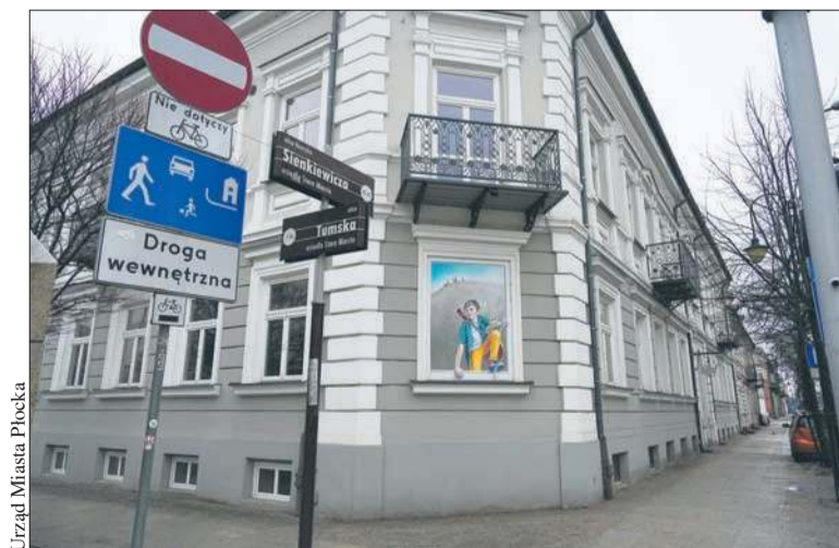
Urząd Miasta Płocka