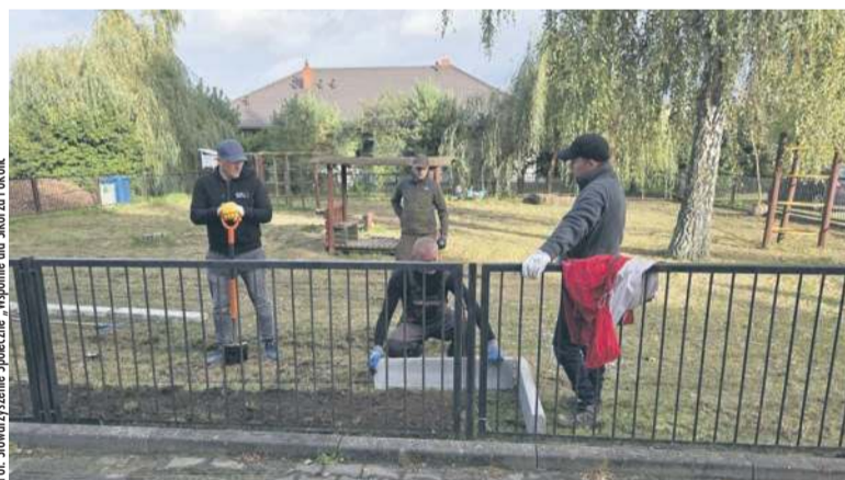
„BotanIQ – Ekoogród społeczny” to jeden z projektów zrealizowanych w 2025 roku przez Stowarzyszenie Społeczne „Wspólnie dla Sikorza i Okolic”

Stowarzyszenie aktywnie pozyskuje różnego rodzaju środki zewnętrzne i granty na organizowanie wydarzeń w całej gminie. Jednym z nich w ubiegłym roku była dofinansowana przez Urząd Marszałkowski Województwa Mazowieckiego „Kulturalna edukacja z Janem Kochanowskim”. Było to w sumie 60 godzin warsztatów animacyjno-muzycznych, teatralnych i kreatywnych, zakończonych Narodowym Czytaniem dzieł Jana Kochanowskiego. - To był