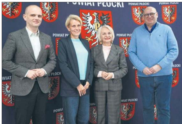
Z. Grabiec / Starostwo Powiatowe w Płocku