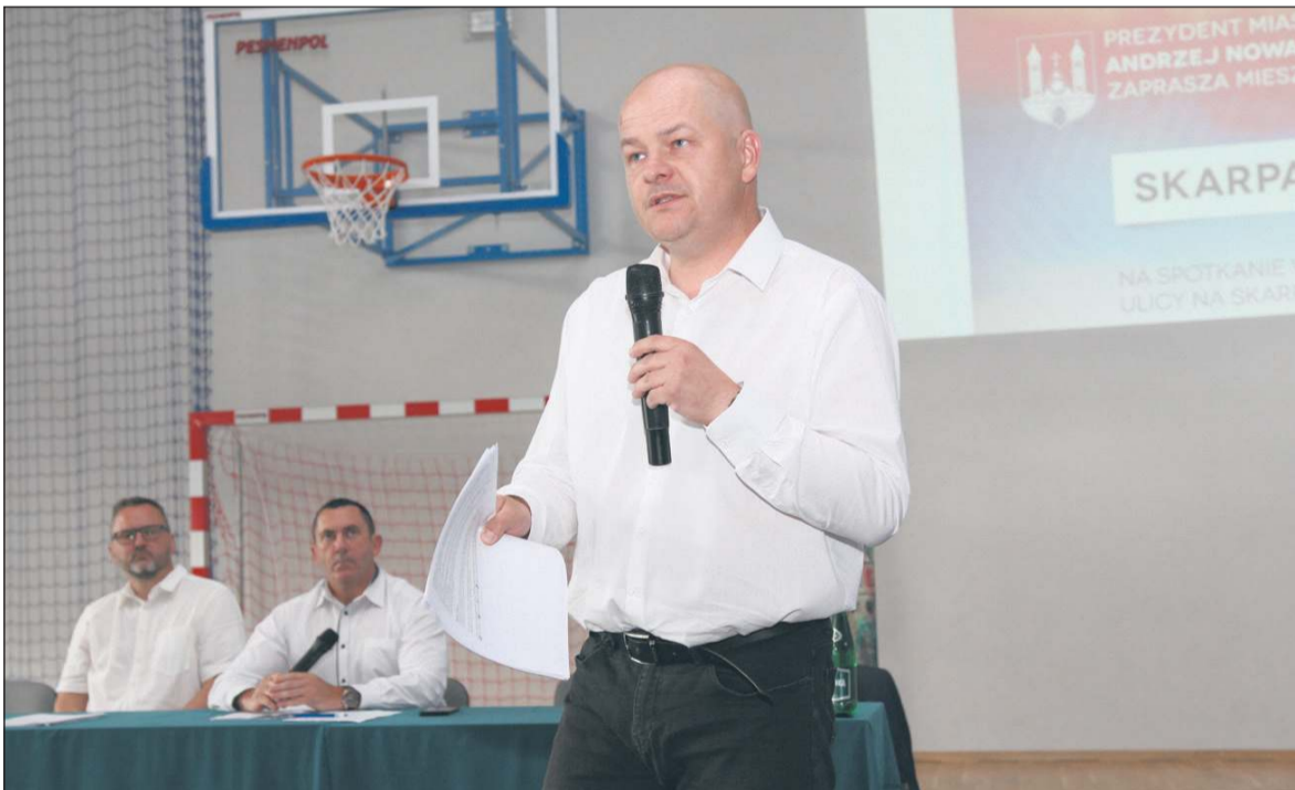
O planowanych przedsięwzięciach na osiedlu Skarpa prezydent Andrzej Nowakowski i jego współpracownicy rozmawiali na spotkaniach z mieszkańcami

drzewa oraz krzewy w rabatach, które wpiszą się w charakter tego miejsca i klimat jaru Brzeźnicy. Teren zostanie oświetlony, zamontowane będą ławki, kosze na śmieci i stojaki rowerowe. Całość posłuży rekreacji. W budżecie Płocka jest 1,5 mln zł na dokończenie „Parku nad jarem”. W planach samorząd ma też rewitalizację „Parku na Zdunach” u zbiegu ul. Kazimierza