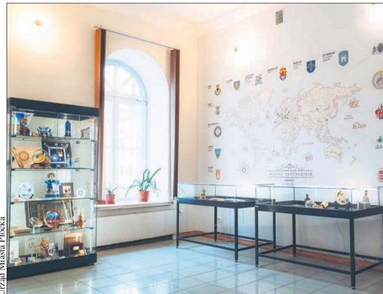
Urząd Miasta Płocka