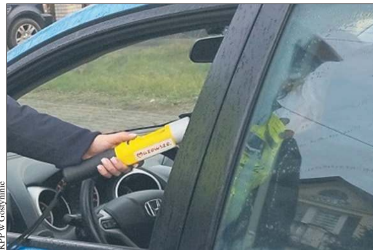
KPP w Gostyninie

Kobietę czekają również konsekwencje za kierowanie pojazdem bez wymaganych uprawnień oraz prowadzenie po-