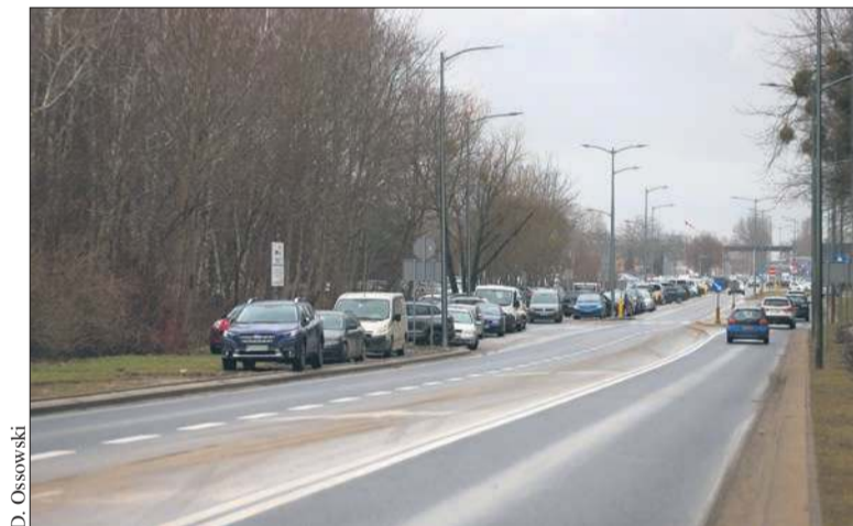
Znalezienie wolnego miejsca parkingowego w okolicach bramy nr 2 to prawdziwe wyzwanie

Trudno się z nimi nie zgodzić. Straż Miejska ma swoje obowiązki i je wypełnia, a kierowcy, dla których zabrakło miejsc, ryzykują, parkując w niedozwolonym miejscu. Czytelniczka dodaje, że największy problem mają ci, którzy nie mogą przesiąść się do