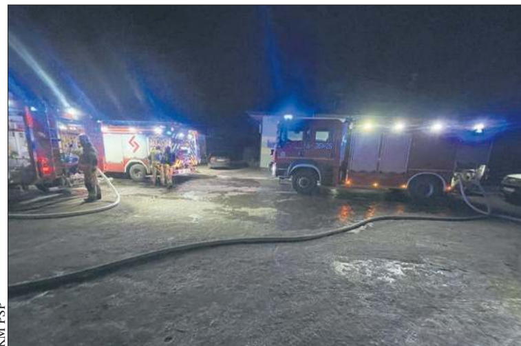
Pożar warsztatu mechanicznego w Ślepkowie Szlacheckim

W gminie Sierpc agresywny wnuczek szarpał własnego dziadka i uderzył kuzyna