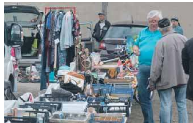
Najbliższy pchli targ już 26 lipca

Pchli targ odbędzie się jak zwykle na parkingu między ul. Sienkiewicza, Sobieskiego i Strzelecką w Tarnowskich Górach. Rozpocznie się o godz. 8 i potrwa do godz. 12. Wystawianie swoich rzeczy jest całkowicie darmowe – nie ma ani za-