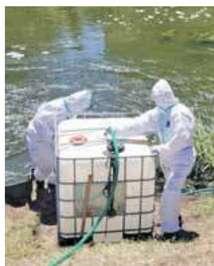
Na miejsce skierowano 5 Pułk Chemiczny z Tarnowskich Gór

Wojewoda śląski wydał za- kaz korzystania do końca lipca z Kłodnicy na odcinku od Małej Elektrowni Wodnej w Pławniowicach do granic województwa śląskiego. W wodzie pojawiły się złote algi. Zapadła też decyzja o po- dawaniu nadtlenu wodoru, co ma ograniczyć ich liczebność.