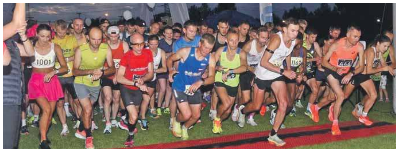
Na starcie obu biegów pojawiło się 1 237 biegaczy

W sobotę, 19 lipca, odbyły się 6. PKO Piekarski Półmaraton i Nocna ZaDyszka. Zanotowano rekord uczestników, na starcie obu biegów pojawiło się 1 237 biegaczy.