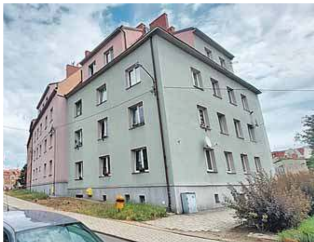
Zmieniła się także szacowana kwota, jaką miasto chciało przeznaczyć na zapłatę. Początkowo był to niespełna milion złotych, potem 1 mln 54 tys. zł

Już w trakcie trwania przetargu wydłużono o jeden