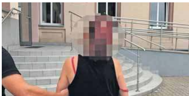
O przestępstwa narkotykowe podejrzane są dwie tarnogórzanki

Policjanci przeszukali mieszkanie i znaleźli metamfetaminę. Kobiety w wieku 29 i 31 lat oraz 36-latek trafili do policyjnej celi. Później były przesłuchania, sprawą zajęła się prokuratura.