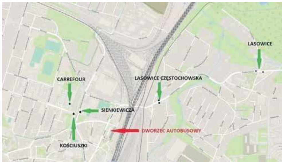
Nowe przystanki dla GTV Bus

Czy tak będzie? Problem korzystania przez GTV Bus z dworca autobusowego jest od dawna. Wszystko zaczęło się w momencie, kiedy były już burmistrz Miasteczka Śląskiego Michał Skrzydło próbował zmienić operatora transportu w mieście – z ZTM na GTV Bus. Wtedy zaczęła być mowa o tym, że dworzec dla GTV Bus będzie niedostępny. ZTM tłumaczył się m.in. tym, że rozbudowuje siatkę połączeń i na tarnogórskim dworcu po prostu brakuje już miejsca. Z drugiej strony pojawiły się głosy, że chodzi o utrudnianie życia konkurencji.