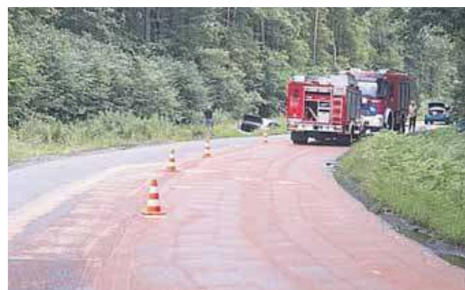
Substancję, z powodu której dwa auta wpadły do rowu, usunęli strażacy z OSP Połomia

danie blisko 2 tysiące działek narkotyku. Zostały objęte policyjnym dozorem, grozi im do 10 lat więzienia. (ESP)