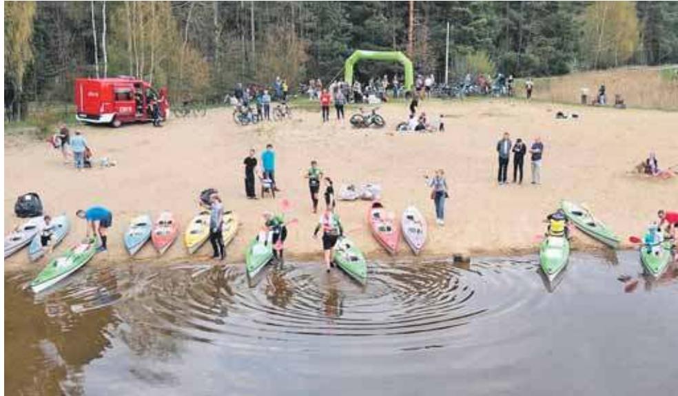
W Kaletach odbędzie się piąta edycja Zielonego Triathlonu Turystycznego