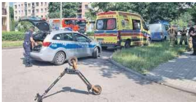
Chłopak został odwieziony do szpitala z urazem klatki piersiowej i kostki

„Poruszając się po chodniku, nie zachował ostroż-