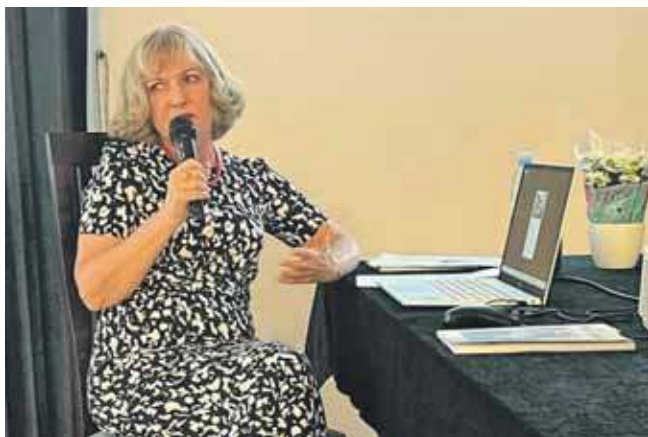
Autorka podczas niedzielnego spotkania w Centrum Kultury Śląskiej w Nakle Śląskim zachęcała gości do spisywania rodzinnych historii