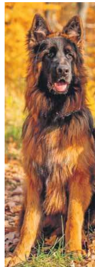
Bono był operowany, ale nie udało się go uratować

Zabezpieczył nagrania z kamer, które przekazuje policji. Prosi też o kontakt wszystkich, którzy widzieli coś podejrzanego, czy mają informacje mogące pomóc ująć sprawcę. Oferuje wyso-