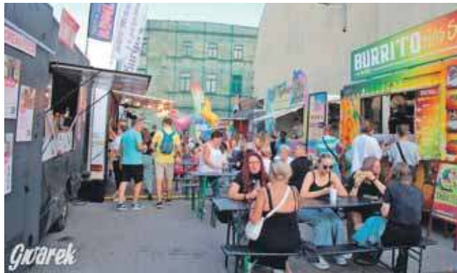
Od kilku lat w czasie Gwarków przy ulicach Dolnej, Gliwickiej i Królika zlokalizowana jest strefa gastronomiczna, gdzie głównie znajdują się food trucki

Aby wziąć udział w przetargu, chętni muszą wpłacić wadium w wysokości 10 tys. zł.