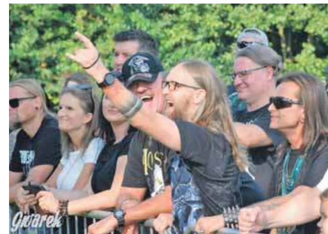
Przed nami szósta edycja Śląskiego Larma