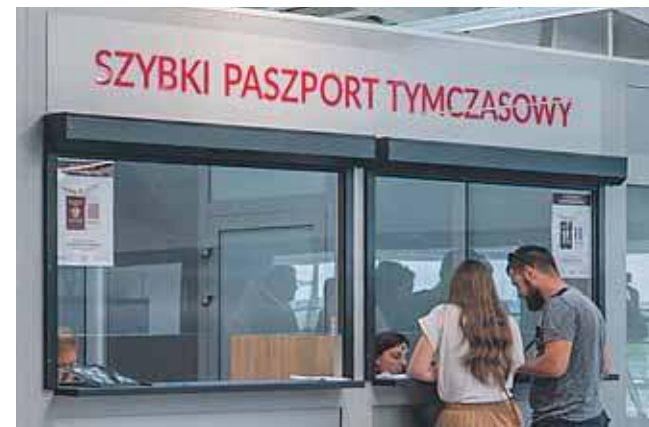
Do tej pory w pyrzowickim punkcie wydano 4 400 dokumentów

– W tym roku obsłużymy 7 milionów pasażerów, a w przyszłym roku być może osiągniemy nawet 8 milionów. Dlatego ten punkt na stałe wpisali się w funkcjonowanie lotniska i powinien zostać z nami na zawsze