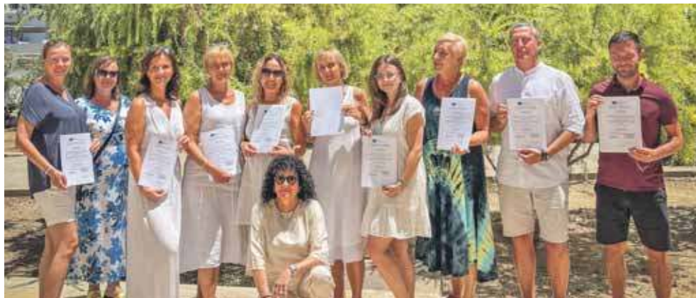
Nauczyciele poszerzyli swoją wiedzę na temat nowoczesnych narzędzi cyfrowych oraz zasad korzystania z międzynarodowych platform edukacyjnych

Nauczyciele poszerzyli swoją wiedzę na temat nowoczesnych narzędzi cyfrowych oraz zasad korzystania z międzynarodowych platform edukacyjnych. – W ramach ćwiczeń praktycznych powstały różnorodne materiały multimedialne i interaktywne, które nauczyciele wykorzystają w nowym roku szkolnym w pracy z młodzieżą. Nowe umiejętności przyczynią się do aktywizacji uczniów w procesie na-