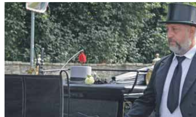
Tym razem powóz był pusty. Położono na nim cylinder zmarłego, białą różę, płonęły świece

wykonania miał zadanie: zabranie ze stojaka lampki szampana, wypicie i odstawienie na postawiony dalej kolejny stojak. – Nie dopytałem i zrobiłem to po „ułańsku”, w czasie jazdy, bez zatrzymywania się. Pu-