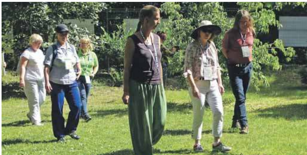
Spacer z przewodnikiem odbywają się we wtorki i w czwartki