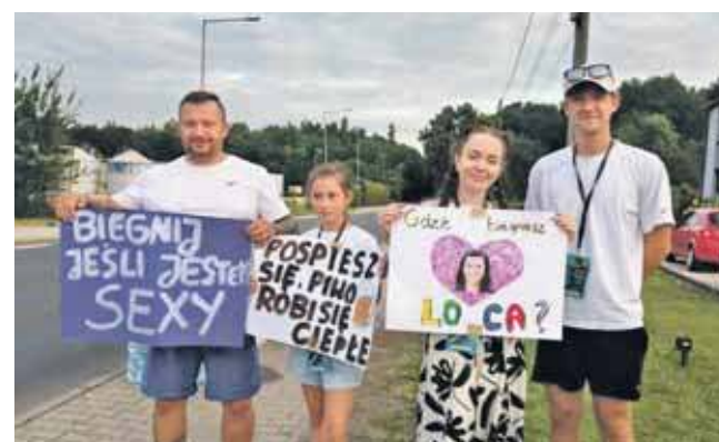
Na trasie nie zabrakło kibiców