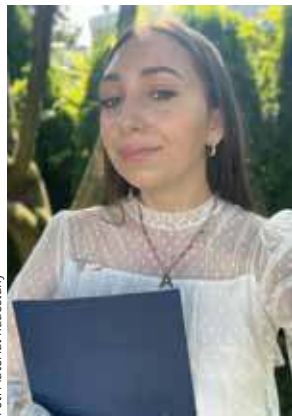
Fot. Materiał niedostępny