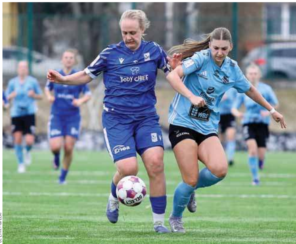
W rozegranym w Olsztynie meczu szef był z Poznania

- Trzeba uczciwie przyznać, że piłkarki z Poznania zaprezentowały wyższą jakość piłkarską, co było widać w niemal każdym ich działaniu na boisku - ocenia Dariusz Maleszewski, trener Stomilank. - To zespół oparty na wielu zawodniczkach z kadr młodzieżowych U-19 oraz