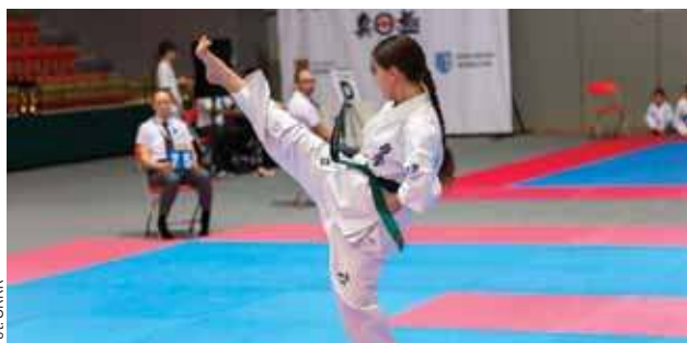
W konkurencji KATA (układy) Olsztynianie zdobyli osiem medali