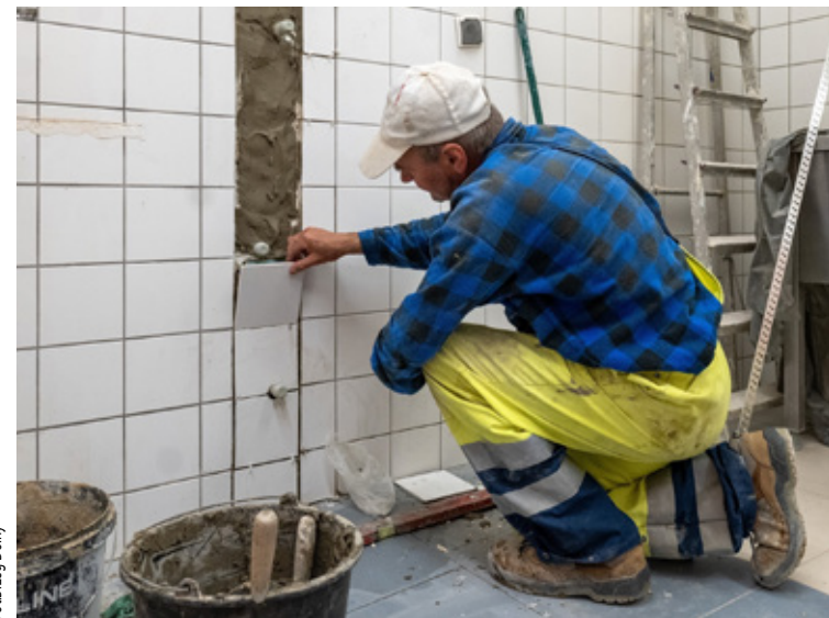
Fot: Brzeg Dolny