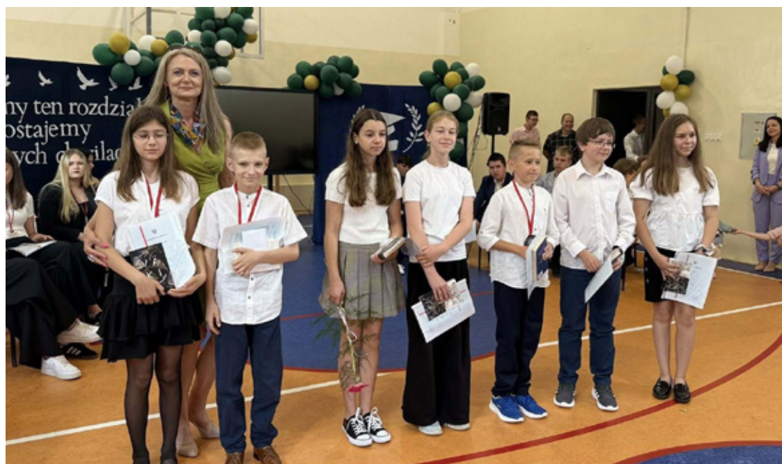
Zespół Szkolno-Przedszkolny nr 2 w Brzegu Dolnym