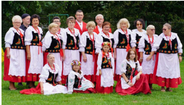
oraz reprezentanci gminy Wołów! Mojęcice i Warzęgów na między- narodowej scenie: W najbliższych dniach na festiwalowej scenie

W tegorocznej edycji Balkan Folk Fest uczestniczy 11 krajów, w tym m.in. Bułgaria, Serbia, Chorwacja, Rumunia, Ukraina czy Mołdawia. Polskę reprezentują takie zespoły jak: Kapela Kurasiów, Kapela z Majdanu Królewskiego, Zespół Sąsiedzi