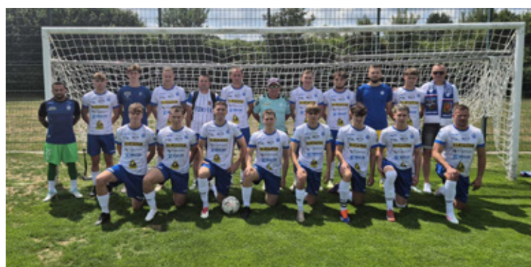
Częścią programu był turniej piłkarski.