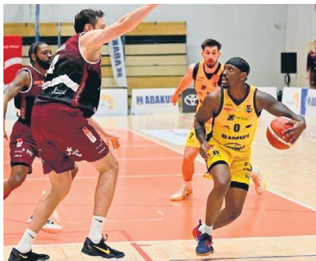
Koszykarze Żubrów Abakus Okna Białystok mają już bardzo małe szanse na utrzymanie się w I lidze