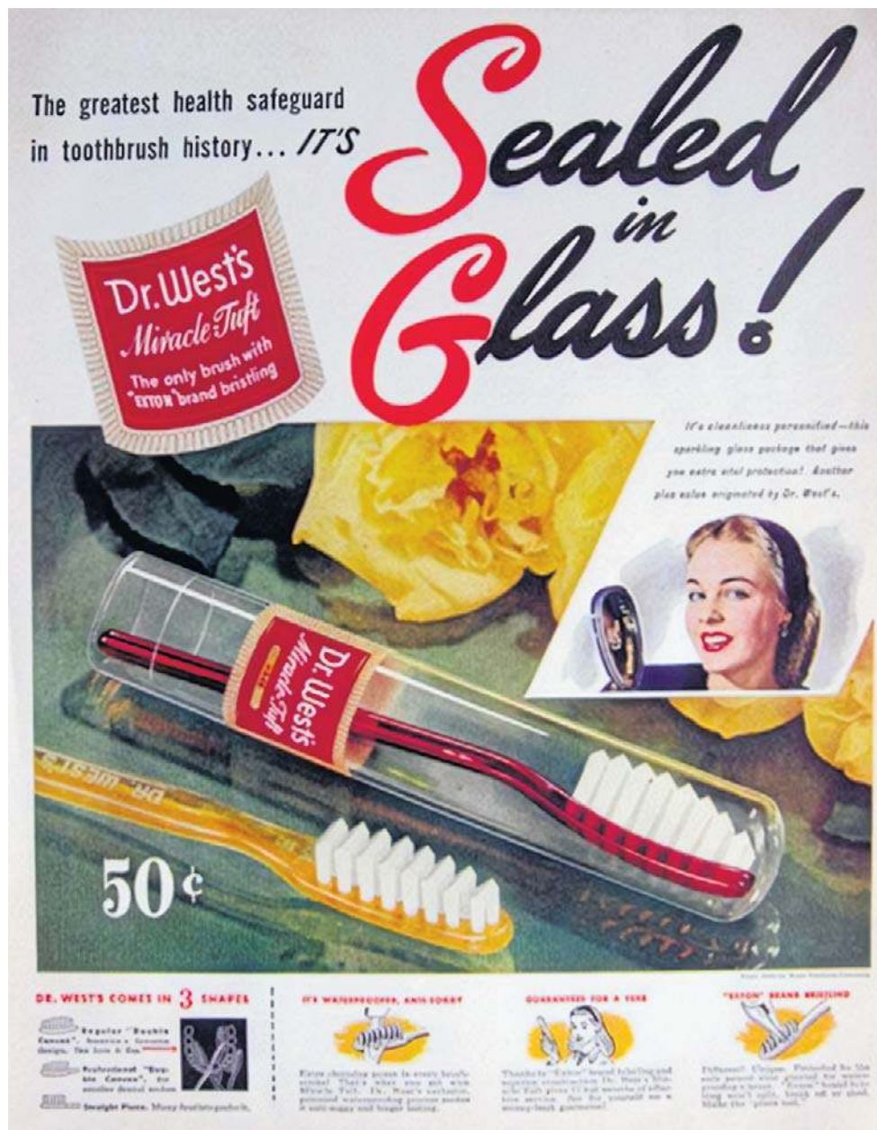
Jedna z pierwszych reklam nylonowej szczoteczki. Otrzymały one nazwę „Dr. West's Miracle-Tuft” i miały charakterystyczne kolorowe uchwyty

A w kolejce czekają urządzenia, których zasada czyszczenia zębów opiera się na tzw. technologii jonowej. Światło UV generowane jest przez lampę UV LED, na promieniowanie reaguje płytka tytanowa umieszczona w uchwycie szczoteczki, a emitowane ujemnie naładowane jony przyciągają bakterie płytki nazębnej do główki szczoteczki. Pozwala to - wedle zapewnień inżynierów od stomatologii - na niemal całkowite wyeliminowanie bakterii streptococcus mutans, odpowiedzialnych za rozwój próchnicy. Dodatkowo technologia jonowa pozytywnie wpływa na stan zdrowia dziąseł, ponoc znacząco poprawiając ich kondycję.