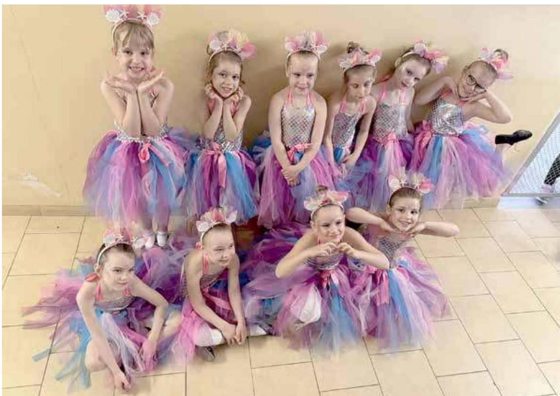
Reprezentaci Maszewa pozajmowali wysokie miejsca