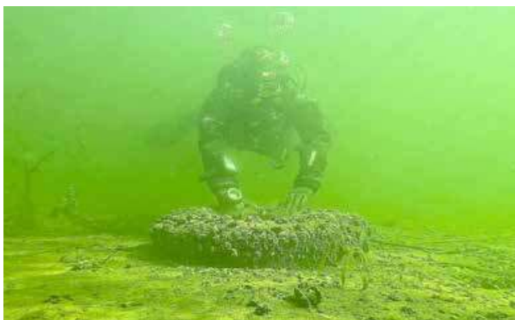
Opony i śmieci wyławiane były z jeziora

Wynik tej akcji to wyciągnięcie pięciu worków śmieci oraz siedemdziesięciu siedem opon z wód Jeziora w okolicach Lubczyny. Sprzątaną był teren ślipa oraz plaży miejskiej. Poprzednim razem wyłowiono tam dwanaście worków śmieci oraz trzydzieści siedem opon. Łącznie daje to sto czternaście opon(!) różnego typu i siedemnaście worków.