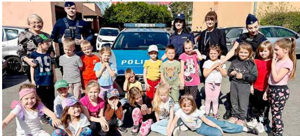
Goleniowscy policjanci spotkali się z uczniami