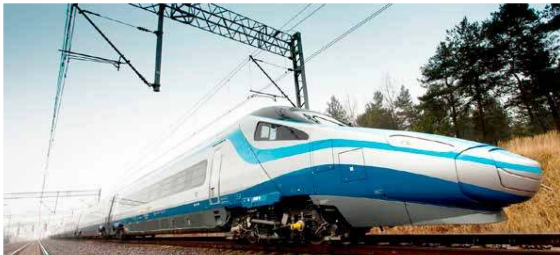
Pociągi Pendolino zatrzymywać się będą w Goleniowie