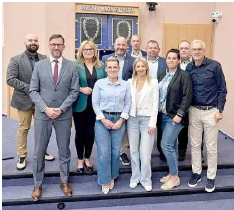
Radni z grupy Koalicja dla Gminy

- Zastraszanie, manipulowanie opinią publiczną i wzbudzanie