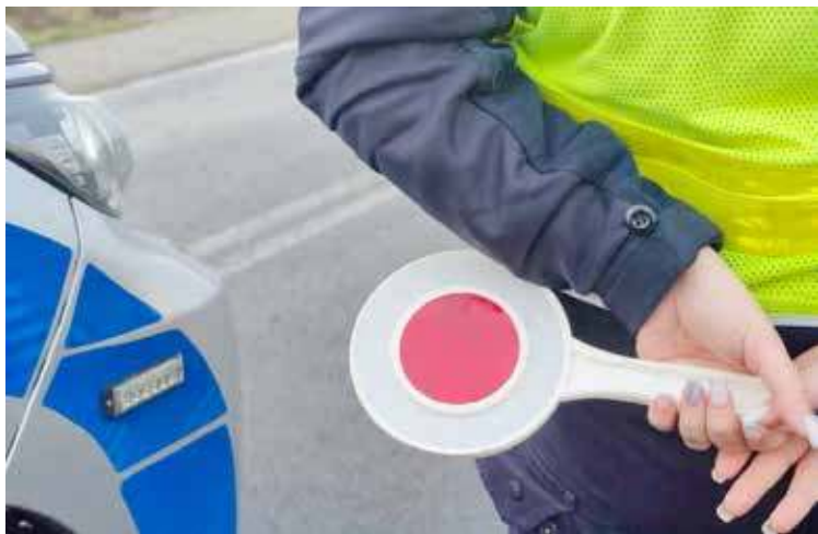
Świąteczny weekend na drogach