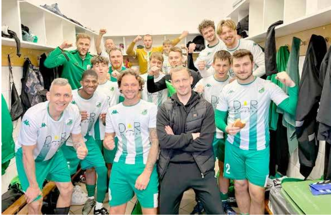
Ina II Goleniów

Niełatwy czas przeżywa drużyna goleniowskiej Iny w rozgrywkach IV ligi. W miniony weekend nasz zespół doznał trzeciej z rzędu porażki, tym razem przegrywając na wyjeździe z Białymi Sądów 0:2.