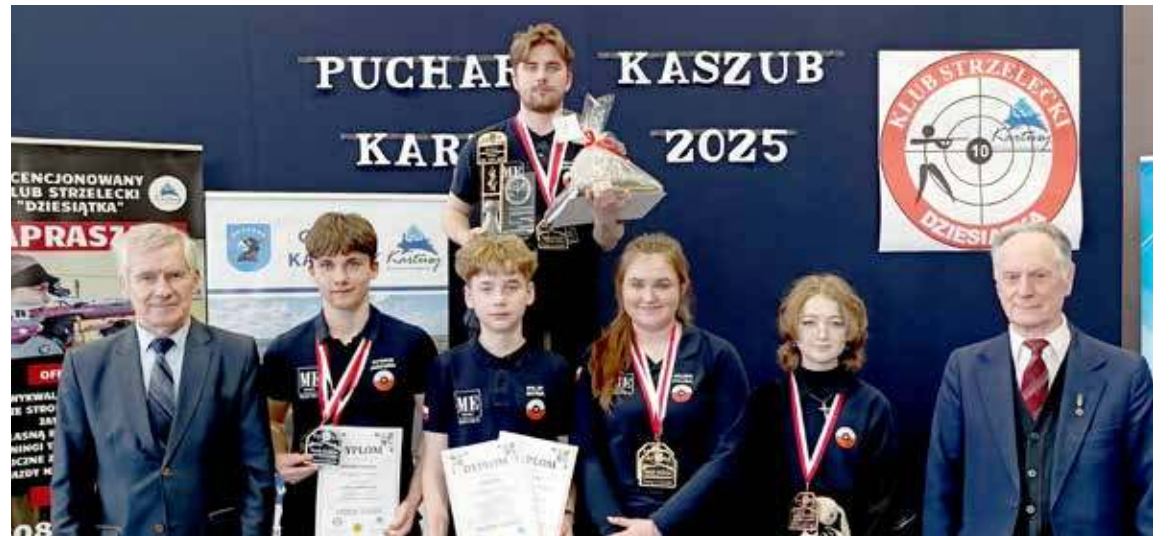
Zawodnicy LOK Klubu Strzelectwa Sportowego TARCZA Goleniów z pucharem, medalami i dyplomami