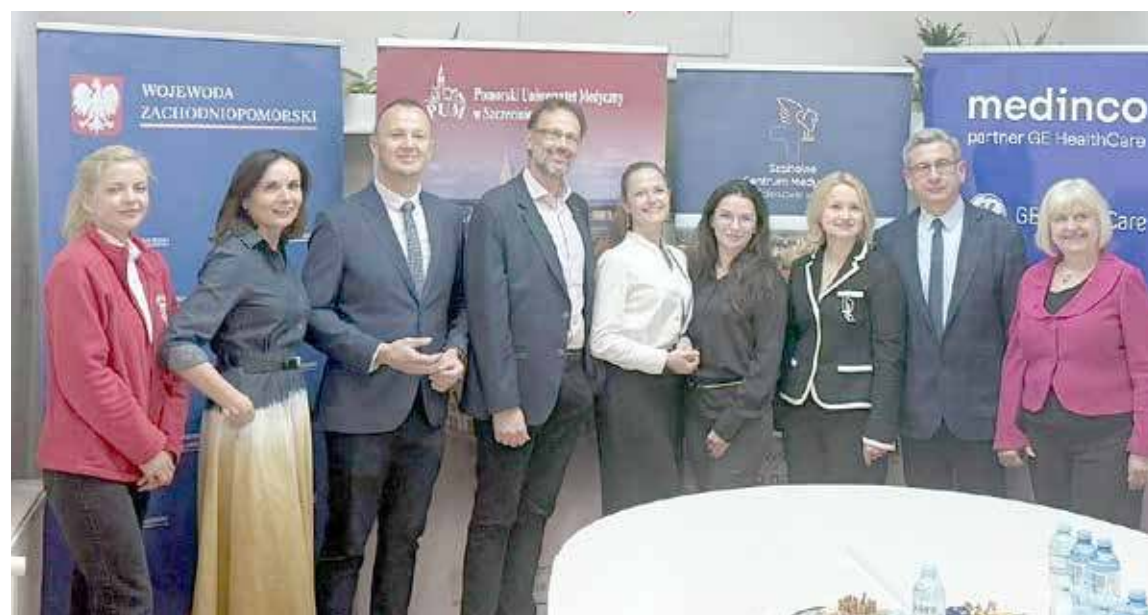
W goleniowskim szpitalu odbyły się warsztaty, wykład oraz bezpłatne badania