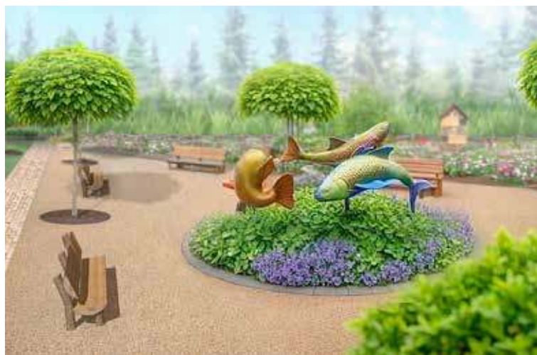
Park Natury Zalewu koncepcja 1