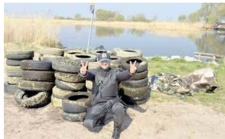
Wyłowiono ponad siedemdziesiąt opon

Gmina Goleniów postawiła oraz następnie odebrała kontener ze śmieciami. Może wydawać się to mało, lecz należy pamiętać, że nie jest ona zarządcą Jeziora. Zostało więc to zrobione w chę-