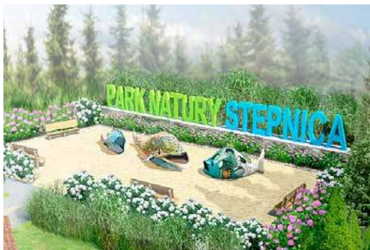
Park Natury Zalewu Koncepcja 2