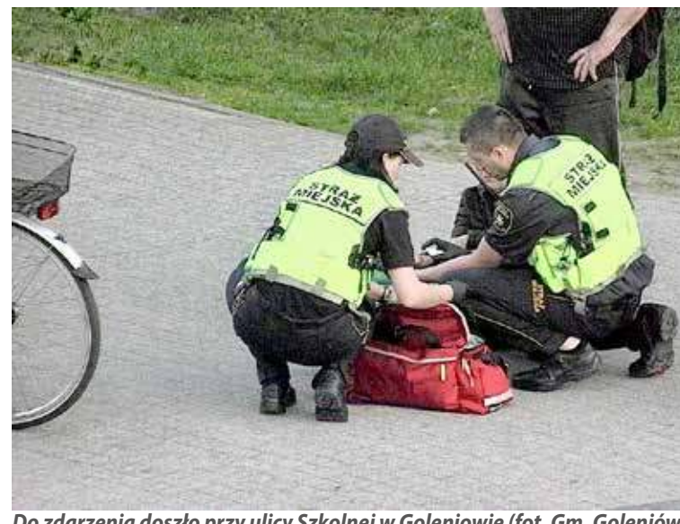
Do zdarzenia doszło przy ulicy Szkolnej w Goleniowie