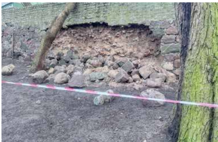
Uszkodzony mur obronny w końcu doczeka się naprawy