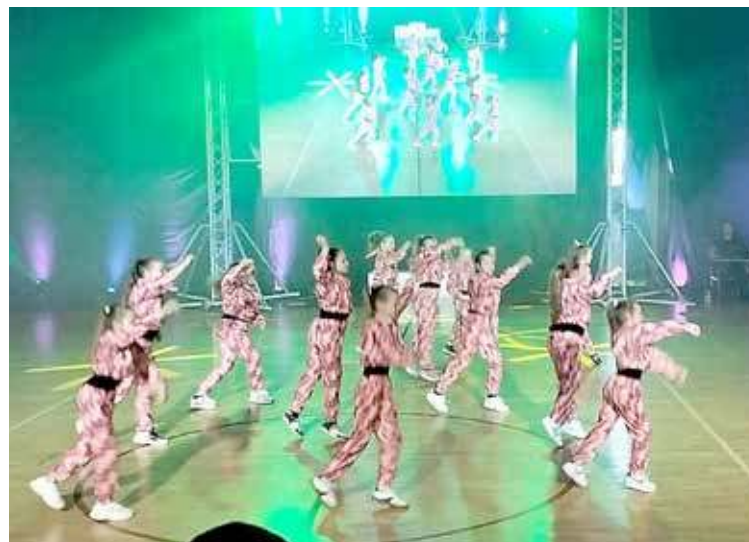
Maszewscy tancerze pokazali klasę