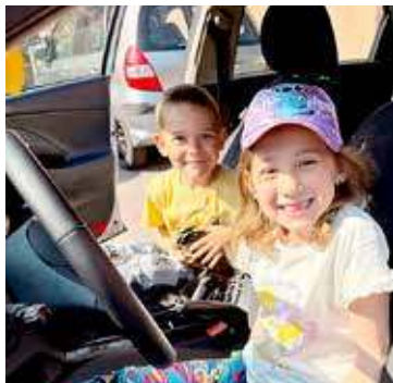
Dzieci miały szansę sięgnąć za kierownicą radiowozu

W trakcie tych zajęć uczniowie szkoły dowiedzieli się jak bezpiecznie poruszać się po drogach. Oczywiście szczególną uwagę zwrócono na prawidłowe przechodzenie przez przejście dla pieszych oraz warunki noszenia elementów odblaskowych. Policjanci przypomnieli również, jak ważna jest znajo-