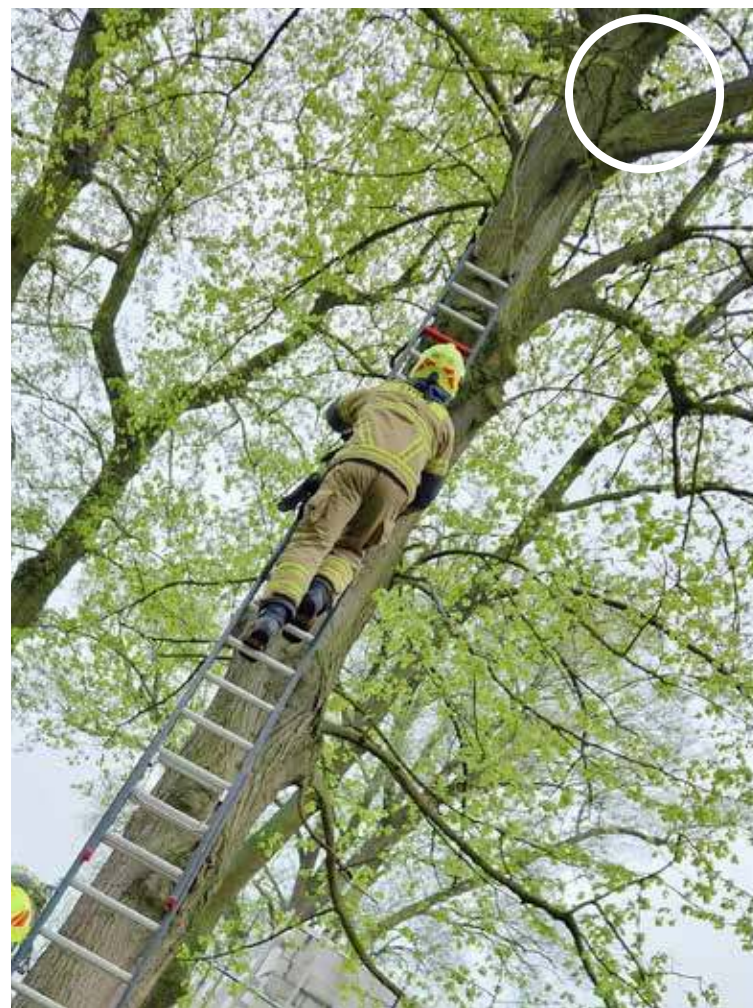
Strażacy ściągali kota z drzewa