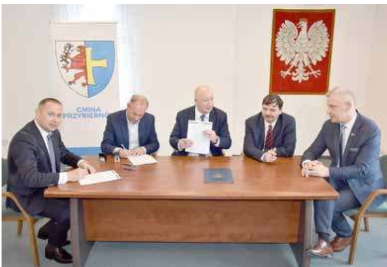
Umowa została podpisana

Projekt przebudowy tej drogi obejmuje m.in. prace związane z przebudową dwupasmowej jezdni, wybudowanie nowych chodników oraz zatok autobusowych, stworzenie azylów – wysepki spowalniającej ruch drogowy, zjazdów i poboczy oraz skrzyżowania z ulicą Cisową. Całkowita długość odcinka, który będzie przebudowywany to 998 metrów. Przewidywany termin zakończenia prac to 28 listopada 2025 r.