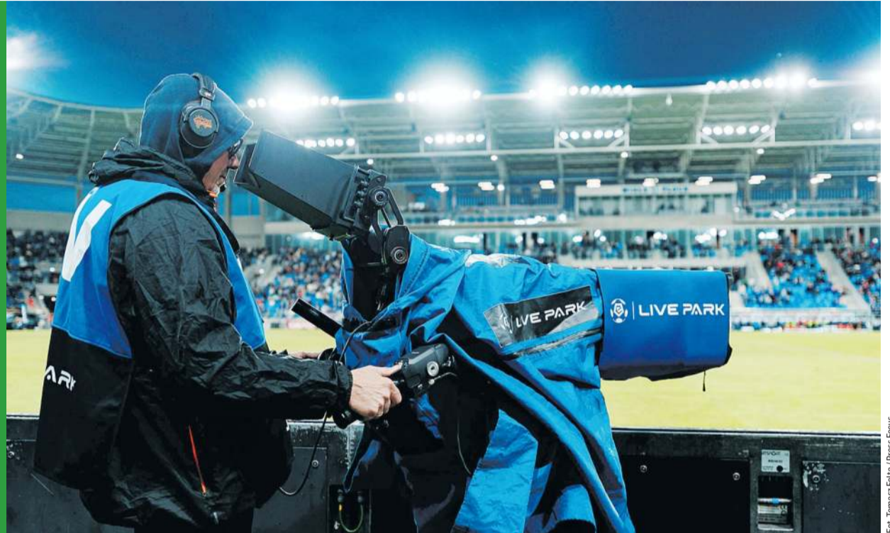
Czy ekstraklasa bez Legii będzie mniej warta?

Scenariusz, w którym spada doborowe trio, możemy sobie chyba darować, bo to jednak prawie niemożliwe. Sporo kibiców ekscytuje się jednak ewentualną degradacją Legii, która wciąż nie wydstawiła się ze strefy spadkowej. Co oznaczałby jej spadek? Ostatnio z taką sytuacją mieliśmy do czynienia w... 1936 roku. Nie będziemy dopowiadać, co było potem, skupimy się wyłącznie na marketingowo-biznesowym ujęciu tego zagadnie-