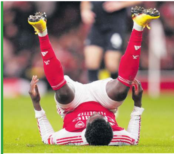
U Bukayo Saki wszystko w tym sezonie jest na opak.