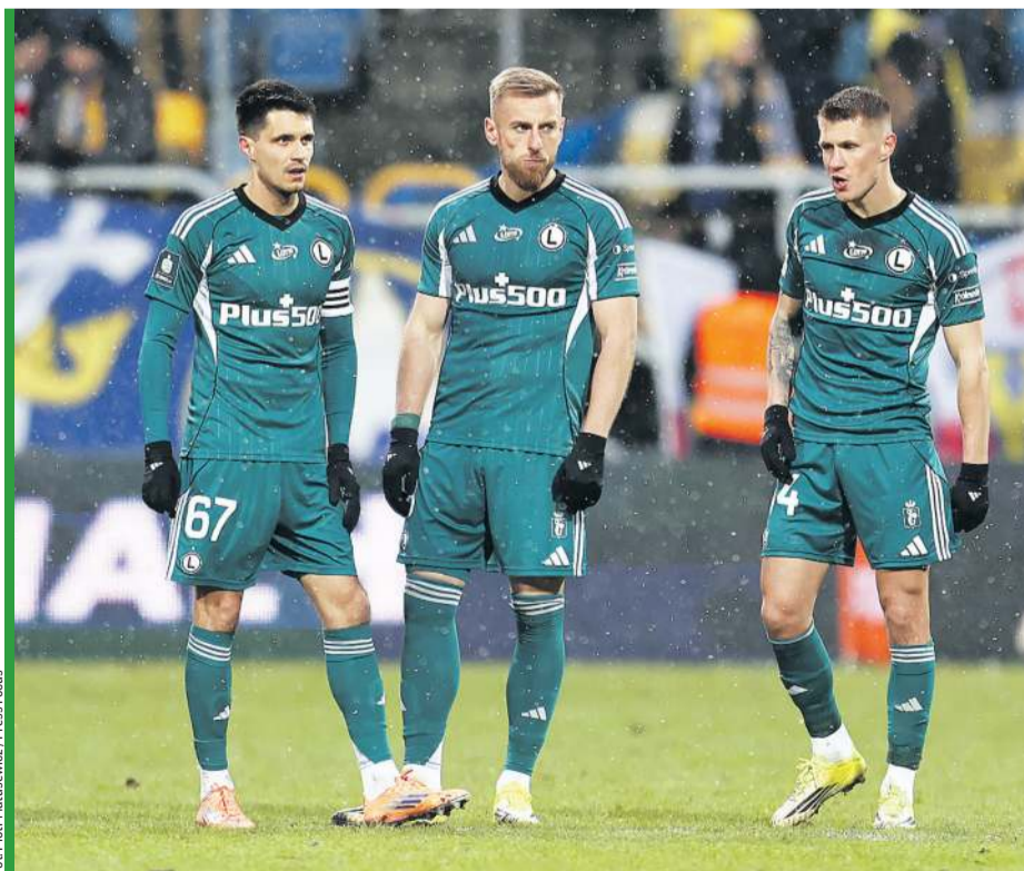
Ekstraklasa bez zawodników Legii? To możliwe!