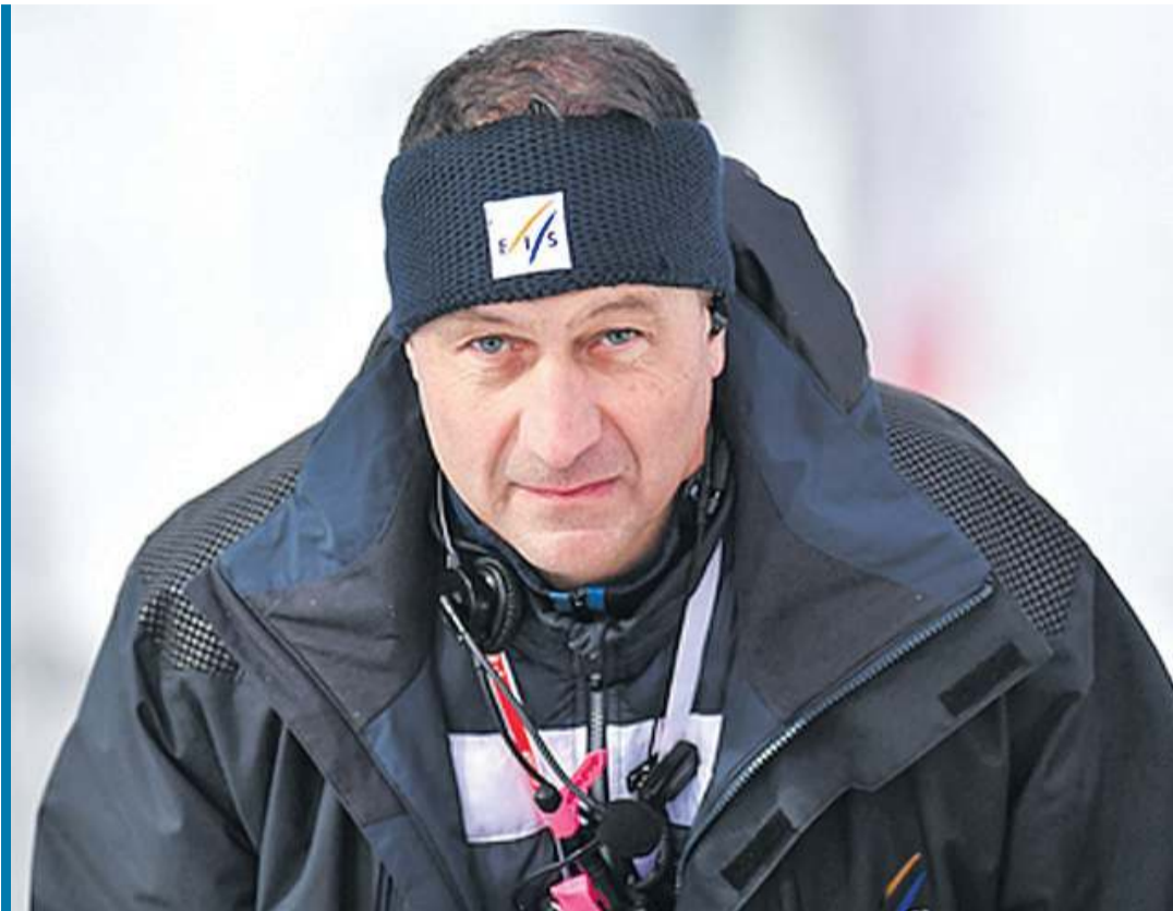
Śnieżnica, nie śnieżnica, a sprawiedliwość musi być po naszej stronie! Przynajmniej od czasu do czasu...

Ileż to razy przy okazji mniejszych lub większych imprez nasza polska kromka chleba z masłem upadła