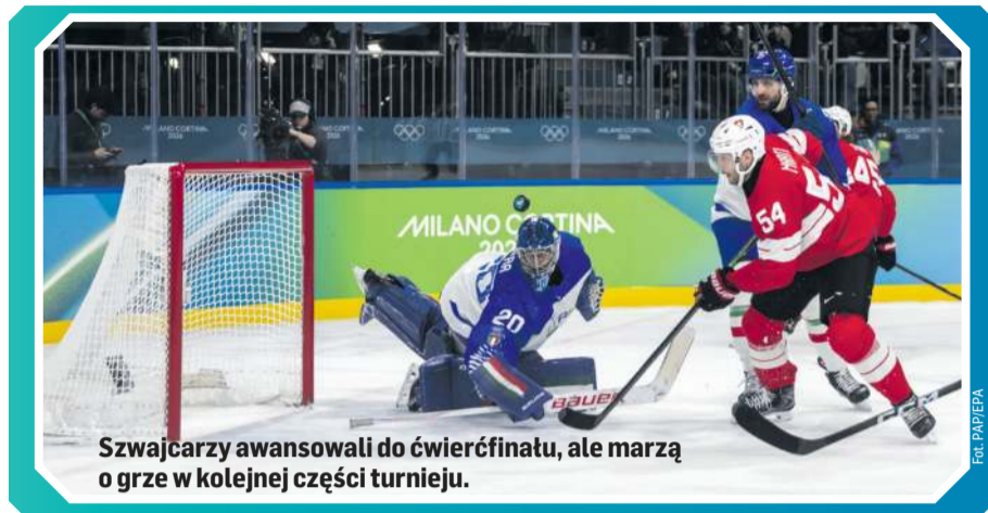
Szwajcarzy awansowali do ćwierćfinału, ale marzą o grze w kolejnej części turnieju.

Ostatnio Szwajcarzy dwa razy z rzędu sięgnęli po wicemistrzostwo świata, z kolei brązowe medale igrzysk to odległe czasy (1928 i 1948) i pewnie na pożegnanie trenera Patricka Fischera chcieliby znaleźć się na podium; potem jeszcze mają u siebie - w maju - mistrzostwa świata. Dwa medale