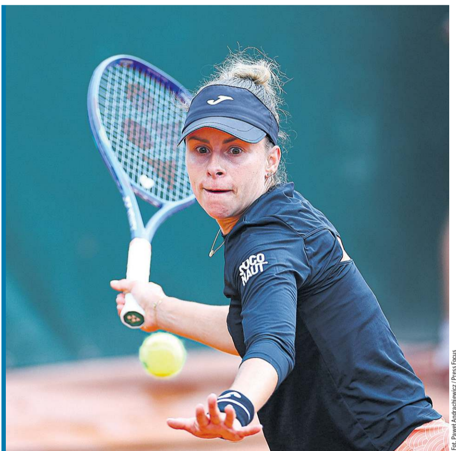
Magda Linette trafia czysto. W tym roku wygrała już 9 z 13 meczów.