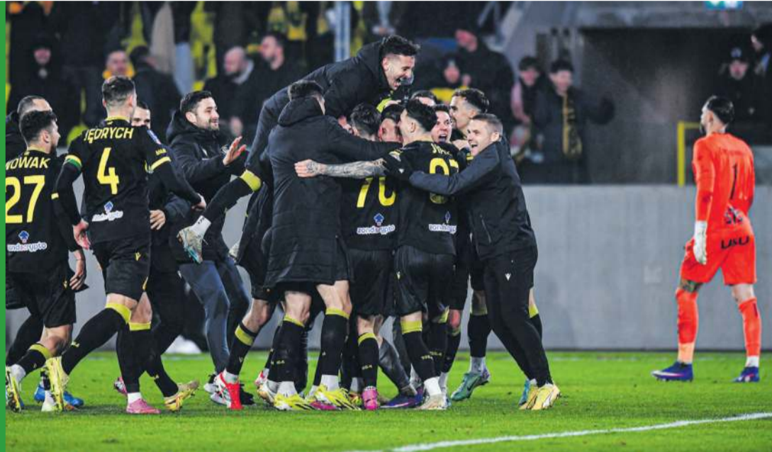
We wtorek tuż przed północą Katowiczanie nacieszyli się z awansu do półfinału, a potem pobiegli do szatni dopisać na plakacie nazwę kolejnego pucharowego „skalpu”.

I tego szczęścia Górnik doświadczył w piątkowe południe w studiu TVP, w którym odbyło się losowanie par półfinałowych. Co prawda po raz kolejny wybrać się będzie musiał w kierunku północnym, ale tym razem zmierzy się nie z zespołem ekstraklasowym, a z najniższym w tym gronie notowanym bydgoskim Zawiszą, na co dzień występującym o trzy klasy niżej (w tym momencie to trzeci zespół grupy II Betclig 3. Ligi). – W pucharze dzieją się rzeczy inne niż w lidze – to na