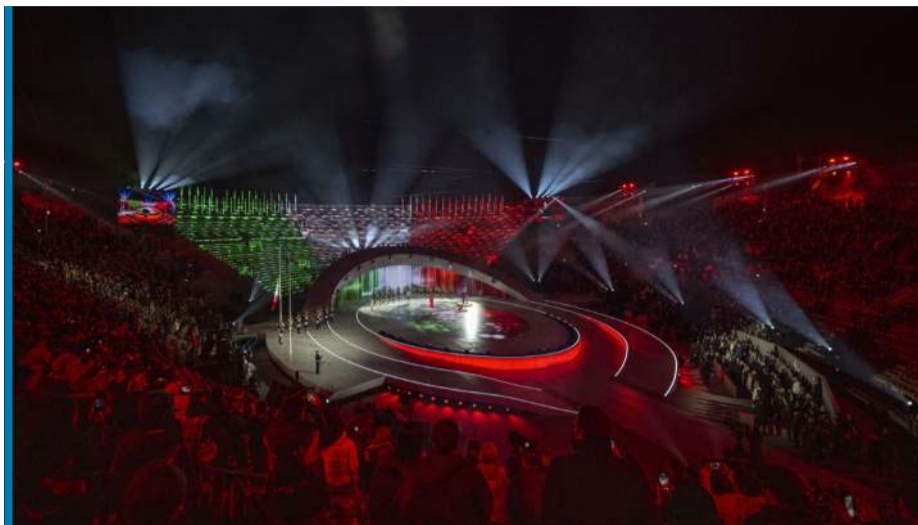
Ceremonia otwarcia odbyła się w antycznym amfiteatrze w Weronie.

W czasie uroczystości żaden sportowiec nie niósł flagi swojego kraju. Tak zdecydował IPC wyjaśniając, że jest to wybór podyktowany wyłącznie „odległością od miejsc zawodów zaplanowanych na następny dzień”. Zamiast sportowców flagi nieśli wolontariusze. W czę-