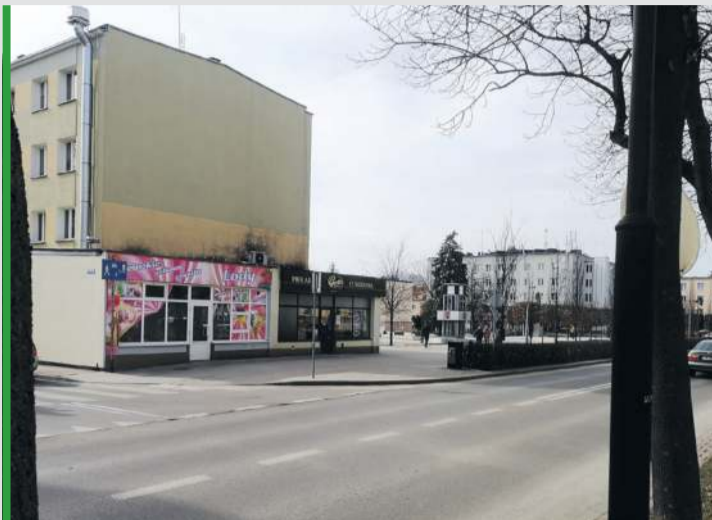
Świdnik jaki jest - każdy widzi. Avia wydaje się największą atrakcją tego dość topornego miasta.

Jak się okazuje trzy dni w pitce to całkiem sporo, aby zobaczyć na tym samym stadionie zupełnie inną liczbę kibiców, wymienioną w licznych miejscach muraw oraz totalnie inne oblicze zespołu – w tym przypadku poznańskiego Lecha. W moim subiektywnym odczuciu Raków w znacznym stopniu przyczynił się do awansu Zabrzeżan – Lechici włożyli w niedzielny mecz tak dużo siły, że trzy dni później przypominali jedynie cień samych siebie. Oczywiście, Górnikowi w żaden sposób nie ujmuje sukcesu – objąć prowadzenie przy Bułgarskiej, obronić rzut karny, a potem jeszcze przez blisko 20 mi-