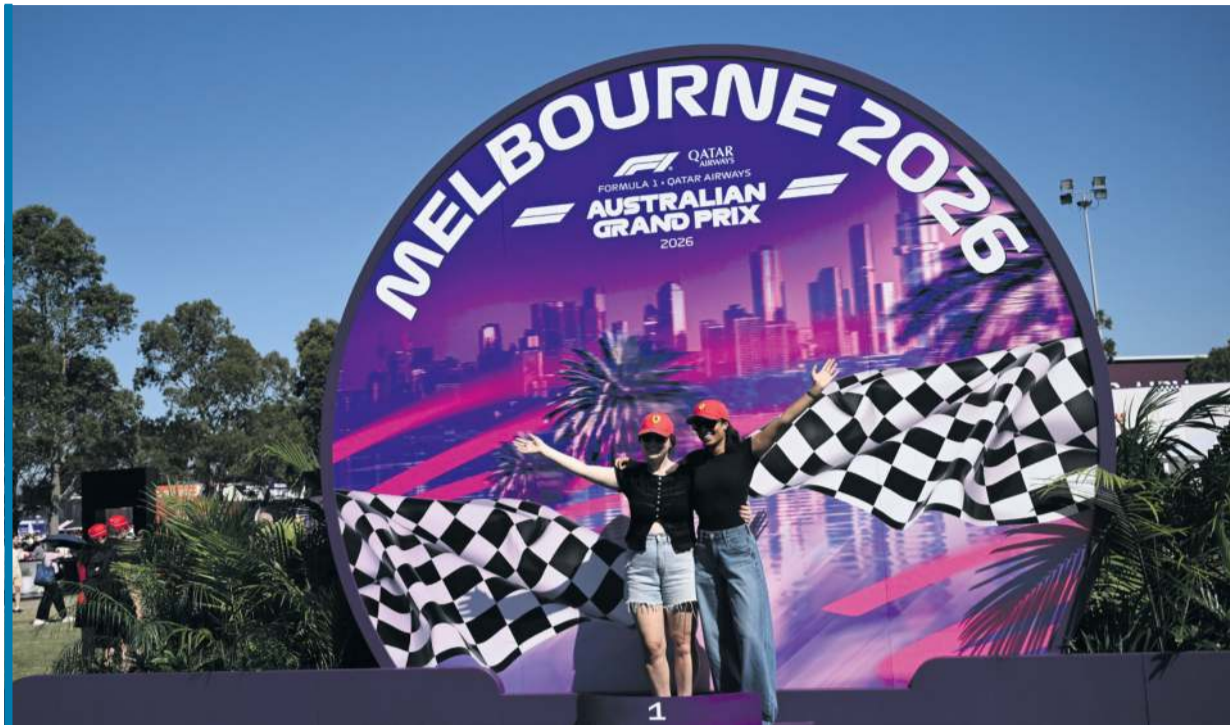
Melbourne gotowe do inauguracji nowego sezonu w Formule 1.

10.00 Snowboard: PŚ w Erzurum, cross (na żywo); 13.20 Pn: Eliminacje MŚ kobiet, Anglia – Islandia, 17.55 Liga czeska, Jablonec – Sigma Otomuniec, 19.55 Liga saudyjska, Al-Nassr – Neom (na żywo)