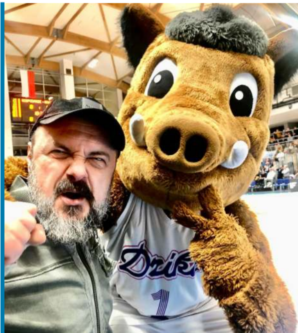
Arkadiusz Jakubik to stały bywalec meczów Dzików Warszawa.

trzeci sezon, już zdążyły przyciągnąć śmietankę warszawskiego show-biznesu. Stałym bywalcem hali przy ul. Obozowej jest Arkadiusz Jakubik. Gwiazdor polskiego kina chętnie pozuje do zdjęć z klubową maskotką – Dzikim Medziakiem. Po jednym ze spotkań aktor w mediach społecznościowych napisał: "Byliśmy wczoraj na Dzikach. Jednym punktem. Ale jest nowa drużyna, nowy trener. Będzie dobrze. My zawsze wierni po porażce i dumni po zwycięstwie".