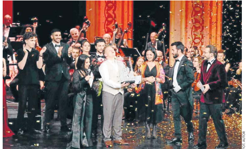
Konkurs odbył się w sobotę wieczorem w stolicy Armenii, Erywaniu. To czwarta wygrana Polski w historii konkursu

Muzykowi pogratulowało Ministerstwo Kultury i Dziedzictwa Narodowego. W swoim wpisie na X przypominało, że akordeonista to niedawny zwycięzca krajowego konkursu Młody Muzyk Roku.