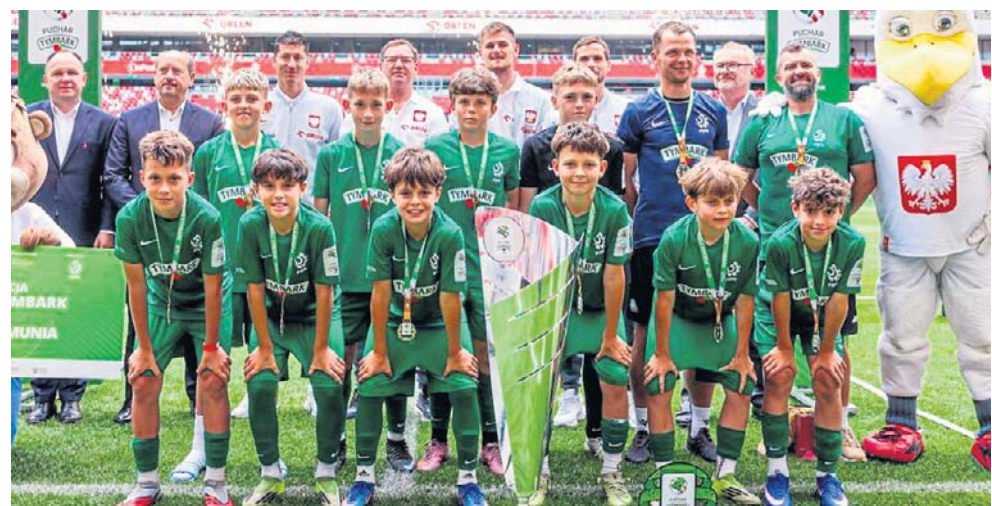
Młodzi adepci piłki nożnej SMS-u Stali Rzeszów okazali się najlepsi w kategorii do 12 lat