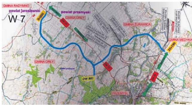
Obecnie projektanci mają czas na naniesienie uwag i dopracowanie wariantu 7

- Kolejne miesiące ciszy, zmieniające się koncepcje oraz przeciągające się analizy sprawiły, że część osób była przekonana, iż projekt nigdy nie wyjdzie poza etap planowania. Ostatnie posiedzenie Komisji Oceny Przedsięwzięć Inwesty-