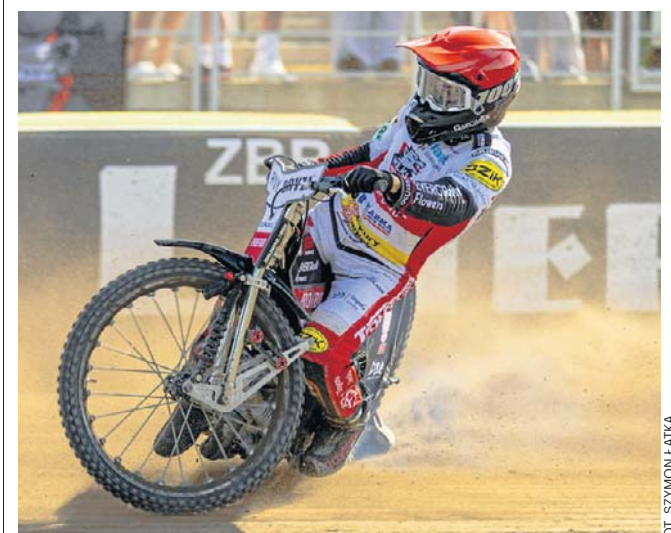
Żużlowcy Cellfast Wilków Krosno w pierwszej rundzie fazy zasadniczej zawiedli z kretesem. Co dalej?...