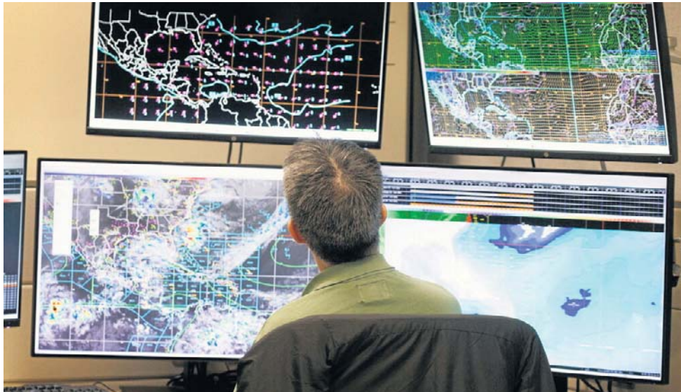
Meteorolodzy biją na alarm: El Nino może poważnie zakłócić mistrzostwa świata

Synoptycy podczas mundialu w Stanach Zjednoczonych, Meksyku i Kanadzie przewidują fale upałów w północnej części USA i na wybrzeżu Pacyfiku, podczas gdy na południu będą występować częste i długotrwałe opady deszczu, które z kolei grożą powodzią.