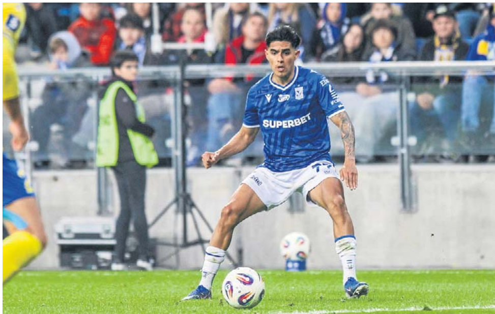
Reprezentant Hondurasu został sprowadzony na stałe do Lecha za 4 miliony euro

Legia Warszawa na takie wydatki nie może sobie pozwolić. Po sezonie naznaczonym klęskami, zwłaszcza na krajowym podwórku, zaciska pasa, szukając na rynku okazji. Takie znalazła już w rywalu i na zapleczu. Jej najnowszym nabytkiem okazał się... absolwent akademii Legii Łukasz