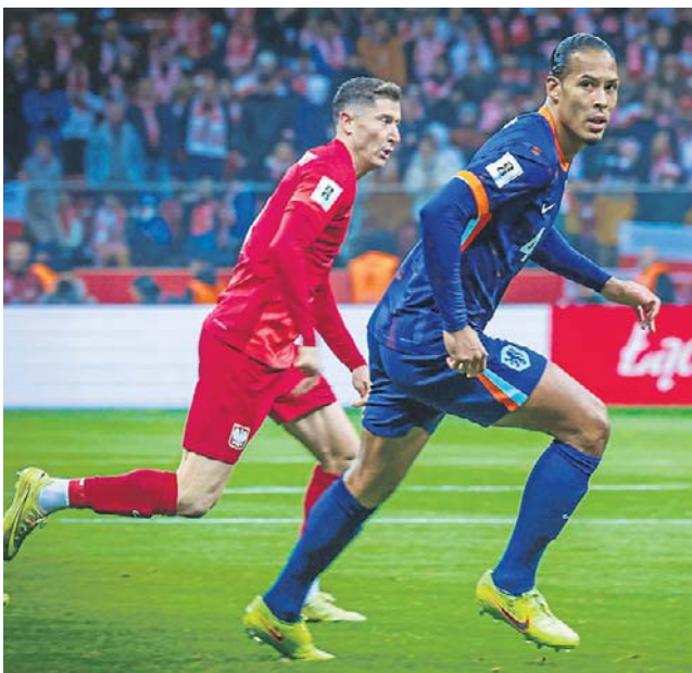
Holandia była rywalem Polski w kwalifikacjach MŚ i byłaby na mundialu, gdyby Biało-Czerwoni wygrali baraże...

Popis dała natomiast Belgia, która rozbiła w Brukseli Tunezję 5:0. „Orły Kartaginy” dostały się do mundialu z bilansem bramkowym 22:0 i 28 punktami zdobywającymi na 30 możliwych w swojej grupie eliminacyjnej, ale przeciwnie „Czerwonym Diabłom” były bezradne.