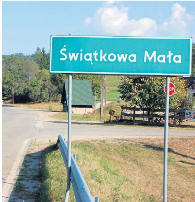
O znalezisku koło Świątkowej Małej policja została zaalarmowana przez leśniczego