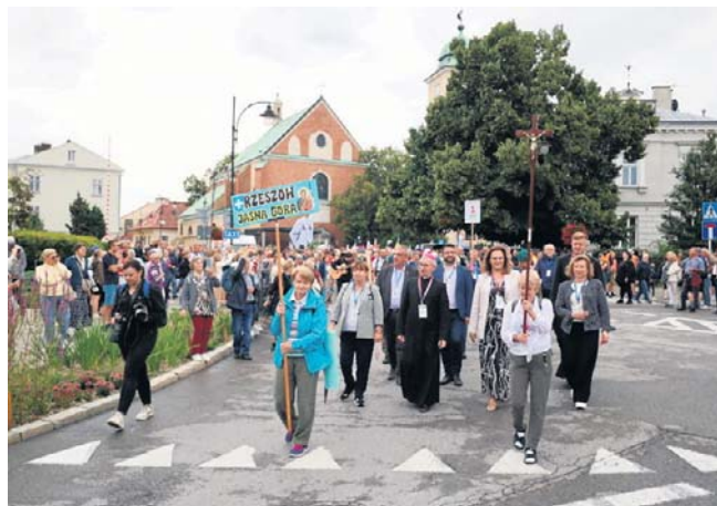
Tak z Rzeszowa wyruszyła 48. Rzeszowska Piesza Pielgrzymka na Jasną Górę

Zapisy na 49. Rzeszowską Pieszą Pielgrzymkę rozpoczyna się 1 lipca 2026 r. Informacje dotyczące pielgrzymki można znaleźć na stronie: www.pielgrzymka.rzeszow.pl