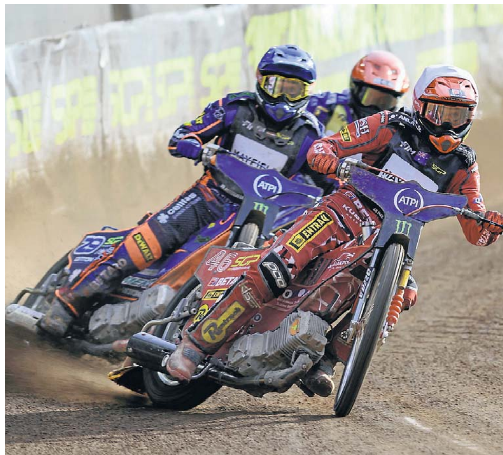
Bartosz Zmarzlik kontra Australijczyk Max Fricke i Andrzej Lebediew z Łotwy