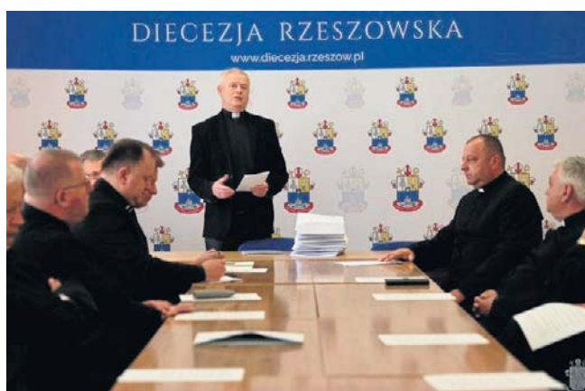
W diecezji rzeszowskiej zapowiedziano kolejne zmiany personalne wśród duchowieństwa