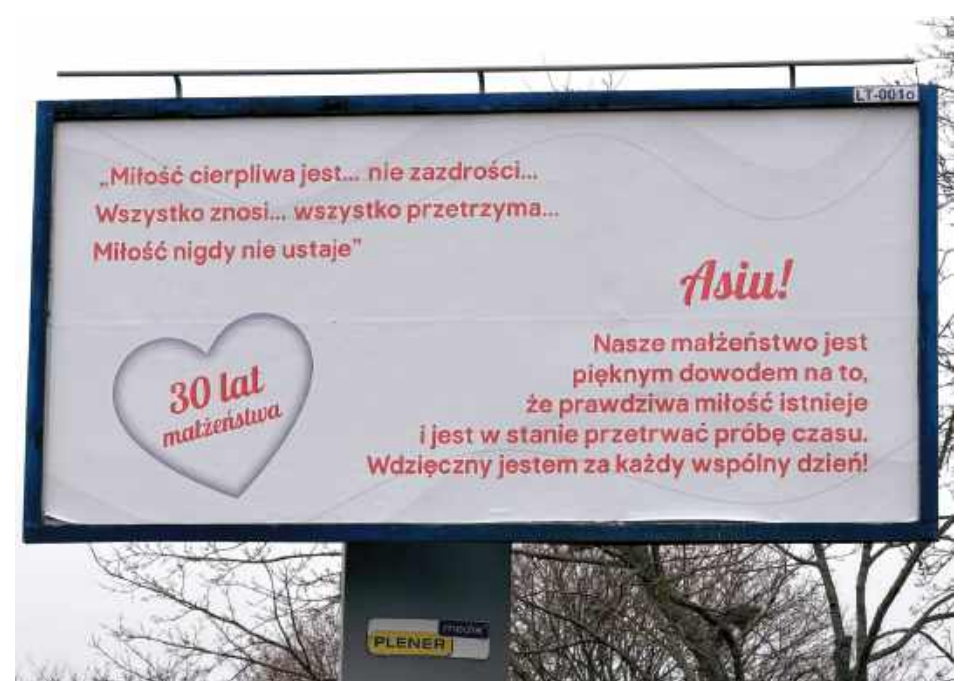
Billboard o miłości przy al. Jana Pawła II

Takiemu publicznemu, a jednocześnie anonimowemu