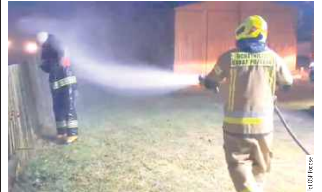
Zaraz po zakończeniu akcji druh Bartek Kot przeszedł strażacki „chrzest”

28 listopada przed godziną 15 do stanowiska kierownika KP PSP w Łukowie wpłynęło zgłoszenie o pożarze w gminie Krzywda.