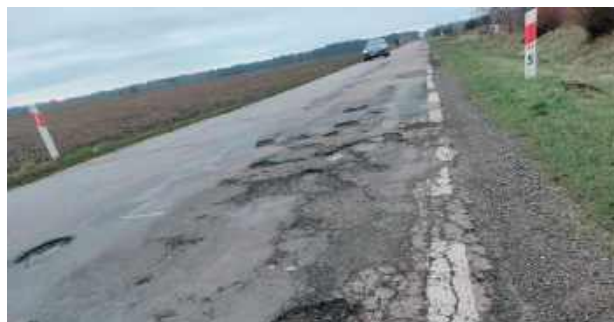
O jeździe po drodze 807 mieszkańcy gminy Wola Mysłowska mówili: „To masakra!”. Szykuje się jej remont

Rozbudowa drogi wojewódzkiej nr 807 na wymienionym odcinku ma na celu poprawę