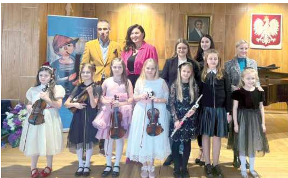
Gratulujemy młodym artystom, ich rodzicom oraz nauczycielom i życzymy kolejnych muzycznych sukcesów!

W dniach 6-7 listopada w Warszawie odbył się IX Ogólnopolski Konkurs Instrumentalny „I Pierwszak może być mistrzem”. Celem konkursu jest docenienie pracy, zaangażowania i pasji dzieci na początku ich edukacji muzycznej oraz zachęcenie do dalszego rozwoju.