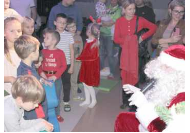
Była też chwila na rozmowę z Mikołajem