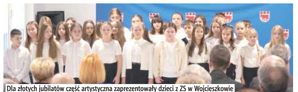
Dla złotych jubilatów część artystyczna zaprezentowały dzieci z ZS w Wojcieszkwie