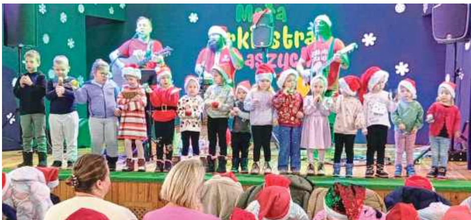
Na zaproszenie Gminnej Biblioteki Publicznej. Na scenie wystąpiła Mała Orkiestra Dni Naszych, która swoim koncertem wprowadziła wszystkich w prawdziwie mikołajkowy nastrój

Na widowni zasiedli uczniowie z Zespołu Szkolno-Przedszkolnego w Trzebieszowie Drugim. Dzieci miały na sobie czerwone czapki Mikołajów, co dodało wydarzeniu jeszcze więcej świątecz-