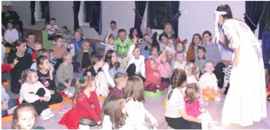
Aktorzy przenieśli publiczność w świąteczny bajkowy świat i zapewnili dzieciom dobrą zabawę

Na początek zaprezentowano przedstawienie „Mikołaj