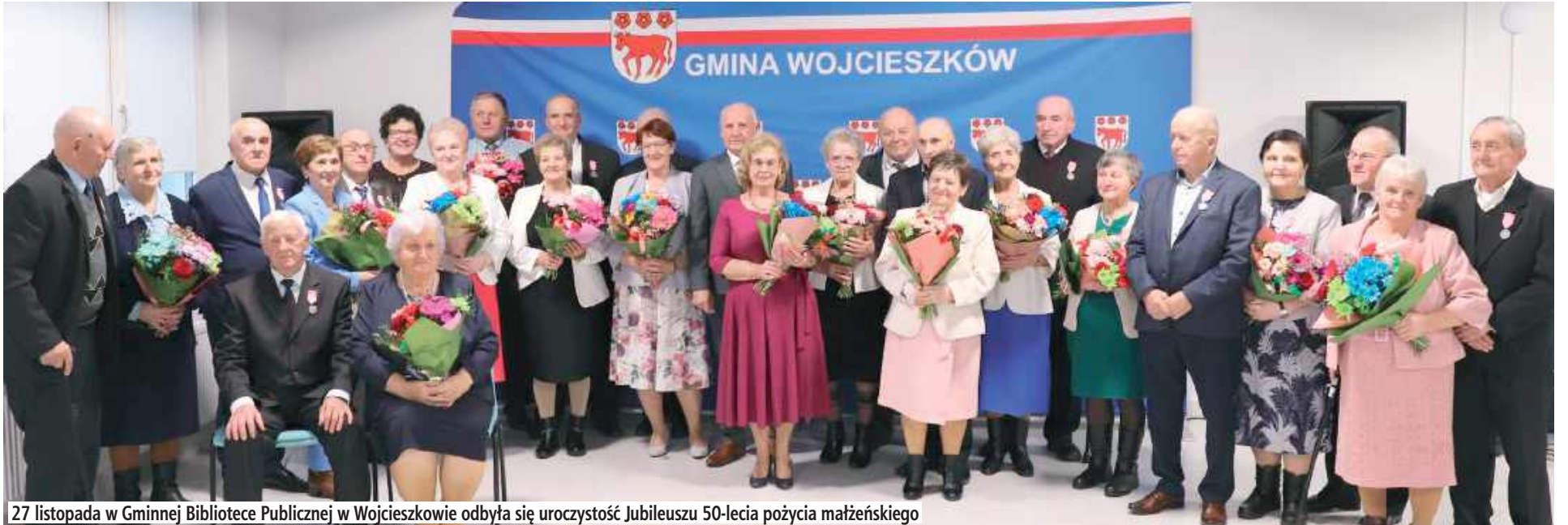
27 listopada w Gminnej Bibliotece Publicznej w Wojcieszkwie odbyła się uroczystość Jubileuszu 50-lecia pożycia małżeńskiego