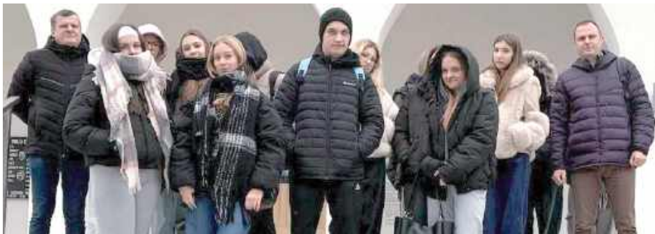
We wtorek, 25 listopada uczniowie klas III i IV LO udali się na wycieczkę do Muzeum Czynu Bojowego Kleeberczyków w Woli Gułowskiej

Podczas wizyty uczniowie poznali przebieg ostatniej bitwy kampanii wrześniowej w 1939 roku, w której Samodzielna Grupa Operacyjna „Polesie” pod dowództwem gen. Franciszka Kleeberga stawiała czoła niemieckim