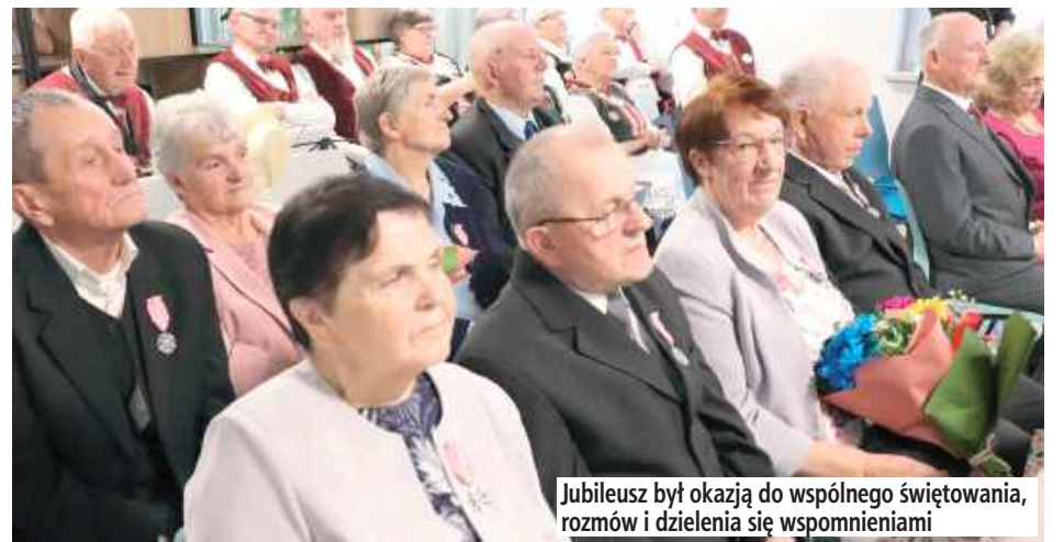
Jubileusz był okazją do wspólnego świętowania, rozmów i dzielenia się wspomnieniami