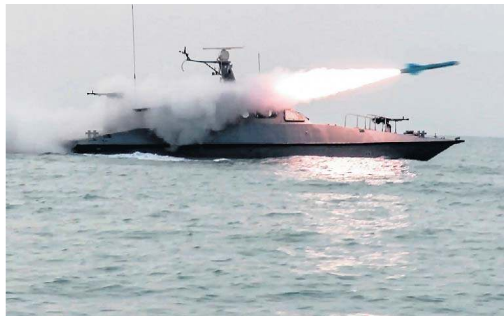
Ćwiczenia morskie Korpusu Strażników Rewolucji Islamskiej w cieśninie Ormuz

W rozmowach stronę amerykańską reprezentowali wysłannik prezydenta USA Steve Witkoff oraz zięć i doradca Donalda Trumpa Jared Kushner. Irańskiej delegacji przewodniczył szef MSZ Abbas Aragchi. W rozmowach, tak jak poprzednio, pośredniczyli dyplomaci z Omanu.