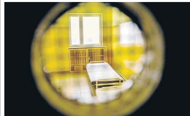
Luka w przepisach ujawnia chaos decyzyjny w systemie ratowania zdrowia

Na moment publikacji odpowiedź ministerstwa zdrowia nie została jeszcze udzielona. Zgodnie z procedurą resort ma na to 21 dni od daty wpływu interpelacji.