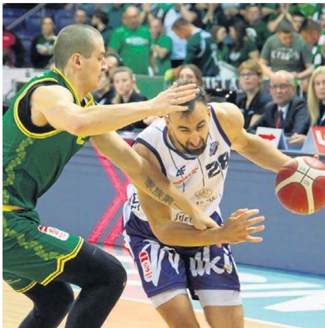
1 listopada King pokonał Zastal 80:66 na swoim boisku. W PP czeka nas jeszcze bardziej zacięte spotkanie

Jedno jest pewne - jeśli King chce sięgnąć po PP musi zagrać trzy dobre spotkania. Wydaje się, że kadrowo jest mocniejszy niż rok temu, gdy dotarł do finału i też w ostatnim ligowym występie pokazał swoją nieobliczalność, a zarazem mocny charakter i coraz skuteczniejszą grę.