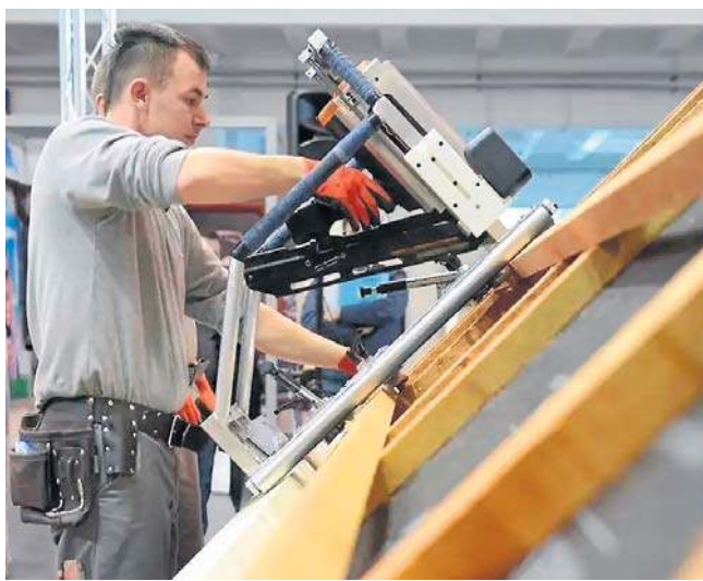
Dekarz za granicą może zarobić 18 000 złotych brutto.

Sektor boryka się między innymi z deficytem pracowników. Stosunkowo niskie bezrobocie i zmiany demograficzne wpływają na wzrost niedoborów na rynku pracy szczególnie właśnie w branży budowlanej. Według najnowszego badania „Barometr Zawodów” (to ogólnopolska analiza co roku przygotowywana na zlecenie Ministerstwa Rodziny, Pracy i Polityki Społecznej), za deficytowe można uznać 17 z 168 prezentowanych zawodów. W tej grupie nie brakuje profesji budowlanych lub powiązanych z budownictwem - są to np.: monterzy instalacji budowlanych, elektrycy i ener-