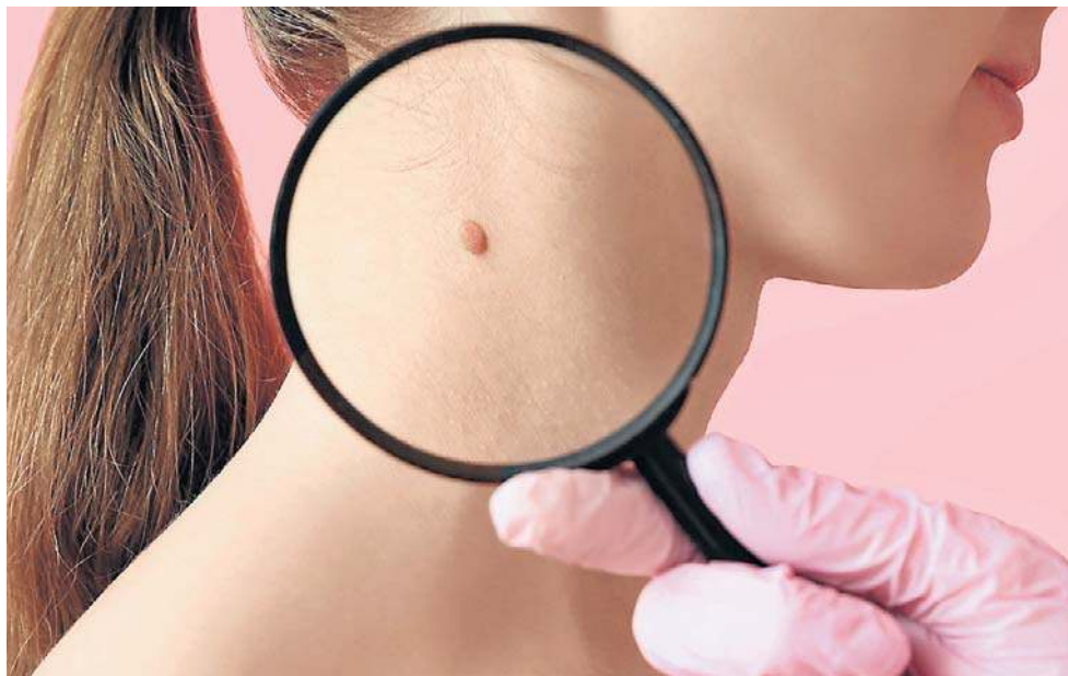
Niektóre objawy raka zbijają z tropu nawet lekarzy

● biopsję aspiracyjną szpiku kostnego lub trepanobiopsję ● badanie histopatologiczne, ● badania obrazowe (np. USG, PET-CT), ● metody chirurgiczne.