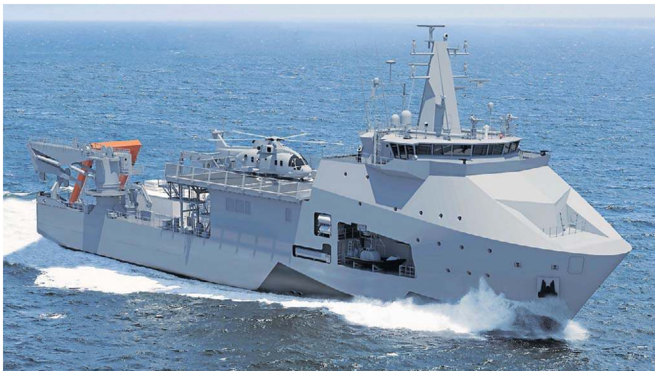
Wizualizacja okrętu Ratownik. Wielozadaniowa, specjalistyczna jednostka powstaje w Stoczni Wojennej

Budująca Ratownika PGZ Stocznia Wojenna niedawno podpisała kontrakt z dostawcą specjalistycznego wyposażenia okrętu. Chodzi o system nurkowania (tzw. saturacyjnego) i ratownictwa okrętów podwodnych. Ma to być jeden z najbardziej zaawansowanych technologicznie systemów tego typu na świecie. Dostarczyć ma go