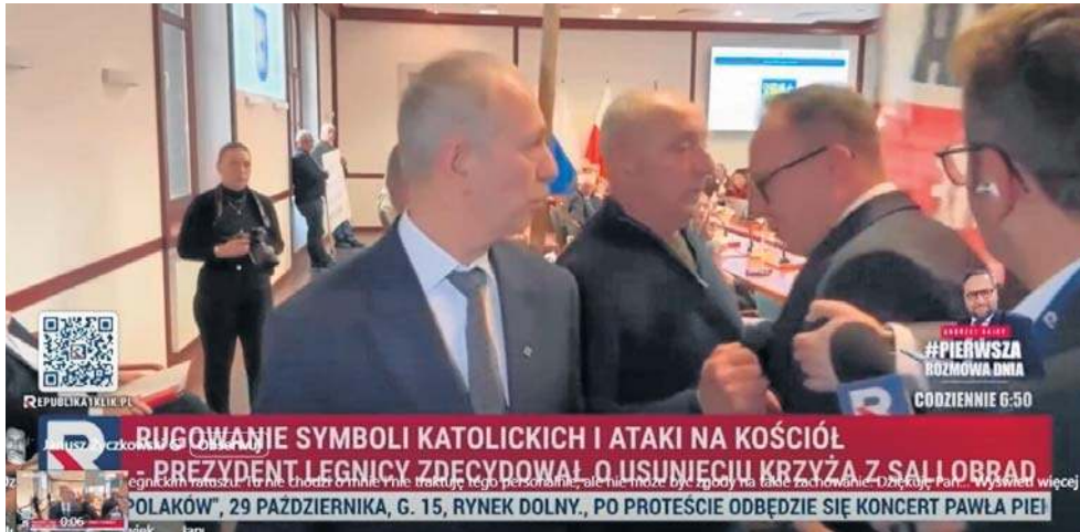
Prezydent twierdzi, że jego nietykalność została naruszona przez dziennikarza