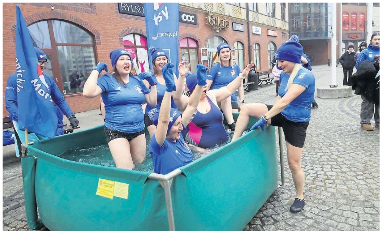
Przed Galerią Piastów morsowanie. A na scenie w Galerii popisy zespołów tanecznych