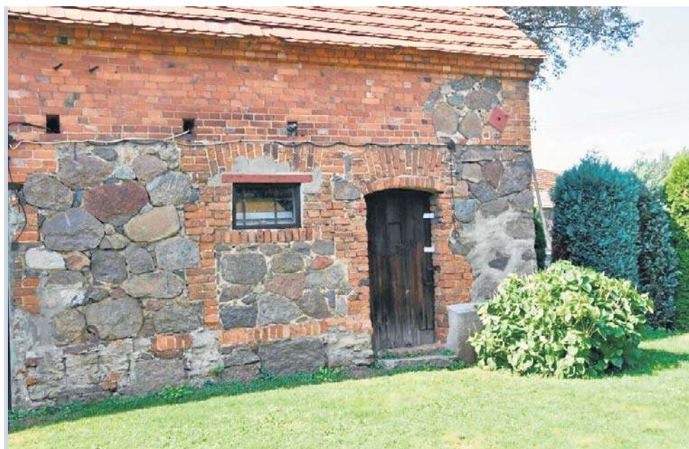
W tym budynku Mateusz J. przetrzymywał przez cztery lata kobietę poznaną w Internecie. Prokuratura oskarża go o to, że znęcał się nad nią ze szczególnym okrucieństwem. Ludzie ze wsi twierdzą, że nic o tym nie wiedzieli

Prokurator Liliana Łukasiewicz z Prokuratury Okręgowej w Legnicy ujawniła, że w procesie odbyły się mowy końcowe i prokuratura zażądała dla Mateusza J. kary dożywocia. Ale wniosków prokuratury dotyczących ukarania oprawcy z Gaików jest więcej.