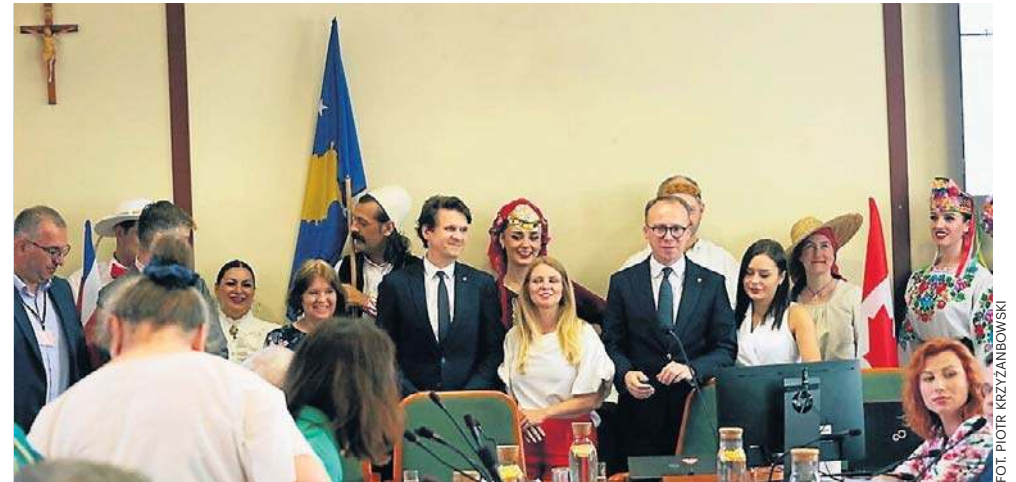
Powodem awantury była sprawa krzyża, który zniknął z sali obrad (zdjęcie archiwalne)