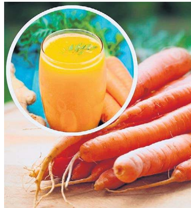
Wypróbuj łatwy przepis na syrop z marchewki według sprawdzonej receptury naszych babć. Naprawdę pomaga!

Nie tylko temperatura wewnątrz wpływa na nasze zdrowie. Ważne jest także utrzymywanie odpowiedniej temperatury w domu zimą, aby nie narażać organizmu na zbyt duże jej wahania, ale też nie wychładzać pomieszczeń za bardzo. Zbyt wysoka temperatura w domu naraża organizm na przegrzanie, co sprzyja przeziębieniu i odmrożeniom po wyjściu na mróz. Natomiast stałe przebywanie w zbyt niskiej temperaturze może prowadzić do zbyt szybkiego wychłodzenia i skutkować podobnymi konsekwencjami, co przebywanie na mrozie. ©