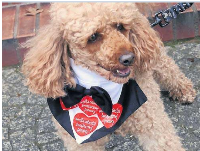
Ważne było, by znaleźć pomysł i zaciekawić Legniczan, bo Finał WOŚP to zbiórka, ale i fajna zabawa