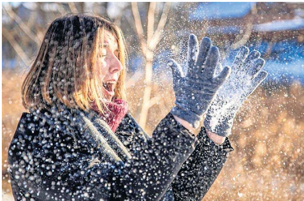
Przemarzniętych dłoni i stóp nie należy w żadnym przypadku wkładać do gorącej wody.

Objawy przemarznięcia świadczące o hipotermii to właśnie trzęsienie się, zmęczenie, dezorientacja, utrata koordynacji. Gdy natomiast ustają, a po-