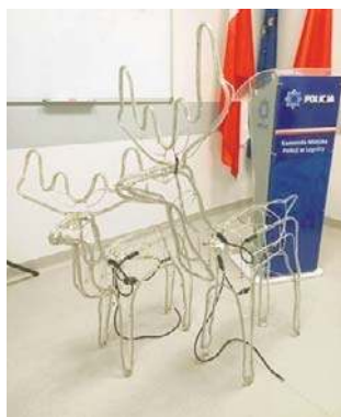
Jelonki powrócą na rondo do Prochowic

- Zdarzenie wzbudziło zainteresowanie mieszkańców,