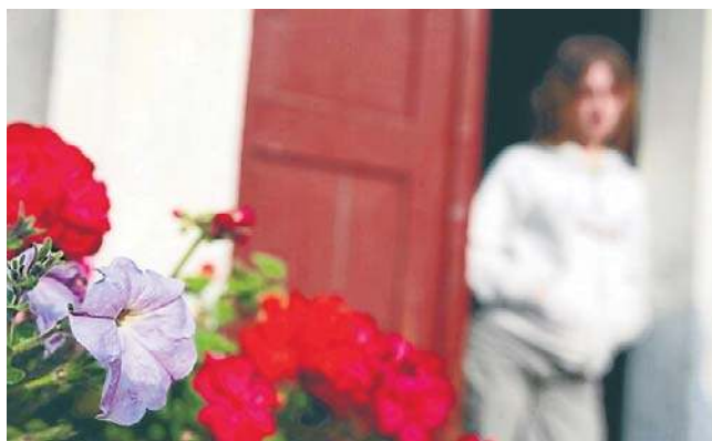
Dziewczynę sąd przesłuchano w obecności psychologa