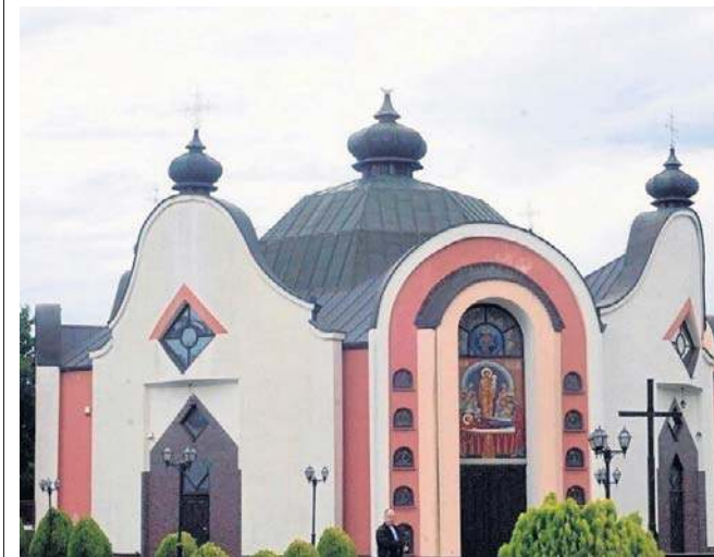
Beniamin W. spowodował w budynku cerkwi straty w wysokości ponad 276 tys. zł

Jak zapowiada prochowski ratusz, jelonki ponownie ozdobią miasto podczas następnych świąt Bożego Narodzenia.