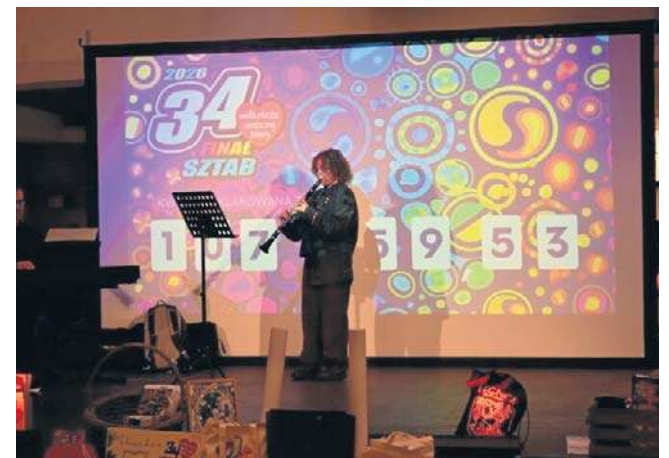
Zbieraliśmy na diagnostykę i leczenie chorób przewodu pokarmowego u dzieci. Wyniki: Legnica.naszemiasto.pl