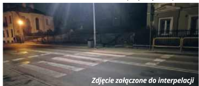
Zdjęcie załączone do interpelacji

Mimo obaw wielu osób dane pokazują, że Chełm podejmuje inicjatywy mające na celu ochronę i rozwój terenów zielonych. Czy te działania przekonają mieszkańców? Czas pokaże. AW