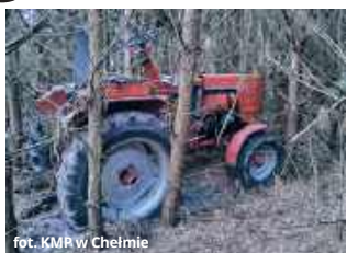
fol. KMR w Chełmie

● GM. SIEDLISZCZE 17- i 18-latkowi grozi za kradzież do 5 lat pozbawienia wolności. Najpierw zabrali pojazd z niezamieszkałej posesji w gminie Siedliszczce, po czym swój łup ukryli w lesie. Policjanci odzyskali już skradzione mienie.