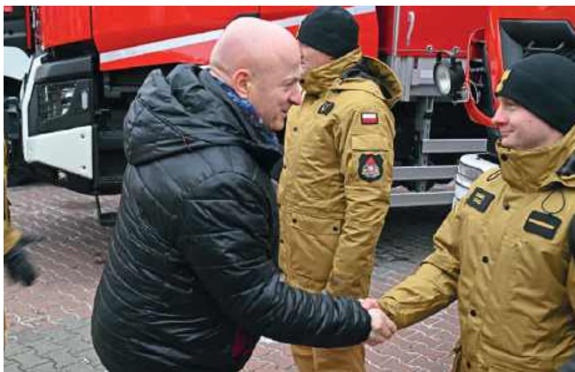
Przekazanie sprzętu w Radzynie Podlaskiej, 19 lutego 2025 roku

Hipotermia to stan zagrażający życiu, dlatego w okresie zimowym szczególnie ważne jest zwracanie uwagi na osoby narażone na wychłodzenie: samotne, bezdomne czy znajdujące się w trudnej sytuacji życiowej.