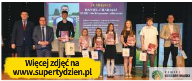
Więcej zdjęć na www.supertydzien.pl

- Gala to wiele pozytywnych emocji, energii i radości, a także zaskoczenie i dumy. Bo przecież sport to coś więcej niż rywalizacja. To szkoła charakteru, determinacji i nieustannego dążenia do doskonałości. To także momenty radości, wzruszeń i niezapomnianych emocji, które łączą ludzi niezależnie od wieku czy dyscypliny. Uhonorowaliśmy tych, którzy swoją postawą na boisku czy macie pokazali, że sport to nie tylko talent, ale przede wszystkim praca