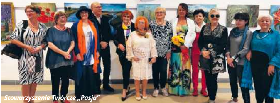
Stowarzyszenie Twórcze „Pasja”

Pierwsza wystawa prac grupy plastycznej odbyła się