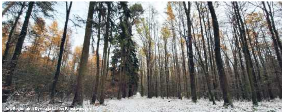
fol. Regionalna Dyrekcja Lasów Państwowych

rażnie precyzuje nadrzędny cel, jaki towarzyszy wszystkim zaplanowanym na danym terenie działaniom. Plan określa się w oparciu o wielomiesięczną, dosyć żmudną inwentaryzację lasu. Najogólniej rzecz ujmując, gospodarka leśna prowadzona jest w taki sposób, aby zapewnić trwałą i zrównoważony rozwój danego obszaru lasu - podkreśla Sternik.