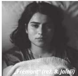
„Fremont” (reż. B. Jalali)

Piękna, wrażliwa i ambitna dwudziestoparoletnia Donya, afgańska imigrantka, mieszka sama w tytułowym Fremont, mieście w stanie Kalifornia. Jako tłumaczka pracowała kiedyś dla rządu USA w Afganistanie, obecnie próbuje asymilować się i znaleźć swoje miejsce w obcym kraju. Donya pracuje przy wypieku ciasteczek z wórbzą u chińskich właścicieli. Samot-