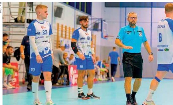
Jurand Ciechanów zagra w sobotę u siebie z Nielbą Wągrowiec

Pozostałe wyniki 22. kolejki: Śląsk Wrocław - AZS AWF Białą Podlaska 25:23 (14:14), Nielba Wągrowiec - Grunwald Poznań 33:34 (16:13), SMS Kielce - Stal Gorzów 32:31 (15:17), AZS UW Warszawa - Miedź Legnica 35:44 (17:22), Pogoń Szczecin - Gwardia Koszalin 39:33 (18:15), Padwa Zamość - Anilana Łódź 29:35 (12:16).