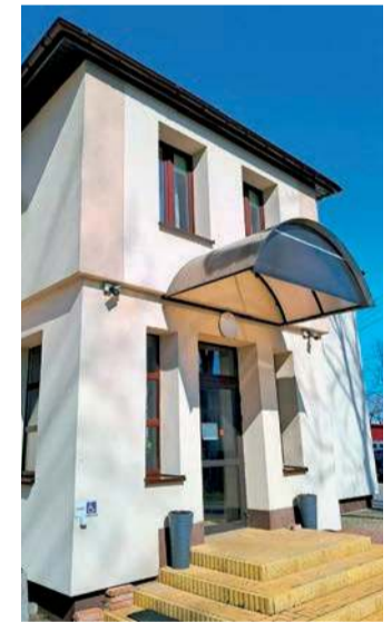
Biblioteka w Naruszewie zostanie wyremontowana

Zakres planowanych prac obejmuje pomieszczenia zagospodarowane przez Gminną Bibliotekę