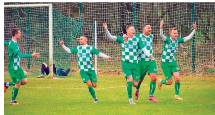
Piłkarze z Opinogóry wracają do gry o awans

Nie powiodło się natomiast walczącej o utrzymanie Wkrze Radzanów. W wyjazdowym spotkaniu