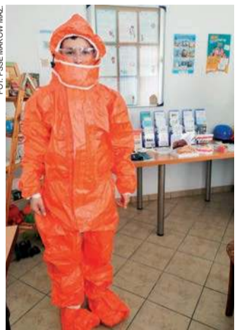
Uczestnicy wydarzenia mogli z bliska zapoznać się z narzędziami pracy PSSE

Powiatowa Stacja Sanitarno-Epidemiologiczna przygotowała m.in. stoisko z materiałami edukacyjnymi, czy stanowiska konsultacyjne sekcji higieny żywności i żywienia, higieny komunalnej, higieny pracy, higieny dzieci i młodzieży, epidemiologii i zapobiegawczego nadzoru sanitarnego.