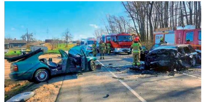
Skutki jednego z nieszczęśliwych zdarzeń w powiecie mławskim. Na szczęście w ostatnich kilkunastu latach na tym terenie systematycznie spadała liczba wypadków drogowych

Ciągle daje o sobie znać przemoc domowa. W ostatnim roku „Niebieską kartą” objęto 206 zdarzeń. W konsekwencji ustalono 130 sprawców (podejrzanych) przemocy,