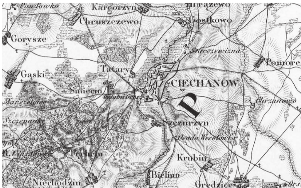
Okolice Ciechanowa ok. 1840 r. (fot. Topograficzna Karta Królestwa Polskiego/domena publiczna)

Anna Borkiewicz-Celińska w książce „Osadnictwo ziemi ciechanowskiej w XV wieku” informuje, że