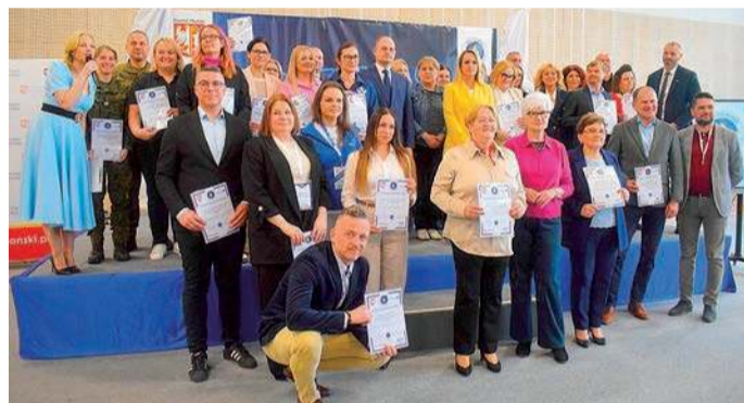
Była to pierwsza edycja wydarzenia