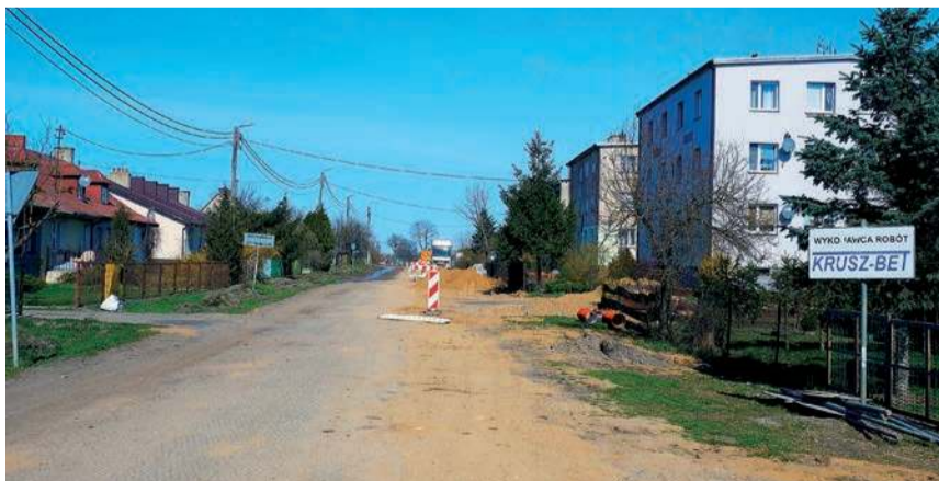
Poprawa spójności komunikacyjnej z siecią ten-t poprzez rozbudowę drogi powiatowej nr 2349w-2