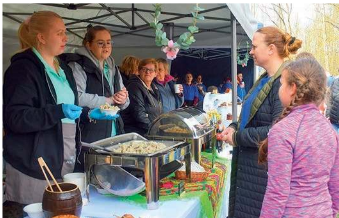
Można było też posilić się na stoisku KGiGW z Nacpolska