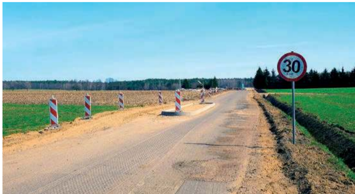
Poprawa spójności komunikacyjnej z siecią TEN-T poprzez rozbudowę drogi powiatowej nr 2349W Żurominek - Stupsk na odcinkach od km 3+860,00 do km 6+250,00 i od km 6+250,00 do km 7+350,00_ (6)-1900