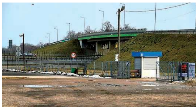
Schron miałby powstać przy ulicy Pułtuskiej