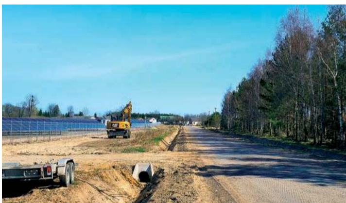
Poprawa spójności komunikacyjnej z siecią ten-t poprzez rozbudowę drogi powiatowej nr 2349w-5