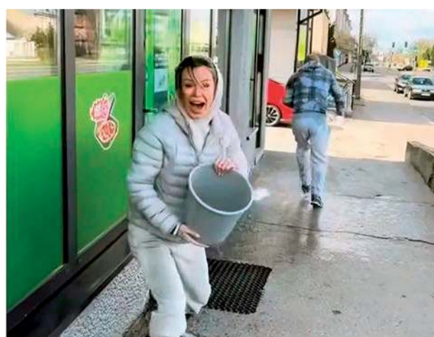
Doda w akcji...

Na realizację inwestycji miasto pozyskało ponad 31 mln zł z funduszy Unii Europejskiej w ramach Krajowego Planu Odbudowy. erem