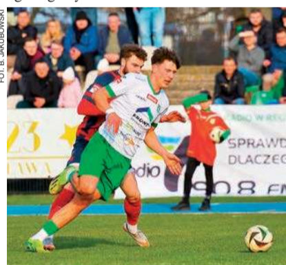
Piłkarze Mławianki stracili punkty w Wiekielecu

Wydawało się, że ta walcząca o utrzymanie w III lidze Mławianki będzie to impuls do zdobywania kolejnych punktów i wydstania się poza strefę spadkową. Zwłaszcza, że w minioną sobotę Mławianie rywalizowali z bezpośrednim przeciwnikiem, który także nie jest pewny ligowego bytu.