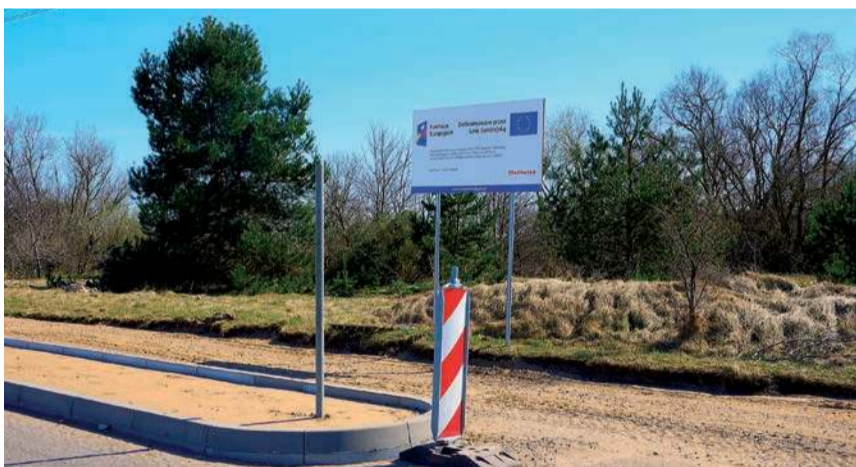
Poprawa spójności komunikacyjnej z siecią ten-t poprzez rozbudowę drogi powiatowej nr 2349w-4