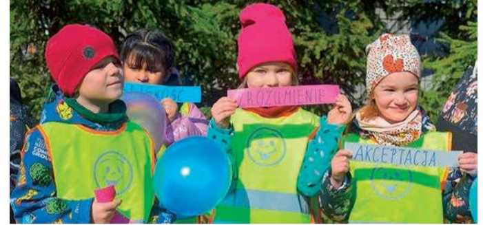
Wydarzenie ma na celu zwiększenie świadomości społecznej na temat autyzmu