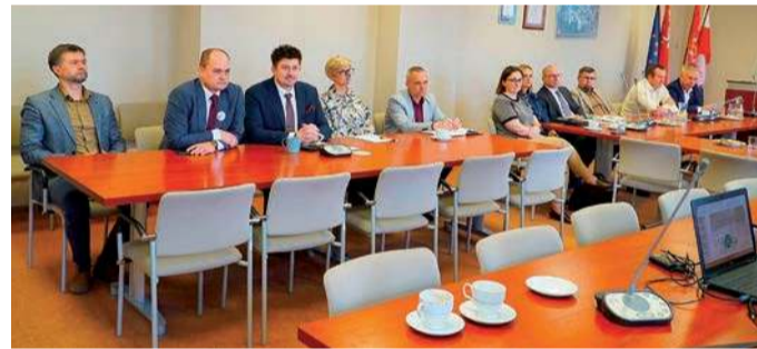
Powiat płoński chce przystąpić do Żyrardowskich Przewozów Autobusowych

Na początku kwietnia w płońskim starostwie odbyło się kolejne spotkanie poświęcone możliwości przystąpienia powiatu do Żyrardowskich Przewozów Autobusowych (ŻPA). A jest to związek powiatów, miast i gmin współpracujących w zakresie organizacji publicznego transportu zbiorowego.