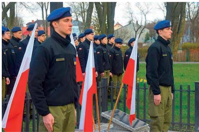
Coroczne płońskie obchody odbywają się w Płońskim Łasku Katyńskim

- Historycy zgodnie potwierdzają, że zbrodnia w Katyniu była zbrodnią podwójną. Najpierw zabito ludzi, potem próbowano zabić pamięć o nich. Dlatego dzisiaj – swoją obecnością w „płońskim łasku katyńskim”