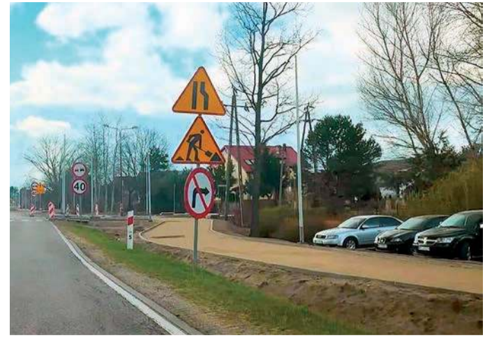
Powstaje blisko 2 km bezpiecznego ciągu pieszo-rowerowego

Oficjalna nazwa zadania to: „Rozbudowa drogi wojewódzkiej