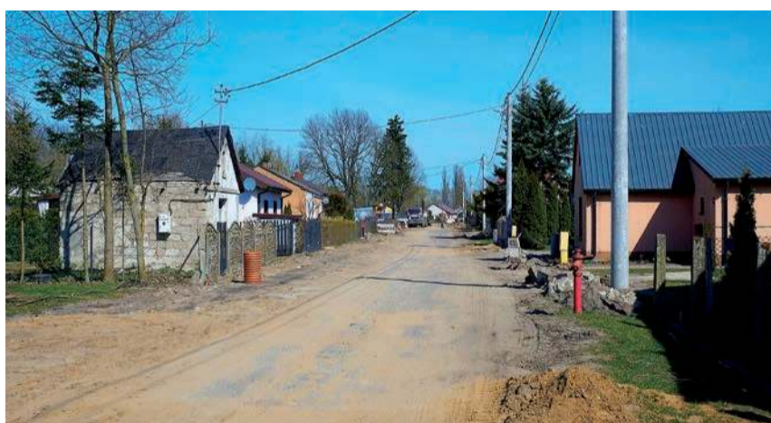
Poprawa spójności komunikacyjnej z siecią ten-t poprzez rozbudowę drogi powiatowej nr 2349w-3