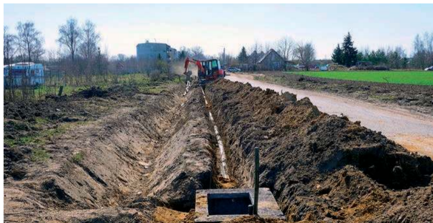
Poprawa spójności komunikacyjnej z siecią ten-t poprzez rozbudowę drogi powiatowej nr 2349w-1

Postępują prace związane z realizacją zadania pn. „ Poprawa spójności komunikacyjnej z siecią TEN-T poprzez rozbudowę drogi powiatowej nr 2349W Żurominek – Stupsk na odcinkach od km 3+860,00 do km 6+250,00 i od km 6+250,00 do km 7+350,00 ”. Na powyższe zadanie Powiat Mławski otrzymał dofinansowanie z Europejskiego Funduszu Rozwoju Regionalnego w ramach Priorytetu: IV: „Fundusze Europejskie dla lepiej połączonego i dostępnego Mazowsza” Działania: 4.1: „Transport regionalny i lokalny” programu Fundusze Europejskie dla Mazowsza 2021-2027.