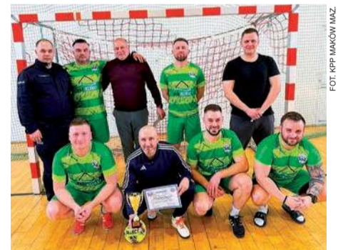
Drużyna KPP Maków Maz.

- Wspaniała atmosfera i sportowy duch walki towarzyszył (...) Turniejowi (...) Po emocjonującej