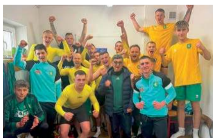
Lider rozgrywek A klasy - zespół Mazowsza Jednorzec

18. kolejka (18-19 kwietnia): Wkra C. - Korona, Przasnysz II - Mazowsze, Żbik II - Pelta, Mazur - Krasnosielc, Iskra - Orzeł, Pokrzywnica - Bartnik, Wymakracz - Łyse