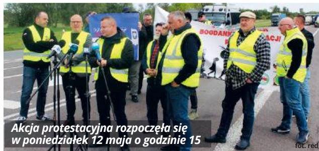
Akcja protestacyjna rozpoczęła się w poniedziałek 12 maja o godzinie 15

Argumentują, że przed wybuchem wojny za obsługę bieżących zleceń odpowiadało ok. 50% kierowców ukraińskich