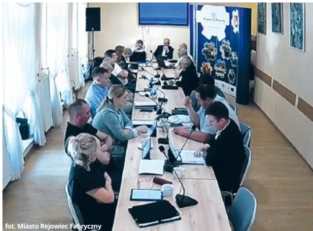
fol. Miasto Rejowiec Fabryczny

W czasie ostatniej sesji rady miasta przedłożono radnym projekt uchwały dotyczącej wysokości przysługujących im diet. To zagadnienie dyskutowane jest najczęściej na początku danej kadencji samorządu, zaraz po zaprzysiężeniu. Aktualna dyskusja dotyczyła tego, czy obowiązujące od ubiegłego roku stawki nie powinny ulec obniżeniu.