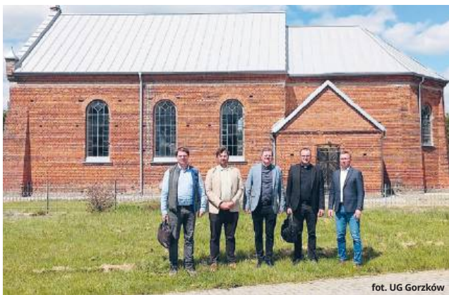
fol. UG Gorzków

Zadanie zostało zrealizowane dzięki dofinansowaniu z Rządowego Programu Odbudowy Zabytków, na podstawie wniosku złożonego przez gminę Gorzków. Całkowita wartość inwestycji wyniosła 172 300,00 zł, z czego 149 940,00 zł pochodziło z promesy. Gmina przeznaczyła na ten cel 15 360,00 zł, a parafia wniosła wkład własny w wysokości 7 000,00 zł.