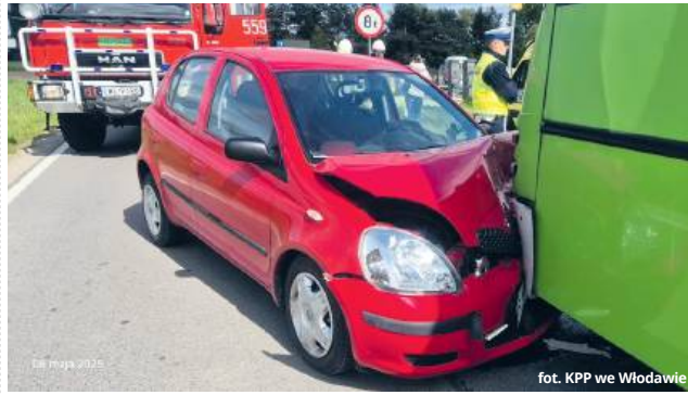
fol. KPP we Włodawie

● GM. WOLA UHRUSKA W czwartek (8 maja) po południu w Uhrusku doszło do poważnego zdarzenia drogowego. Kierujący toyotą yaris 64-latek z niewiadomych przyczyn zjechał nagle na przeciwny pas ruchu i czołowo zderzył się z autobusem. Mężczyzna z obrażeniami ciała trafił do szpitala.