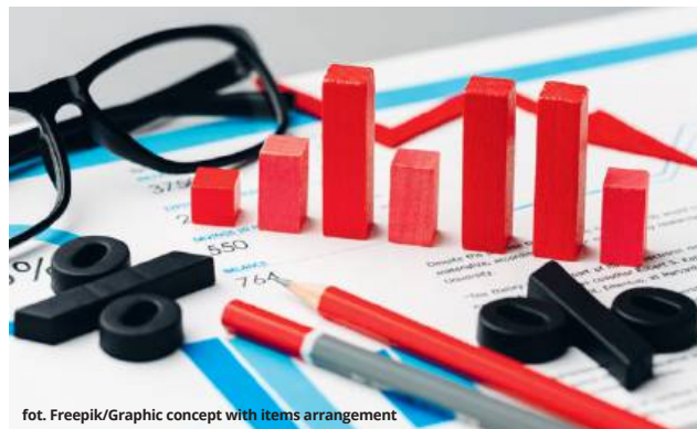
fol. Freepik/Graphic concept with items arrangement

Rada Polityki Pieniężnej 7 maja obniżyła poziom stóp procentowych o 0,5 pkt proc. W teorii taka obniżka zmniejszy ratę kredytu z oprocentowaniem zmiennym, na kwotę 500 000 zł, o ok. 172 zł. W praktyce w części przypadków rata spadnie jeszcze bardziej. Dotyczy to kredytów z oprocentowaniem opartym na stawce WIBOR 6M, która spadła już o 0,81 p.p. W rezultacie rata wspomnianego kredytu będzie mniejsza o 278 zł. Taka obniżka stóp procentowych nieco poprawi też dostępność kredytów hipotecznych. Zdolność kredytowa wzrośnie o ok. 5 proc. Jeśli ktoś na początku kwietnia mógł uzyskać kredyt na 500 000 zł, to po obniżce będzie to ok. 525 000 zł.