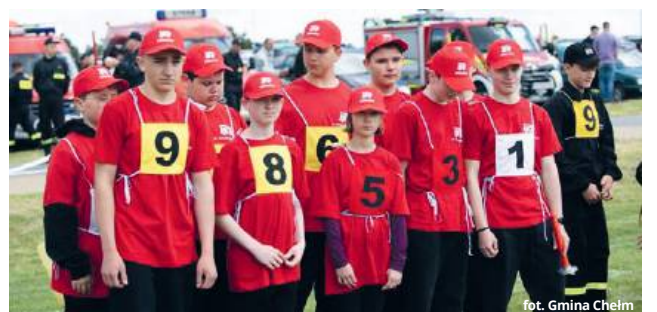
fol. Gmina Chełm

W kategorii drużyn młodzieżowych dziewczęta reprezentowała wyjątkowo ekipa z Weremowic. Wśród drużyn mieszanych najlepszy wynik osiągnęła natomiast drużyna z Krzywic. Tuż za nią, na drugim miejscu, uplasowała się drużyna z Zarzecza. Trzecie miejsce zdobyła drużyna ze Strupina Dużego. Czwarty z kolei wynik wypracowała drużyna młodzieżowa z Rożdżałowa. Na piątej pozycji ogólnej klasyfikacji znalazła się drużyna ze Stawu, a na szóstej