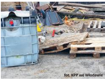
fol. KPP we Włodawie

I apeluje o rozsądek podczas prac polowych oraz obsługi maszyn rolniczych. Nieostrożność może spowodować poważny wypadek, podczas którego narażamy się na utratę zdrowia, a nawet życia.