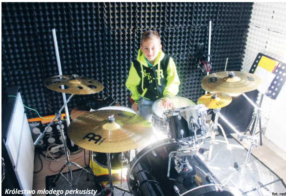
Królestwo młodego perkusisty

W podróży przez tę nieodkrytą jeszcze, ale upragnioną, przestrzeń towarzyszy Natano-