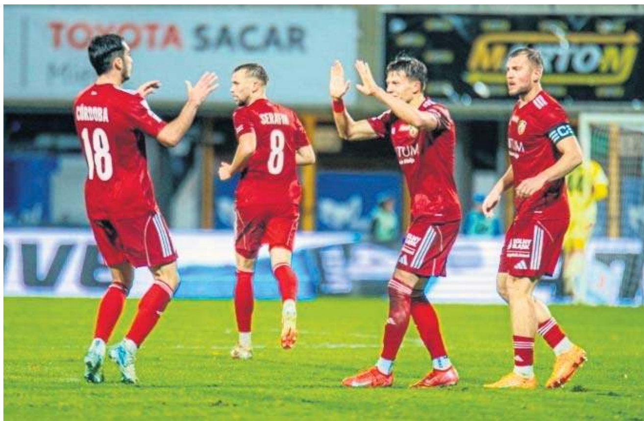
Remis z tak mocnym rywalem jak Polonia, i to na wyjeździe, powinien bardziej cieszyć legniczan

PIŁKA NOŻNA TRENERZY NIE BYLI ZADOWOLENI Z PODZIAŁU PUNKTÓW