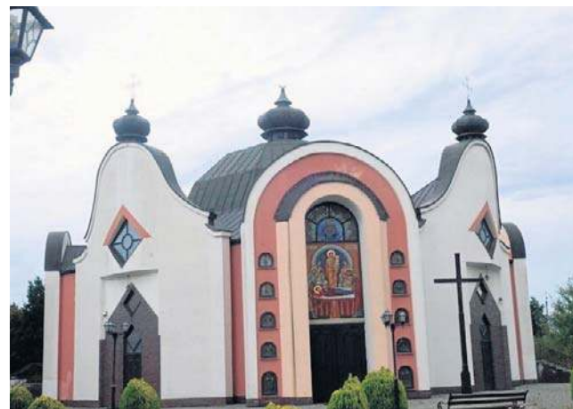
Cerkiew wciąż nie ma głównego krzyża. - To uderzenie w uczucia wiernych - mówiła pełnomocnik parafii

będę wykonywał w parafii różne prace, aby odpokutować swoją winę - mówił Benjamin W.