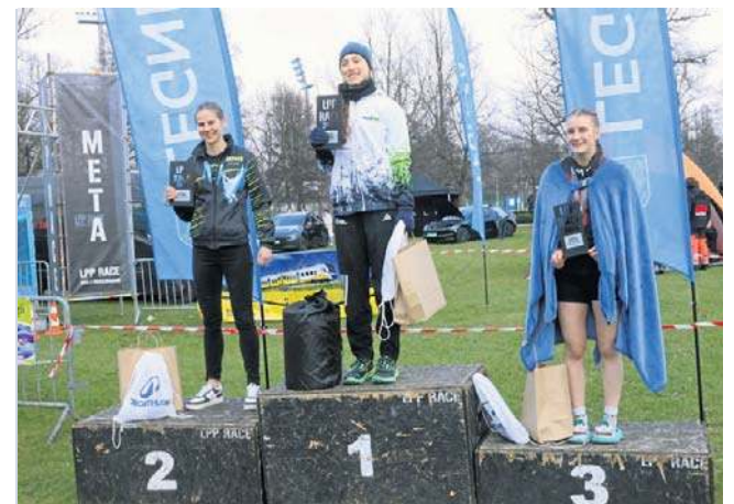
Zwycięzca wśród mężczyzn potrzebował na pokonanie 12 km 1 h i 14 min. Wśród kobiet 1 h i 23 min