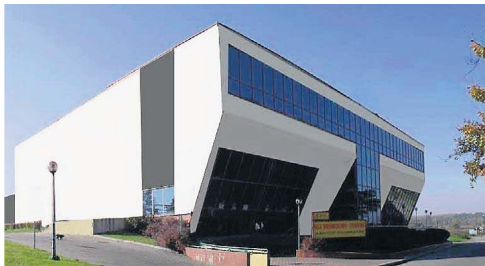
Tak hala będzie wyglądała z zewnątrz po remoncie. Zakończenie prac w końcu 2026 r.

Cały remont hali to koszt 9 mln zł. Niespełna 6 mln zł miasto otrzymało, jako dofinansowanie tego projektu, z Funduszy Europejskich.