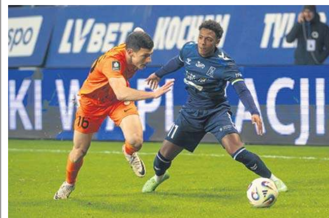
Nie tak wyobrażali sobie mecz w Lublinie piłkarze Zagłębia. Rywale wygrali zasłużenie