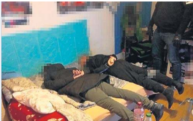
Zatrzymani mężczyźni mają 24, 37 i 41 lat. Najmłodszy z nich wywodzi się ze środowiska pseudokibiców