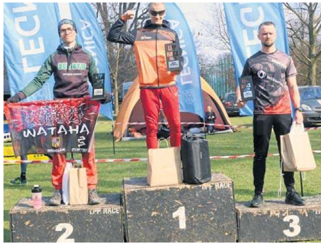
Zawody odbyły się w sobotę, 21 marca, w Lasku Złotoryjskim