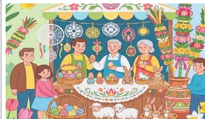
Fragment plakatu zapowiadającego kiermasz, na którym kupimy prace uczestników warsztatów

Dom Kultury Atrium na legnickich Piekarach szykuje wystawę pokonkursoiwa z najpiękniejszymi pisankami. Wernisaż i wręczenie nagród 1 kwietnia o g. 16.