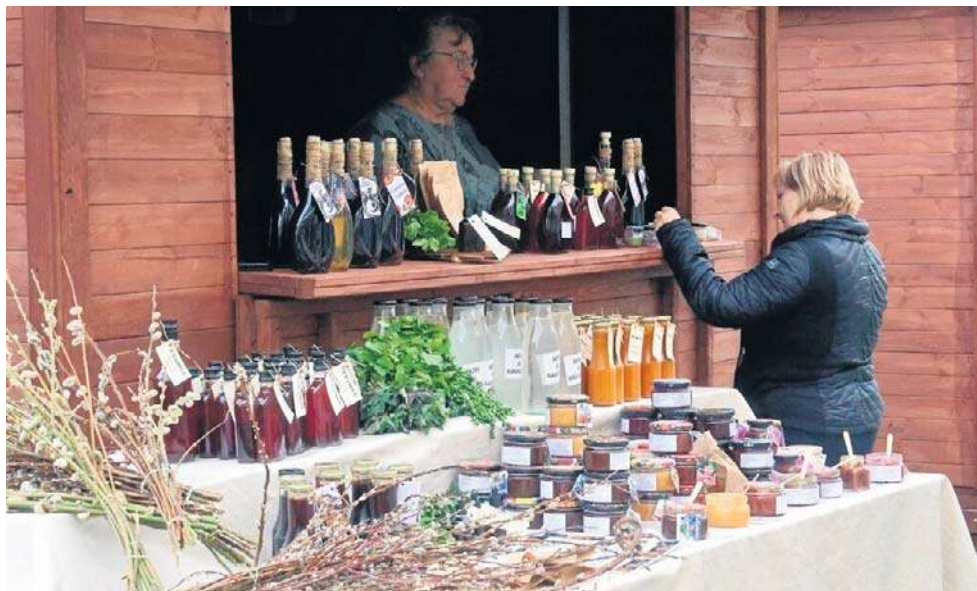
W legnickim Rynku pojawi się wiele stoisk z regionalnym jedzeniem i napitkami

Jak informuje legnicki ratusz, szczególną ofertę przygotowano dla najmłodszych. W sobotę i niedzielę (28 i 29 marca), w godz. 12.00-17.00, odbywać się będą warsztaty i animacje, wśród których znajdują się m.in.: zdobienie figurek, malowanie twarzy, animacje sceniczne, tworzenie gry planszowej, interaktywny teatrzyk wielkanocny, strefa zabaw z wielkanocnym królikiem, festiwal baniek mydlnych, gigapuzzle 3D, strefa