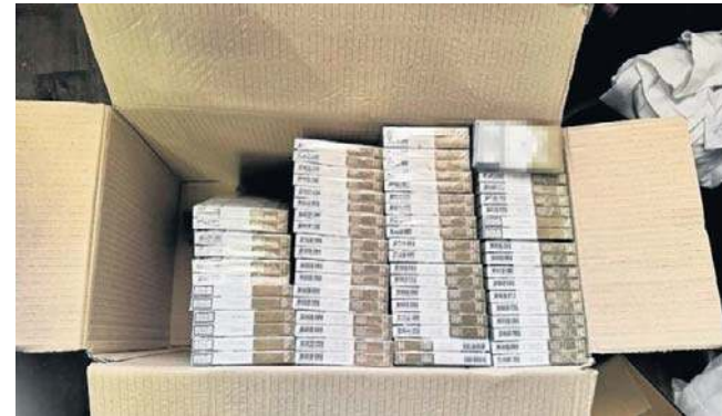
Na paczkach nie było polskich znaków akcyzy, na tym towarze robił biznes Legniczanie

Realizując wcześniej wypracowane ustalenia, policjanci weszli do wytypowanego lokalu, gdzie podczas szczegółowego przeszukania