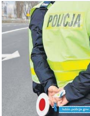
Od lutego obowiązują nowe przepisy

To jednak nie koniec jego problemów, bowiem kierujący nie powinien wsiadać za kierownicę auta, gdyż posiadał aktywny zakaz prowadzenia pojazdów mechanicznych, a jego