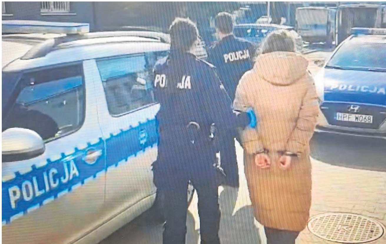
Matka, która wraz ze znajomym porwała 8-letniego syna z wioski pod Łodzią, została zatrzymana przez policję, ale szybko ją zwolniono. Babcia chłopca obawia się, że córka może ponownie spróbować porwania