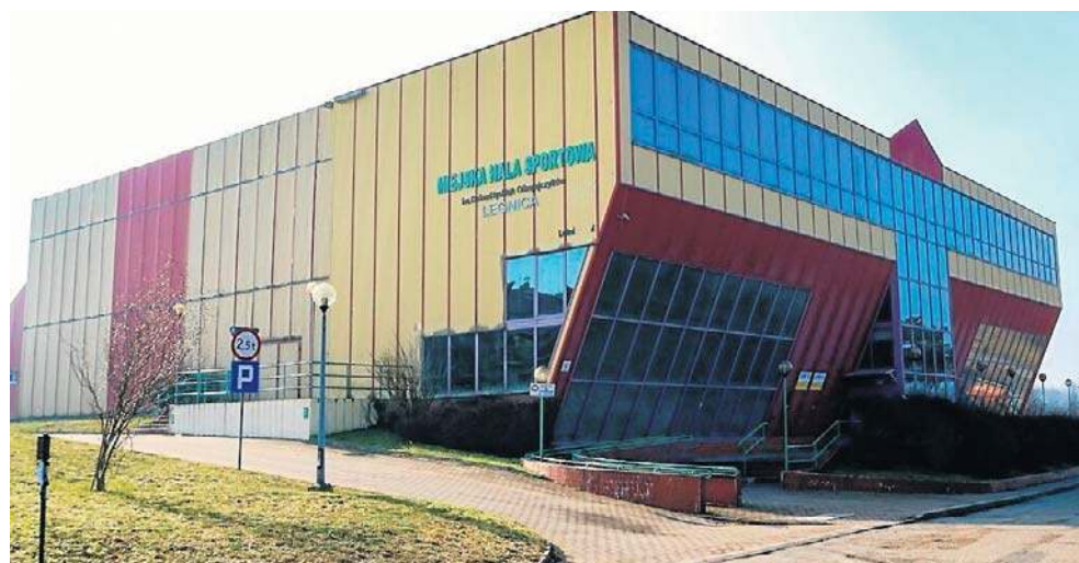
Obecny wygląd hali