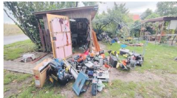
Mężczyzna kradł rowery, kosiarki, piły, przedłużacze, generatory elektryczne i inne urządzenia.