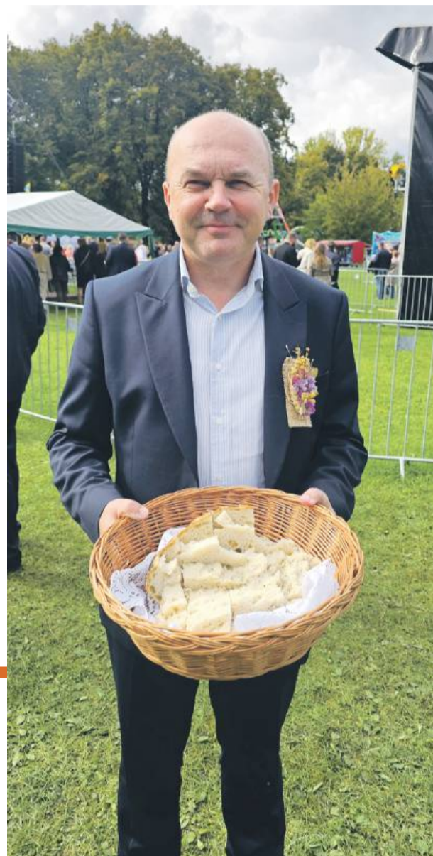
Symboliczne rozdanie chleba mieszkańcom