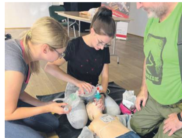
W szkoleniu wykorzystywane były fantomy i sprzęt ratowniczy.

W miniony weekend sala widowiskowa Gminnej Biblioteki Publicznej w Wiązowie zamieniła się w centrum nauki ratowania życia. To właśnie tam odbyło się szkolenie z kwalifikowanej pierwszej pomocy dla blisko 60 druhów Ochotniczych Straży Pożarnych z powiatu strzelińskiego.