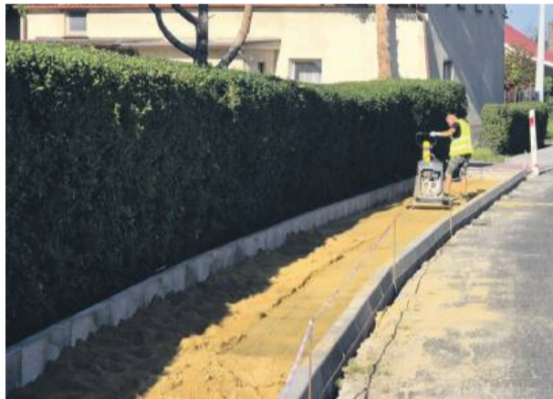
Trwa budowa chodnika w Gołostowicach