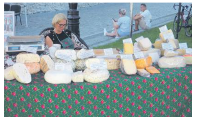
Do udziału zaproszono lokalnych producentów z powiatu strzeńskiego, szkoły i koła gospodyń wiejskich