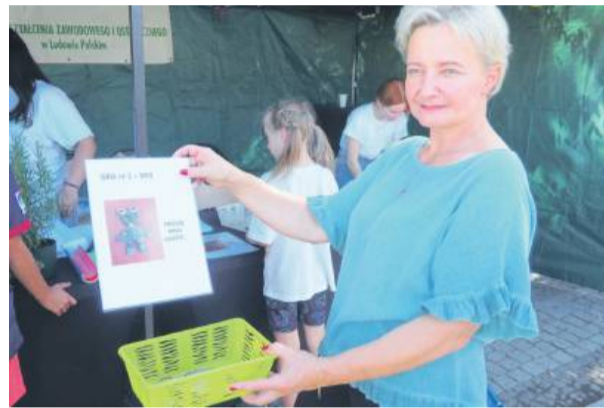
Gry i zabawy przygotowała kadra CKZiU z Ludowa Polskiego