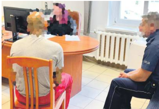
Mężczyzna usłyszał zarzuty znęcania się psychicznego i fizycznego nad żoną i synem

Mieszkaniec został zatrzymany i trafił do policyjnej celi. Sąd Rejonowy w Strzelinie zastosował wobec niego tymczasowy, dwumiesięczny areszt.