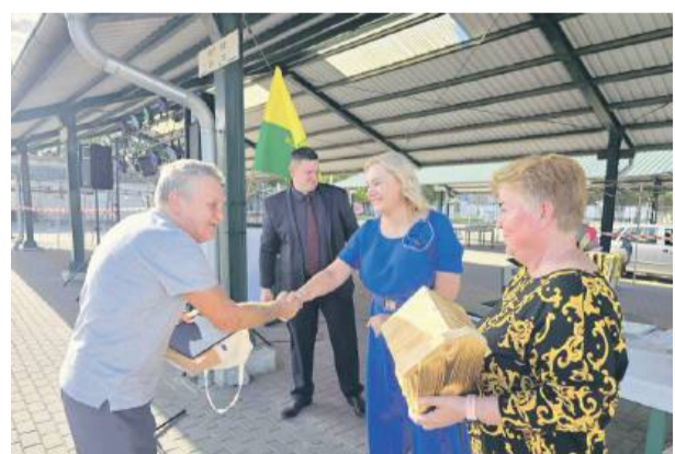
Podczas wydarzenia działkowcom wręczono nagrody.

W sobotę, 20 września, na miejskim targowisku w Strzelinie odbyła się uroczystość z okazji 80-lecia