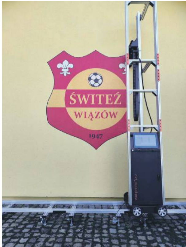
Do namalowania logo wykorzystano nowoczesny sprzęt komputerowy do ściennych nadruków.