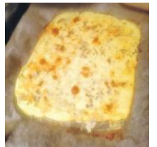
Wrapa ściągamy z papieru po ostygnięciu