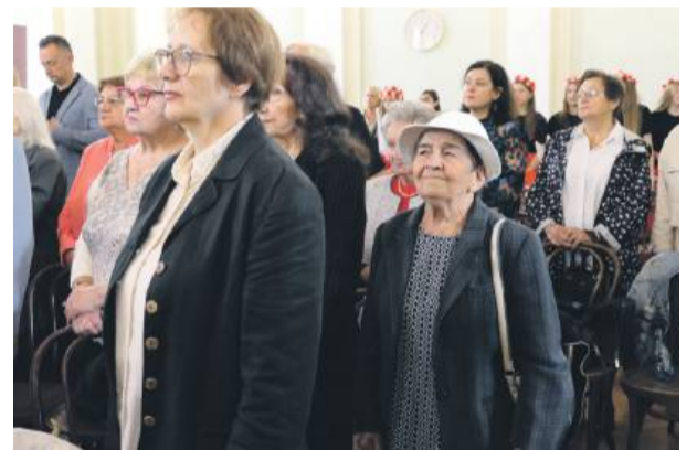
W uroczystości udział wzięli m.in. absolwenci „jedynki”