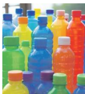
Kaucją objęte będą m.in. plastikowe butelki

Od 1 października w sklepach w całej Polsce zacznie obowiązywać system kaucyjny. Na półkach pojawią się napoje w butelkach i puszkach oznaczone specjalnym znakiem. Kaucją objęte będą: