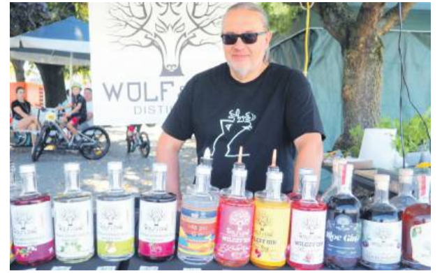
Nie zabrakło stoiska z mocnymi trunkami. Firma ze Stanicy produkuje whisky w odremontowanym dziewiętnastowiecznym budynku gorzelnii.

Nie zabrakło stoiska z mocnymi trunkami. Firma ze Stanicy produkuje whisky w odremontowanym dziewiętnastowiecznym budynku gorzelnii. W świecie produkcji alkoholi jakości-