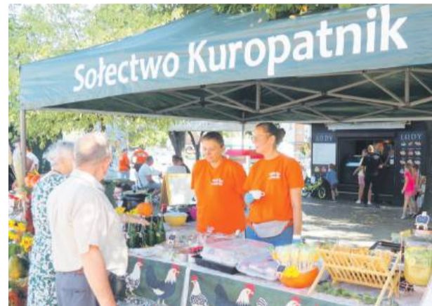
Na stoisku koła gospodyń nie zabrakło produktów z dyni

Do udziału zaproszono lokalnych producentów z powiatu strzeńskiego, szkoły i koła gospodyń wiejskich. Każdy mógł spróbować oryginalnych produktów, np. pasty lub ciasta dyniowego. Na stoiskach serwowano też dania z regionu.