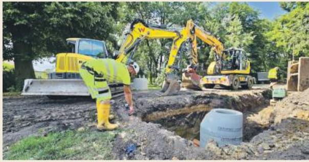
Prace związane z budową kanalizacji sanitarnej w Pławnej rozpoczęły się na początku lipca. Zdjęcie archiwalne.