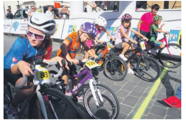
Każda forma ruchu dla maluchów i młodzieży jest ważna