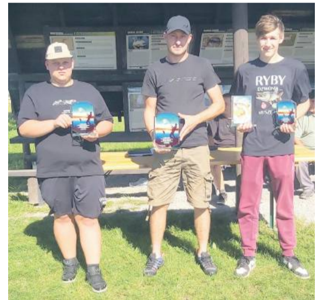
Najlepsza trójka sobotnio-niedzielnich zawodów.