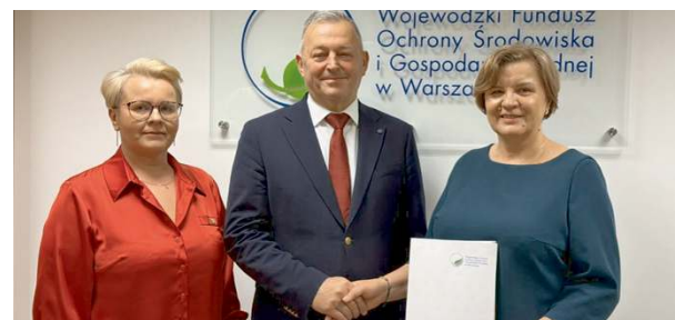
Gmina dostała pieniądze na usunięcie azbestu.

W siedzibie Wojewódzkiego Funduszu Ochrony Środowiska i Gospodarki Wodnej w Warszawie odbyło się uroczyste podpisanie umowy dotyczącej realizacji zadania pn. „Usuwanie i unieszkodliwianie wyrobów zawierających