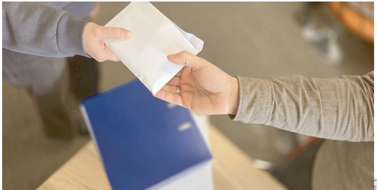
Przepisy mówią, że darowizna nie może być zapłatą za jakąkolwiek usługę ze strony urzędu.