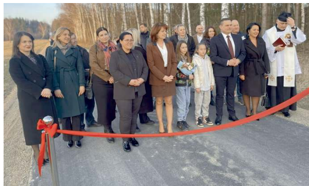
Na przebudowę ul. Leśnej w Broszkowie czekali od dawna.

W ramach prac wykonano m.in.: przebudowę dachu, izolację stropu, rozbudowę budynku, instalacje hydrauliczne