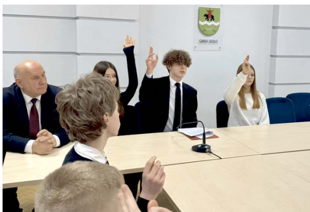
Młodzi radni nie zamierzają ograniczać się tylko do deklaracji.

Nie tylko szkolna przygoda, ale prawdziwa lekcja demokracji. Młodzieżowa Rada Gminy Siedlce udowadnia, że nastolatki chcą i potrafią współdecydować o sprawach lokalnej wspólnoty.