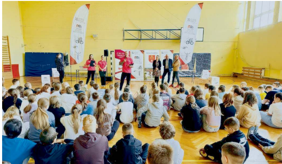
W Zespole Szkolno-Przedszkolnym w Skórcu odbyła się lekcja ekologii.