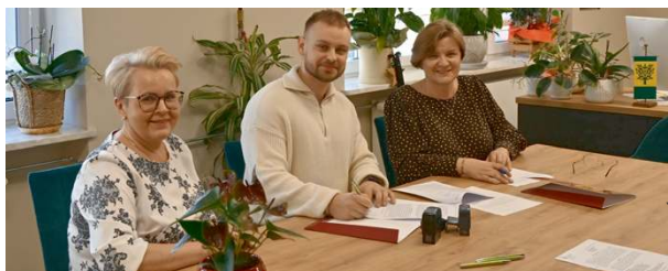
Klub Sportowy Amazonka Wiśniew dostał 35 tys. zł.