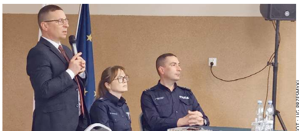
W zeszłym roku nie odnotowano ani jednego włamania.