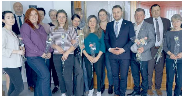
Panie otrzymały goździki, panowie - słodkie podarunki.

Najważniejszym punktem programu był recital Joanny Moro „Ja z podróży!”. Artystka, znana szerokiej publiczności m.in. z tytułowej roli w serialu „Anna German”, zaprezentowała program łączący muzykę, literaturę i osobiste refleksje. Już od pierwszych chwil nawiązała znakomity kontakt z publiczno-