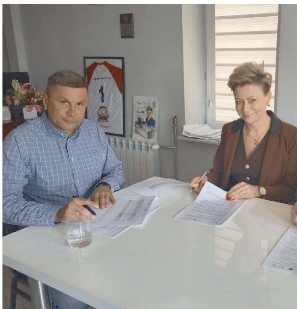
To kolejny przykład skutecznego pozyskiwania środków.

W ramach przedsięwzięcia m.in. zostanie zmodernizowana Stacja Uzdatniania Wody w Kisielanach-Żmichach oraz Stacja Uzdatniania Wody w Mokobodach, wybudowanych zostanie osiem odcinków sieci wodociągowej na terenie gminy o łącznej długości 2,2 km.. Projekt obejmuje również przebudowę 184 hydrantów oraz wykonanie punktów pomiaro-