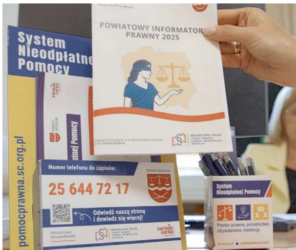
By nikt nie pozostawał sam ze swoim problemem...

Od 16 maja 2020 r. zakres bezpłatnych porad został rozszerzony również na sprawy związane z prowadzeniem działalności gospodarczej przez osoby fizyczne prowadzące jednoosobową działalność gospodarczą, które w ostatnim roku nie zatrudniały pracowników. W ta-