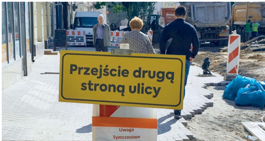
Mieszkańcom remonty dróg nie kojarzą się najlepiej.

Jak się okazuje, miasto ma dalsze plany. – W najbliższych tygodniach złożymy wniosek o dofinansowanie z rezerwy budżetu państwa remontu kilometrowego odcinka ul. Brzeskiej, mniej więcej od siedziby Spółdzielczego Producenta Sprężyn do skrzyżowania z ul. Starzyńskiego. Przewidujemy wymianę nawierzchni asfaltowej i częściowo wymianę podbudowy tam, gdzie będzie potrzebna. Obecnie trwają prace projektowe. Chcielibyśmy także ogłosić przetarg na drugi etap dróg wojskowych, czyli ul. Gar-