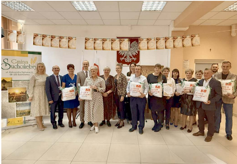
Dzień Sołtysa to okazja do podkreślenia roli, jaką sołtysi odgrywają w życiu lokalnej społeczności.

W środę, 11 marca, odbył się II Gminny Dzień Sołtysa – wydarzenie będące wyrazem uznania i wdzięczności dla osób pełniących tę funkcję na terenie gminy. Spotkanie, zorganizowane przez Gminę Suchożebry we współpracy z Gminnym Ośrodkiem Kultury w Suchożebkach, zgromadziło liczne grono uczestników i przebiegało