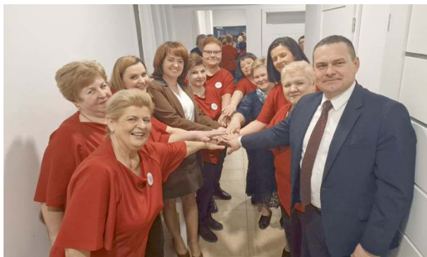
Ze świetlicy cieszą się panie z Koła Gospodyń Wiejskich w Żdźdarze.

Inwestycja obejmowała wykonanie nawierzchni bitumicznej wraz z infrastrukturą towarzyszącą na odcinku 837 m. Otwarcie drogi było jedno-