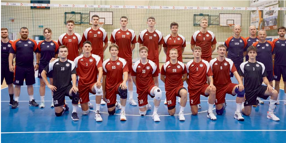
W tabeli KPS Siedlce zajmuje 8. miejsce. Już 21 marca siedlczanie zmierzą się z BBTS Bielsko-Biała.

W niedzielnym (15 marca) spotkaniu rozegranym w Nowej Soli KPS Siedlce stanął przed szansą na ważne punkty w kontekście walki o fazę play-off. Przed meczem zespół z naszego regionu zajmował 8. miejsce w tabeli z dorobkiem 38 punktów i wciąż miał matematyczne szanse na awans do czołowej ósemki. Astra Nowa Sól plasowała się na 12. pozycji, mając 32 punkty i tracąc do miejsc gwarantujących grę w play-off zaledwie kilka „oczek”.