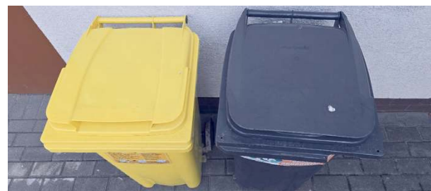
Zmiany wejdą w życie za kilka miesięcy.

– Dochodzą nam nowe rodzaje odpadów, głównie tekstylna, które będą odbierane dwa razy w roku – wyjaśnił. Do tej