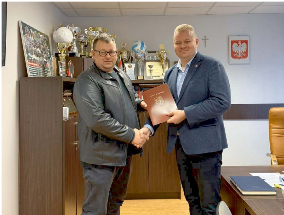
W Gminie Wodynie podjęto kolejne konkretne działania inwestycyjne oraz administracyjne.

Zakres zadania obejmuje kompleksowy remont budynku. Wyremontowane zostaną sala ogólna oraz sala spotkań młodzieży, które stanowią przestrzeń do zebrań mieszkańców, spotkań integracyjnych oraz organizacji wydarzeń lokalnych. W części kuchennej przewidziano nowy podział pomieszczeń, co pozwoli na lepsze zagospodaro-